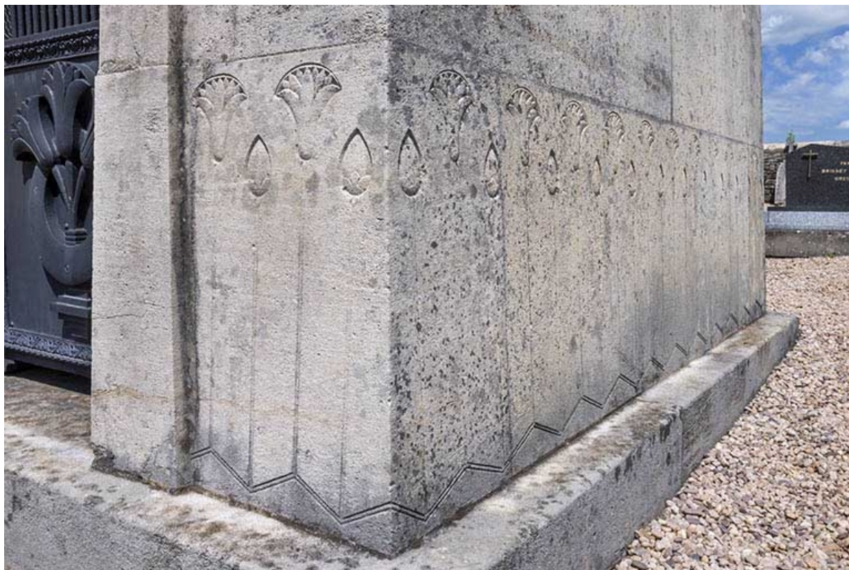
Le tombeau, de trois quarts droit, partie basse. 70, Jussey