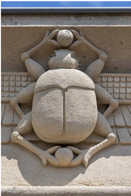
Détail du scarabée de la corniche.