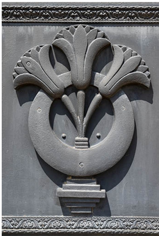
Détail du bas-relief de la porte