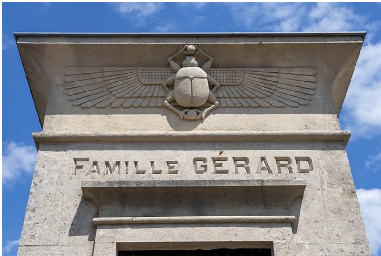
La corniche du tombeau.