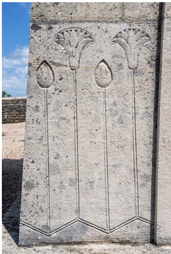
Ornements de la face antérieure (partie inférieure gauche). 70, Jussey