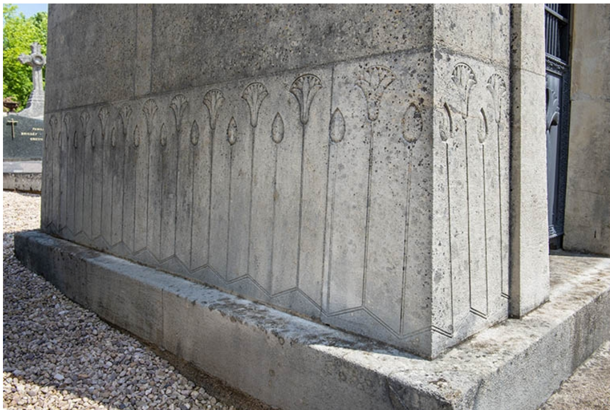
Le tombeau, de trois quarts gauche, partie basse. 70, Jussey