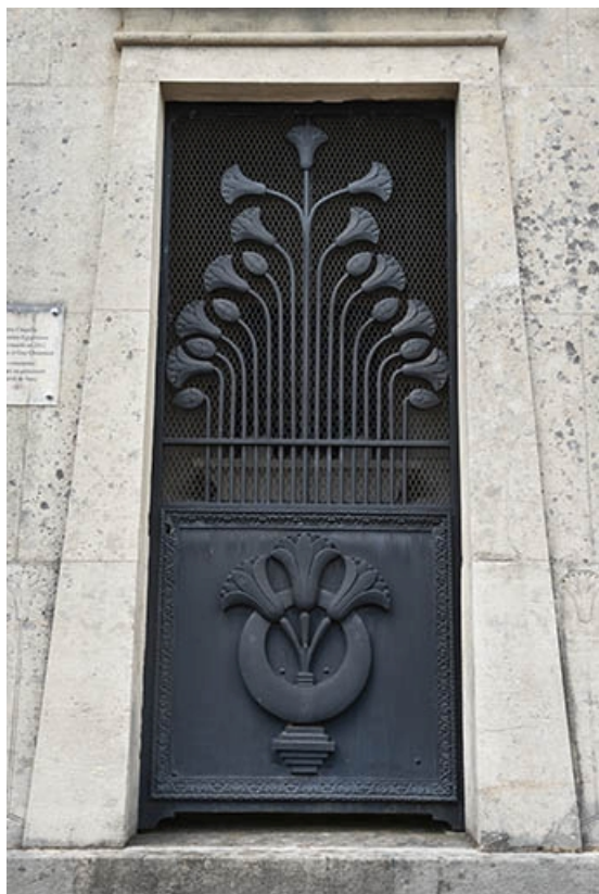
La porte. 70, Jussey