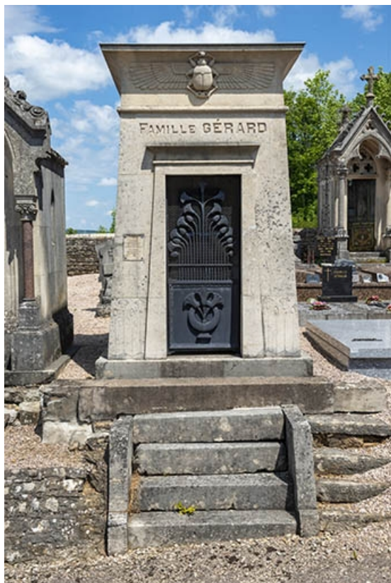
Le tombeau de face.