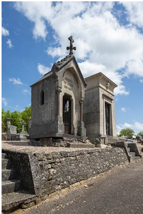
Le tombeau de trois quarts gauche, en contexte. 70, Jussey