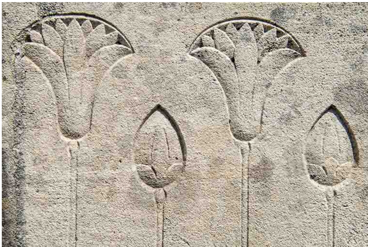
Détail des bas-reliefs du tombeau.