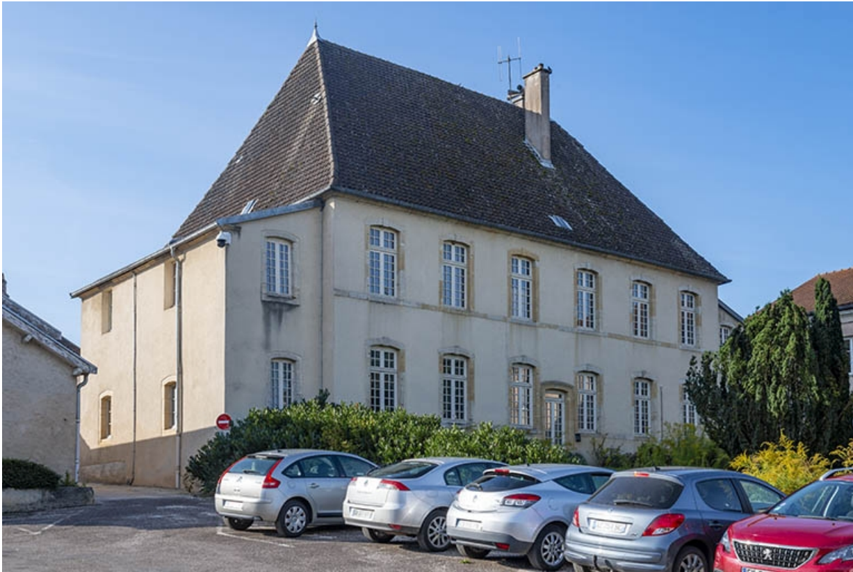
L'arrière, façade nord.