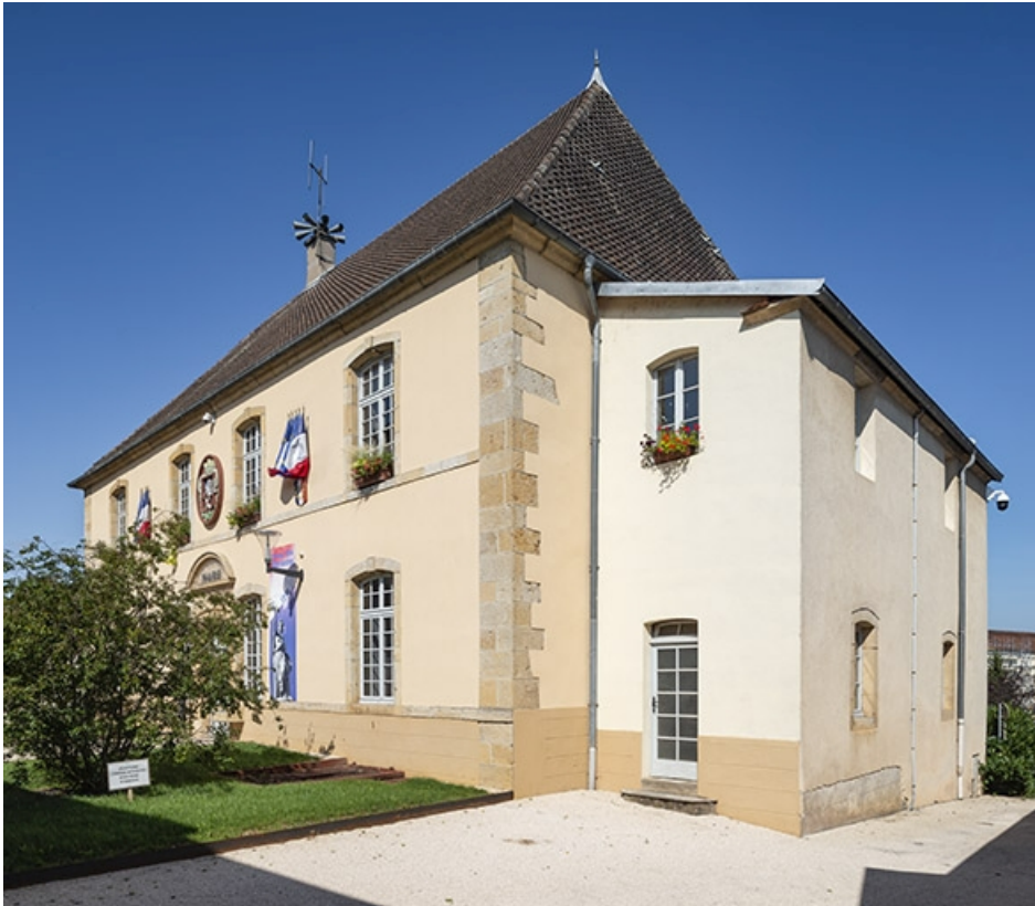
Trois quarts droit de la facade antérieure.