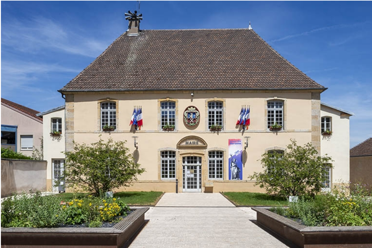
L'ensemble de la façade sud.