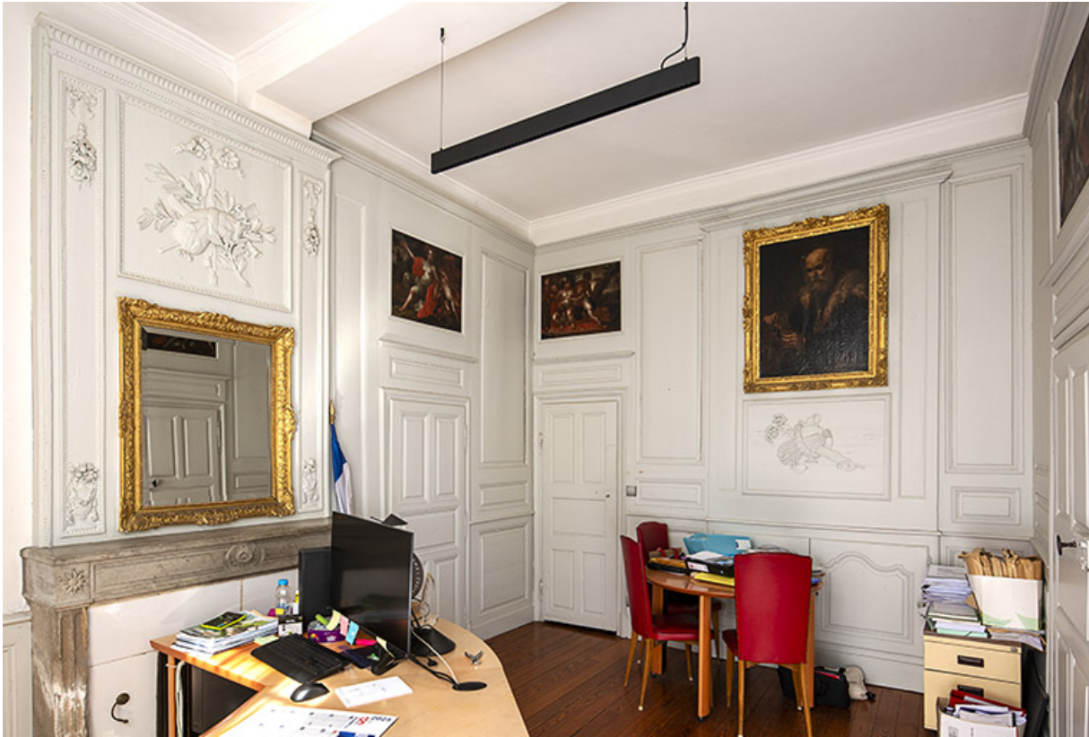
Le salon du rez-de-chaussée, dit bureau du maire.