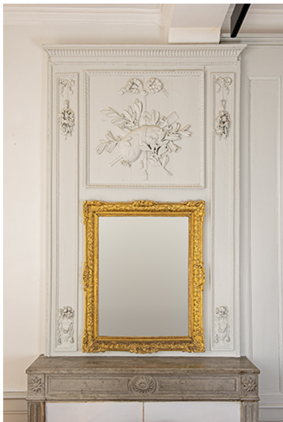
Bureau du maire, détail du lambris.