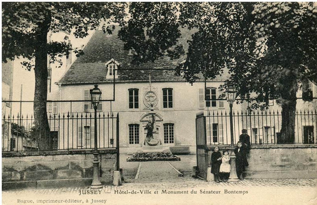
La cour de l'hôtel de ville avec le monument à Charles Bontemps, au début du 20e siècle. 70, Jussey