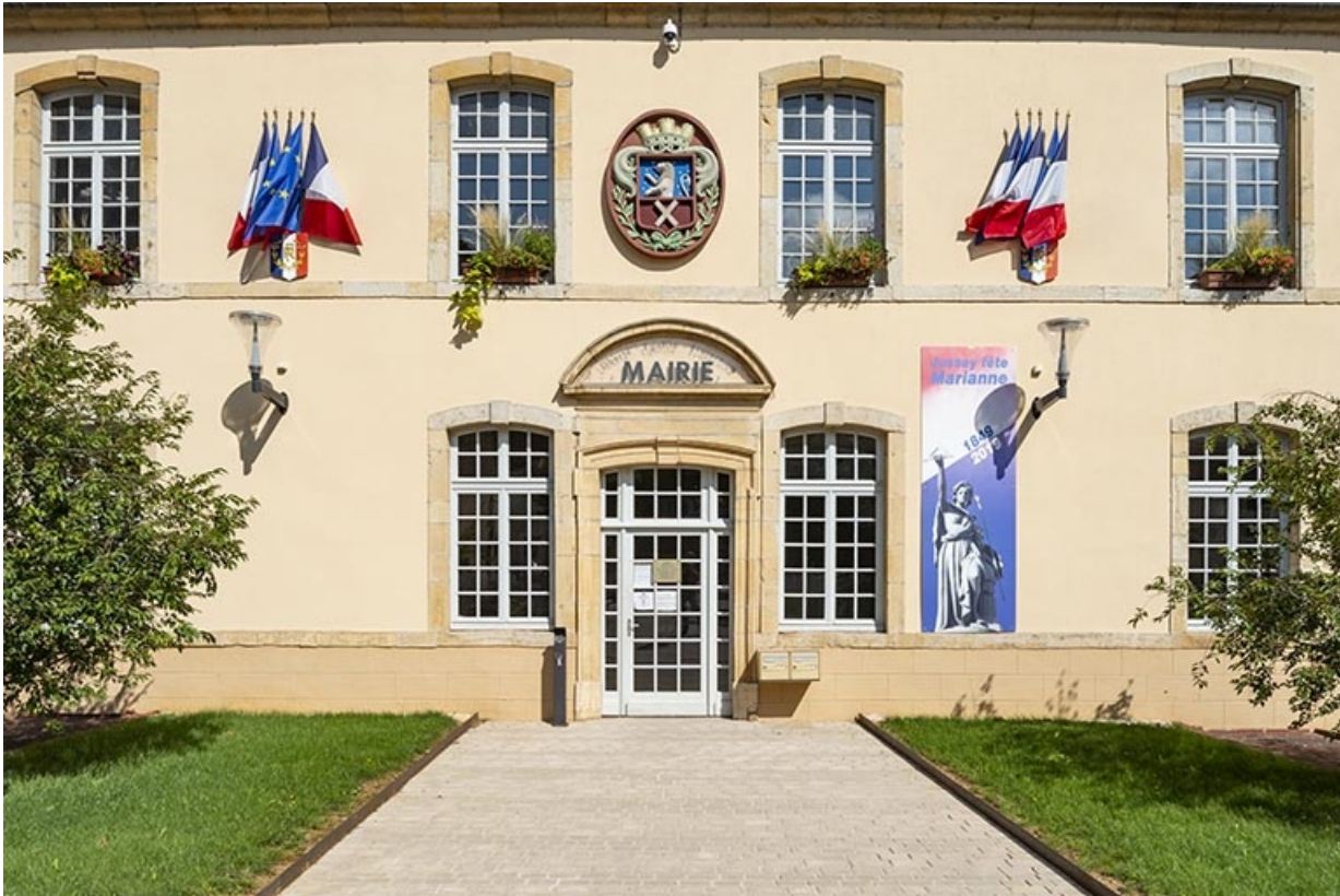
Détail de la façade antérieure.