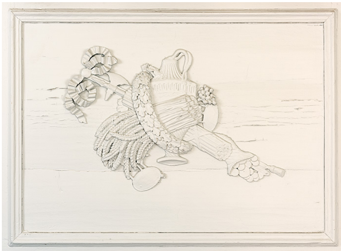
Bureau du maire, détail du décor.