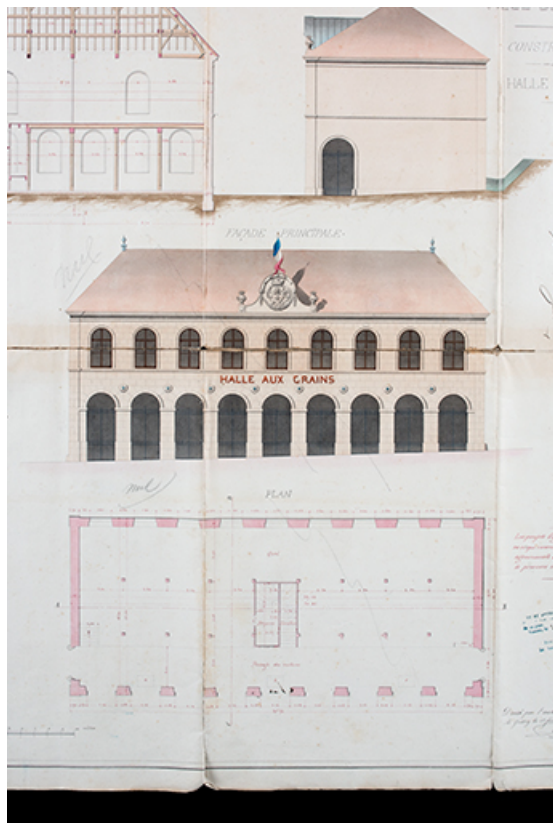
Projet de la halle municipale de Jussey [plans, élévations et coupes], 1863 (détail). 70, Jussey place de la République