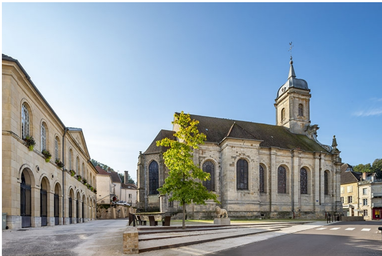
Flanc nord de l'église et façade de la halle aux grains.