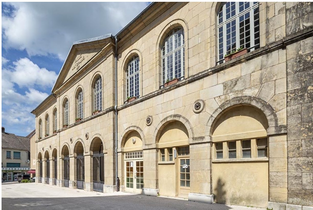
Vue de trois quarts droit de la façade antérieure de la halle.