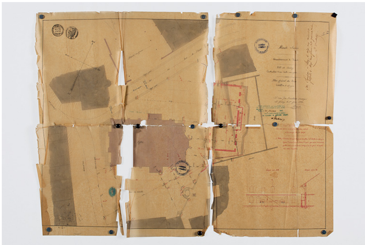
Plan de situation projeté de la halle municipale de Jussey [plan], 1863. 70, Jussey place de la République