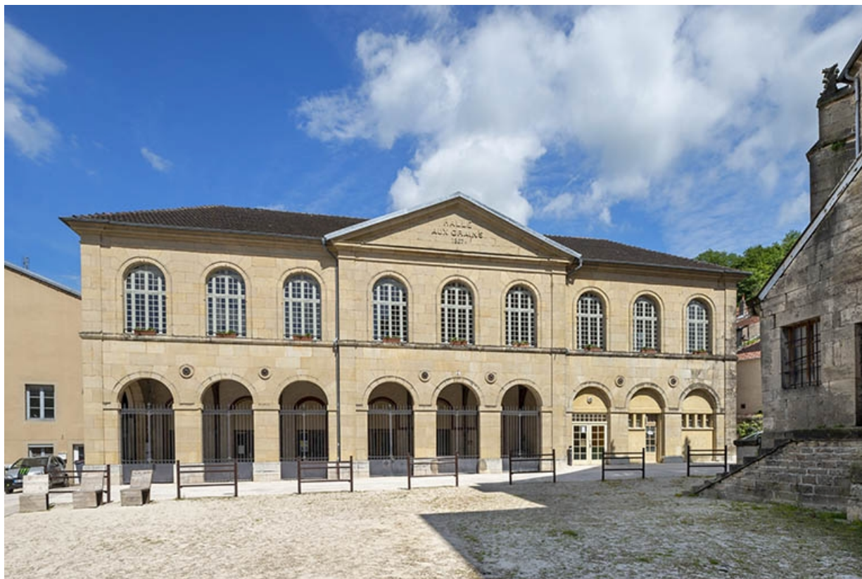
Vue de face de la halle.