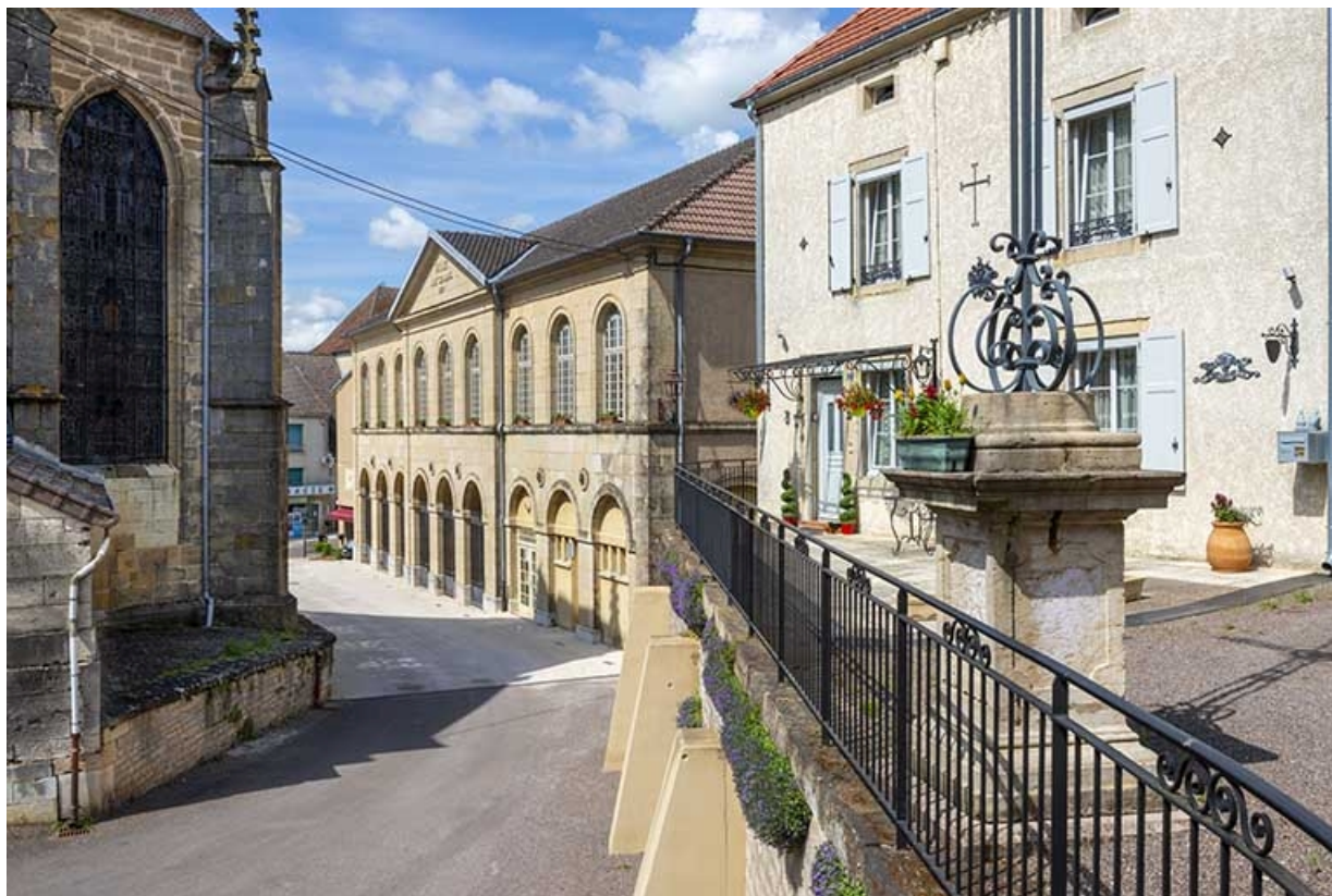
Vue éloignée depuis le sud.