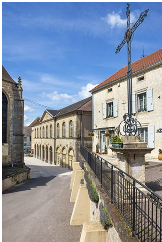
Vue éloignée depuis le sud.