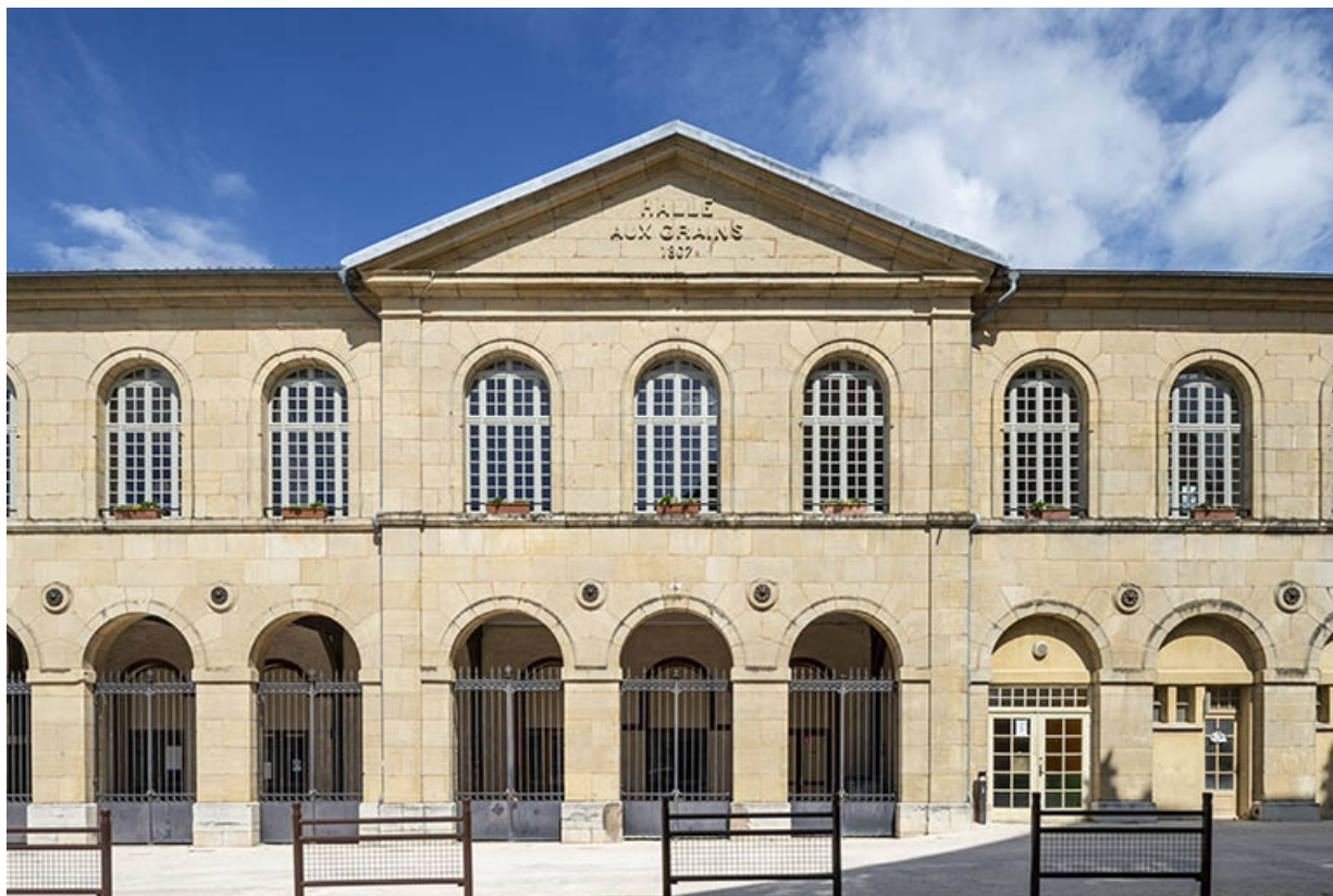
Détail de la vue de face de la façade antérieure de la halle.