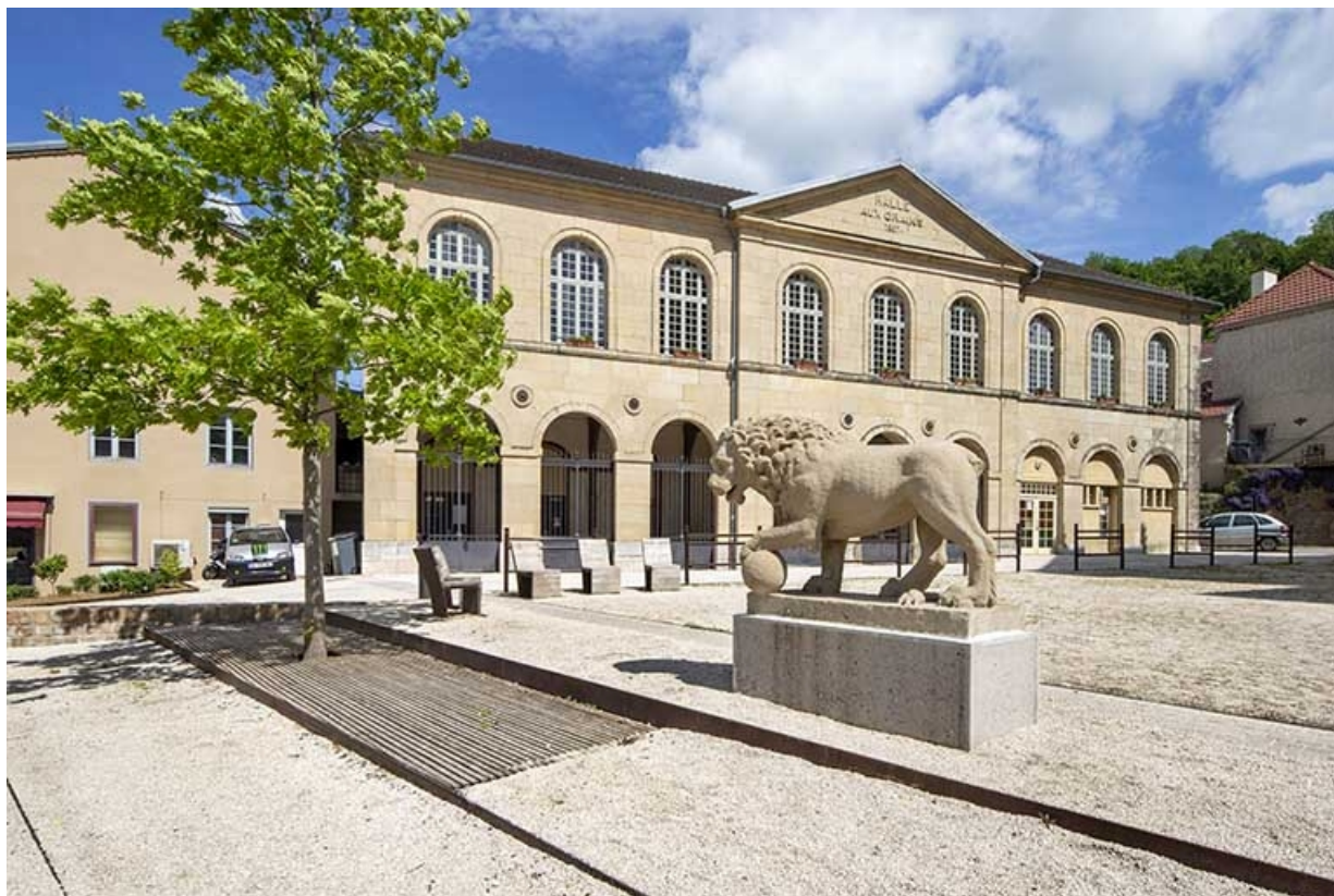
Vue éloignée de trois quarts gauche de la façade antérieure de la halle.