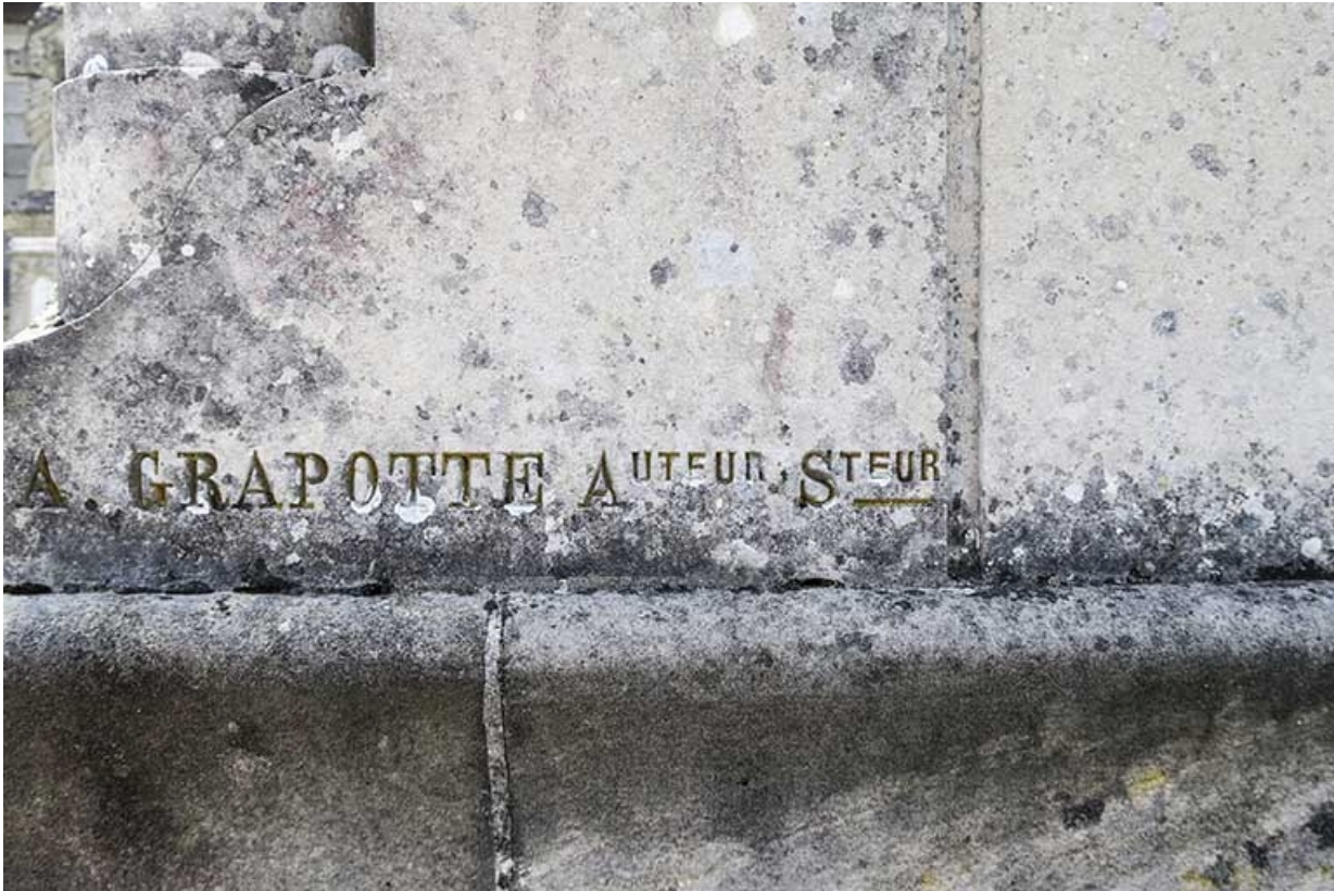
Détail, signature : A. GRAPOTTE.

70, Luxeuil-les-Bains place du Souvenir français