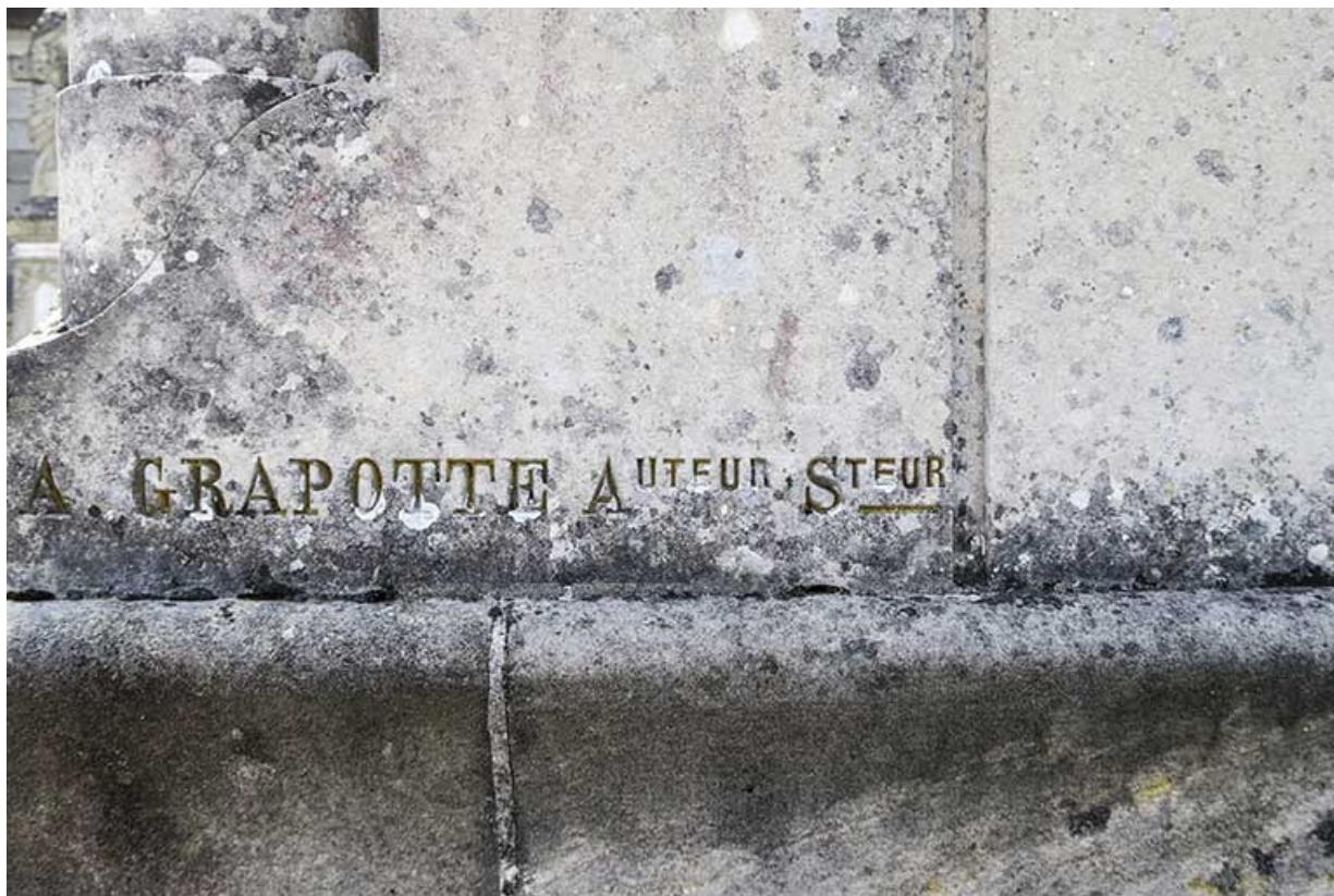
Détail, signature : A. GRAPOTTE.

70, Luxeuil-les-Bains place du Souvenir français