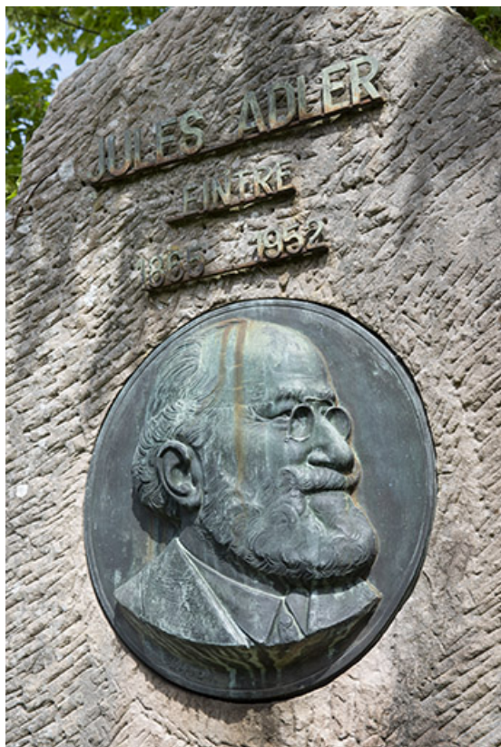
Médaille, portrait de Jules Adler.

70, Luxeuil-les-Bains, 3 rue des Thermes