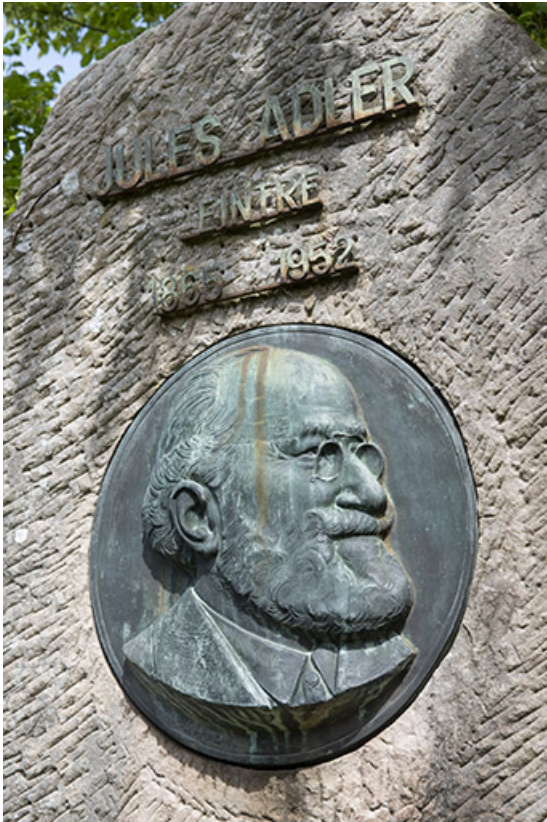
Médaille, portrait de Jules Adler.

70, Luxeuil-les-Bains, 3 rue des Thermes