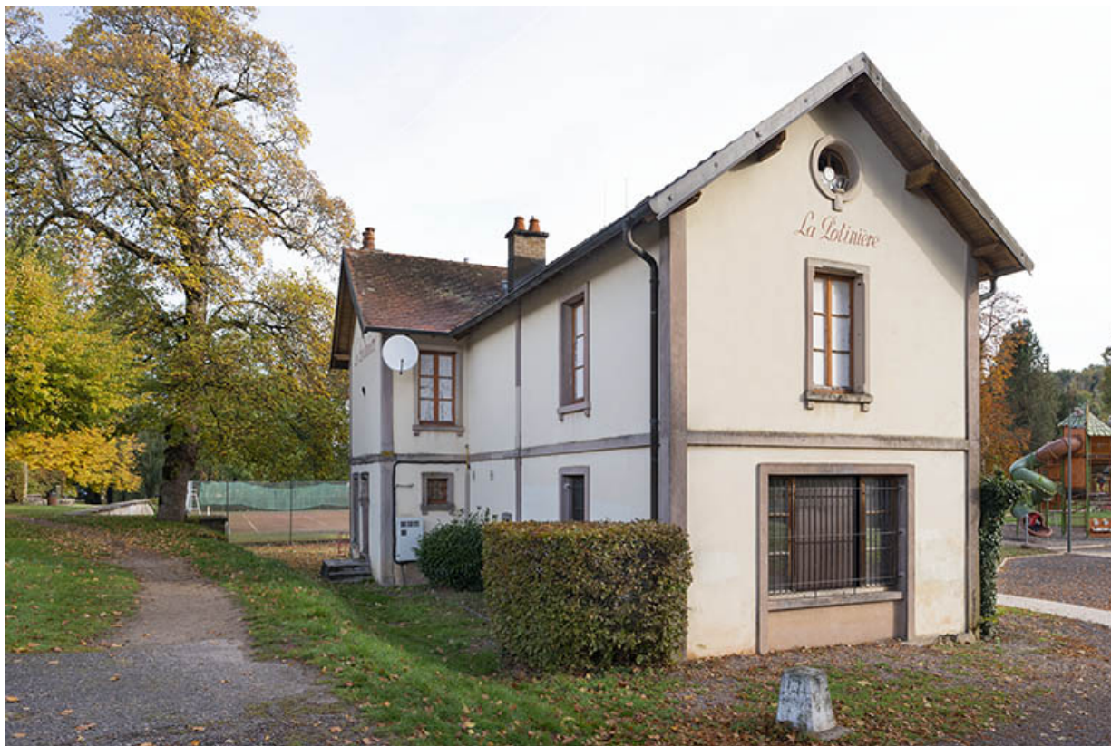
Vue depuis le sud-ouest.

70, Luxeuil-les-Bains, 3 rue des Thermes