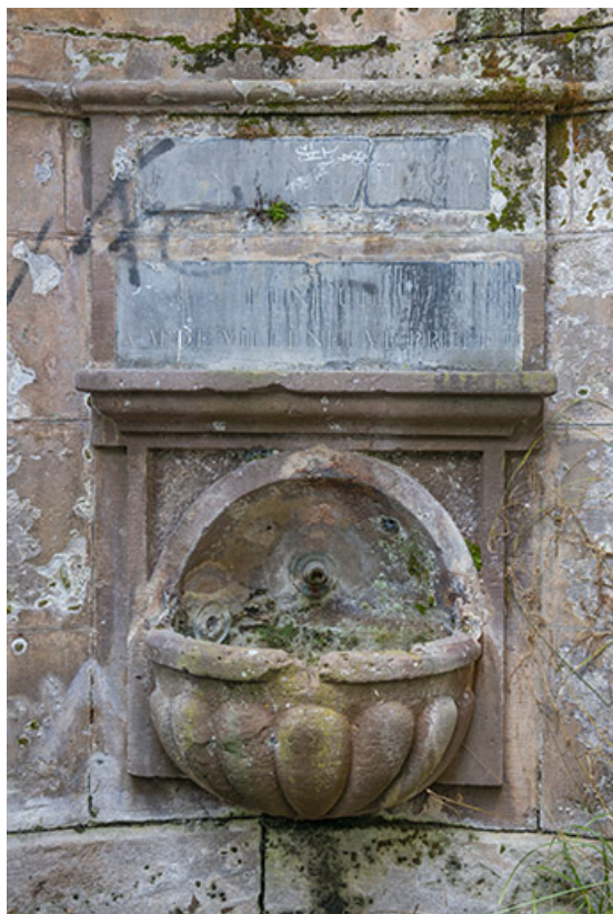
Demi-vasque godronnée et inscription.

70, Luxeuil-les-Bains, 3 rue des Thermes