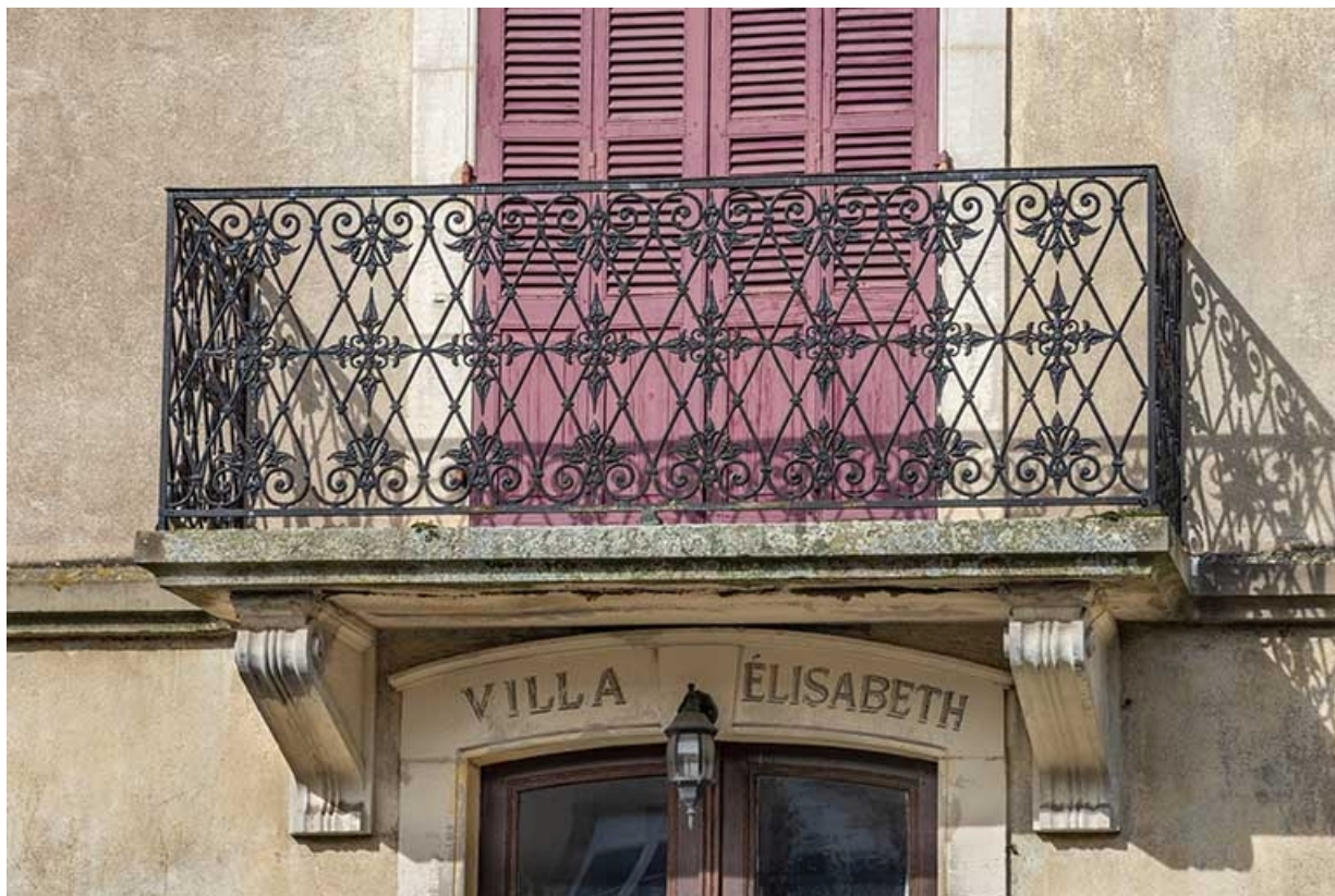
Façade sud, détail, balcon et inscription de la porte d'entrée.