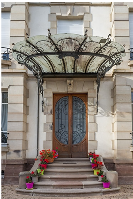
Porte d'entrée surmontée d'une marquise, vue de face. 70, Luxeuil-les-Bains, 11B rue de Grammont