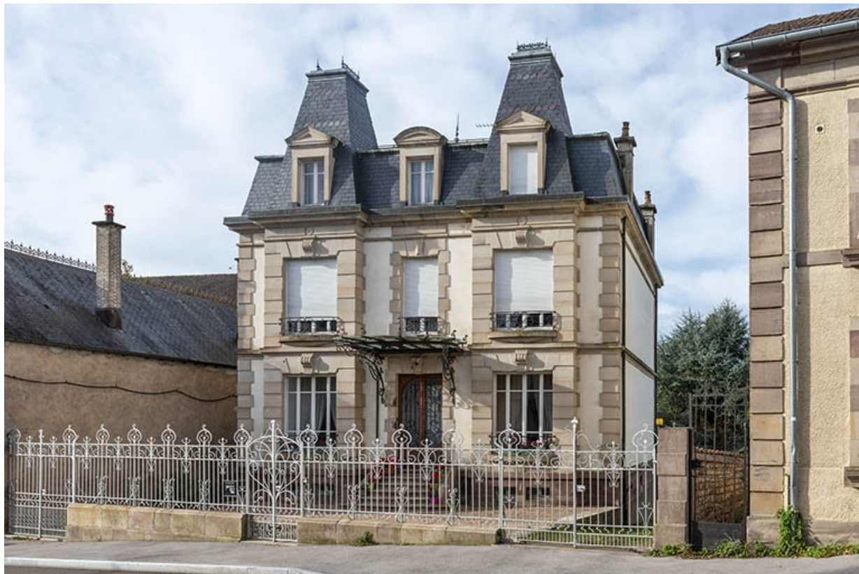
Façade principale, vue de trois quarts depuis le nord-est.

70, Luxeuil-les-Bains, 11B rue de Grammont