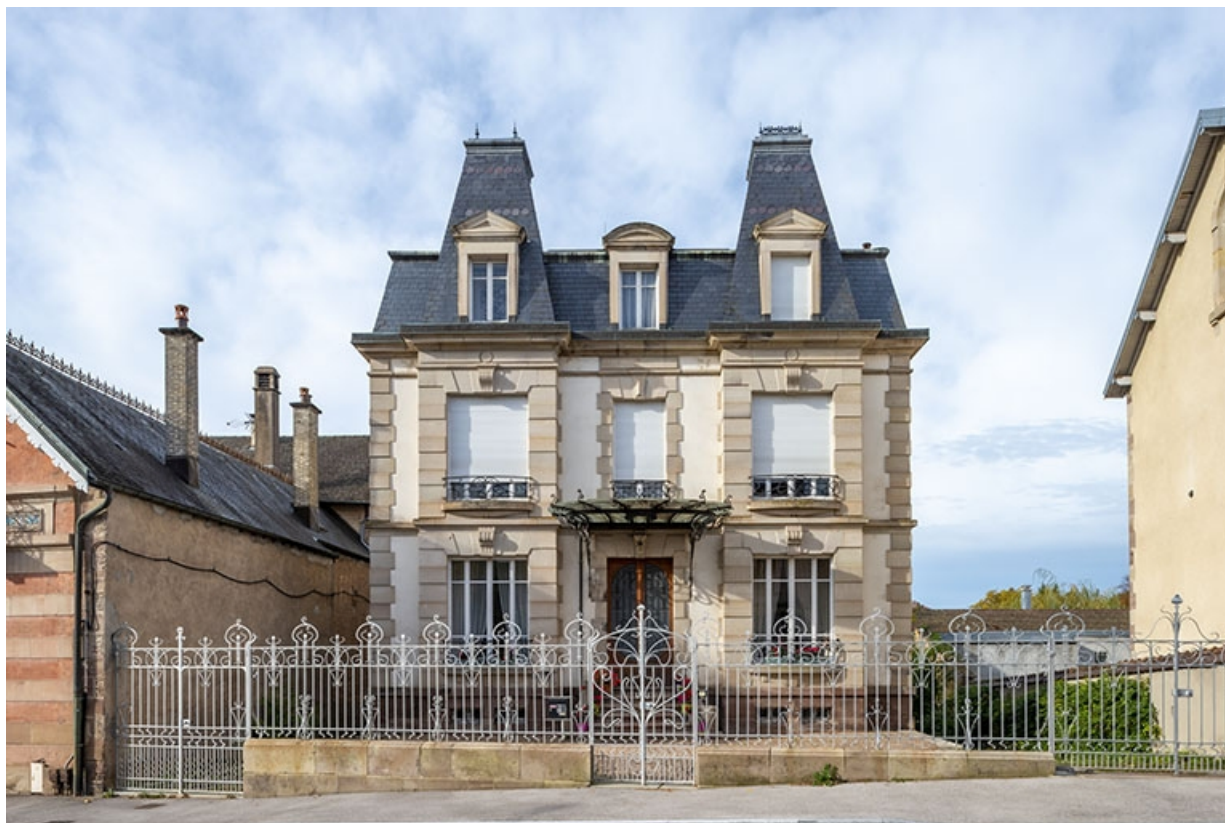
Façade principale, vue de face.

70, Luxeuil-les-Bains, 11B rue de Grammont