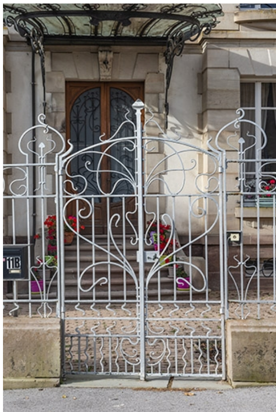
Grille de clôture.

70, Luxeuil-les-Bains, 11B rue de Grammont