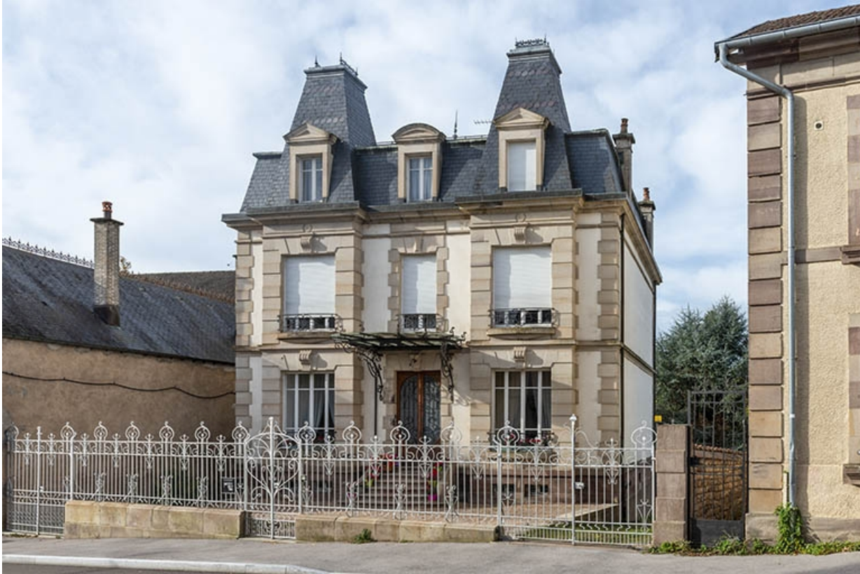
Façade principale, vue de trois quarts depuis le nord-est.

70, Luxeuil-les-Bains, 11B rue de Grammont