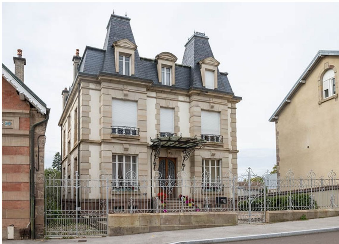
Façade principale, vue de trois quarts depuis le sud-est.

70, Luxeuil-les-Bains, 11B rue de Grammont