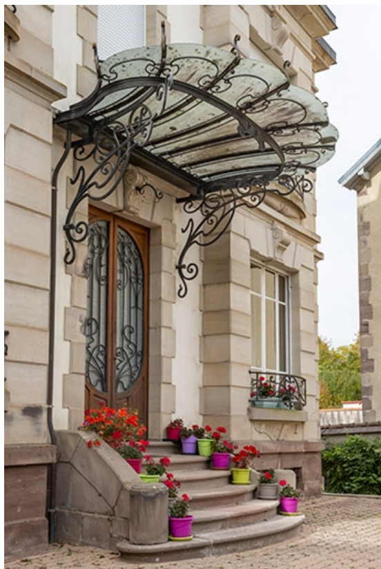
Porte d'entrée surmontée d'une marquise, vue de trois quarts.

70, Luxeuil-les-Bains, 11B rue de Grammont