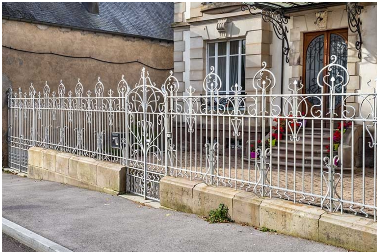
Grille de clôture.

70, Luxeuil-les-Bains, 11B rue de Grammont