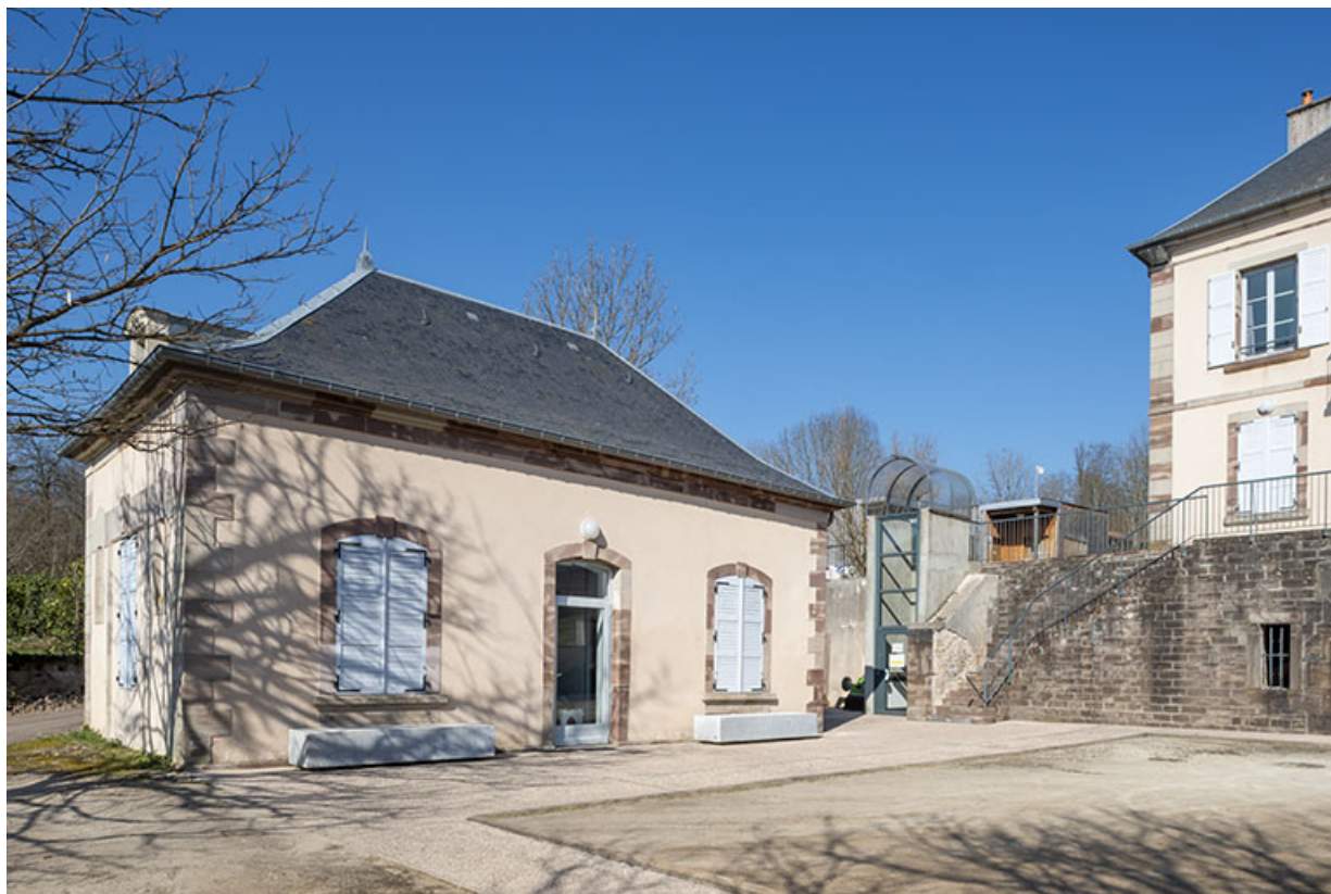
Aile de gauche.

70, Luxeuil-les-Bains, 14 rue de Grammont