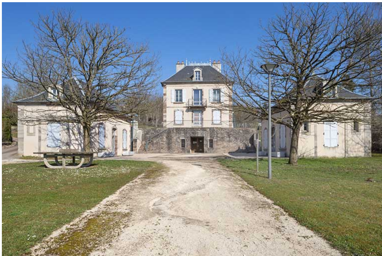
Vue d'ensemble (vue rapprochée).

70, Luxeuil-les-Bains, 14 rue de Grammont