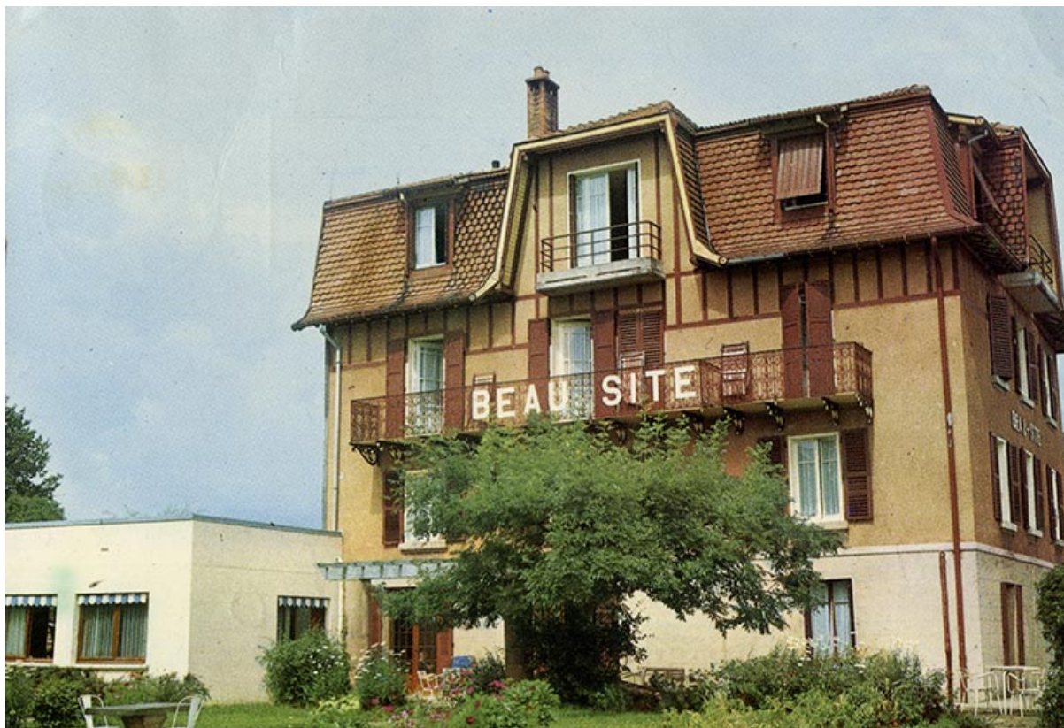
Vue datant du dernier quart du 20e siècle. 70, Luxeuil-les-Bains, 18 rue Roger Moulinard