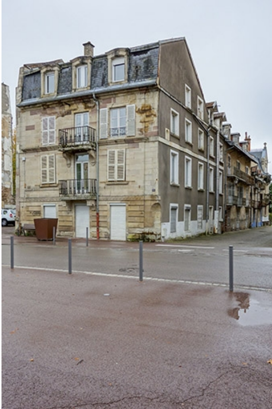
Façade sur la rue des Thermes, vue sur l'allée des Romains.

70, Luxeuil-les-Bains, 10 rue des Thermes