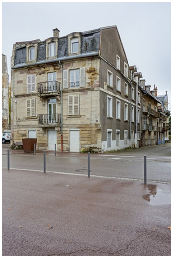
Façade sur la rue des Thermes, vue sur l'allée des Romains.

70, Luxeuil-les-Bains, 10 rue des Thermes