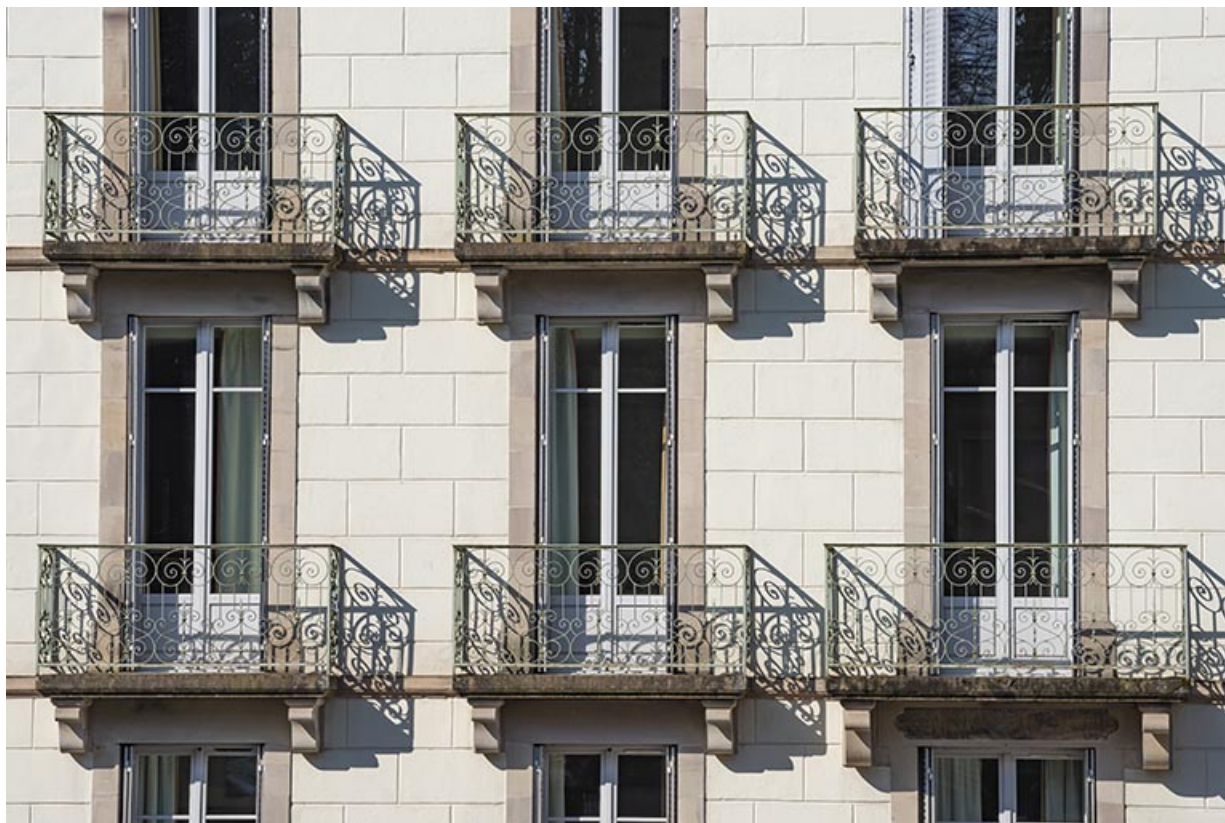
Façade sur rue de l'aile sud, détail : balcons. 70, Luxeuil-les-Bains, 2 avenue Jean Moulin