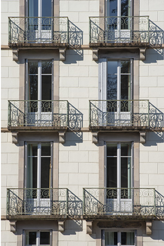
Façade sur rue de l'aile sud, détail : balcons.

70, Luxeuil-les-Bains, 2 avenue Jean Moulin