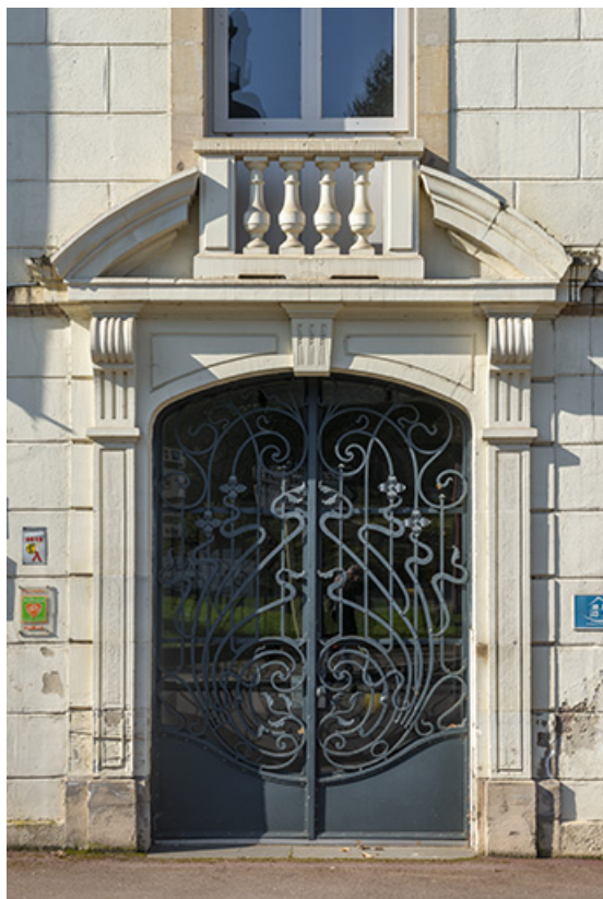
Façade sur rue de l'aile nord, détail : porte. 70, Luxeuil-les-Bains, 2 avenue Jean Moulin