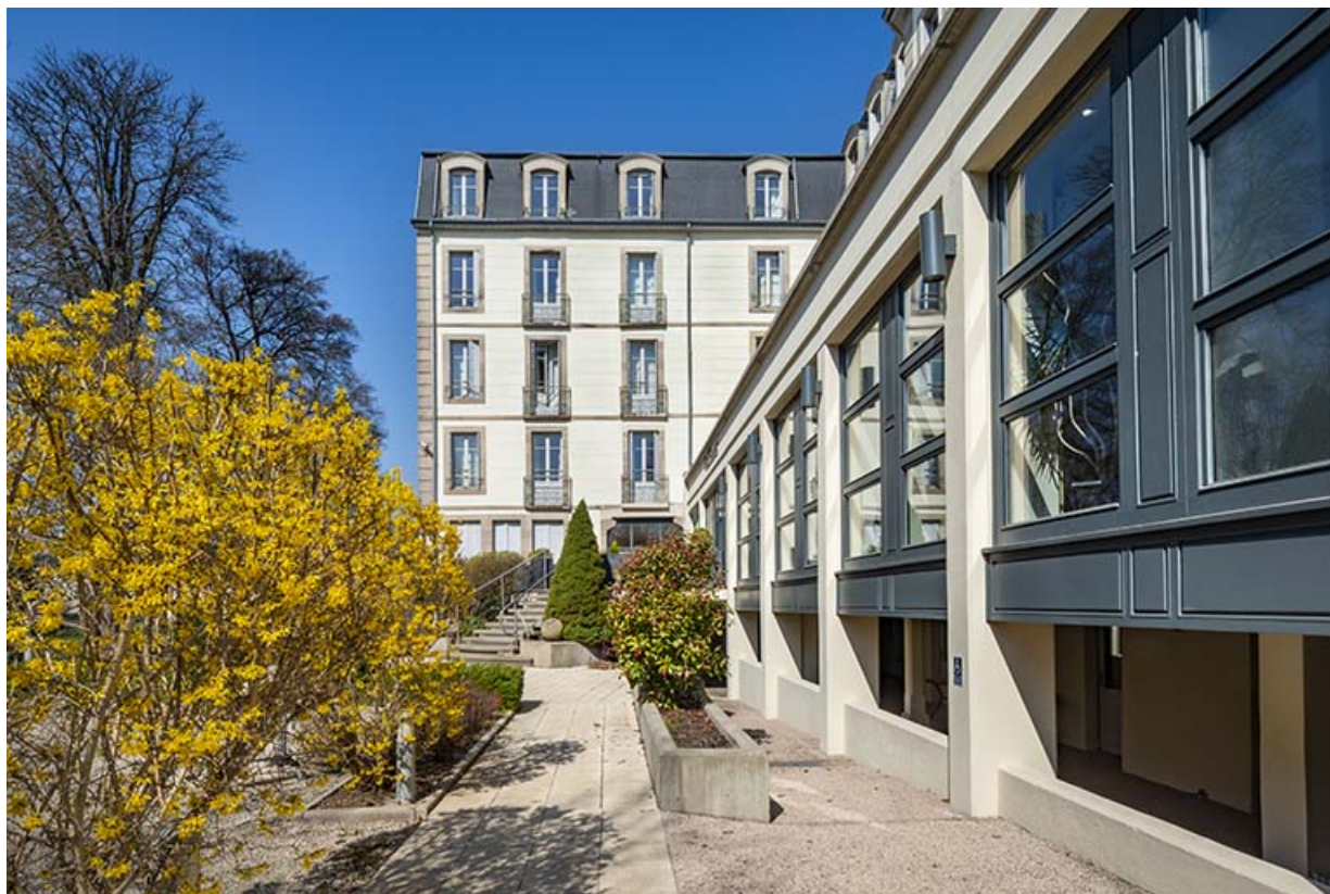
Extension en rez-de-chaussée côté parc. 70, Luxeuil-les-Bains, 2 avenue Jean Moulin