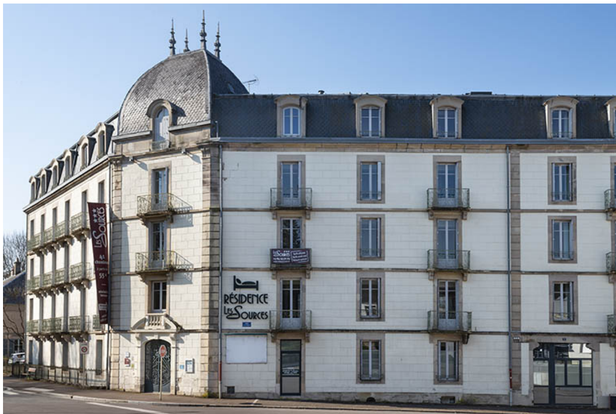
Façade sur rue de l'aile nord, détail.

70, Luxeuil-les-Bains, 2 avenue Jean Moulin