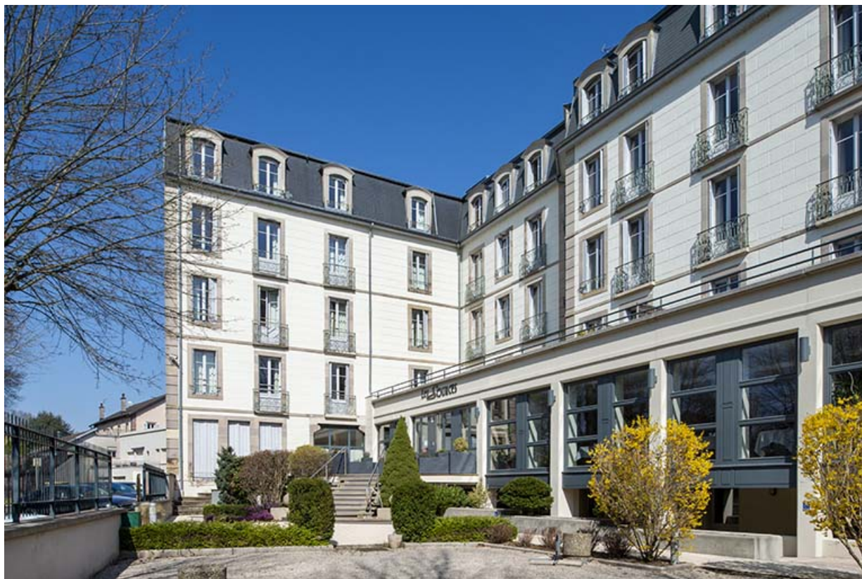
Façade sur parc de l'aile nord.

70, Luxeuil-les-Bains, 2 avenue Jean Moulin