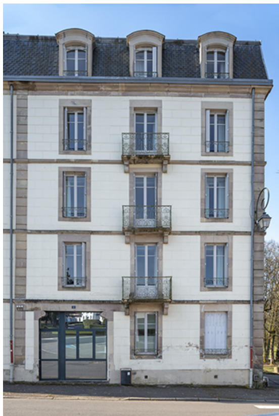
Façade sur rue de l'aile nord, détail.

70, Luxeuil-les-Bains, 2 avenue Jean Moulin