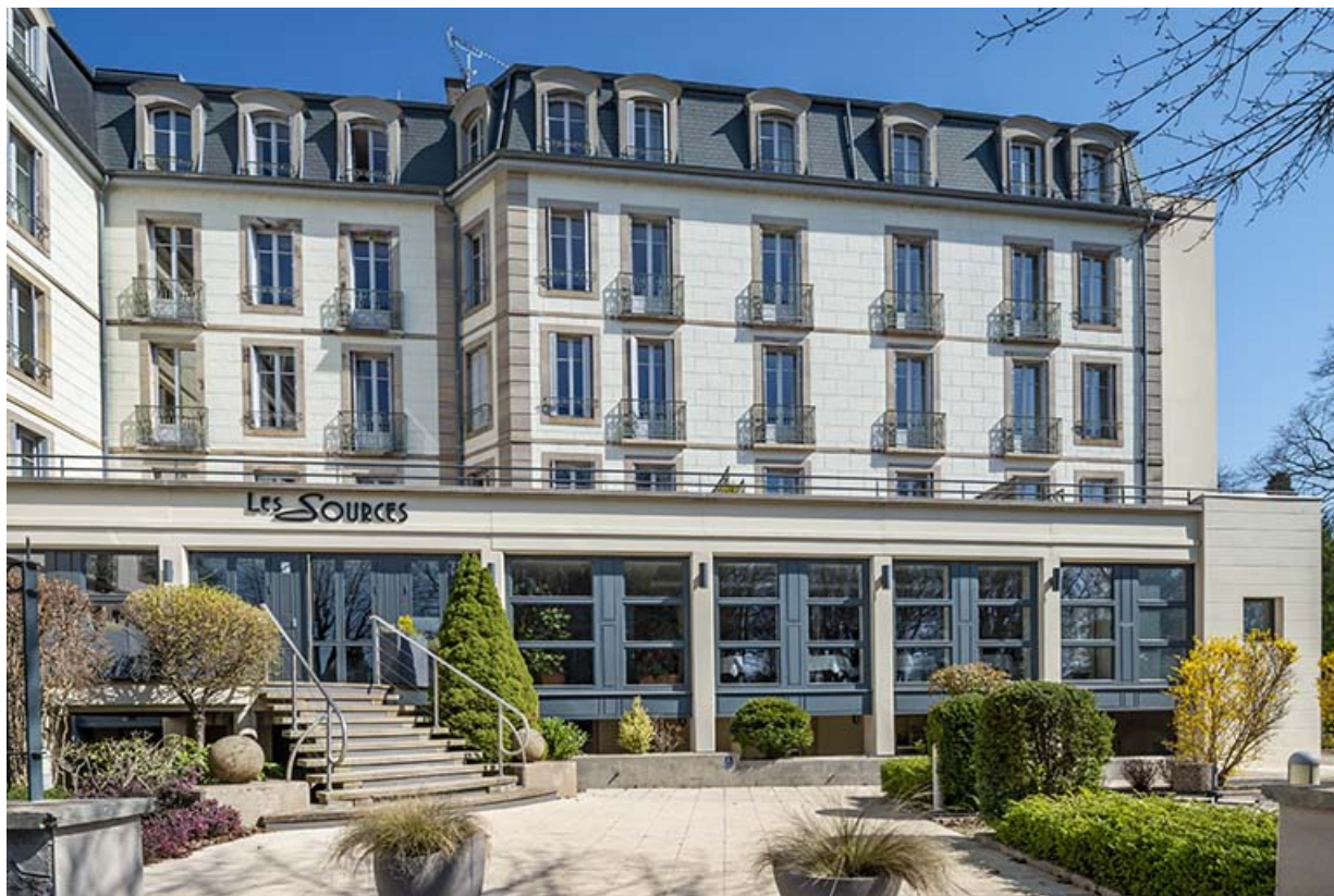
Façade sur parc de l'aile sud.

70, Luxeuil-les-Bains, 2 avenue Jean Moulin