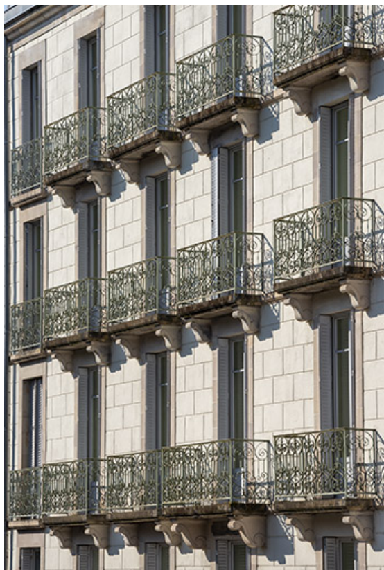
Façade sur rue de l'aile sud, détail : balcons.

70, Luxeuil-les-Bains, 2 avenue Jean Moulin