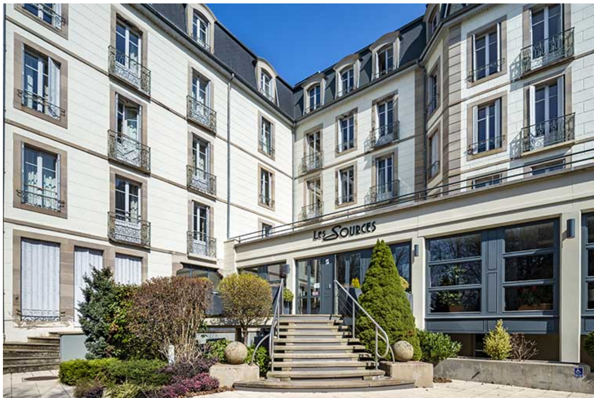
Extension en rez-de-chaussée côté parc. 70, Luxeuil-les-Bains, 2 avenue Jean Moulin