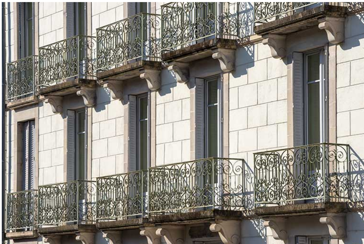
Façade sur rue de l'aile sud, détail : balcons. 70, Luxeuil-les-Bains, 2 avenue Jean Moulin