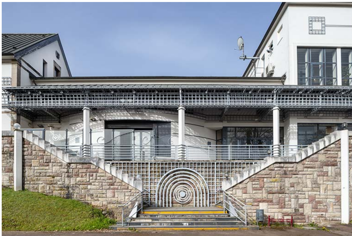
Corps de bâtiment liant la maison (à gauche) et la salle des fêtes (à droite). 70, Luxeuil-les-Bains, 16 rue de la Saline