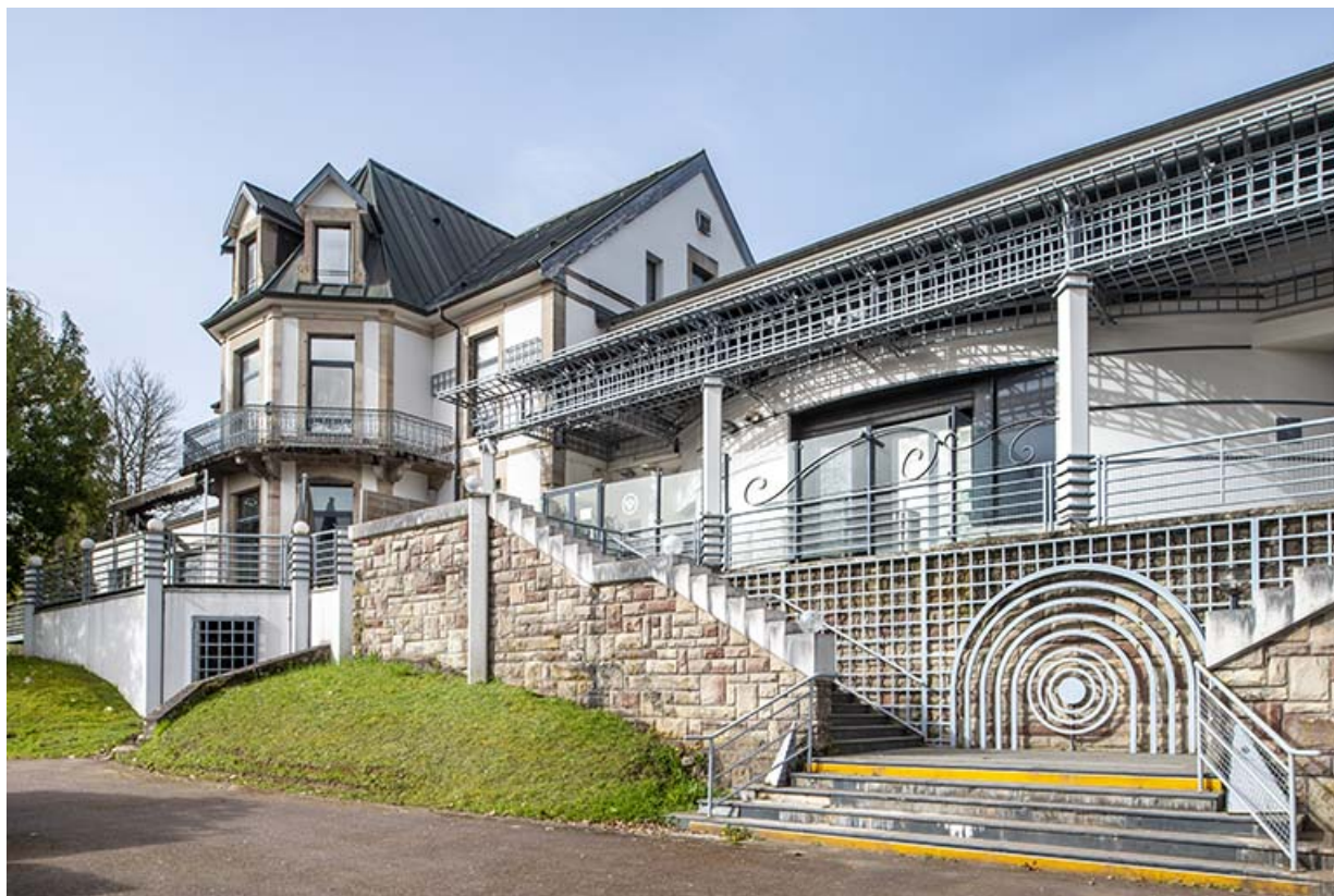
Corps de bâtiment liant la maison (à gauche) et la salle des fêtes (à droite). 70, Luxeuil-les-Bains, 16 rue de la Saline