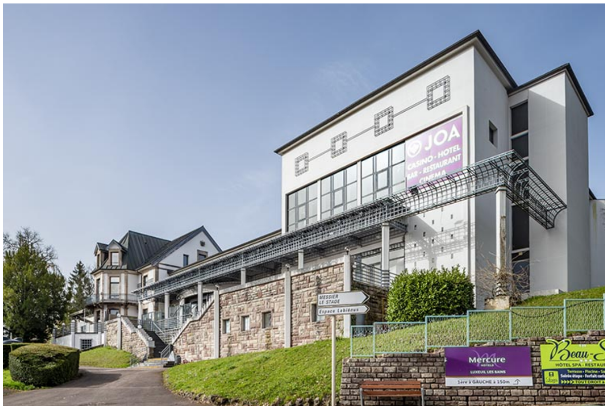
Salle des fêtes, vue depuis le nord-ouest.

70, Luxeuil-les-Bains, 16 rue de la Saline