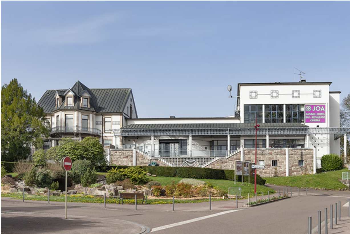
Vue d'ensemble avec la maison (à gauche) et la salle des fêtes (à droite).

70, Luxeuil-les-Bains, 16 rue de la Saline