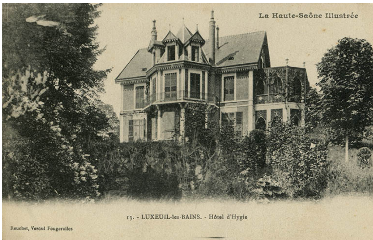
Maison, vue ancienne (premier quart du 20e siècle).

70, Luxeuil-les-Bains, 16 rue de la Saline