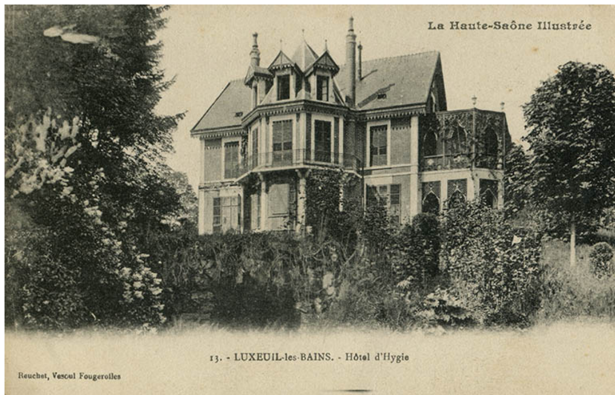
Maison, vue ancienne (premier quart du 20e siècle).

70, Luxeuil-les-Bains, 16 rue de la Saline