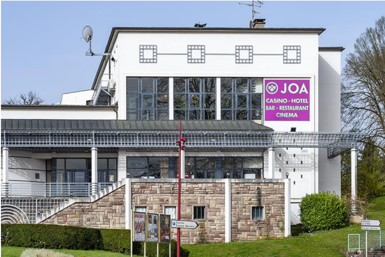
Salle des fêtes, vue depuis l'ouest.

70, Luxeuil-les-Bains, 16 rue de la Saline