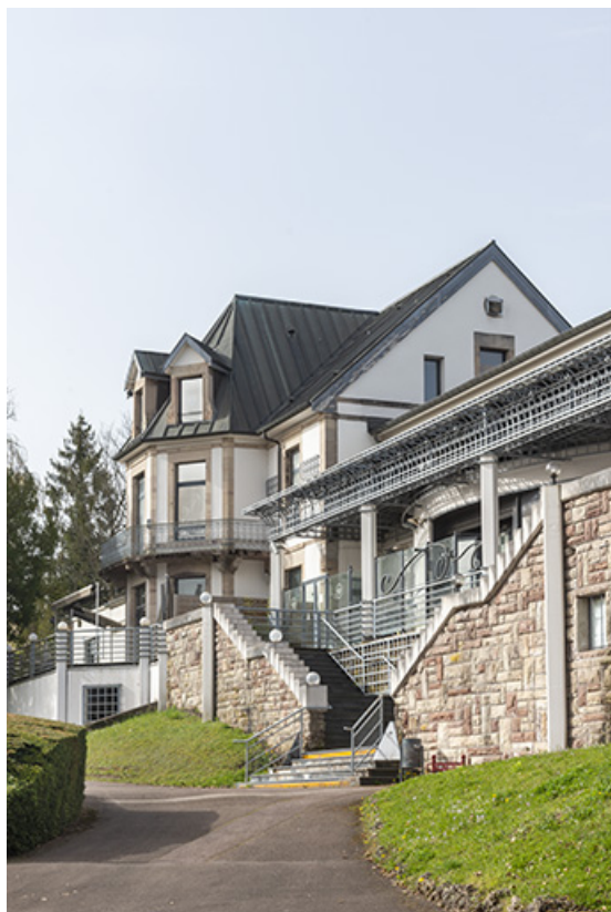
Maison, vue depuis le nord.

70, Luxeuil-les-Bains, 16 rue de la Saline