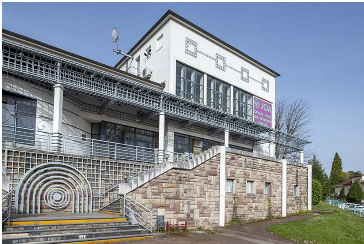
Salle des fêtes, vue depuis le sud-ouest.

70, Luxeuil-les-Bains, 16 rue de la Saline