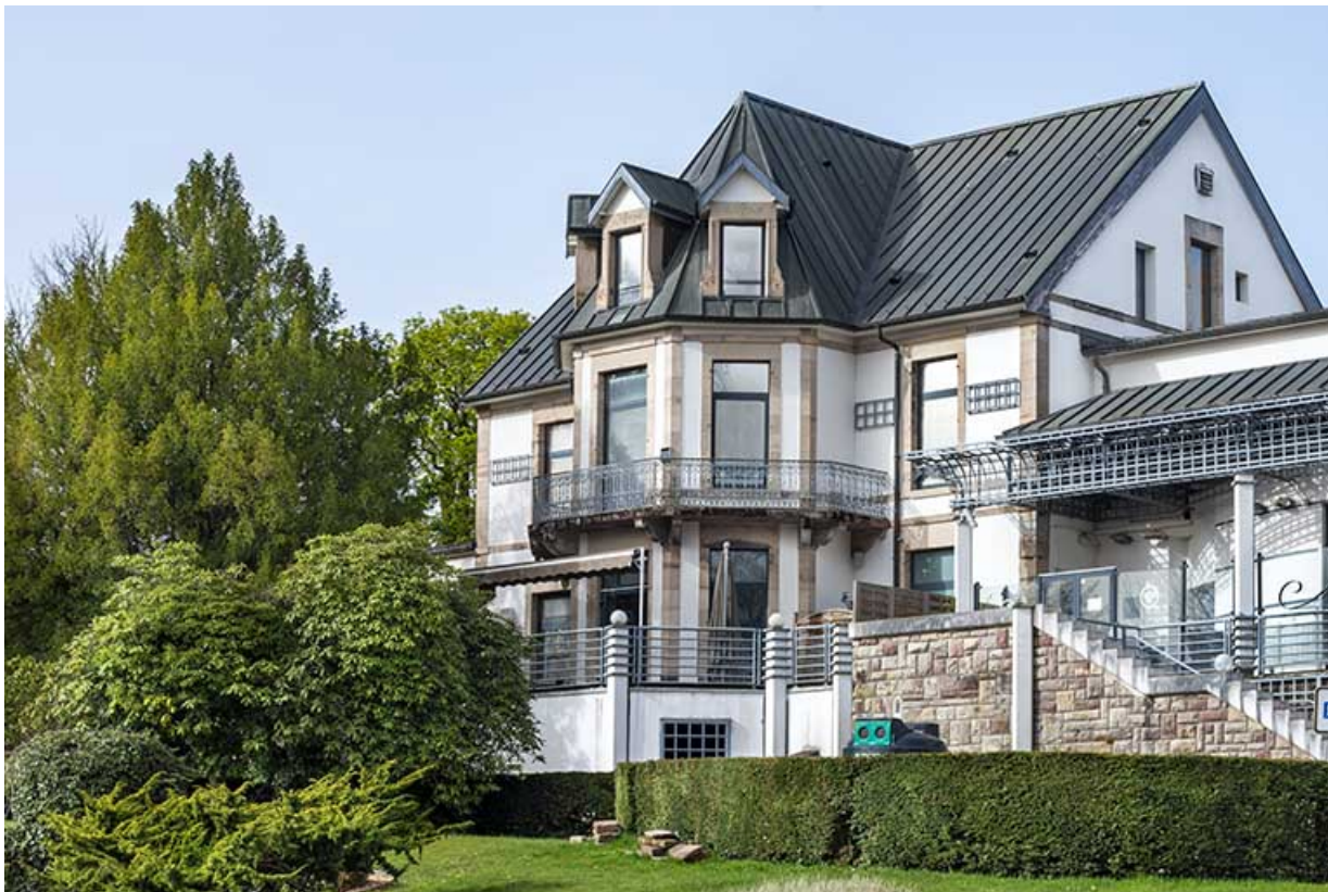
Maison, vue depuis le nord.

70, Luxeuil-les-Bains, 16 rue de la Saline