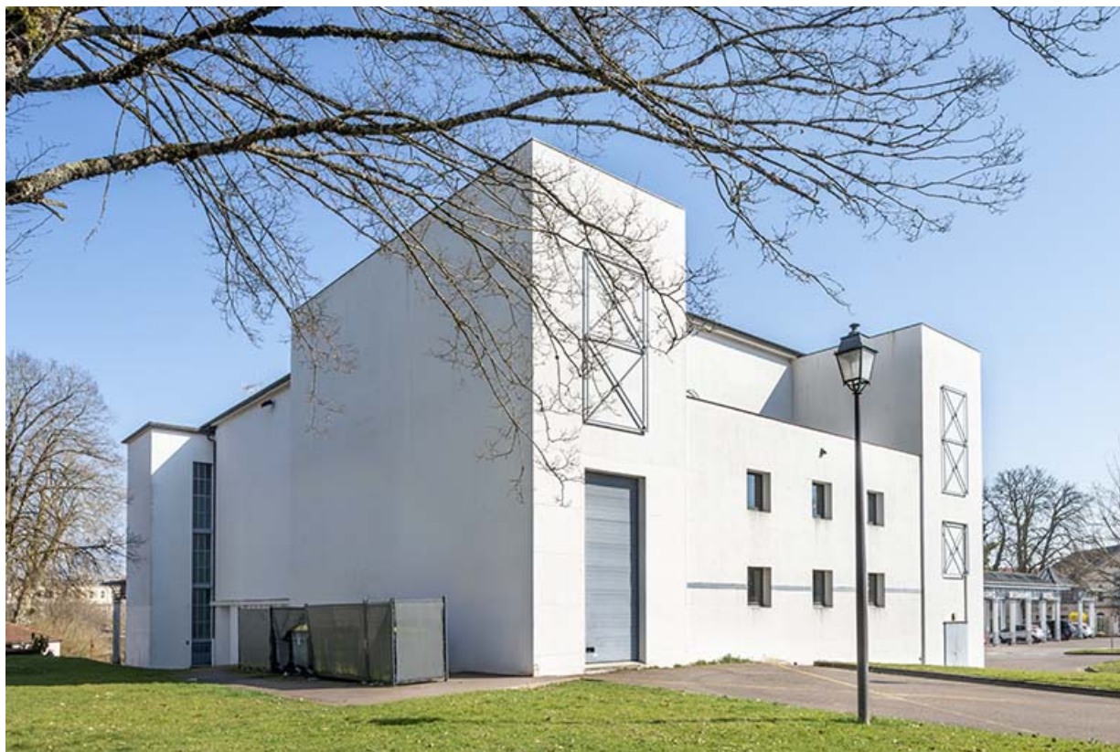
Salle des fêtes, vue depuis le nord-ouest. 70, Luxeuil-les-Bains, 16 rue de la Saline