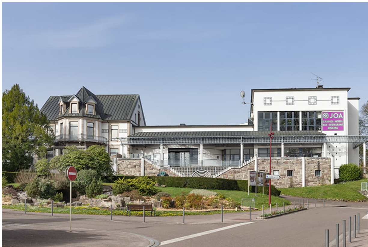
Vue d'ensemble avec la maison (à gauche) et la salle des fêtes (à droite).

70, Luxeuil-les-Bains, 16 rue de la Saline