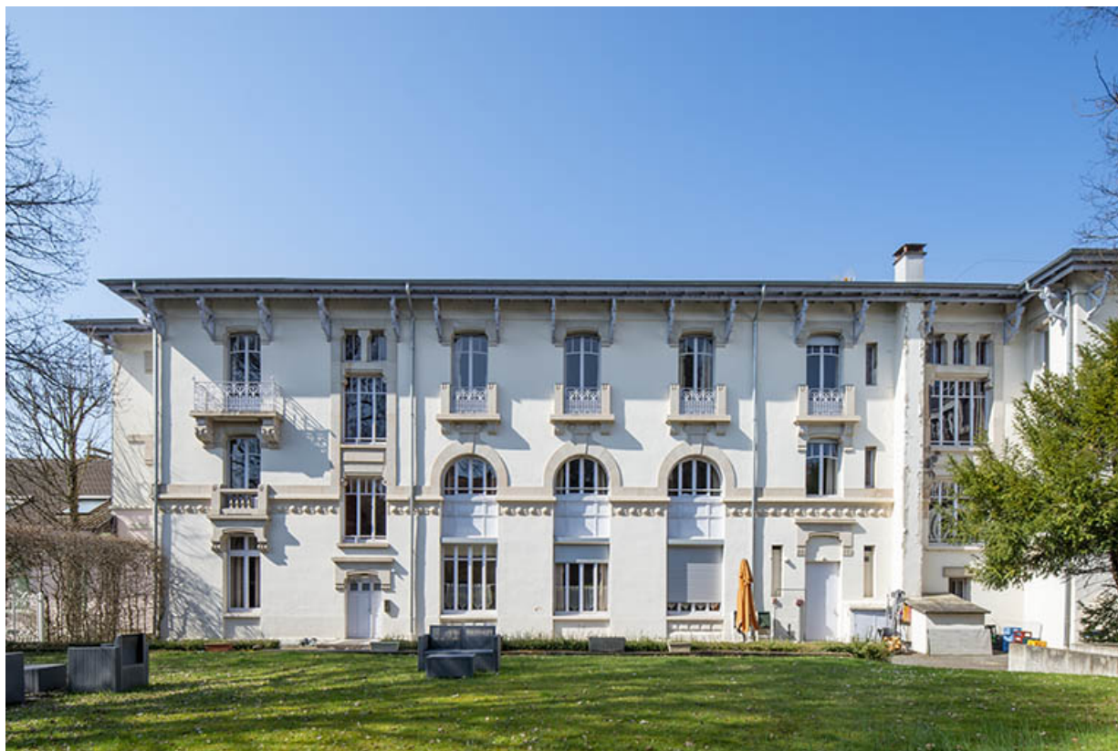
Façade est, vue de face.

70, Luxeuil-les-Bains, 4B rue des Thermes