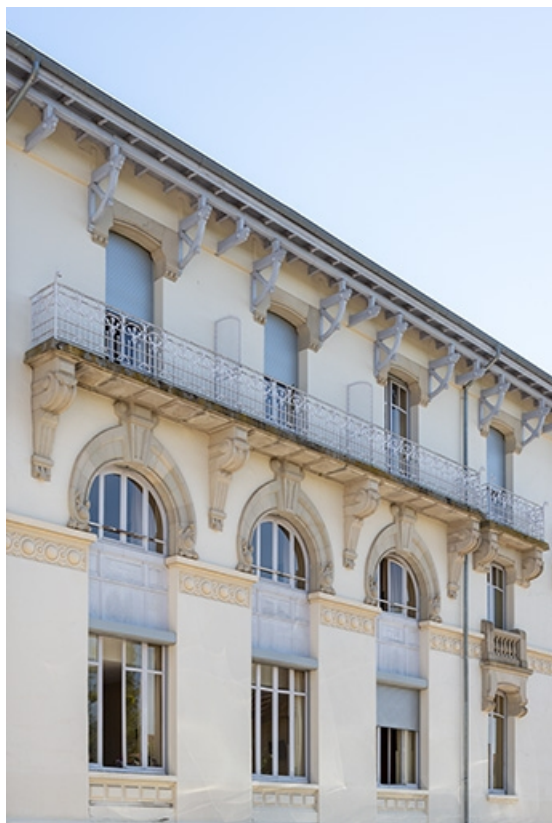
Façade ouest, vue de trois quarts, détail.

70, Luxeuil-les-Bains, 4B rue des Thermes