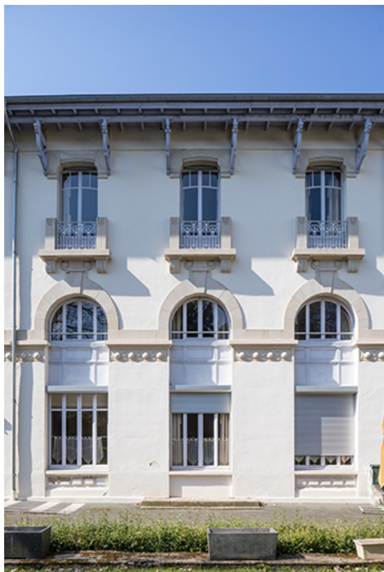
Façade est, vue de face, détail.

70, Luxeuil-les-Bains, 4B rue des Thermes