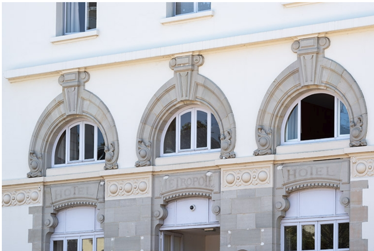
Façade nord, vue de trois quarts, détail. 70, Luxeuil-les-Bains, 4B rue des Thermes