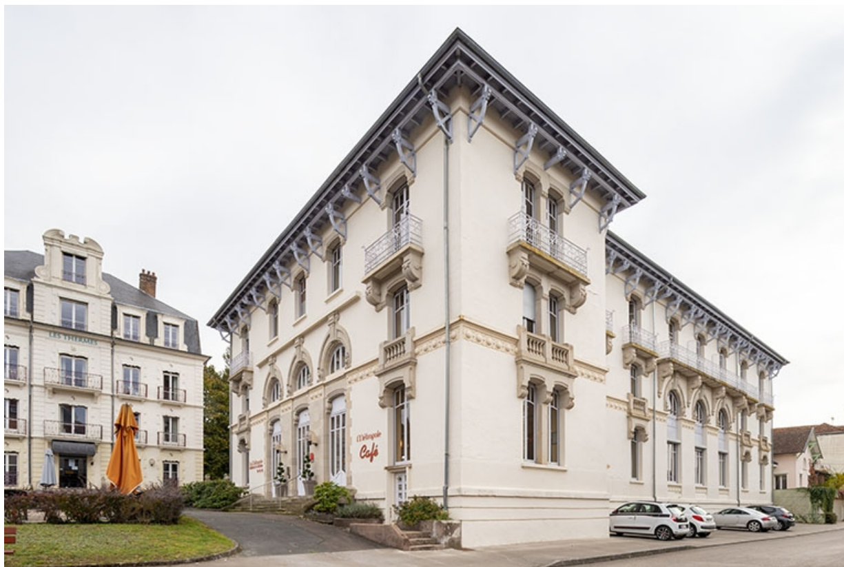
Façade ouest, vue de trois quarts depuis le nord-ouest.

70, Luxeuil-les-Bains, 4B rue des Thermes