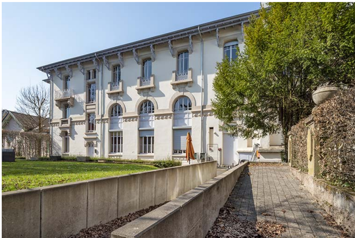
Façade est, vue de trois quarts.

70, Luxeuil-les-Bains, 4B rue des Thermes