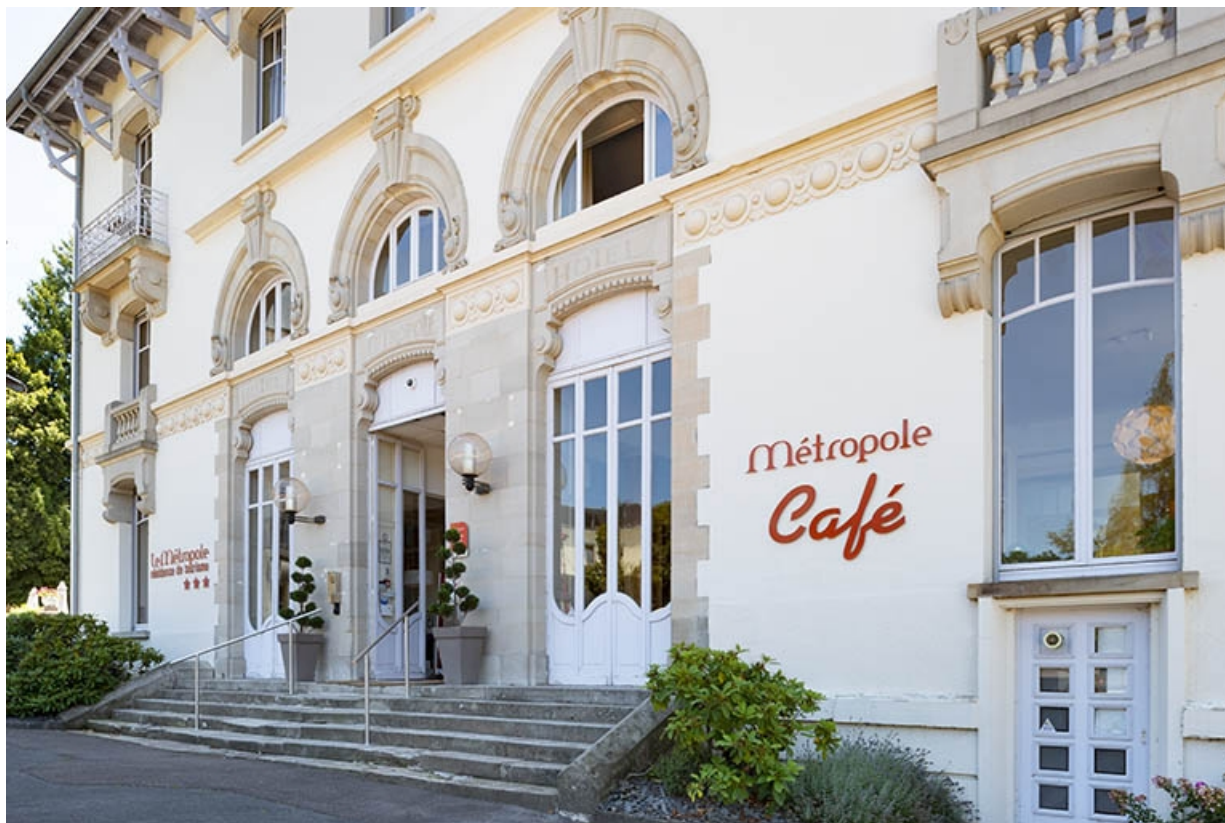
Façade nord, vue de trois quarts, détail. 70, Luxeuil-les-Bains, 4B rue des Thermes