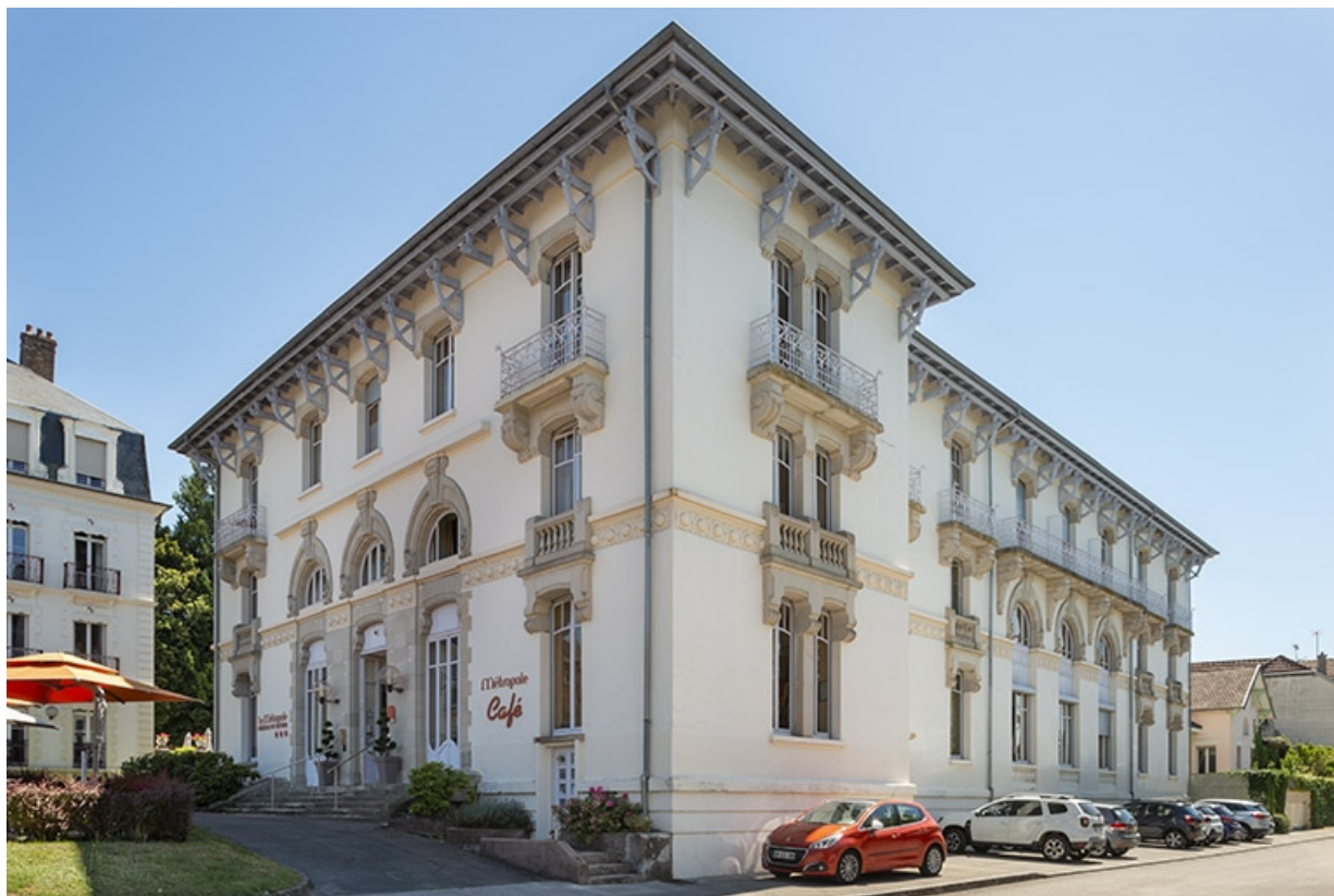
Façade nord, vue de trois quarts.

70, Luxeuil-les-Bains, 4B rue des Thermes