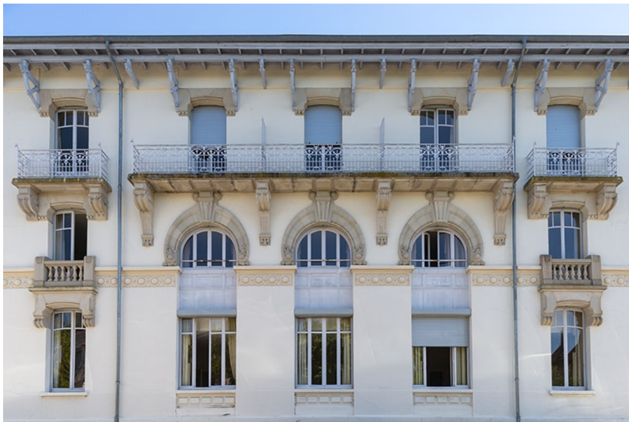
Façade ouest, vue de face, détail.

70, Luxeuil-les-Bains, 4B rue des Thermes