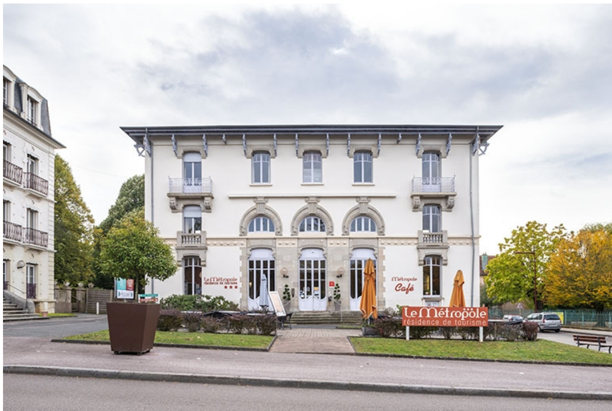
Façade nord, vue de face.

70, Luxeuil-les-Bains, 4B rue des Thermes