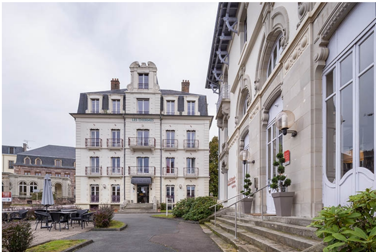
Situation de l'hôtel, à proximité immédiate de l'hôtel des Thermes.

70, Luxeuil-les-Bains, 4B rue des Thermes