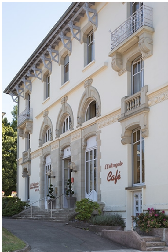
Façade nord, vue de trois quarts, détail. 70, Luxeuil-les-Bains, 4B rue des Thermes