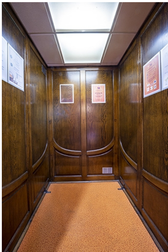
Cabine de l'ascenseur, vue intérieure.

70, Luxeuil-les-Bains, 4B rue des Thermes