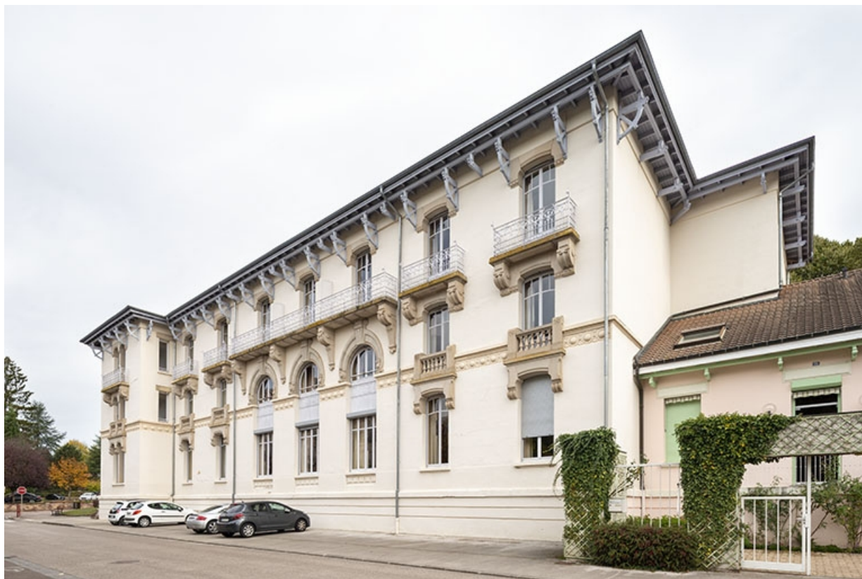
Façade ouest, vue de trois quarts depuis le sud-ouest.

70, Luxeuil-les-Bains, 4B rue des Thermes