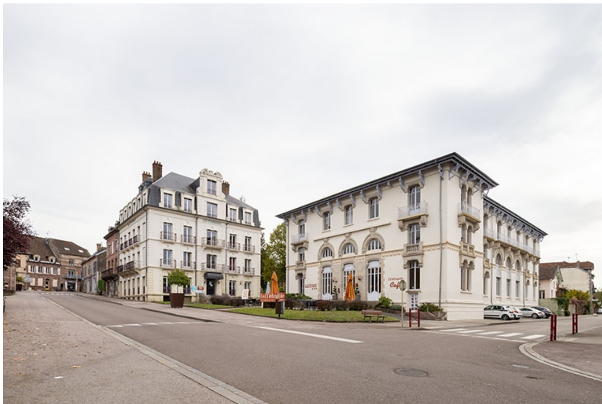
Situation de l'hôtel, au croisement de la rue des Thermes (à gauche) et du boulevard Richet (à droite). 70, Luxeuil-les-Bains, 4 rue des Thermes