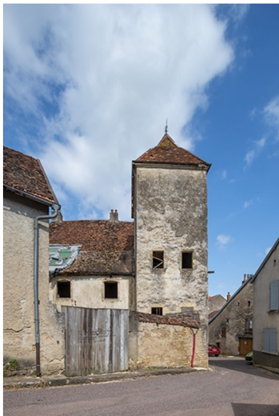
La face sud de la tour.