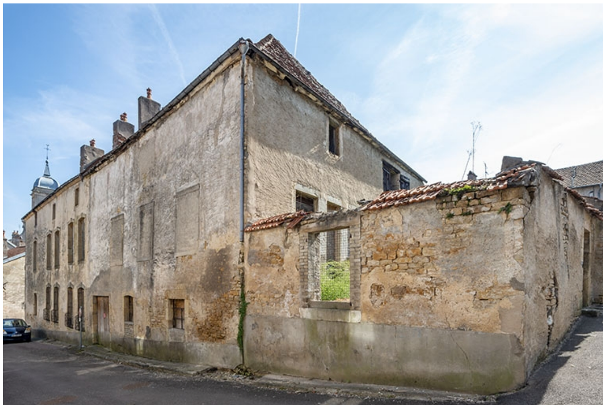
La façade sur la rue du Général-Etienne, de biais.