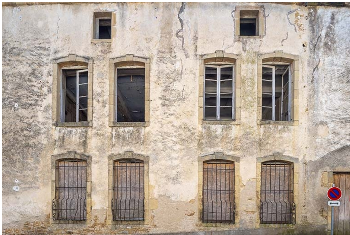
Le corps de logis sur la rue du Général-Etienne.