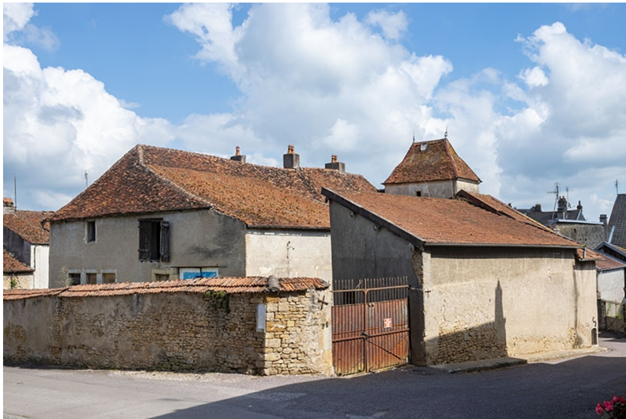
Vue rapprochée de l'angle sud-ouest de la maison, à l'angle des rues Patet-Traverse et Patet-Tournante. 70, Jussey rue Patet Tournante