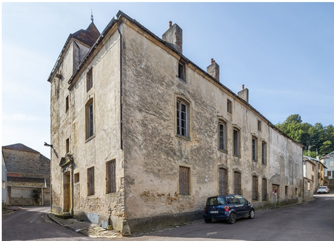
Angle nord-est de la maison. 70, Jussey rue Patet Tournante