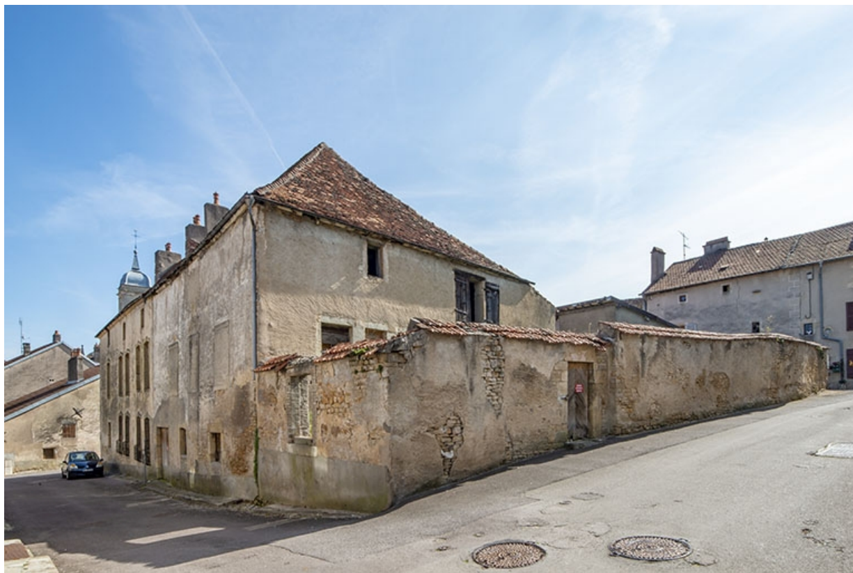
Angle nord-ouest de la maison, à l'angle des rues Patet-Traverse et Général-Etienne. 70, Jussey rue Patet Tournante