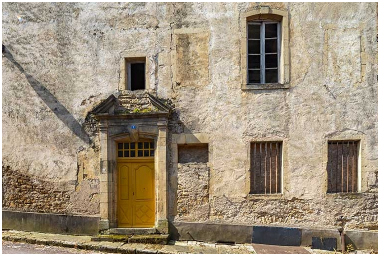
Détail de la façade orientale et de la porte située à la base de la tour. 70, Jussey rue Patet Tournante