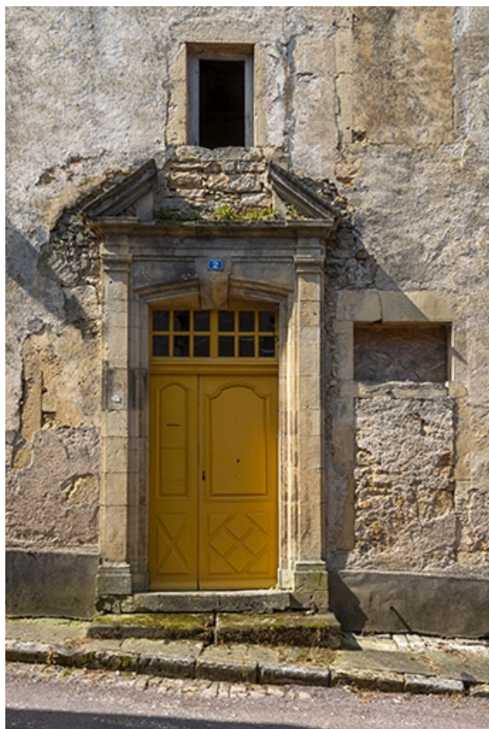
La porte au pied de la tour, rue Patet-Tournante. 70, Jussey rue Patet Tournante