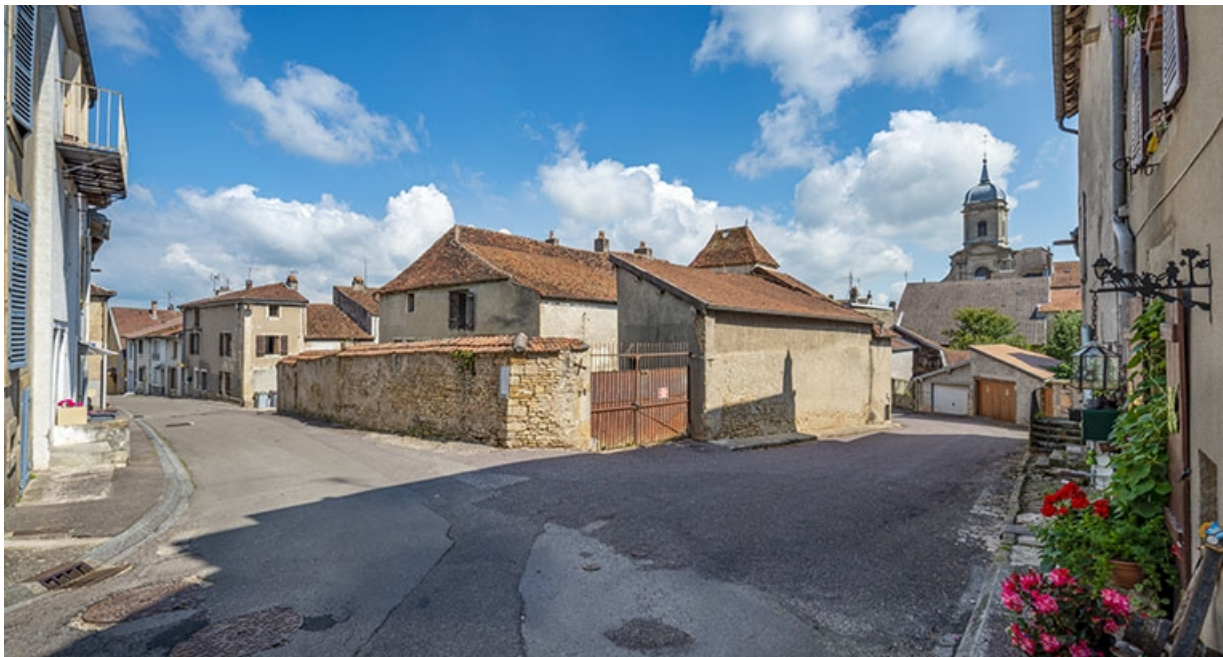
Angle sud-ouest de la maison, à l'angle des rues Patet-Traverse et Patet-Tournante. 70, Jussey rue Patet Tournante