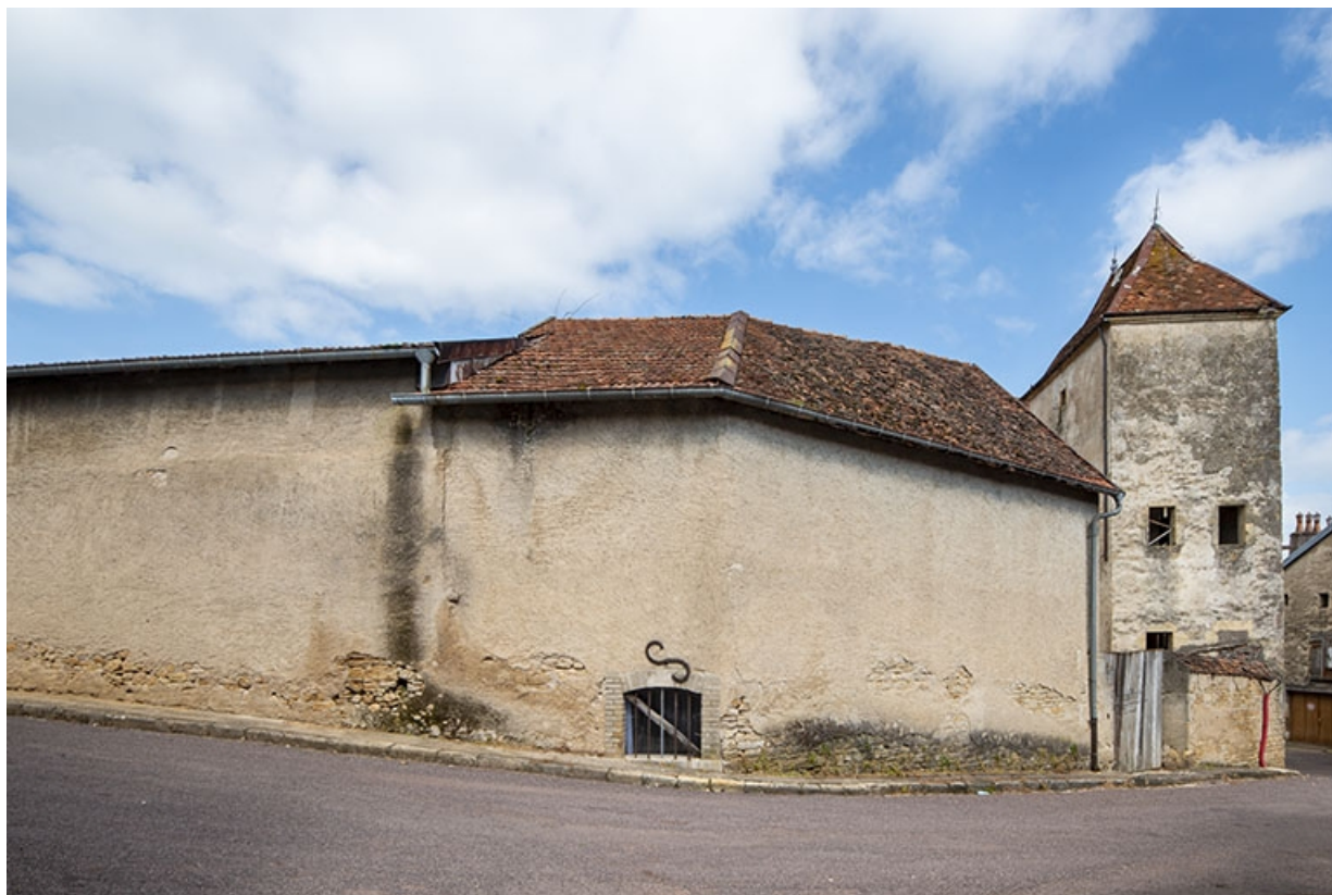
Le mur côté sud et la tour depuis le sud.