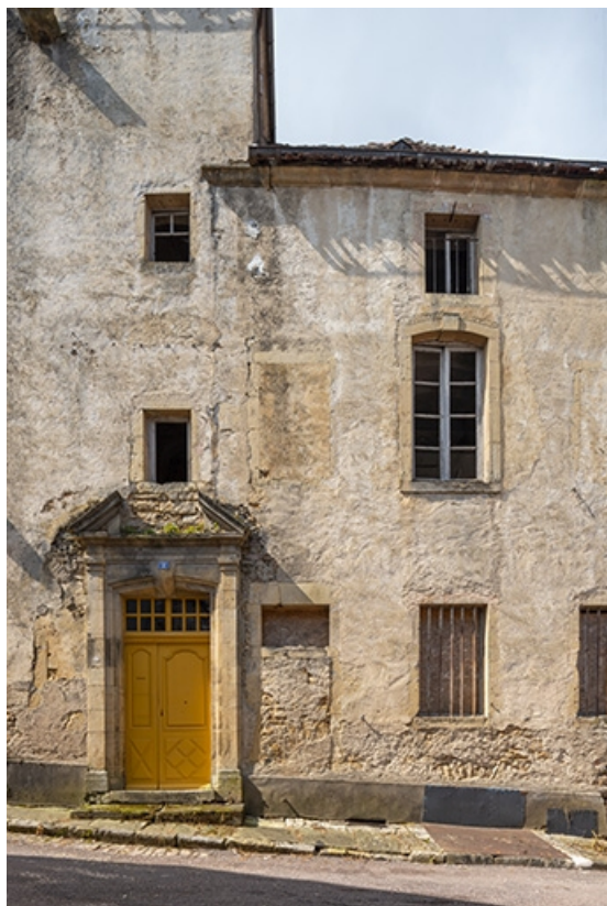
Détail de la façade orientale et de la porte située à la base de la tour. 70, Jussey rue Patet Tournante