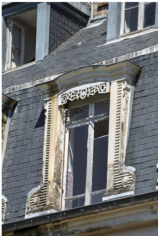
Façade sud, lucarne.

70, Luxeuil-les-Bains, 6 rue des Thermes