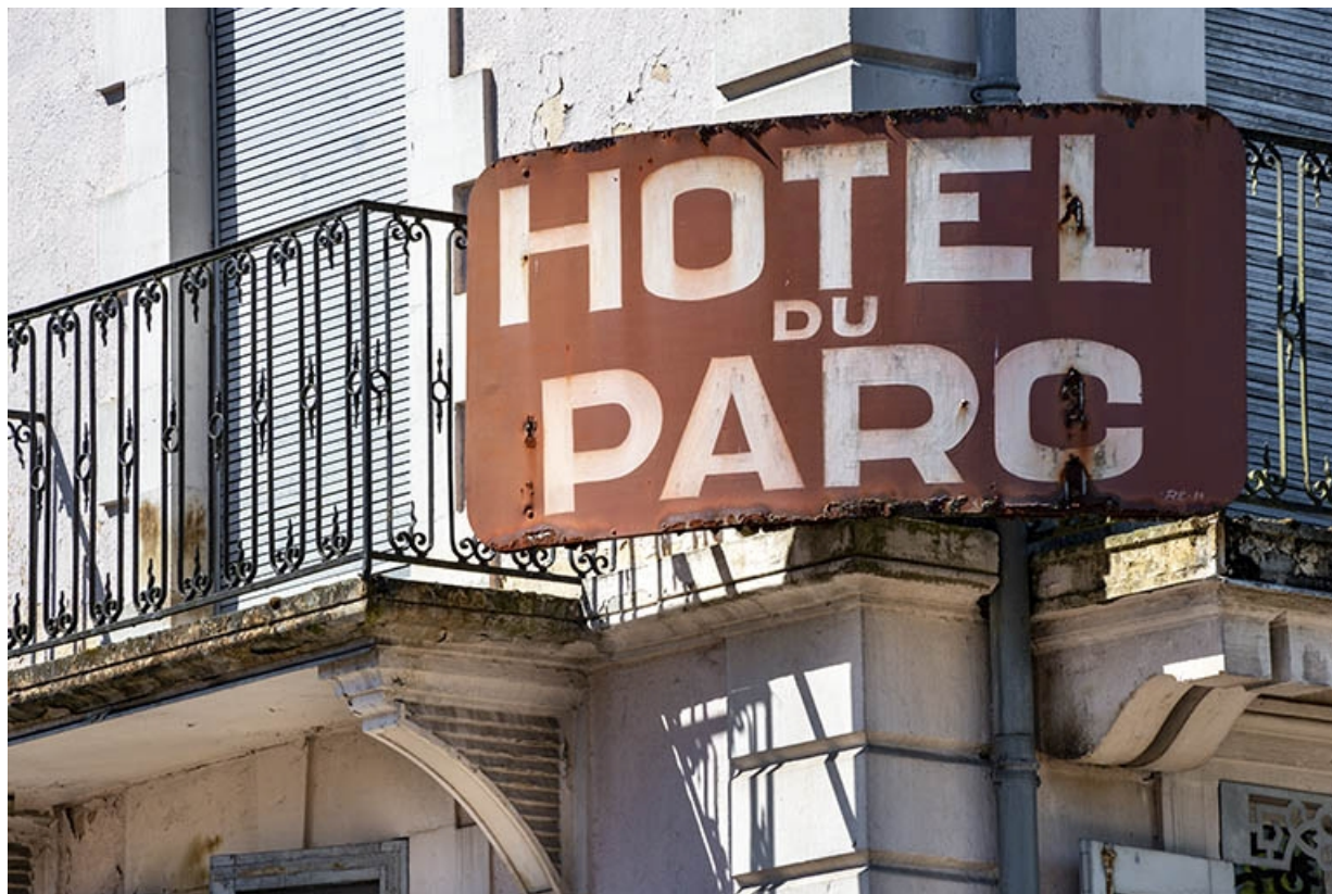
Enseigne : HOTEL DU PARC.

70, Luxeuil-les-Bains, 6 rue des Thermes