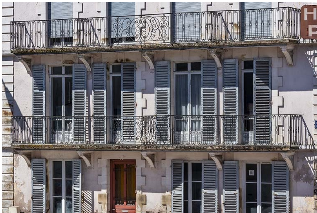
Façade est, balcons.

70, Luxeuil-les-Bains, 6 rue des Thermes