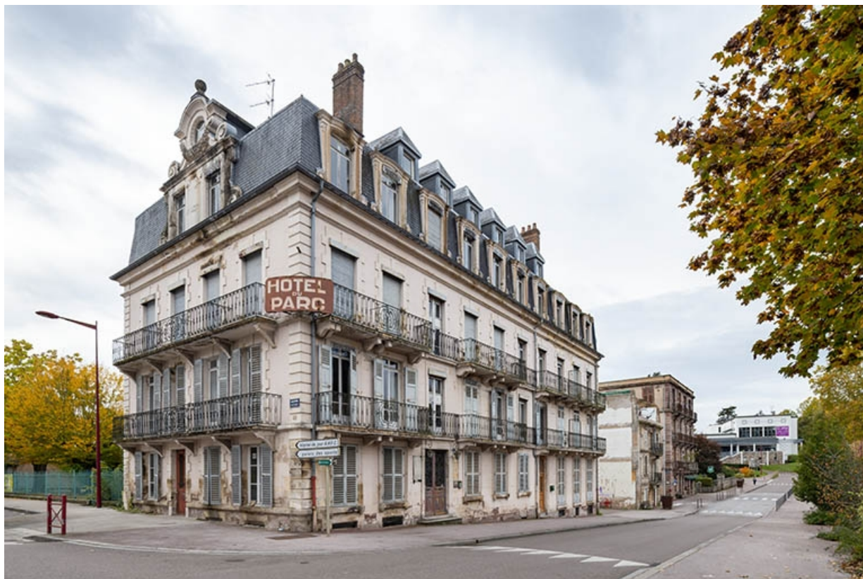
Façade nord et façade est, vue depuis l'angle du boulevard Richet (à gauche) et de la rue des Thermes (à droite). 70, Luxeuil-les-Bains, 6 rue des Thermes