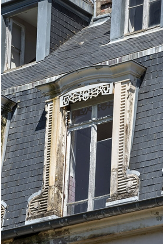
Façade sud, lucarne.

70, Luxeuil-les-Bains, 6 rue des Thermes