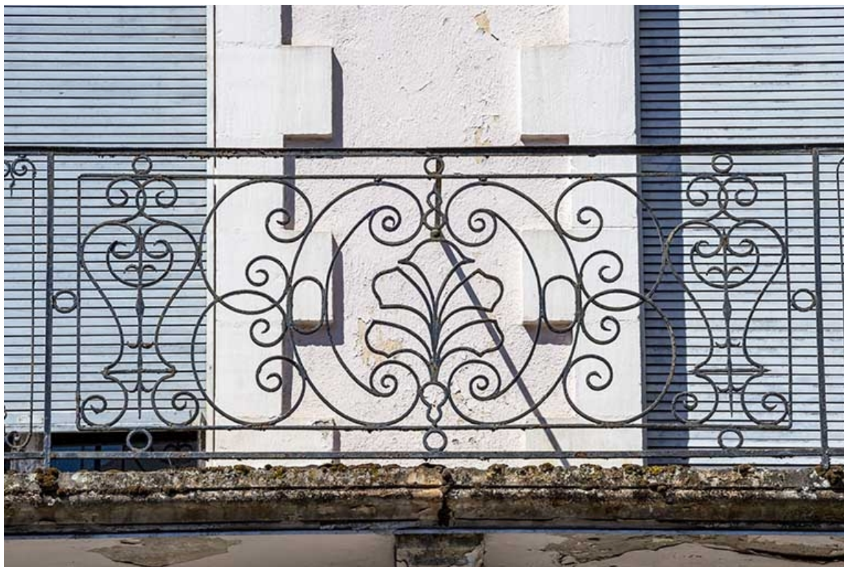
Façade est, garde-corps de balcon en fer forgé. 70, Luxeuil-les-Bains, 6 rue des Thermes