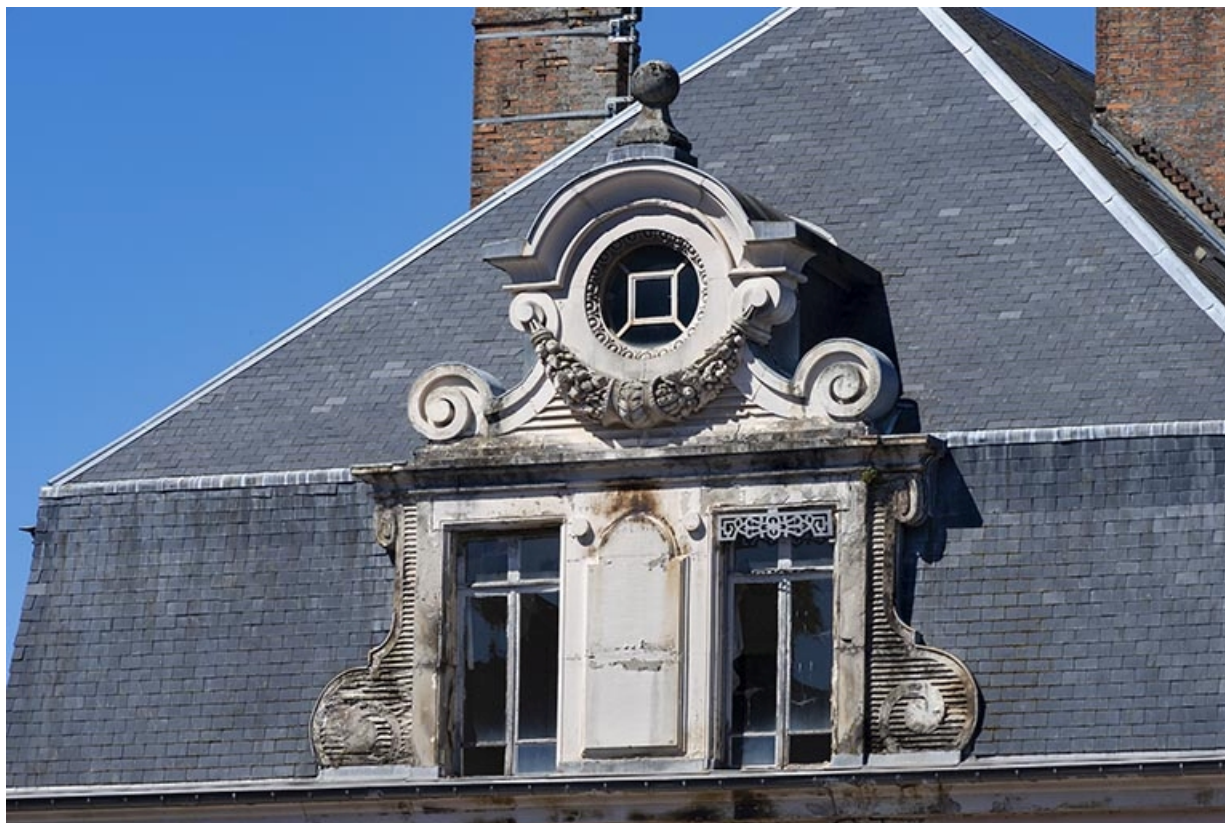
Façade est, détail de la grande lucarne, vue de trois quarts.

70, Luxeuil-les-Bains, 6 rue des Thermes