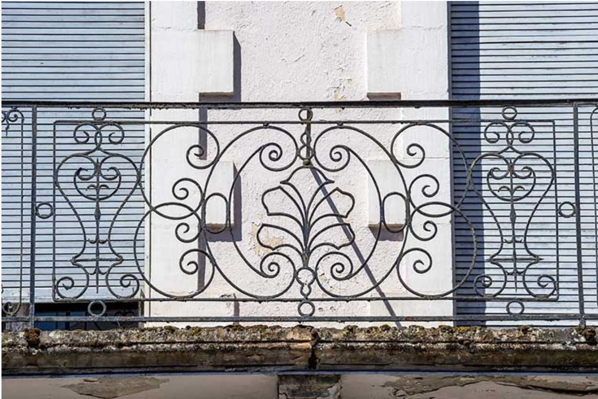
Façade est, garde-corps de balcon en fer forgé.

70, Luxeuil-les-Bains, 6 rue des Thermes