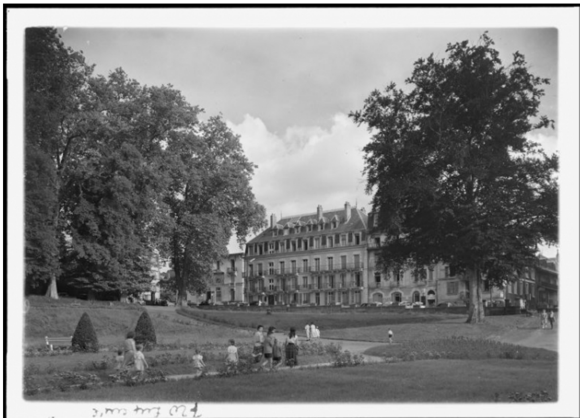
Façade sur la rue des Thermes, vue prise depuis le parc thermal. 70, Luxeuil-les-Bains, 6 rue des Thermes