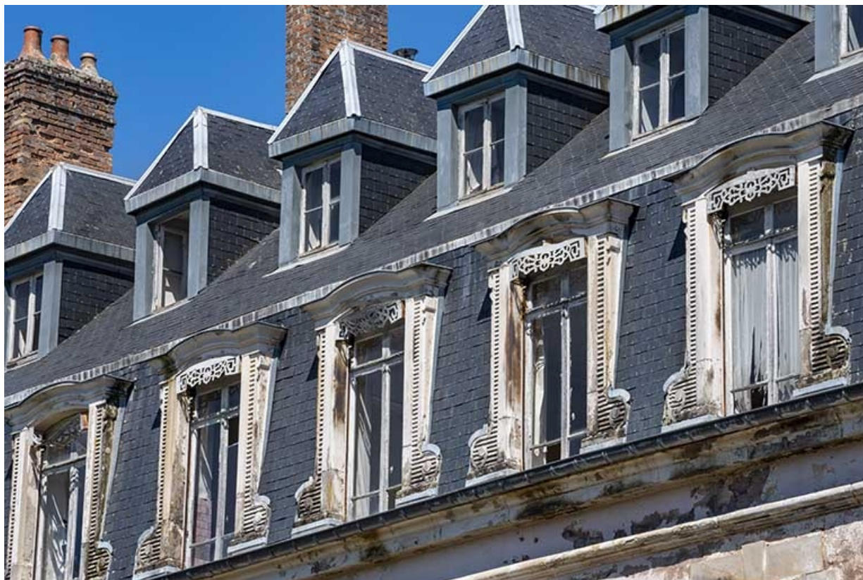
Façade sud, lucarnes.

70, Luxeuil-les-Bains, 6 rue des Thermes