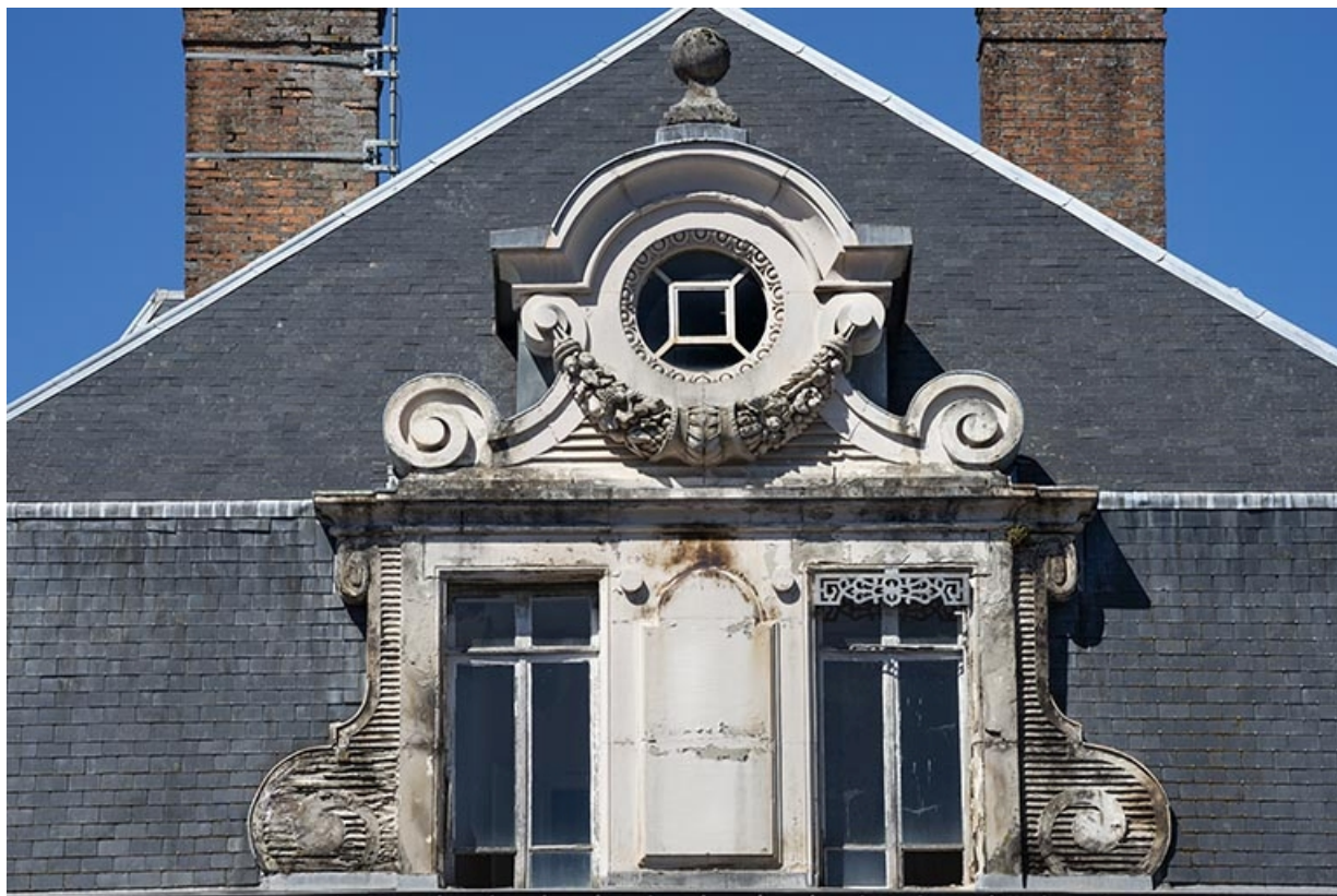
Façade est, détail de la grande lucarne, vue de face.

70, Luxeuil-les-Bains, 6 rue des Thermes