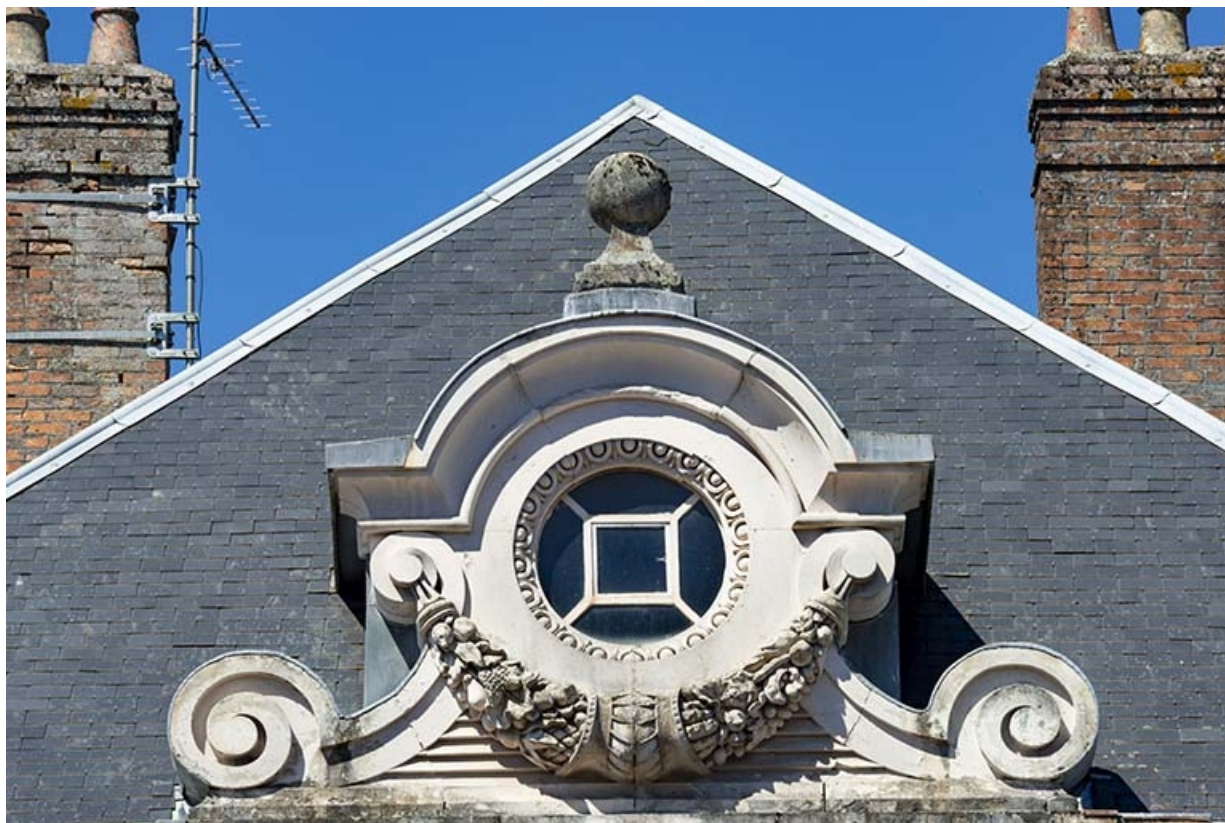
Façade est, détail de la grande lucarne, oculus sommital.

70, Luxeuil-les-Bains, 6 rue des Thermes