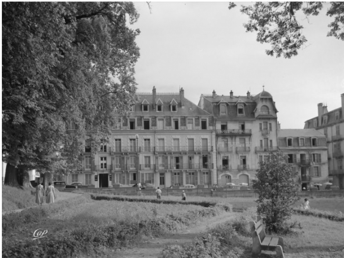
Façade nord, vue depuis le parc thermal au-delà de la rue des Thermes.

70, Luxeuil-les-Bains, 6 rue des Thermes