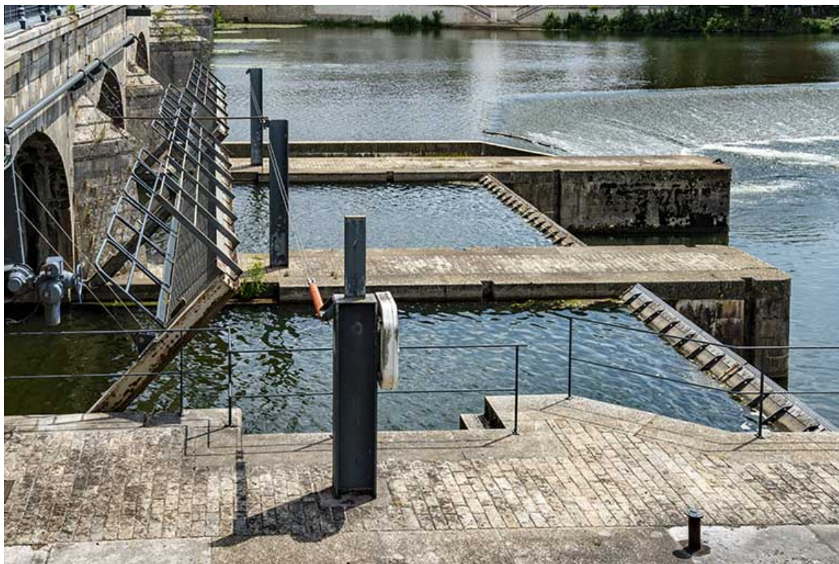
La partie mobile du barrage de Gray. 70, Gray