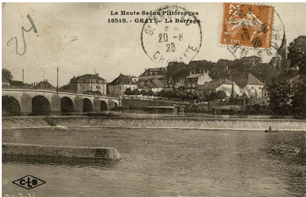
Le barrage, carte postale.