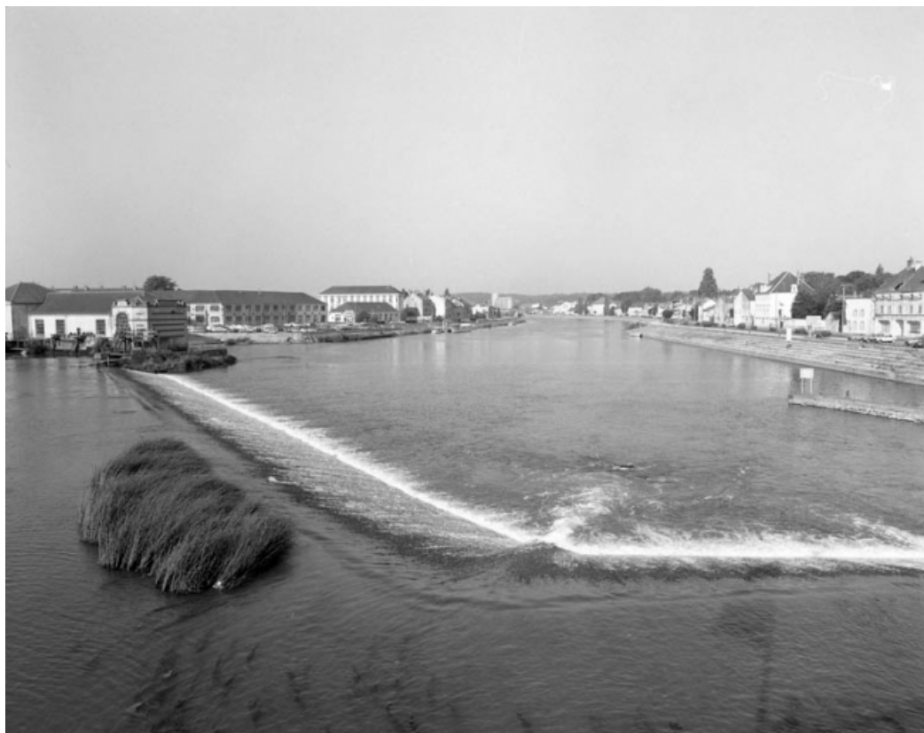
Les quais Mavia et Villeneuve depuis le barrage. 70, Gray