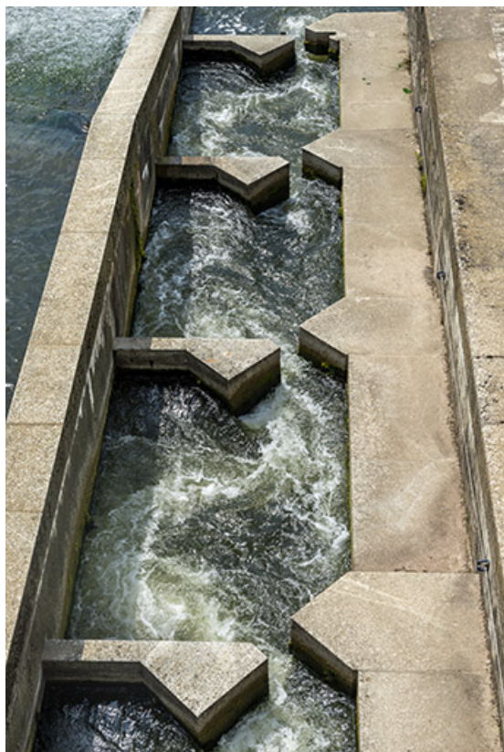
La passe à poisson.