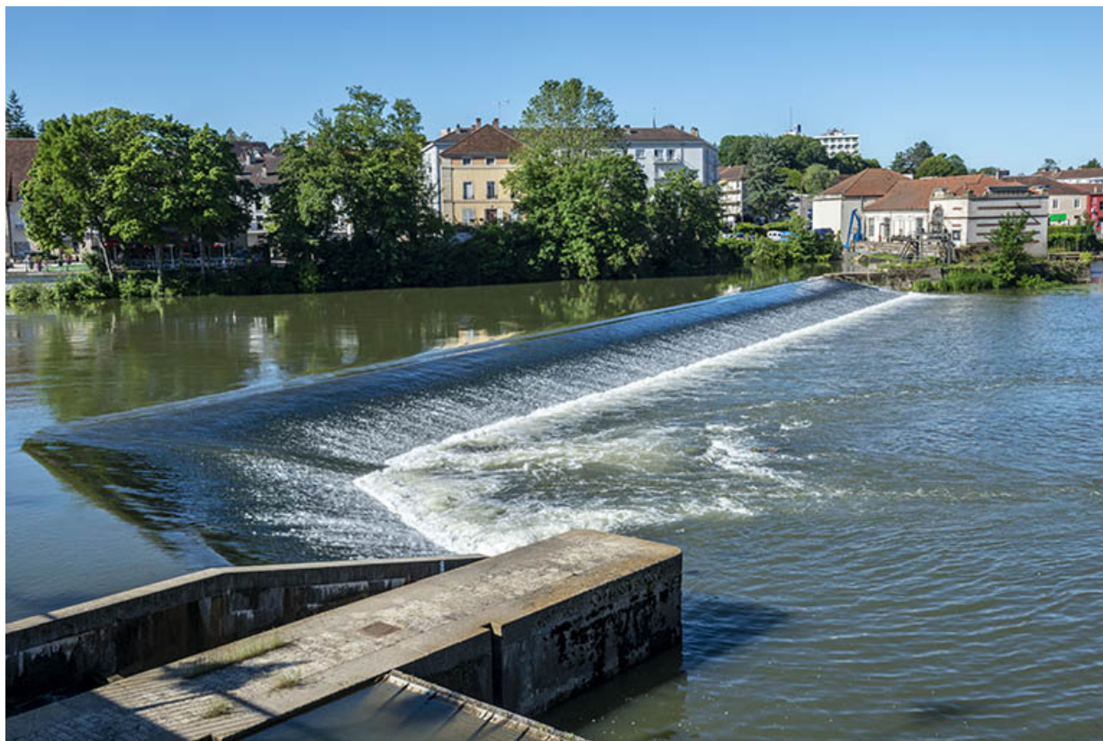
Le déversoir en aval du pont de Gray.