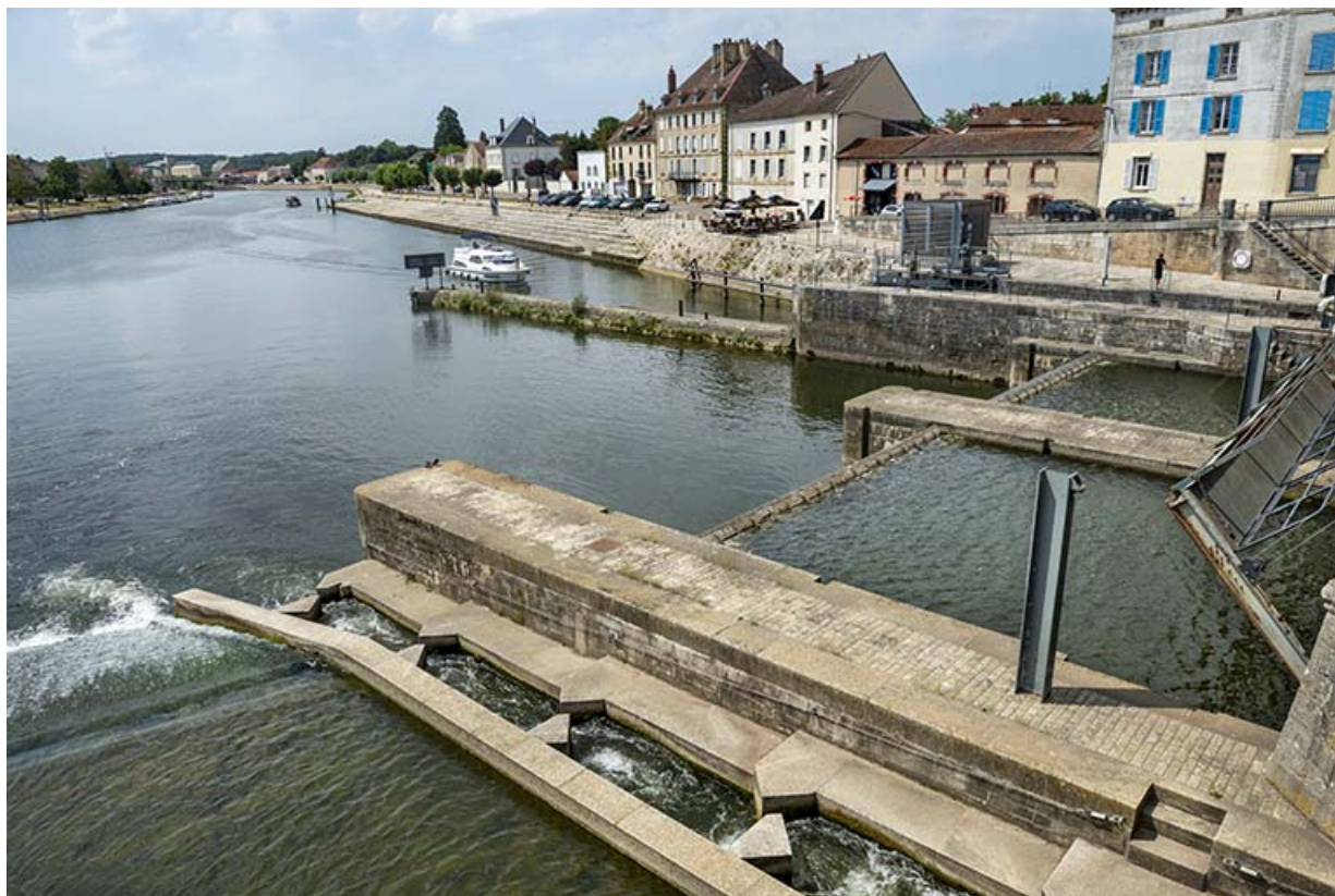
Vue d'ensemble du site.