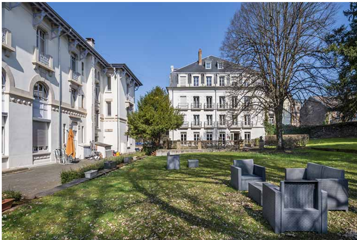
Hôtel Métropole (à gauche) et Hôtel des Thermes (à droite). 70, Luxeuil-les-Bains