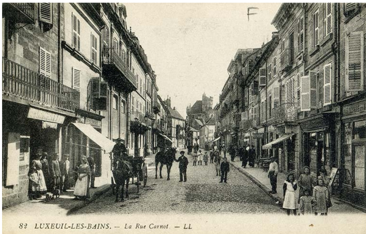
Rue Carnot, vue en direction du sud.