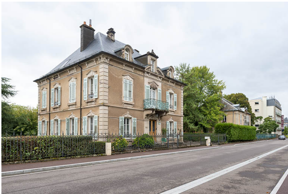
Rue de Grammont avec la Villa des Platanes. 70, Luxeuil-les-Bains