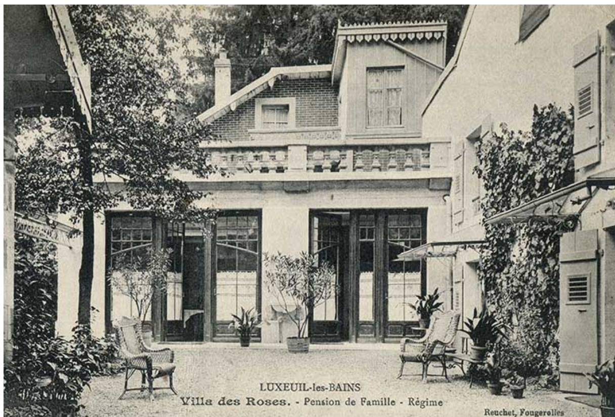
Un exemple d'hébergement modeste : la Villa des Roses.