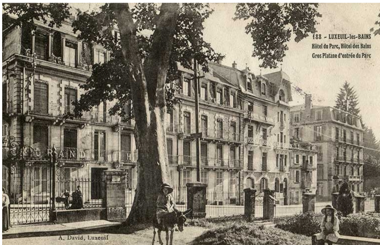
Rue des Thermes, façades de l'Hôtel du Parc et de l'Hôtel des Bains. 70, Luxeuil-les-Bains