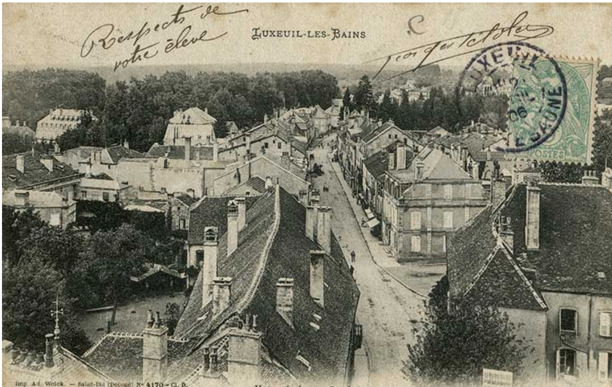
Rue Carnot, vue en direction du nord.