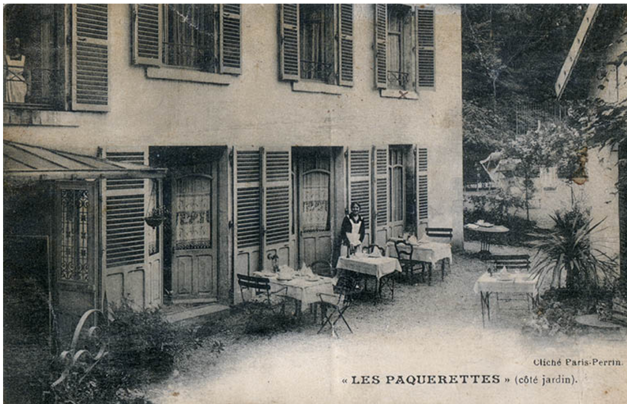
Un exemple d'hébergement modeste : la Villa des Pâquerettes.