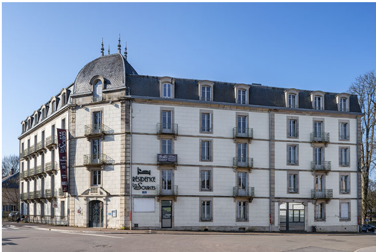
Hôtel des Sources. 70, Luxeuil-les-Bains