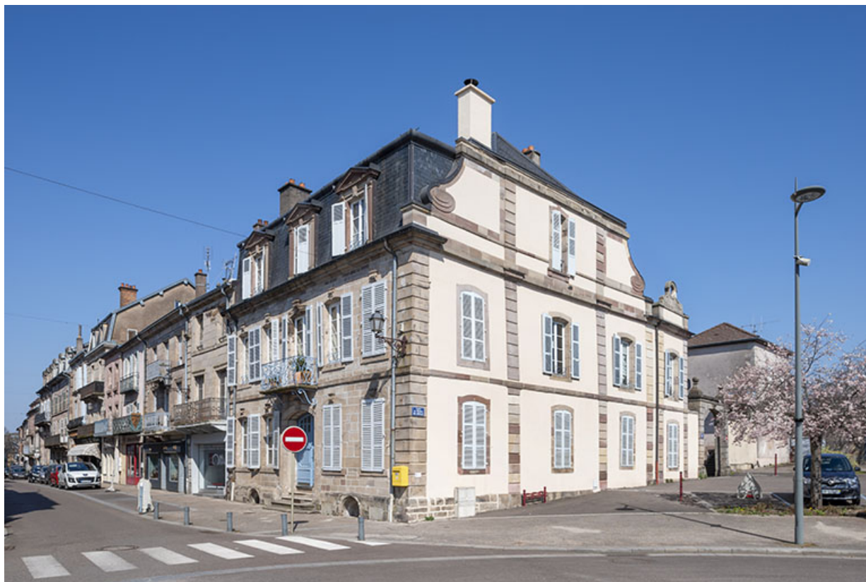
Rue Carnot avec la Maison Nicot.