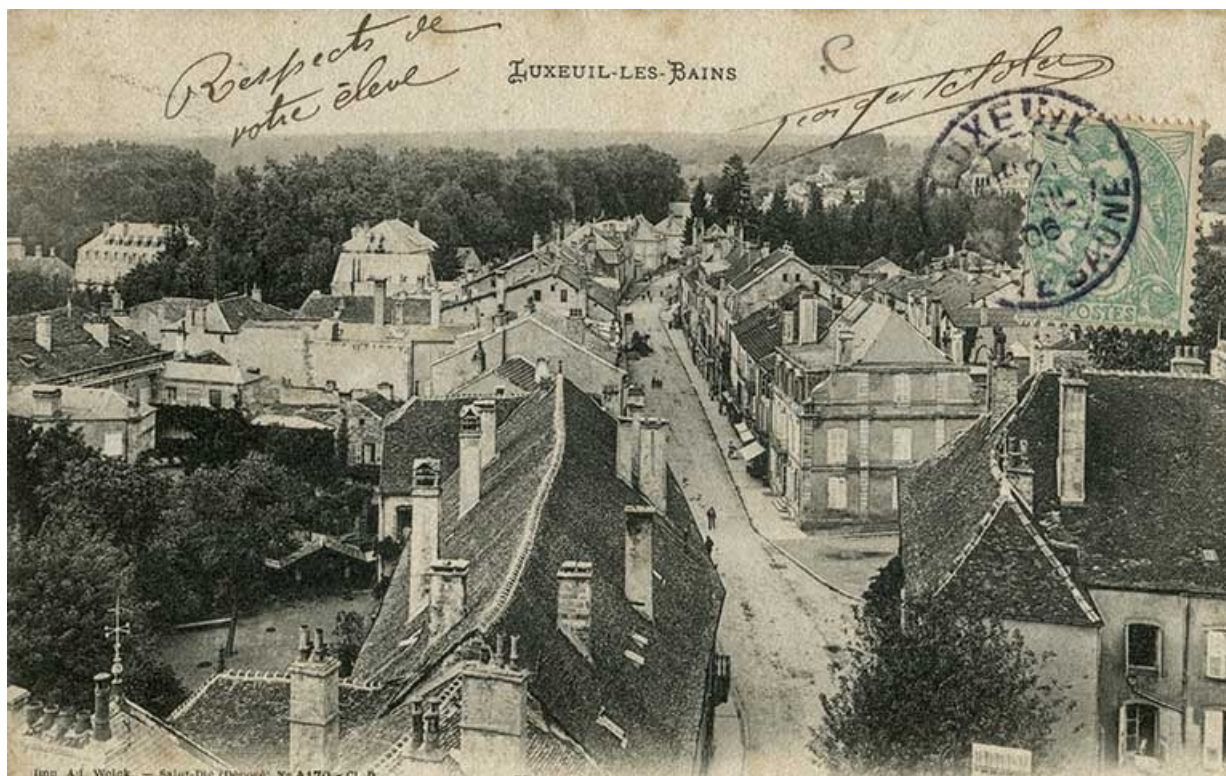
Rue Carnot, vue en direction du nord.