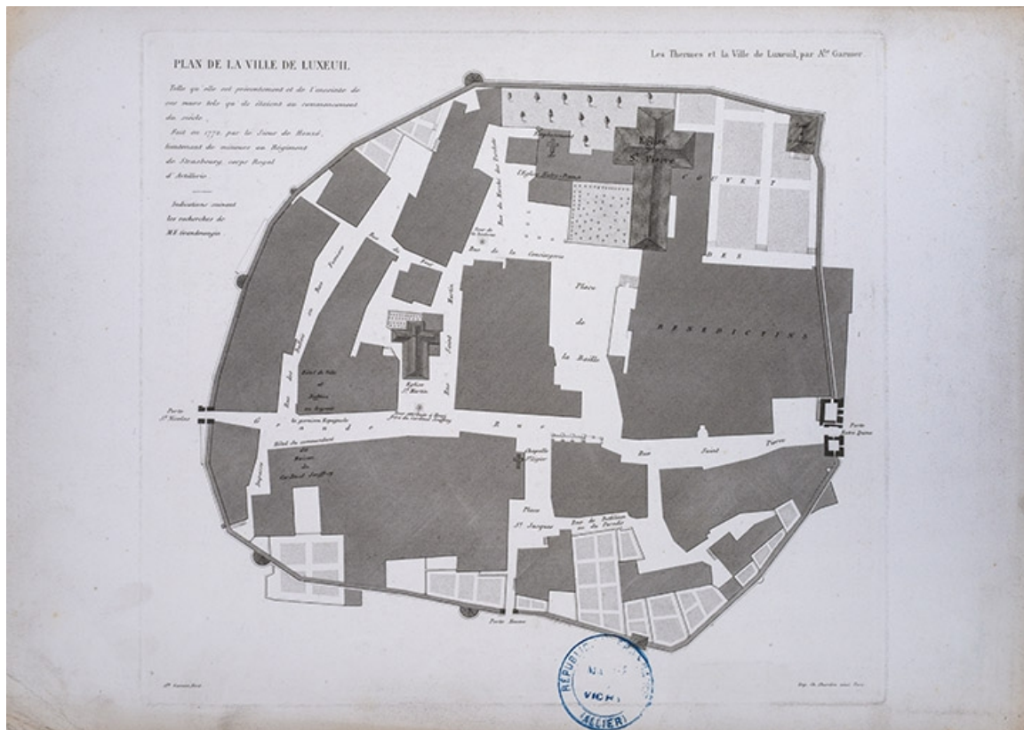
Plan du centre ancien en 1866. 70, Luxeuil-les-Bains