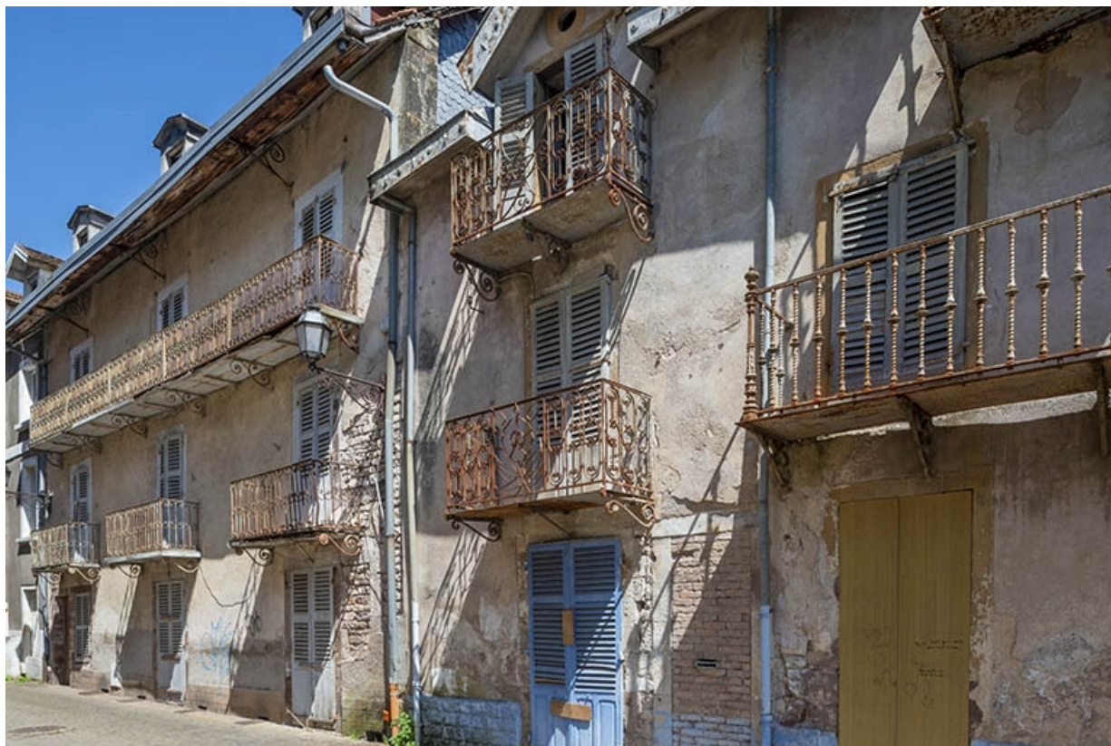
Balcons de la rue de la Fosse Pageot (actuelle allée des Romains). 70, Luxeuil-les-Bains