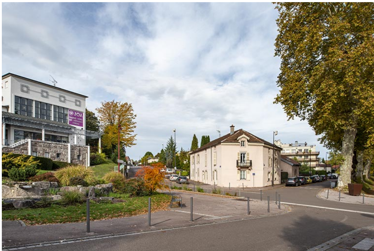
Croisement de l'avenue des Thermes et de la rue Georges Clemenceau. 70, Luxeuil-les-Bains