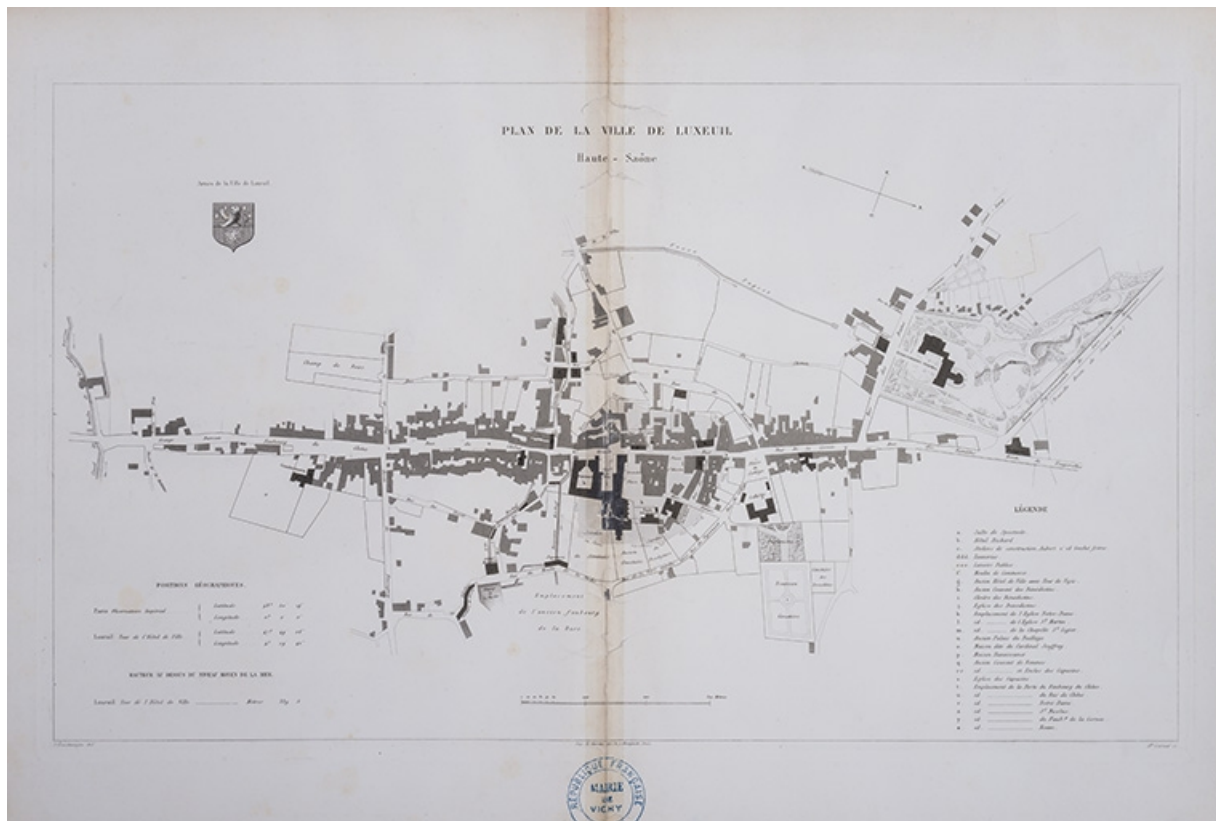
Plan d'ensemble de la commune en 1866. 70, Luxeuil-les-Bains