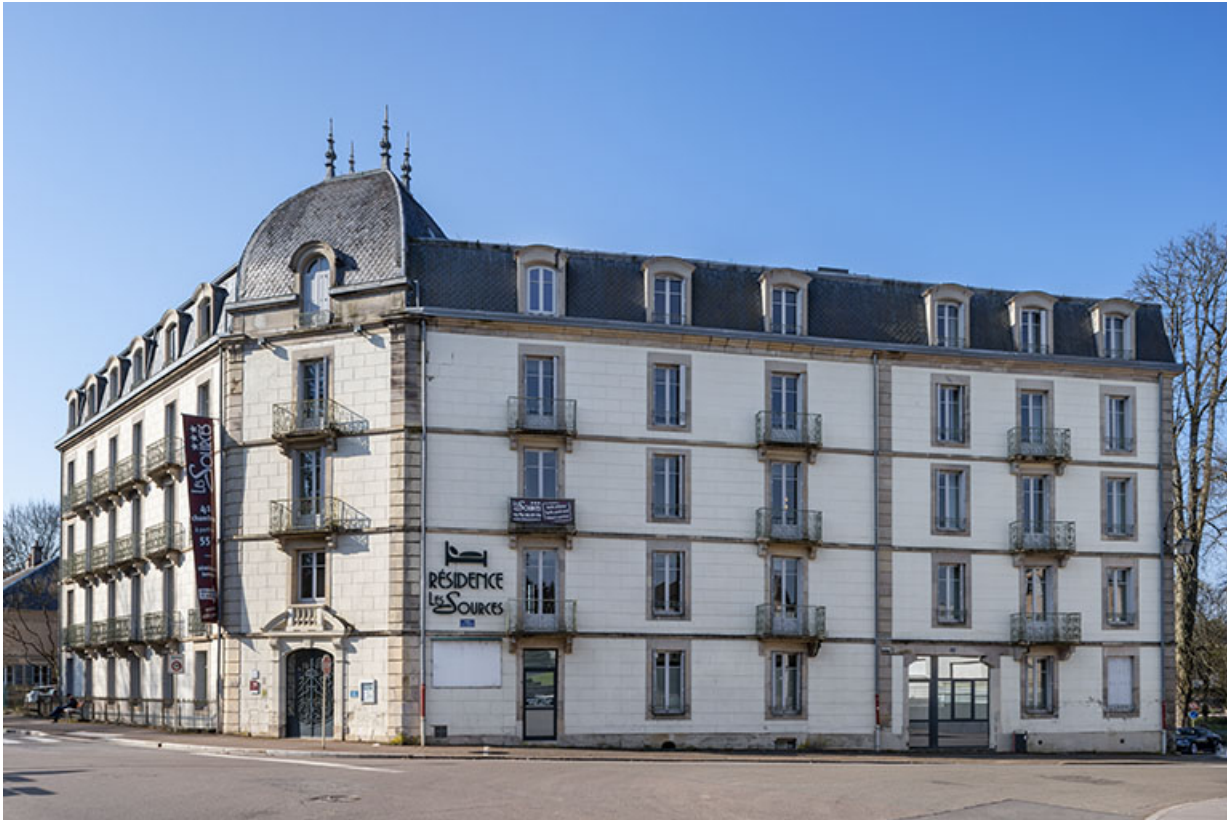
Hôtel des Sources.