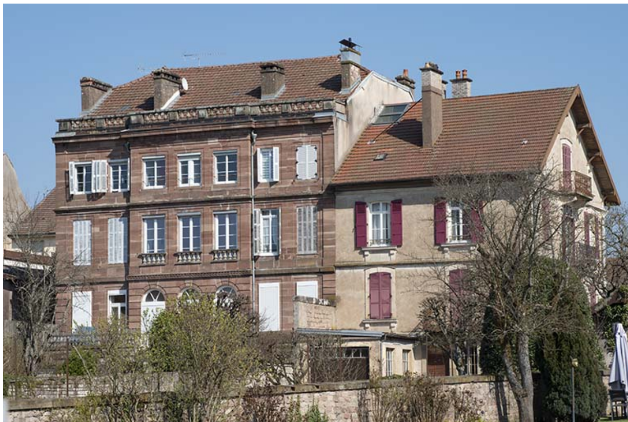
Maison Ganeval puis hôtel de La Terrasse (à gauche) et Villa Élisabeth (à droite). 70, Luxeuil-les-Bains