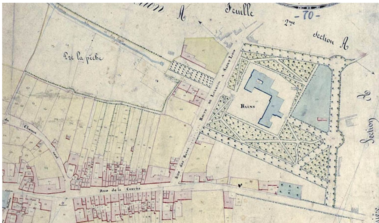
Plan des abords de l'établissement thermal en 1827.