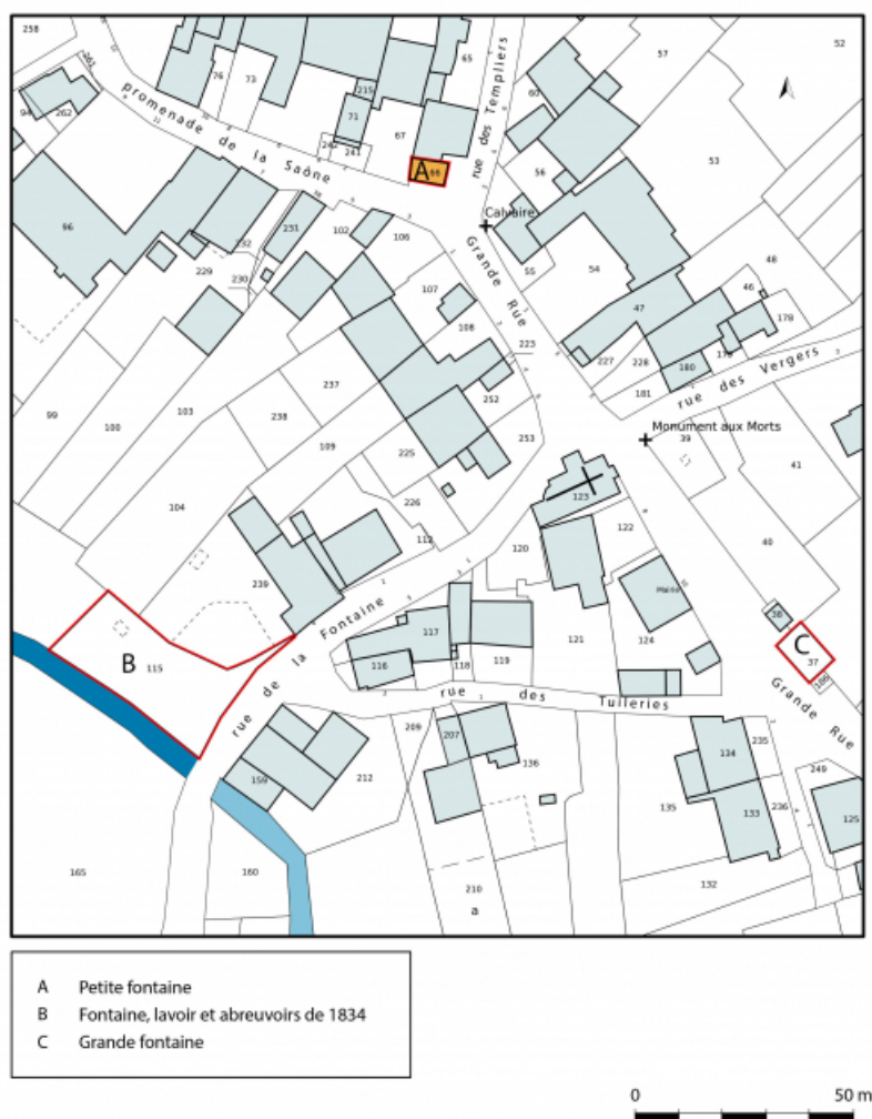
Plan de situation, extrait du plan cadastral numérisé, section AB, échelle 1/1000. 70, Soing-Cubry-Charentenay