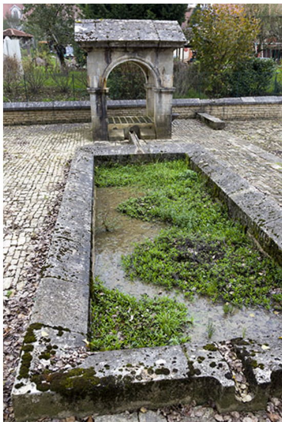
Lavoir et gorge servant à l'écoulement de l'eau. 70, Soing-Cubry-Charentenay, 4 rue de la Fontaine