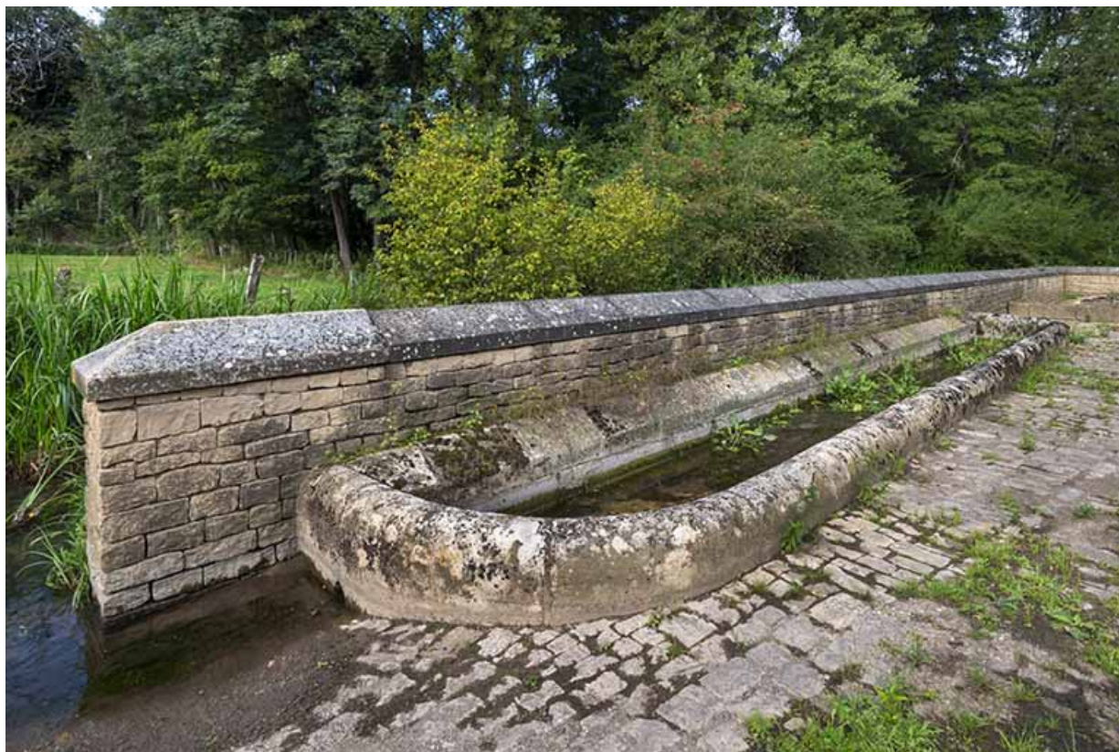
Abreuvoir adossé au mur nord de la place.

70, Soing-Cubry-Charentenay, 4 rue de la Fontaine