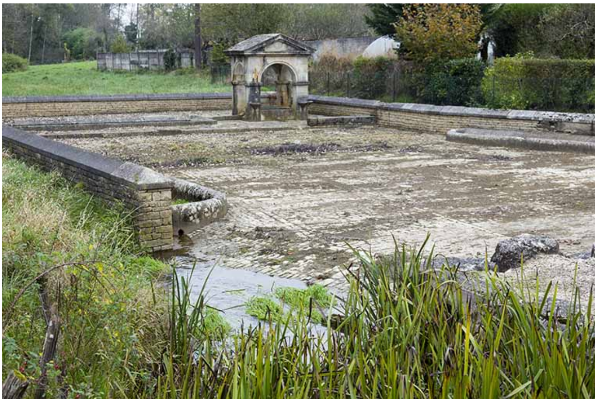
Place de la fontaine vue depuis le pont.

70, Soing-Cubry-Charentenay, 4 rue de la Fontaine