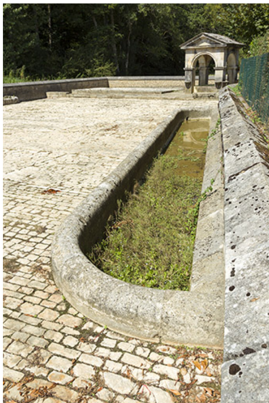
Abreuvoir adossé au mur sud de la place.

70, Soing-Cubry-Charentenay, 4 rue de la Fontaine