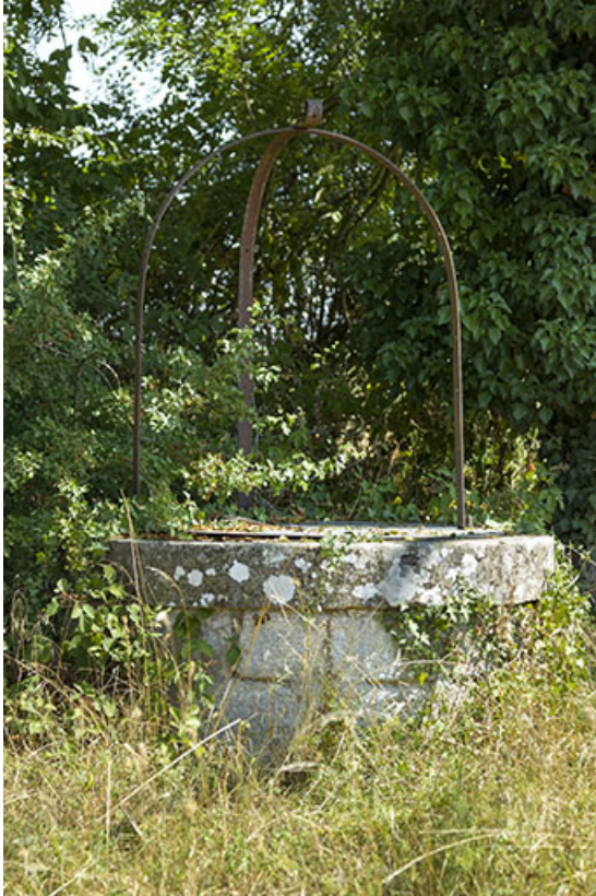
Puits dépendant du site d'écluse.

70, Beaujeu-Saint-Vallier-Pierrefix-et-Quitteur