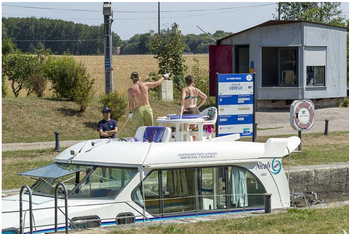
Bateau de plaisance entrain de franchir l'écluse.

70, Beaujeu-Saint-Vallier-Pierrejux-et-Quitteur