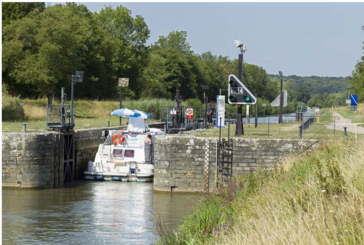
Bateau de plaisance arrivant dans le sas de l'écluse.

70, Beaujeu-Saint-Vallier-Pierrejux-et-Quitteur