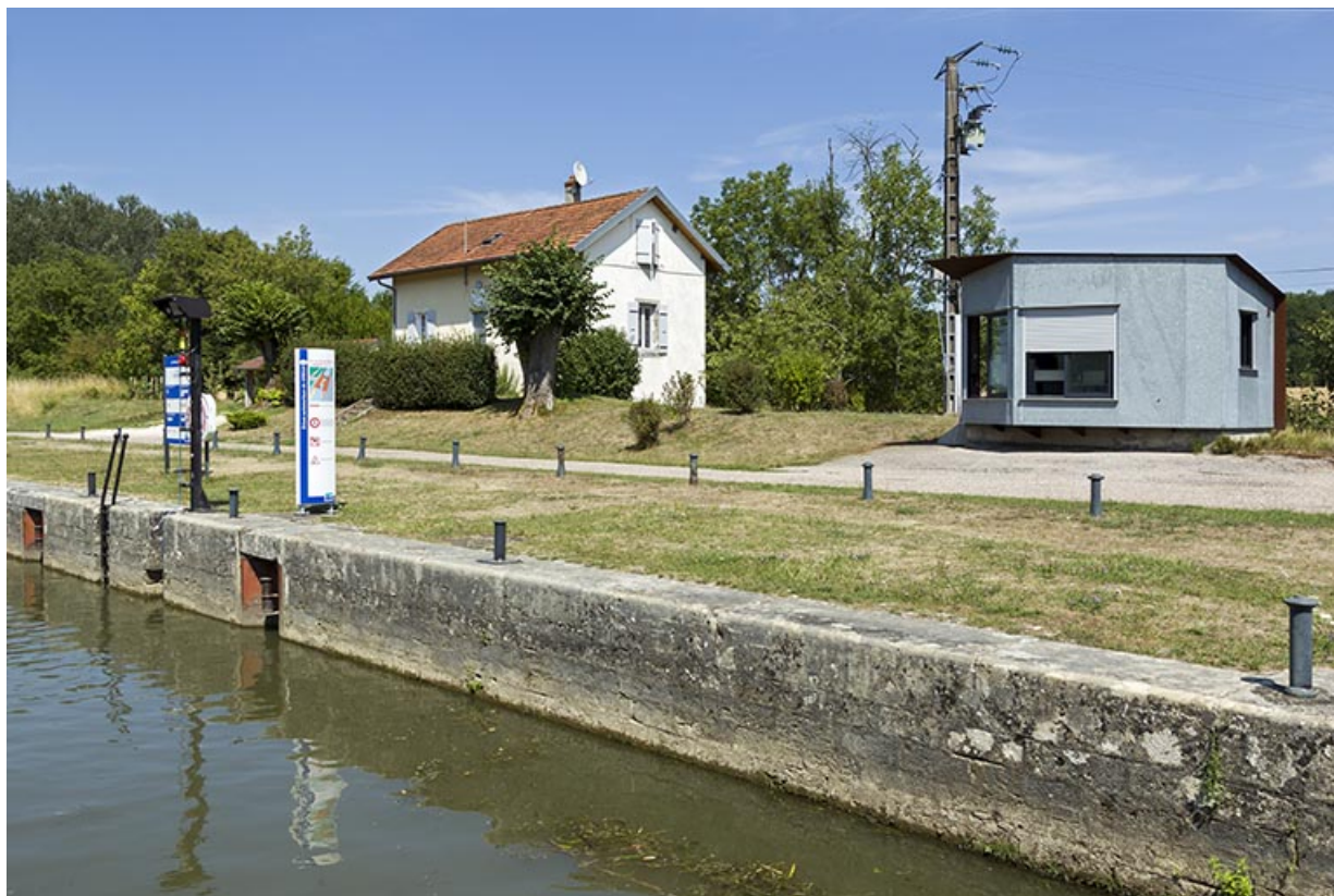
L'écluse, le poste de commande et la maison d'éclusier.