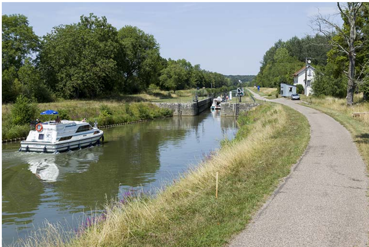
Vue amont du site d'écluse.

70, Beaujeu-Saint-Vallier-Pierrejux-et-Quitteur