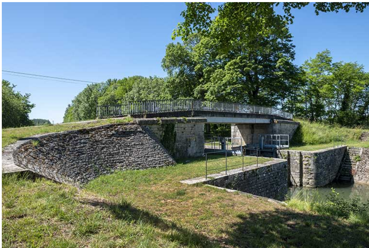
Vue de trois-quarts gauche.