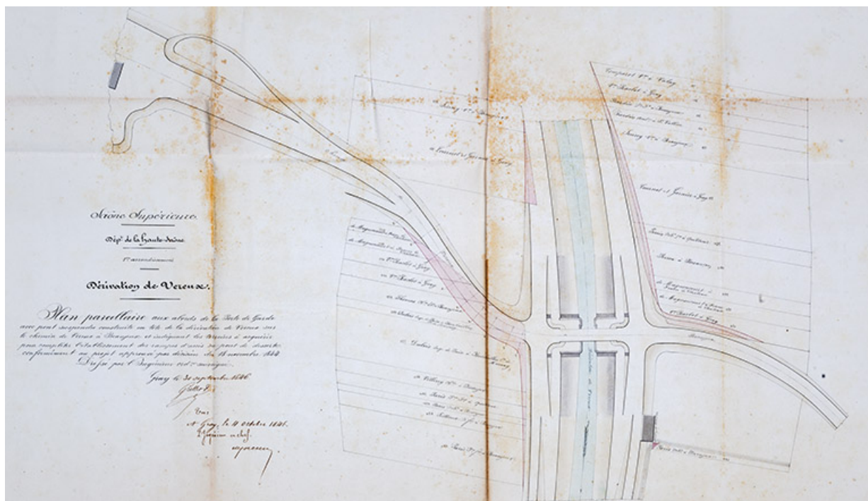
Plan des abords de la porte de garde, 1846.