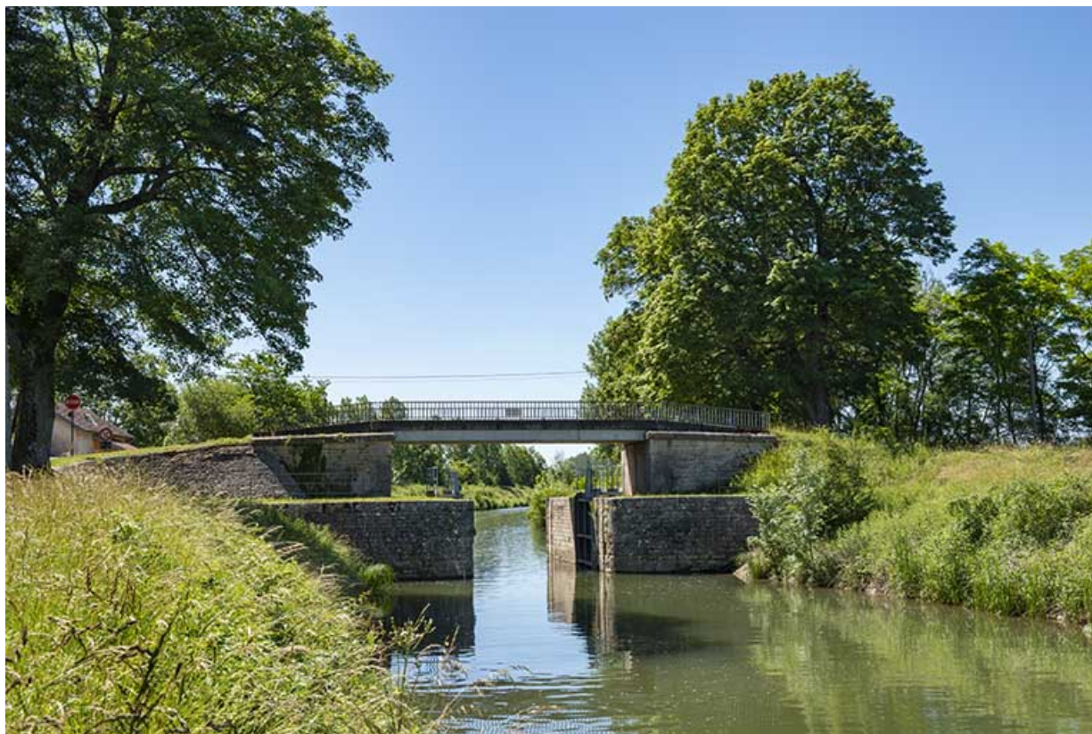
La porte de garde et le canal de navigation. 70, Vereux