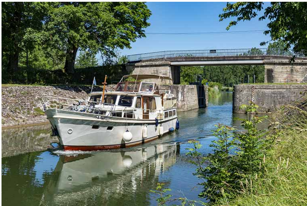
Bateau de plaisance et la porte en arrière-plan.