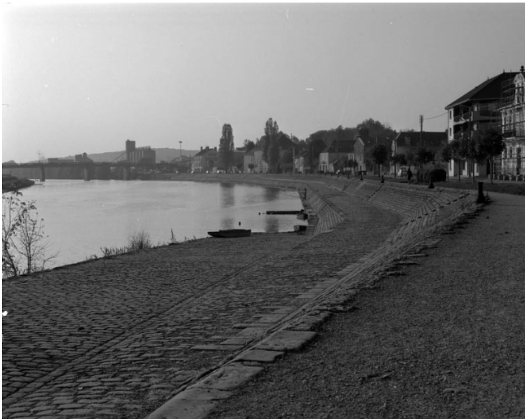
Vue d'ensemble du quai Villeneuve avec les silos en arrière-plan.