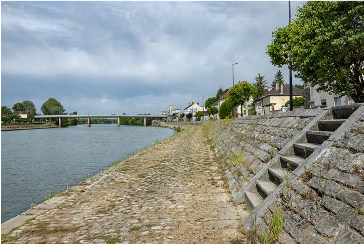
Le chemin de halage.