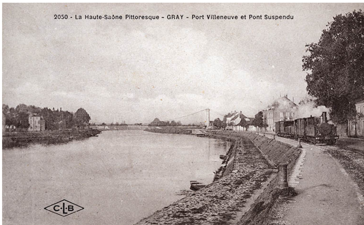
Prolongement du quai Villeneuve, carte postale.