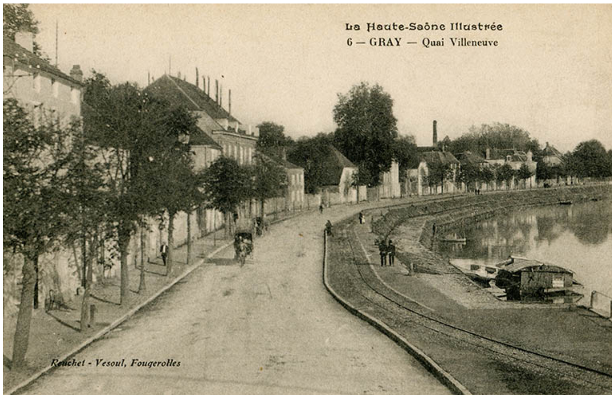
Gray- Quai Villeneuve, carte postale. 70, Gray quai Villeuve

Archives départementales de la Haute-Saône : Gray - Quai Villeneuve. Carte postale (Ed.Reuchet, Vesoul & Fougerolles), s.d. 11Fi279-77.