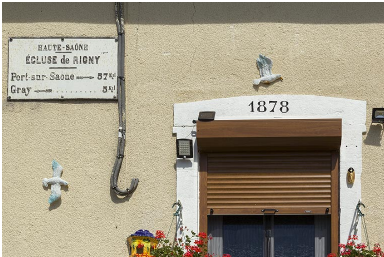
La plaque signalétique de la maison éclusière et la date portée sur le linteau de la porte d'entrée.