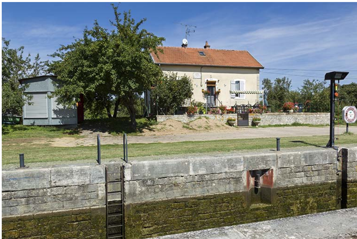
Le sas, la maison et le poste de commande de l'écluse de Rigny.