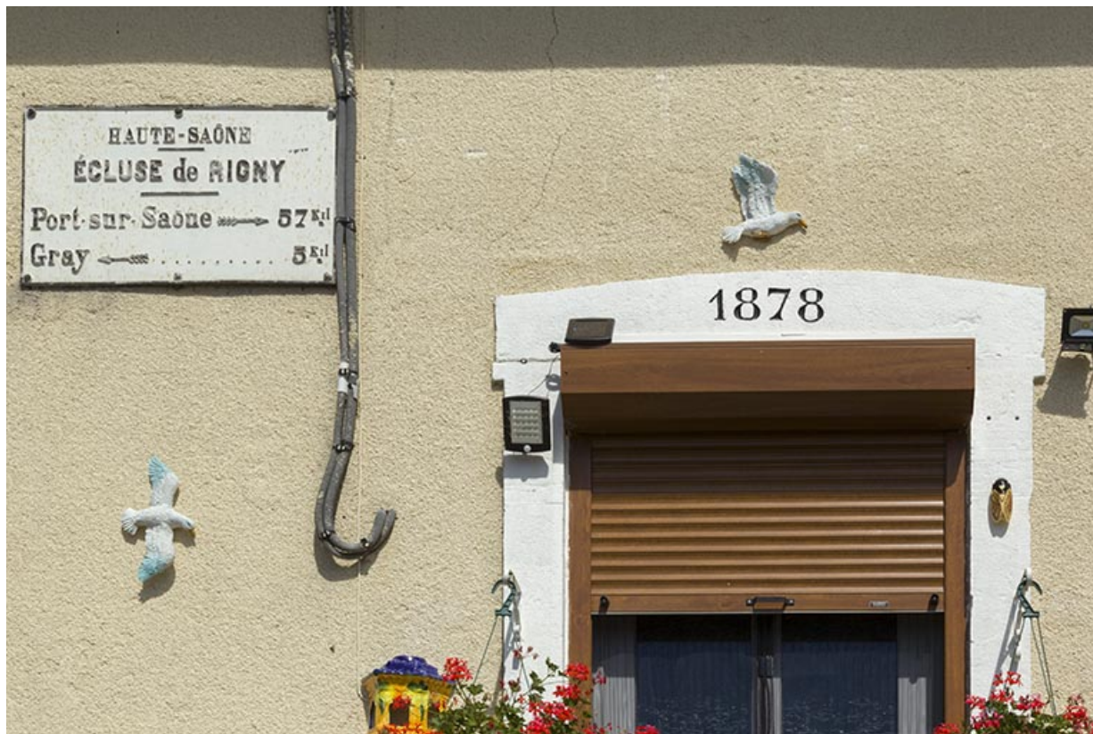
La plaque signalétique de la maison éclusière et la date portée sur le linteau de la porte d'entrée.