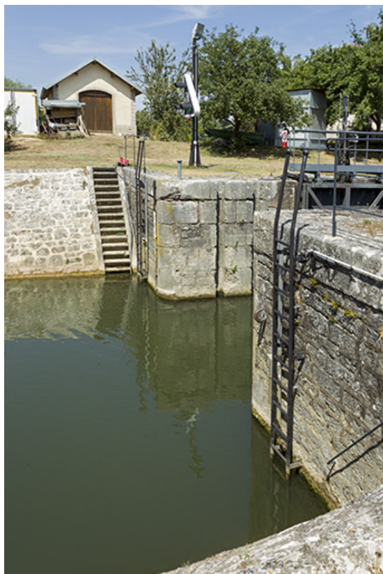
Vue sur la tête de l'écluse.