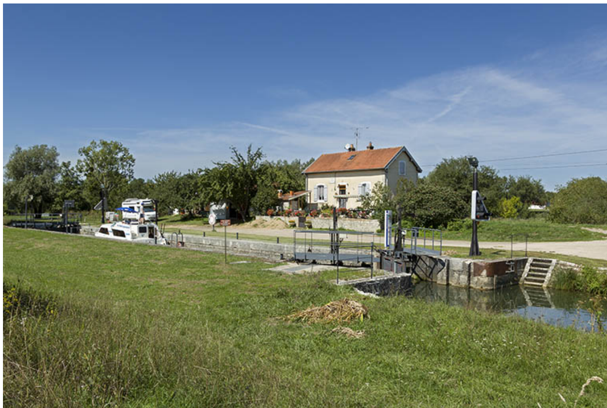
Vue générale du site d'écluse.