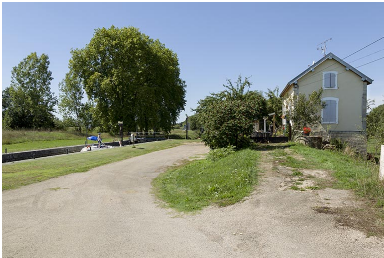
Vue depuis l'amont.