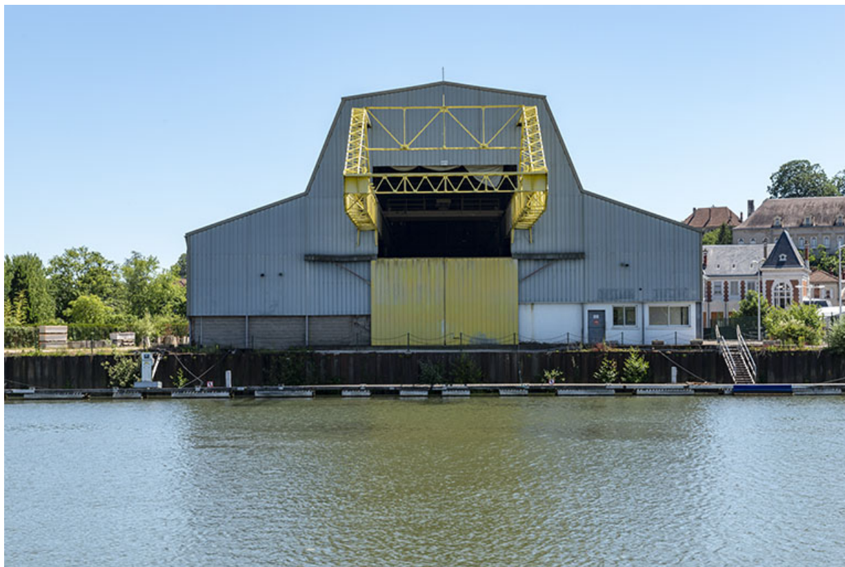
Ancien hangar transformé en société de location de bateaux. 70, Gray