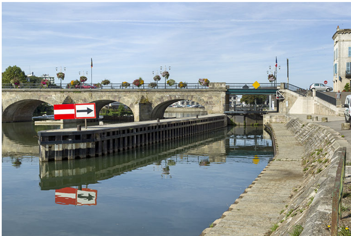
L'écluse, vue depuis l'amont. 70, Gray