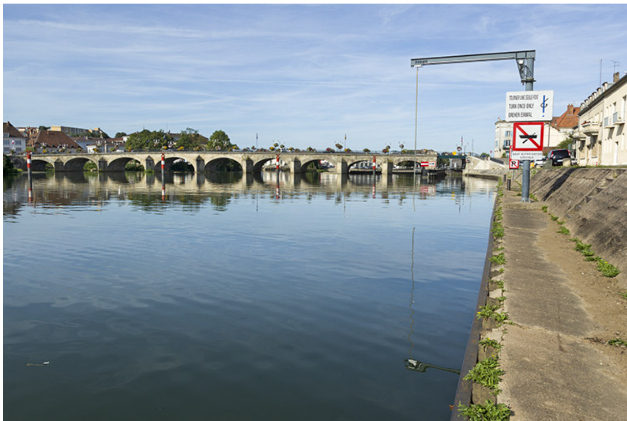
Vue générale du pont et du site d'écluse. 70, Gray