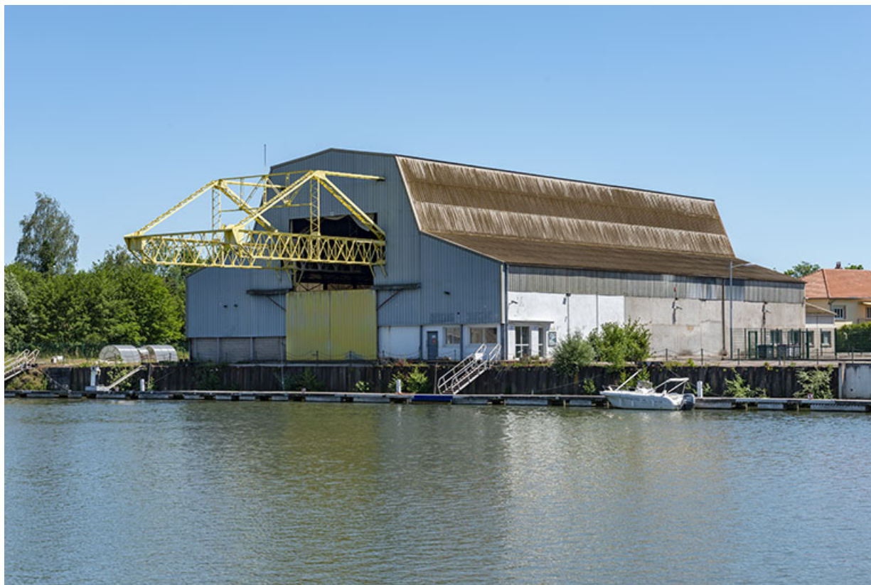
Vue de trois-quart.