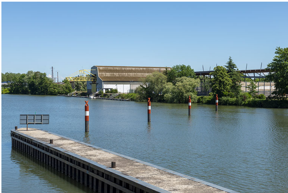
Digue de l'entrée de l'écluse sur la gauche. 70, Gray