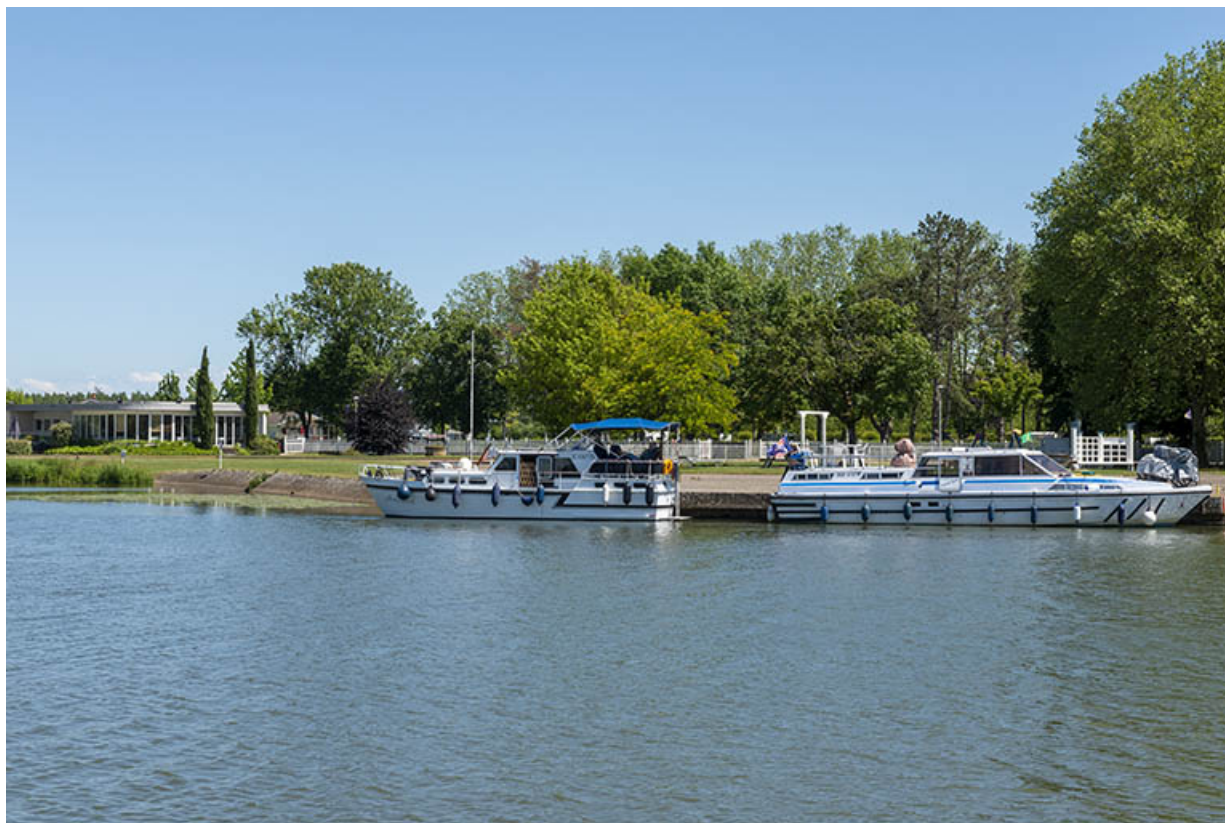
L'embarcadère pour les bateaux de plaisance.