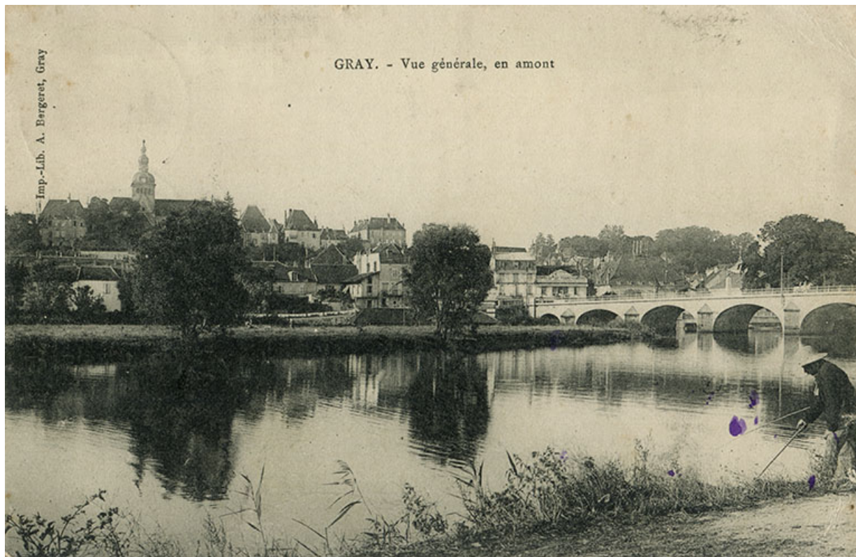
Vue générale en amont, carte postale. 70, Gray