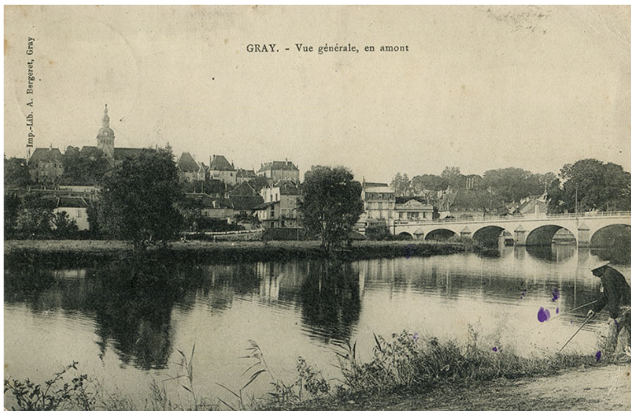
Vue générale en amont, carte postale.