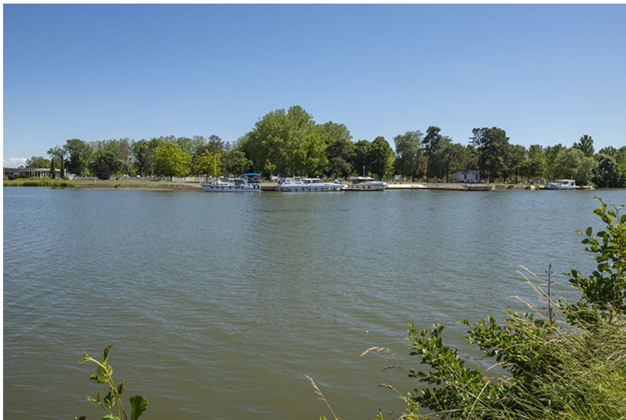
Le complexe de loisirs à Gray. 70, Gray