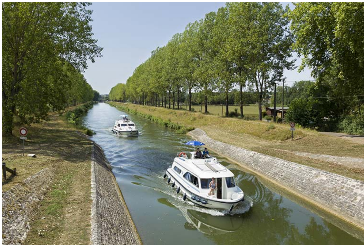
Bateaux de plaisance naviguant dans la dérivation de Rigny. 70, Rigny