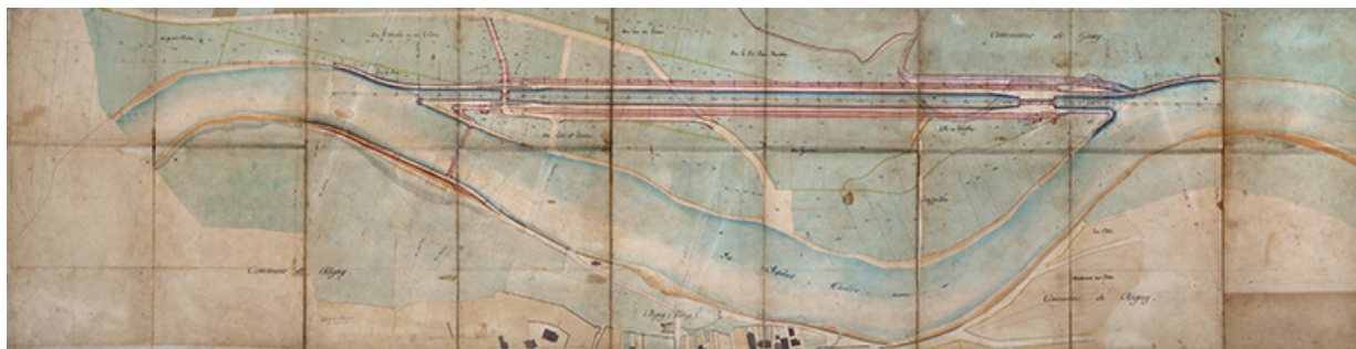
Bief de Rigny. Construction d'une dérivation éclusée, d'un barrage mobile et d'un chemin de halage. Plan général (1876). 70, Rigny