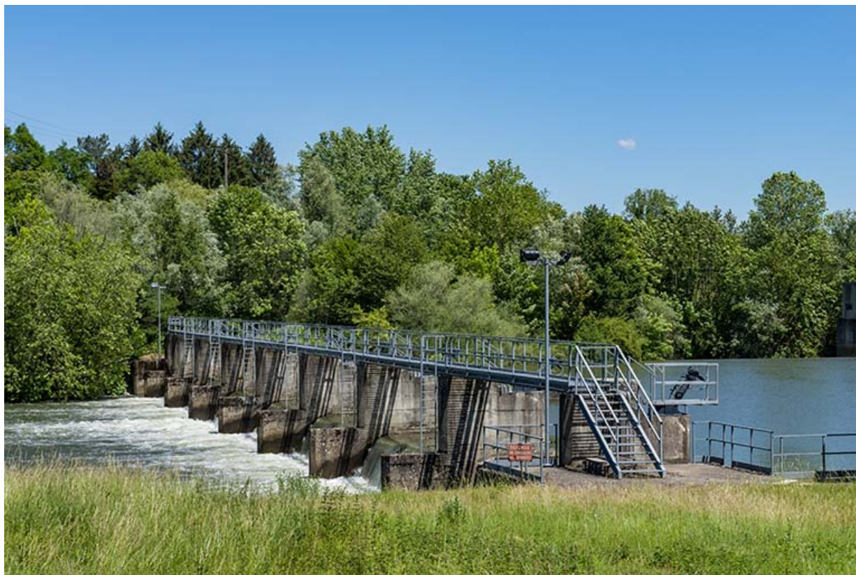
Le barrage mobile de Rigny.