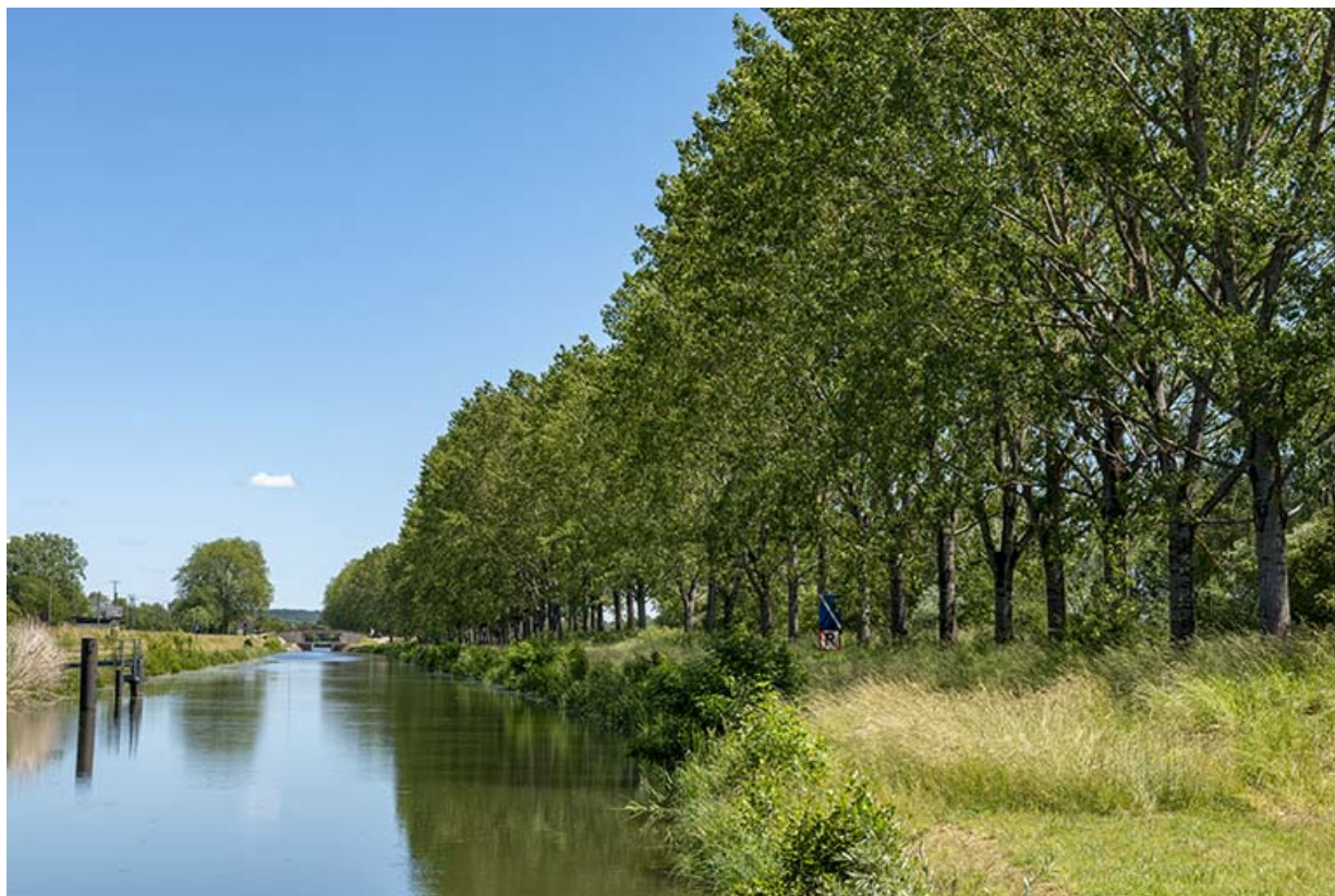
Le canal et la porte de garde en arrière-plan. 70, Rigny