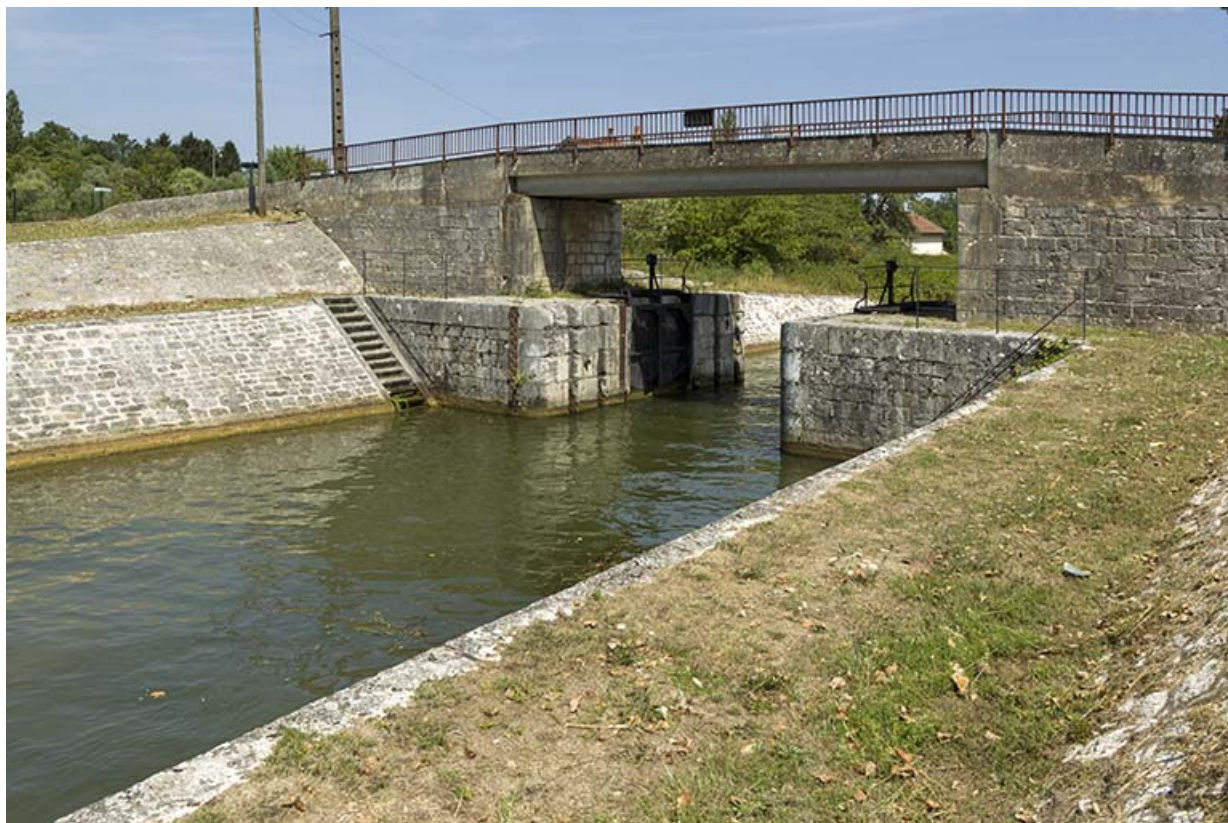
La porte de garde à l'entrée du canal. 70, Rigny