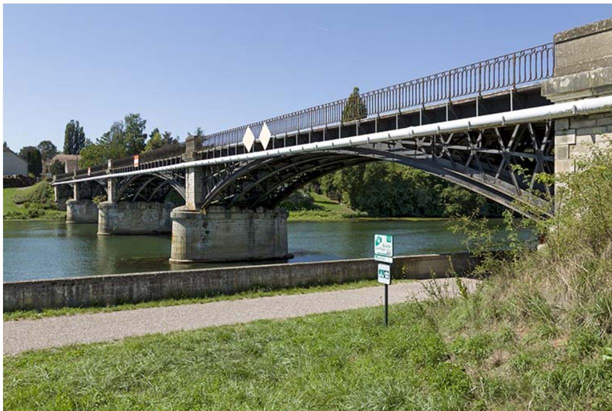
Le pont de Prantigny. 70, Rigny