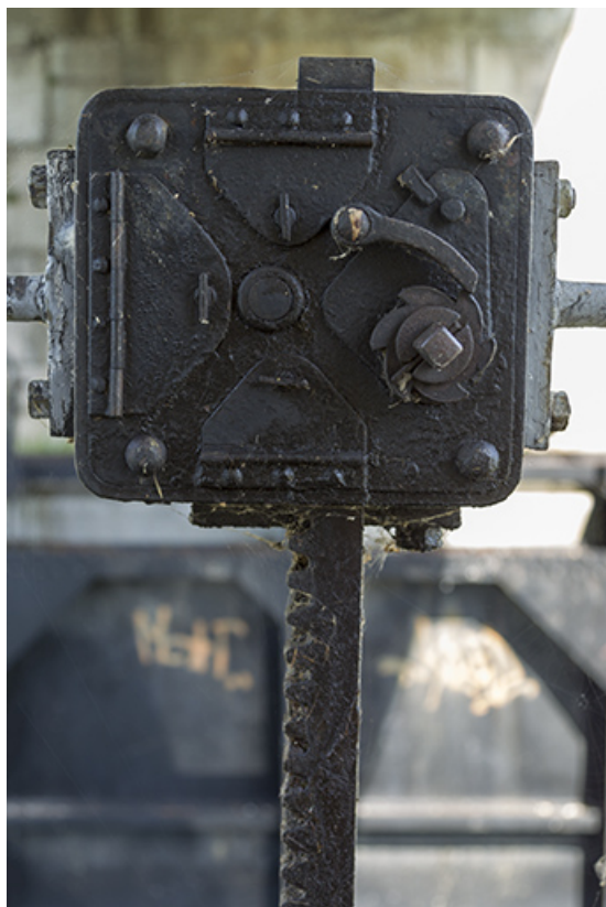
Cric manuel d'une vantelle.