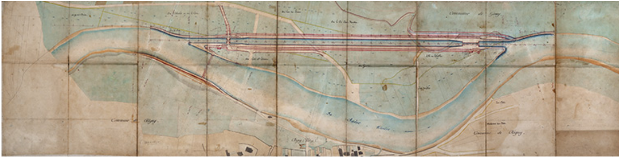
Bief de Rigny. Construction d'une dérivation éclusée, d'un barrage mobile et d'un chemin de halage. Plan général (1876). 70, Rigny