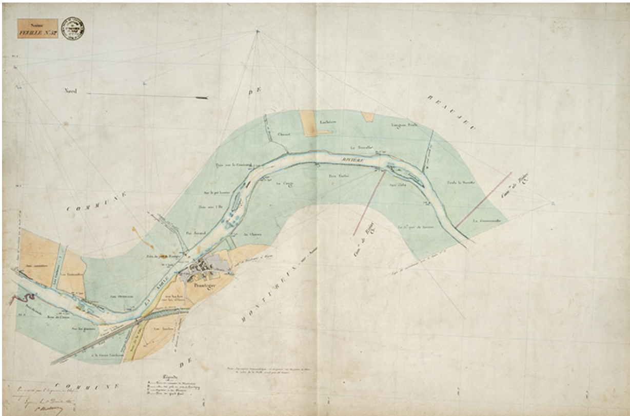
Saône - Feuille n°52.