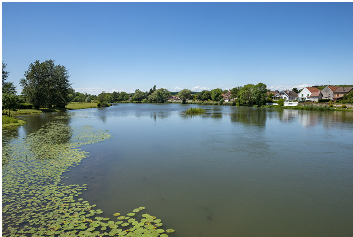
La Saône et le village de Rigny.