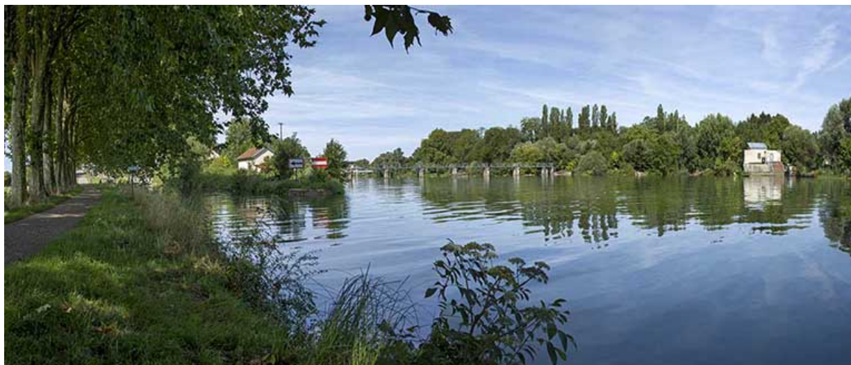
Le bief avec l'entrée de la dérivation sur la gauche et la Saône sur la droite. 70, Rigny