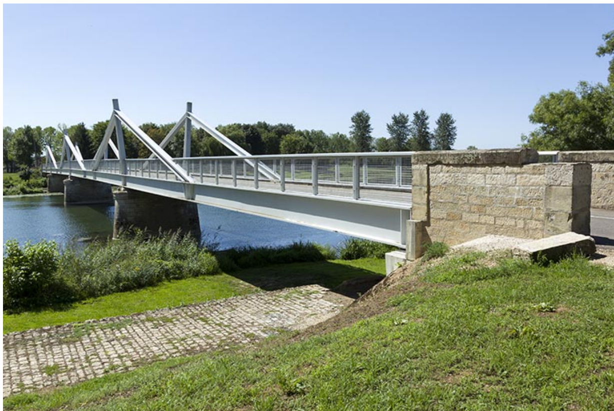
Le pont de Rigny et le chemin de halage en contrebas.