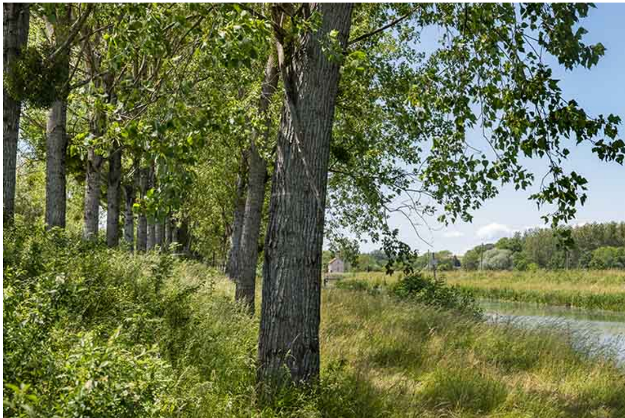
Alignement double d'arbres le long du canal de navigation. 70, Rigny