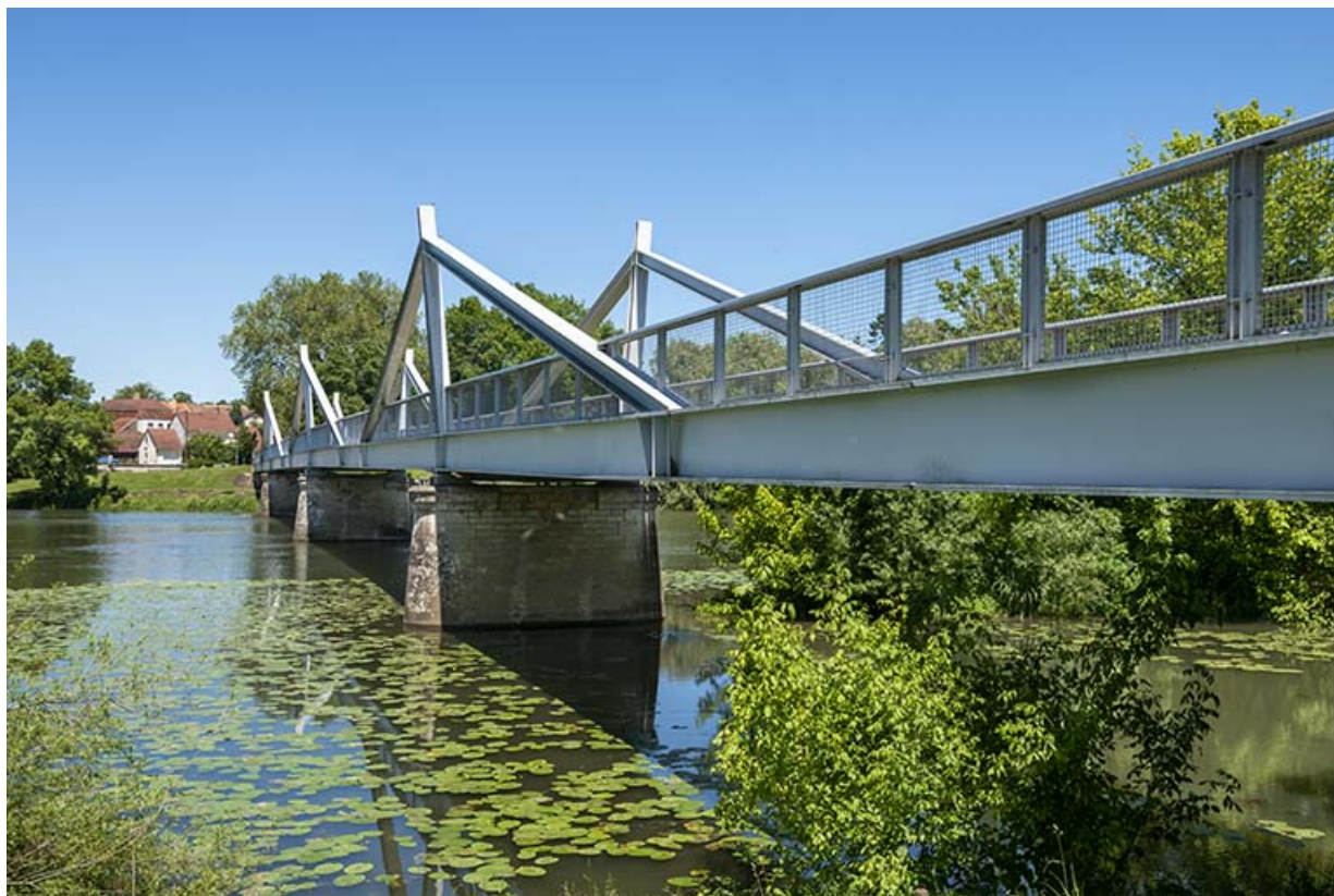
Pont de Rigny et la Saône.