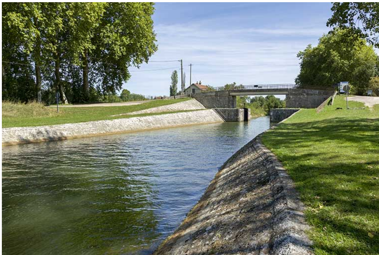
Vue depuis l'aval de la porte de garde et la maison du barragiste en arrière-plan. 70, Rigny