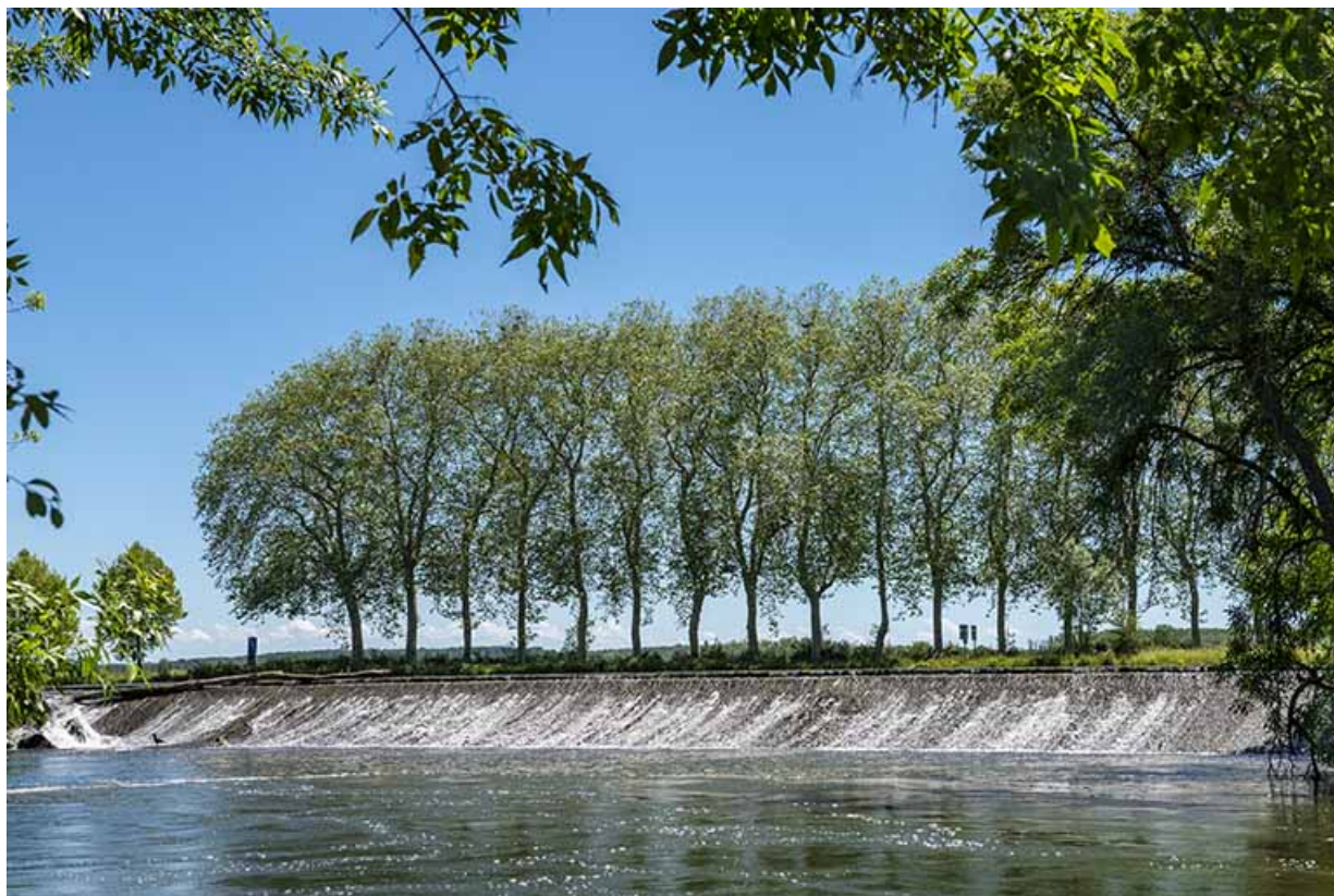
Déversoir en amont du barrage.