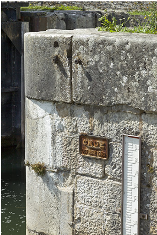
Repère de crue et échelle limnimétrique, porte de garde. 70, Rigny