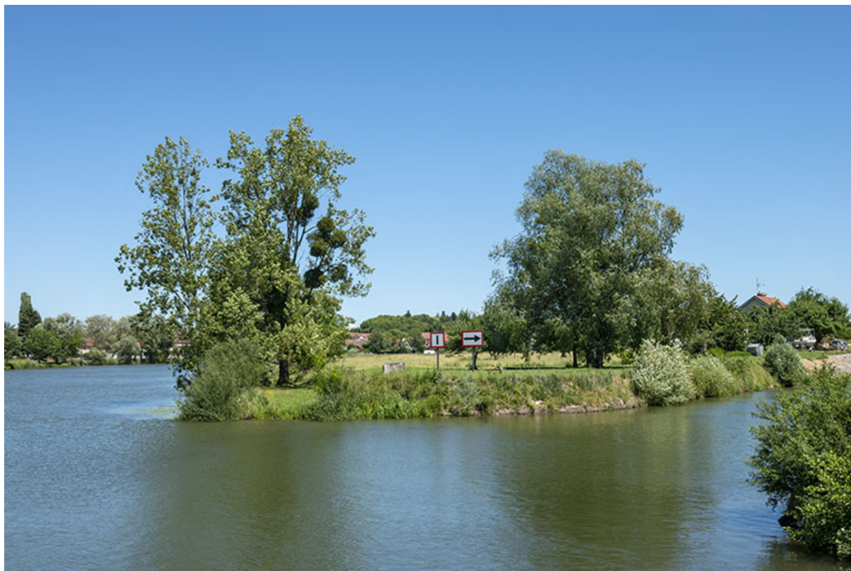
Fin du bief de Rigny et début de celui de Gray. 70, Rigny