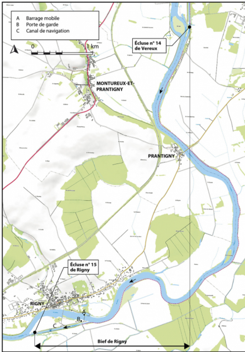
Plan de localisation (1/20 000). Extrait du ScanExpress standard © IGN 2018. 70, Rigny