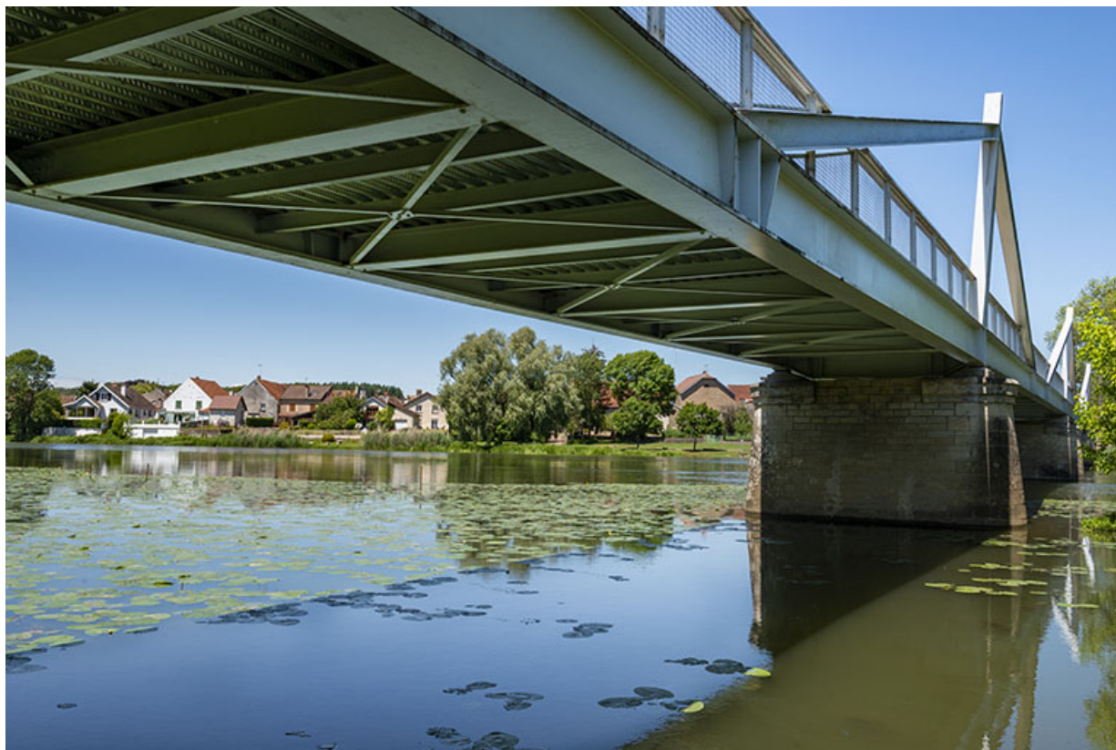
Tablier métallique du pont.