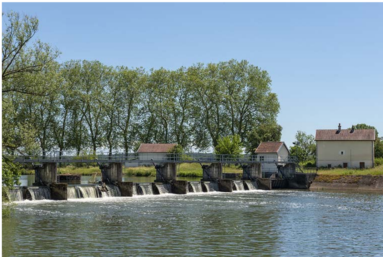
Vue depuis l'aval du barrage mobile. 70, Rigny