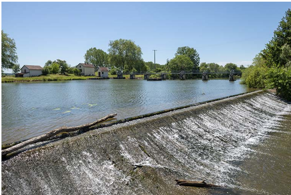
Vue de profil du déversoir et le barrage mobile en arrière-plan. 70, Rigny