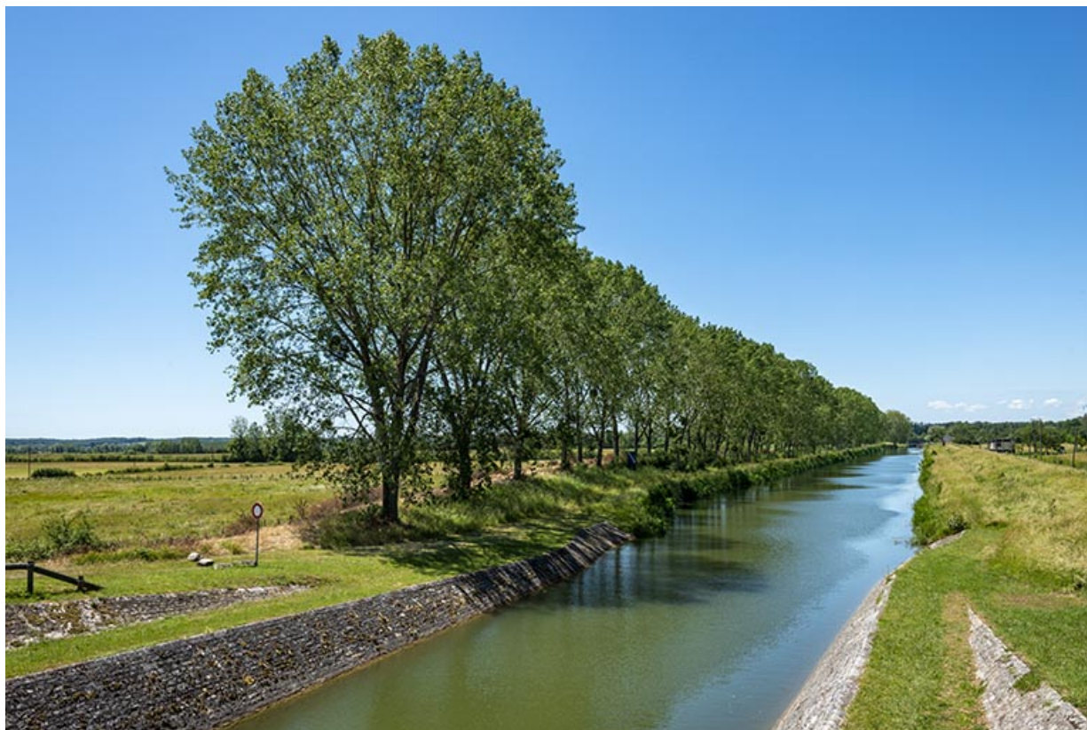
Le canal dans la dérivation.