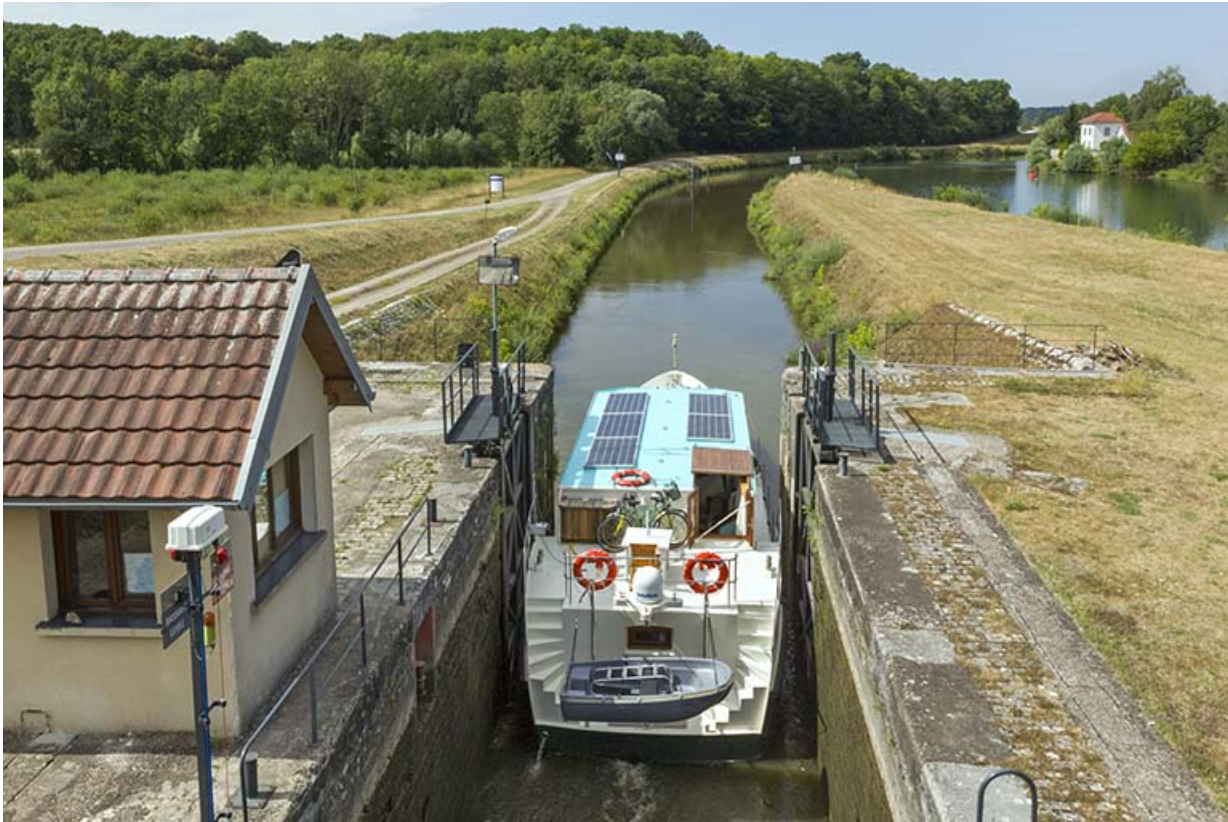
Bateau quittant le sas de l'écluse.