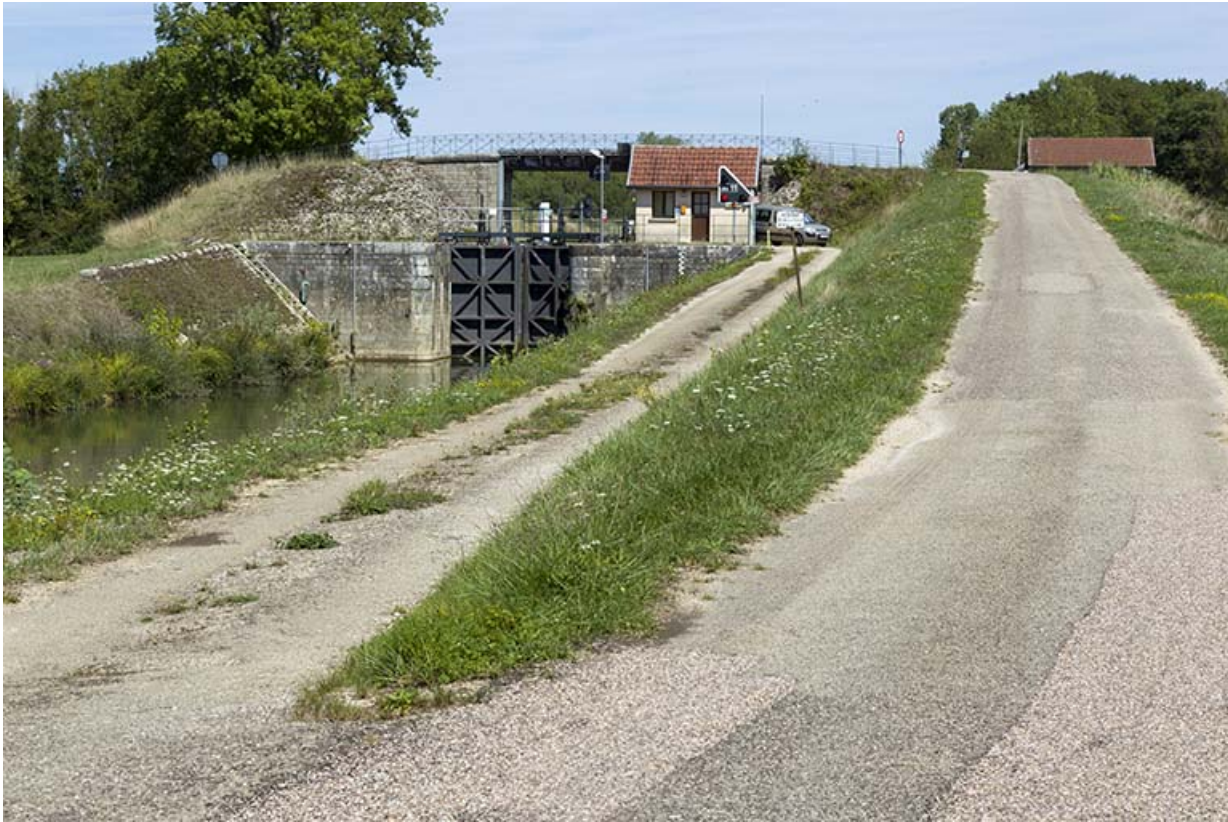
Vue du site d'écluse depuis l'aval.

70, Ray-sur-Saône chemin Près de la Roche