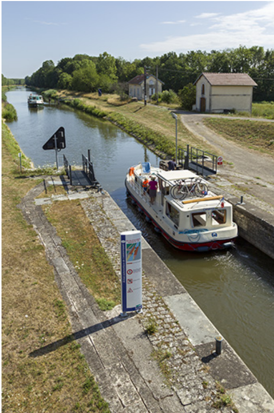
Bateau de plaisance franchissant l'écluse.

70, Ray-sur-Saône chemin Près de la Roche