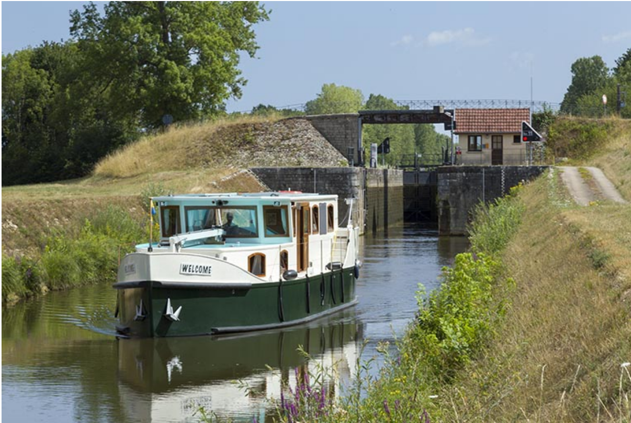
Bateau de plaisance et l'écluse en arrière-plan.

70, Ray-sur-Saône chemin Près de la Roche