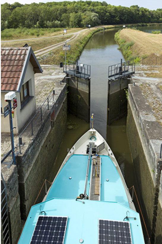
Bateau dans le sas de l'écluse.

70, Ray-sur-Saône chemin Près de la Roche