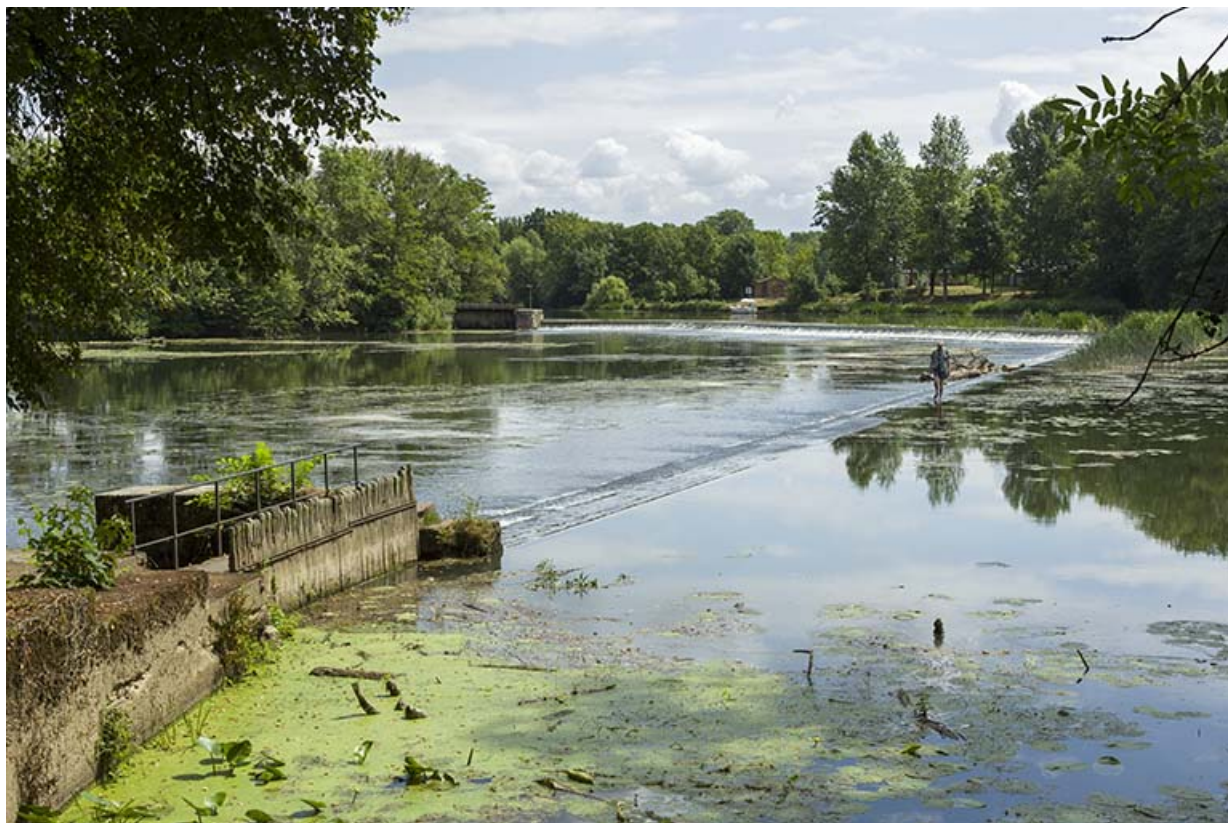
Ancien barrage usinier et la Saône.