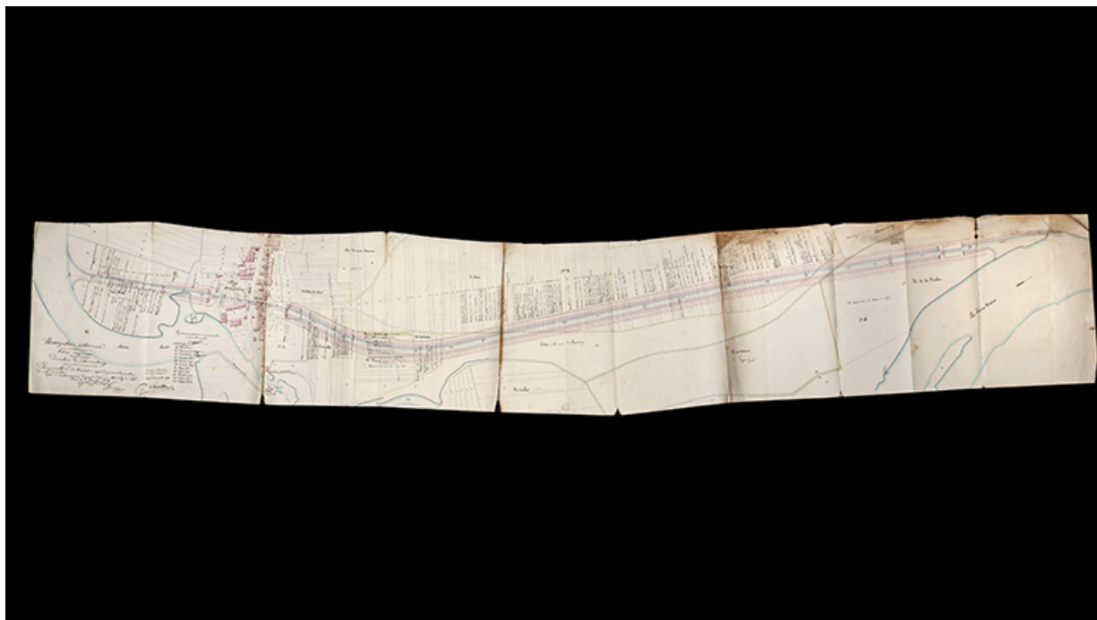
Plan des terrains à acquérir pour la construction de la dérivation (1838).