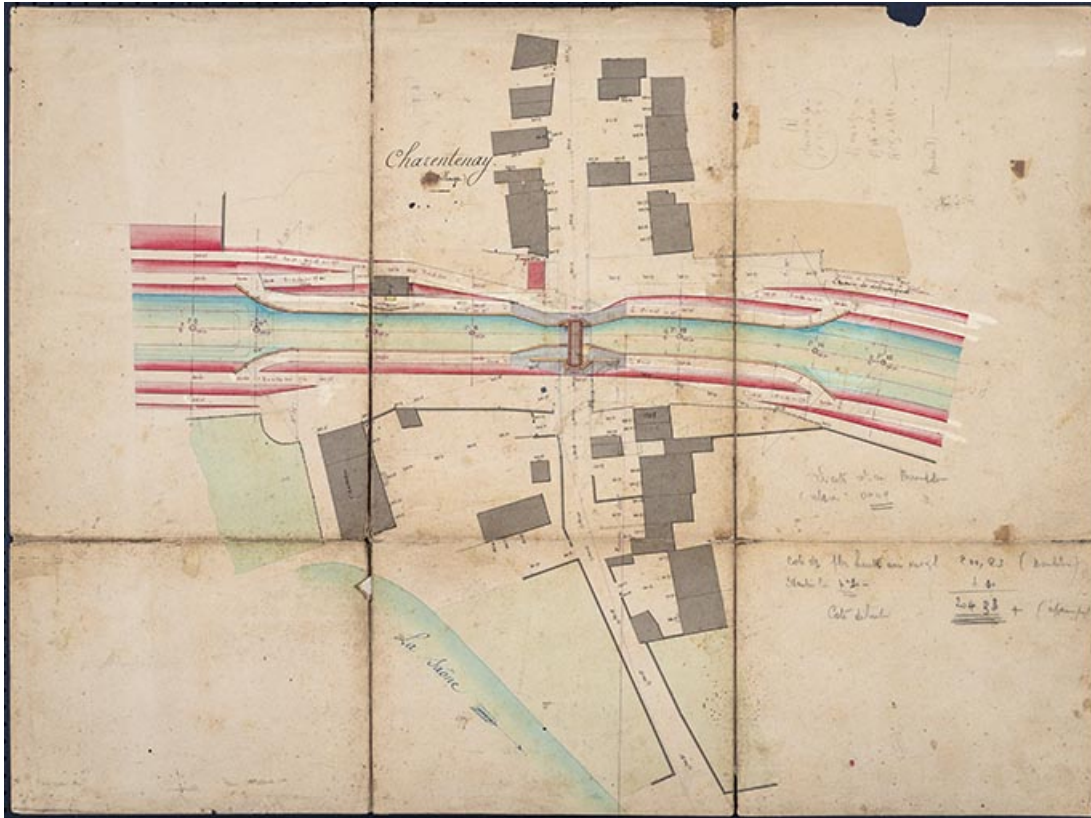
Plan général de la tranchée maçonnée (1876). 70, Soing-Cubry-Charentenay