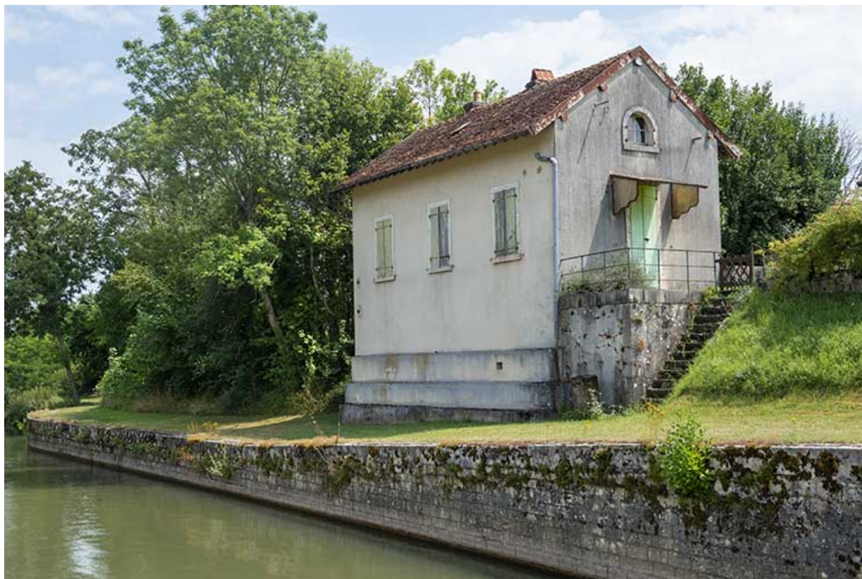
Maison de la porte de garde.