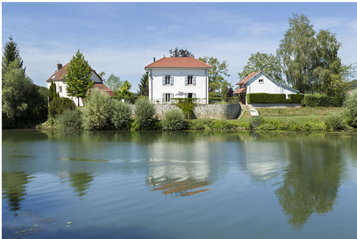
Embarcadère de l'ancien bac de Ray-sur-Saône.