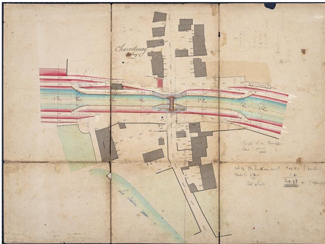
Plan général de la tranchée maçonnée (1876). 70, Soing-Cubry-Charentenay