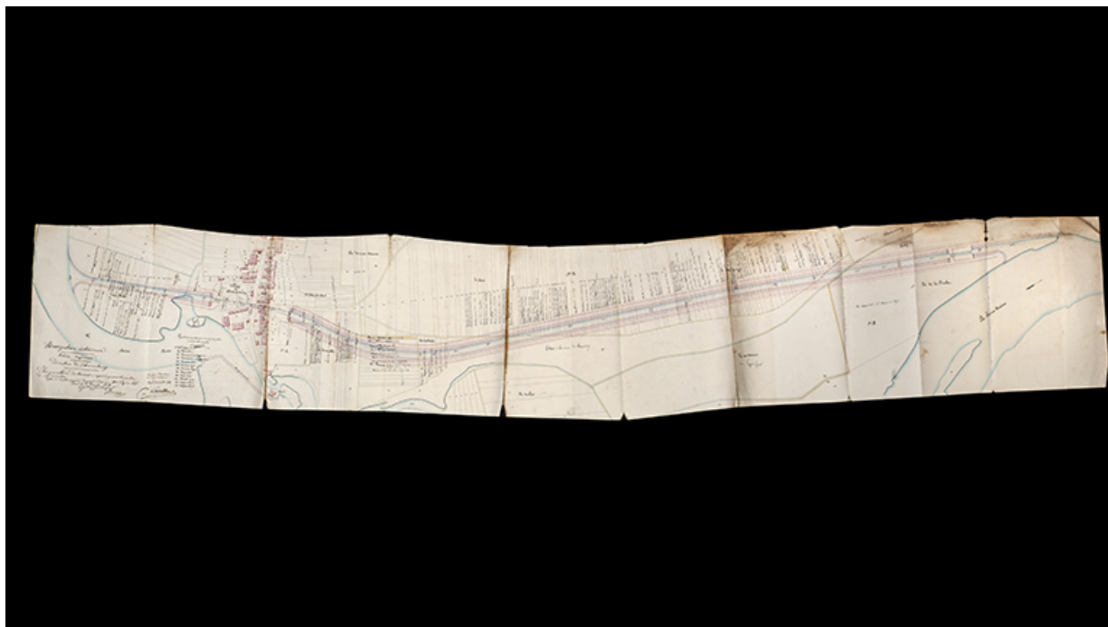
Plan des terrains à acquérir pour la construction de la dérivation (1838). 70, Soing-Cubry-Charentenay