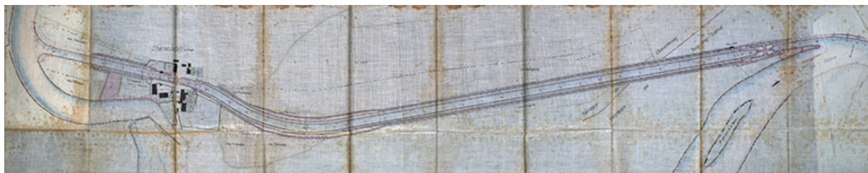
Achèvement de la dérivation de Charentenay - Plan général de la dérivation (1876).