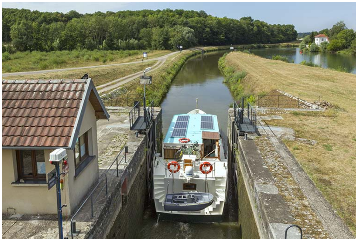
Bateau quittant le sas de l'écluse.