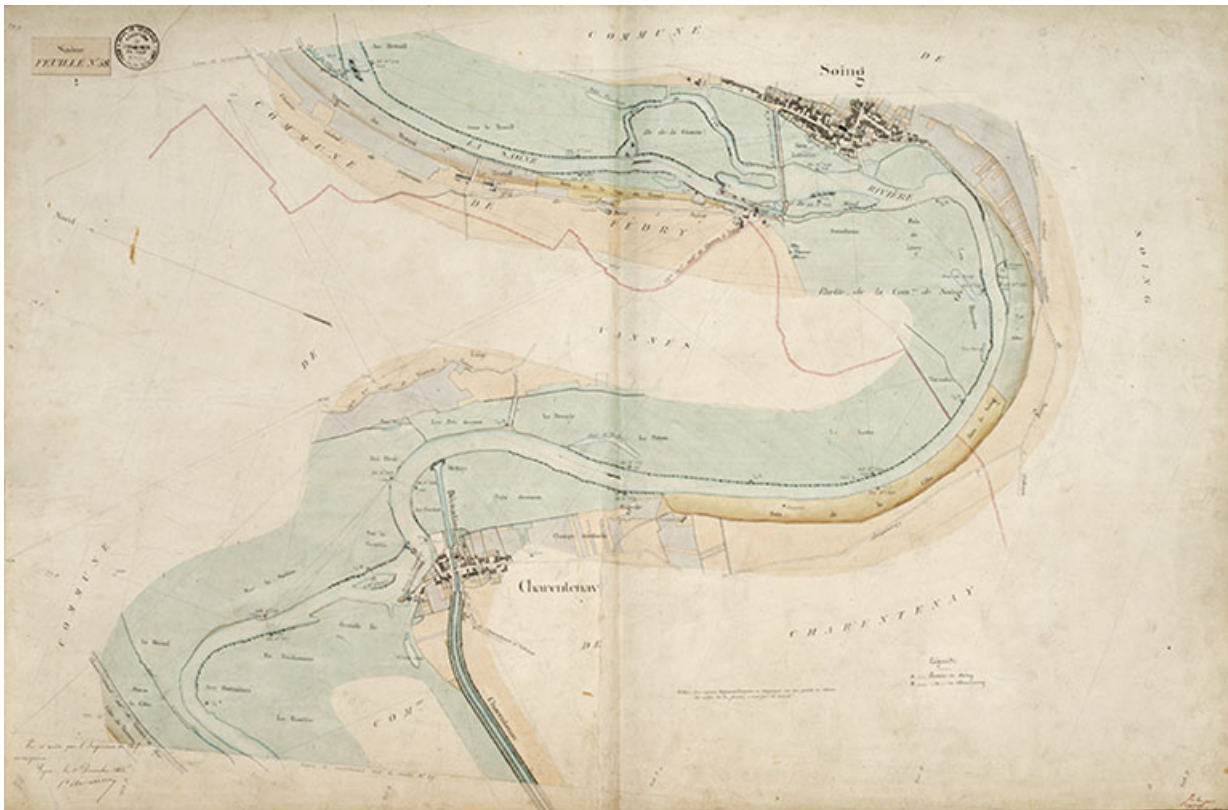
Saône - Feuille n°58. 70, Soing-Cubry-Charentenay