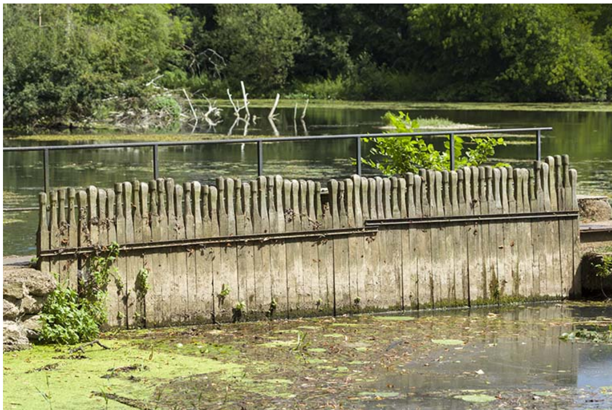
Aiguilles fermant l'ancien pertuis de navigation.