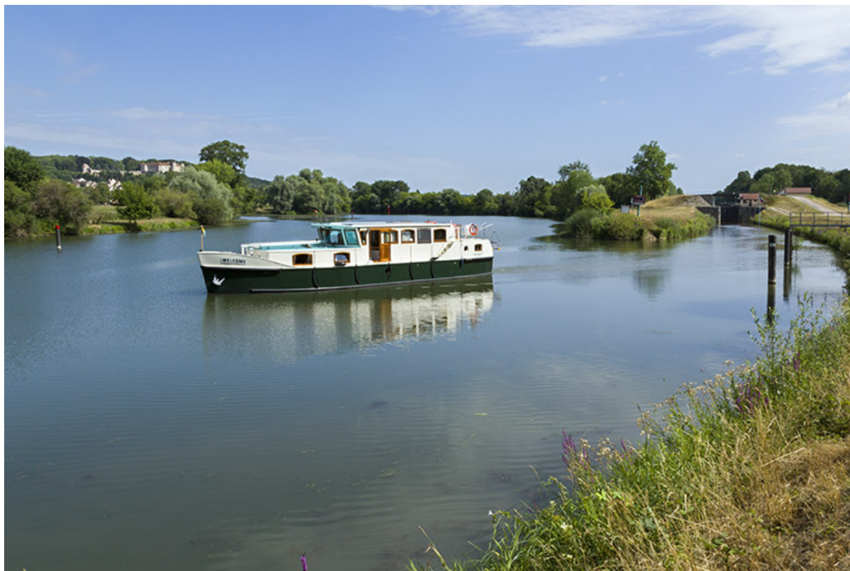
bateau de plaisance sortant de la dérivation de Charentenay.