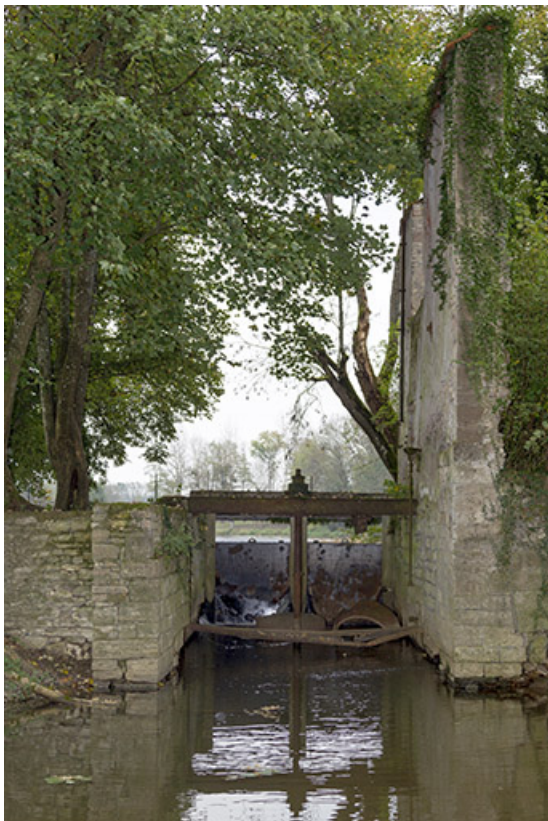
L'ancien canal de dérivation du moulin.