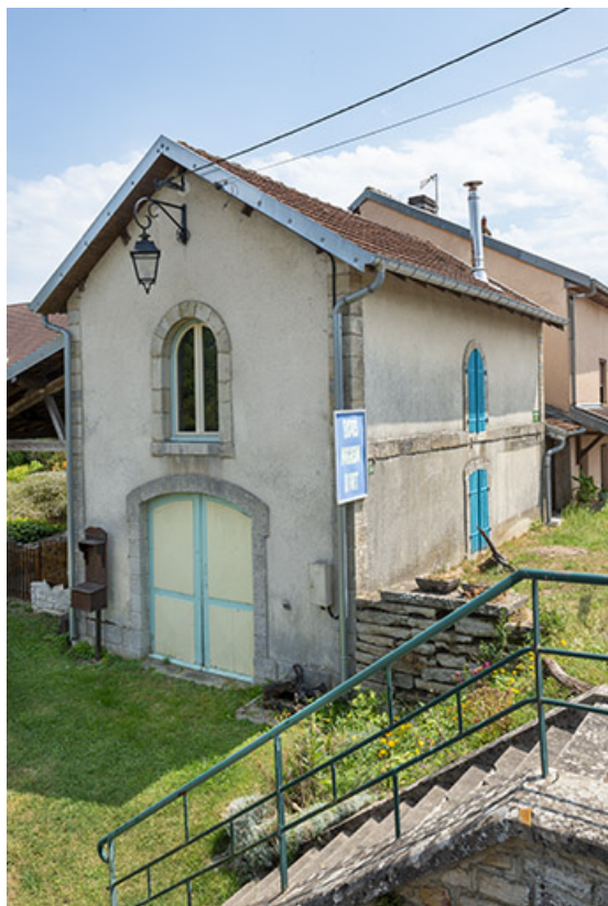
Magasin servant à la maintenance du pont-tournant. 70, Soing-Cubry-Charentenay