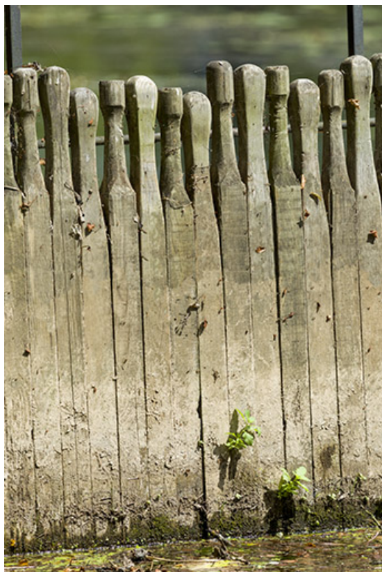
Détail des aiguilles.