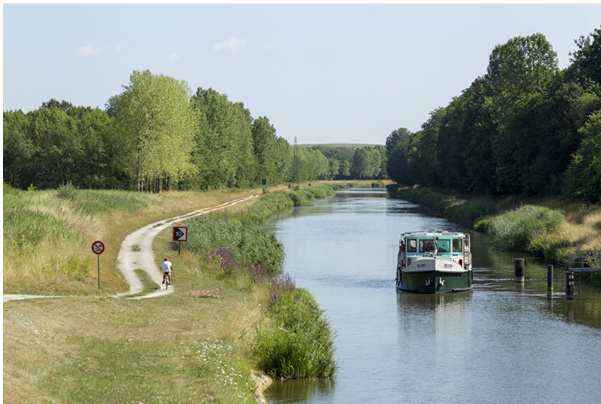
La dérivation au niveau de Ray-sur-Saône avec le chemin de halage. 70, Soing-Cubry-Charentenay