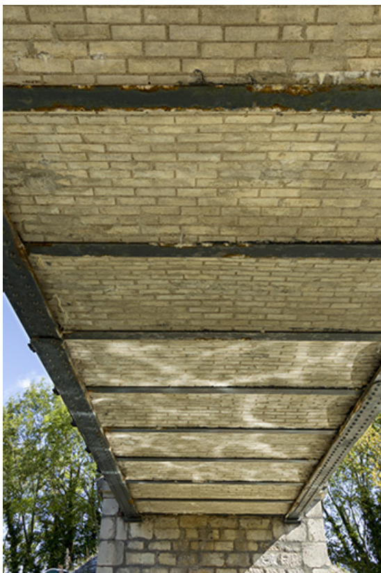
La voûte du pont.