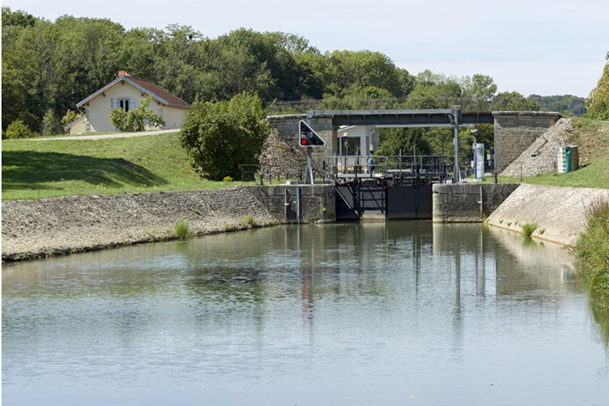
Entrée amont de l'écluse à sas.