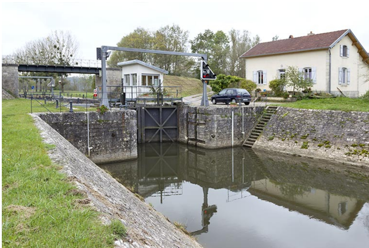
Vue aval de l'entrée du sas. 70, Vanne