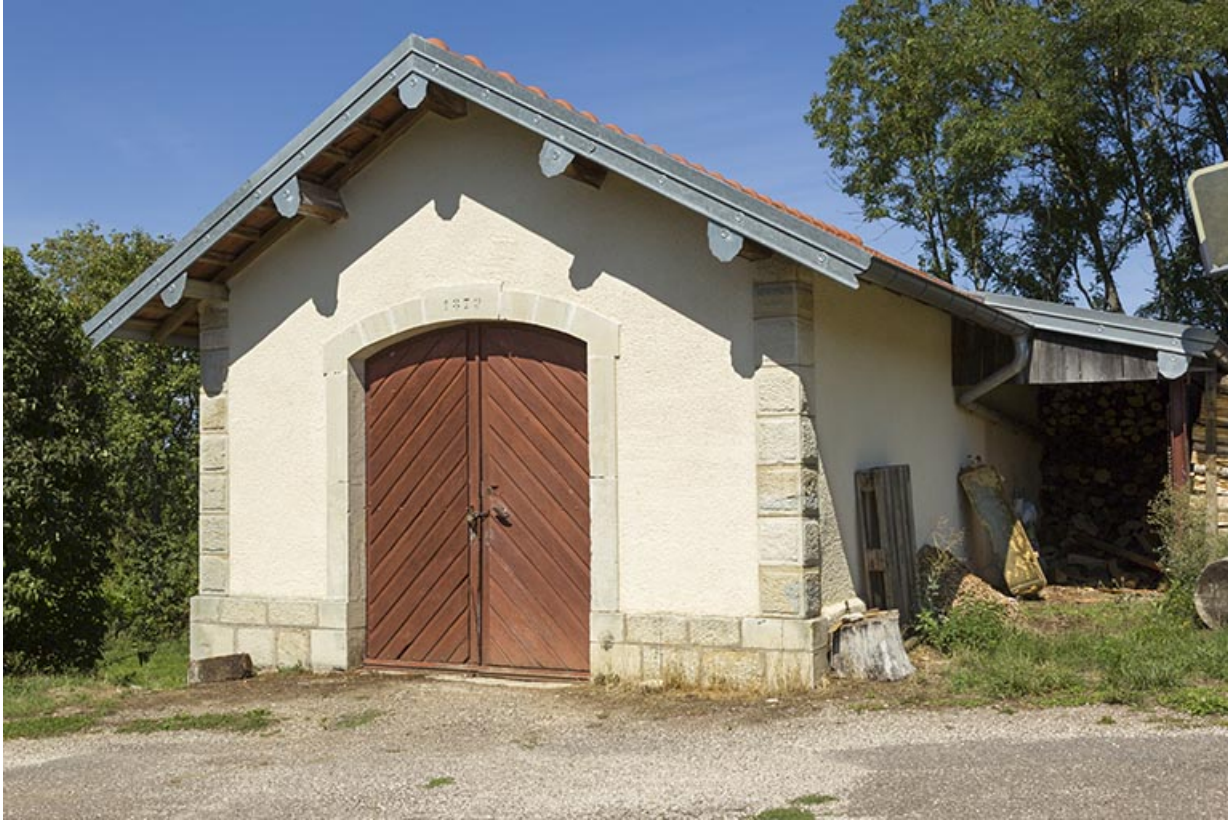
Le magasin attenant au site d'écluse.