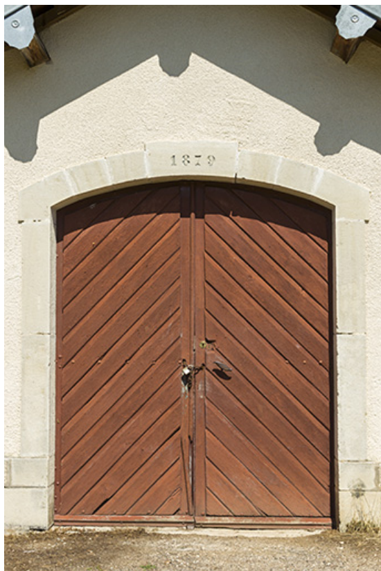
La porte du magasin.