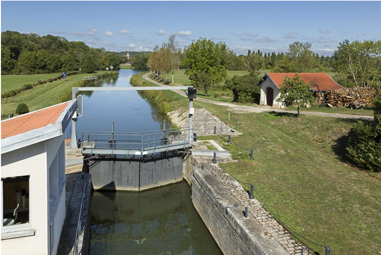
Vue de l'écluse depuis la passerelle métallique.