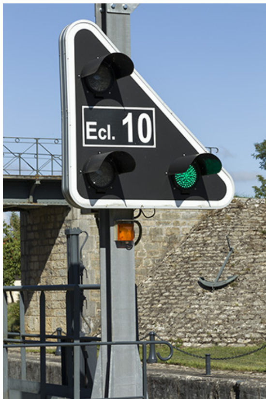
Panneau signalant l'écluse de Soing. 70, Vanne