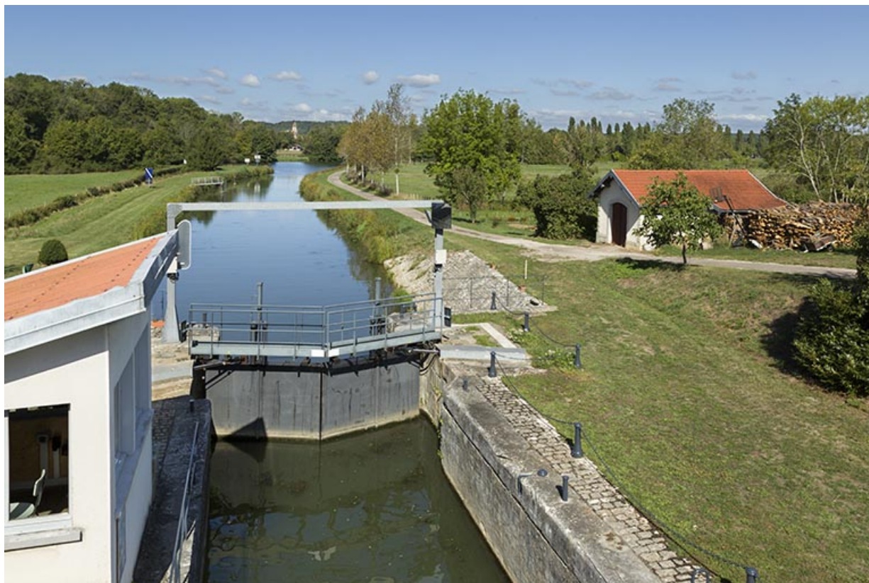
Vue de l'écluse depuis la passerelle métallique. 70, Vanne