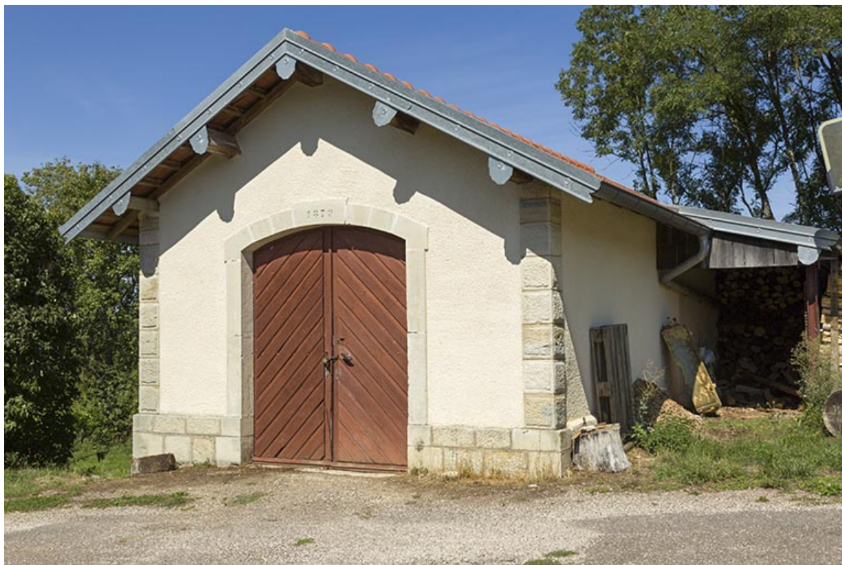
Le magasin attenant au site d'écluse.