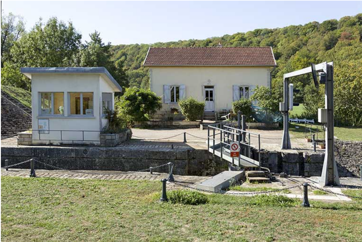
L'écluse, le poste de commande et la maison de l'éclusier.