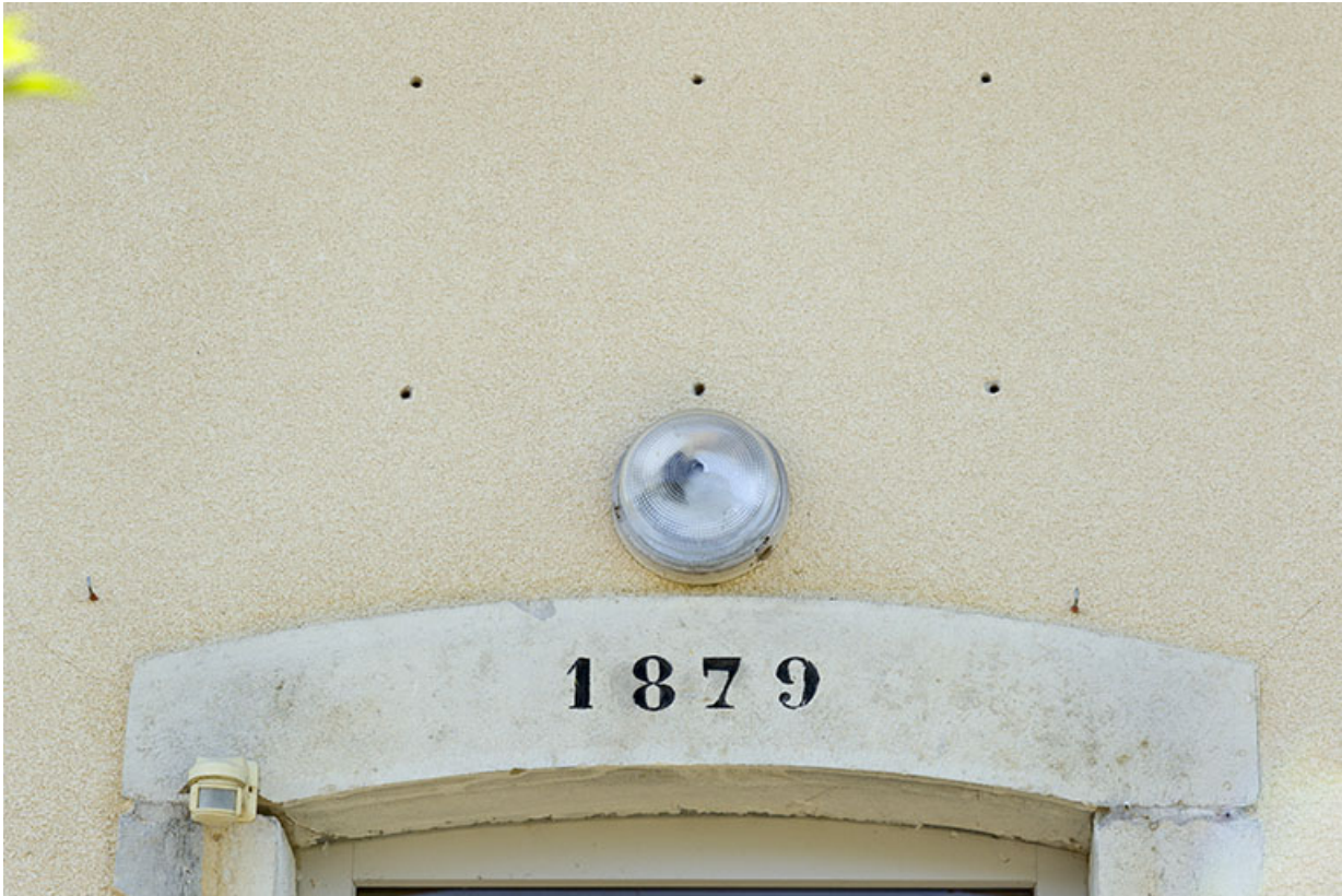
Date portée sur le linteau de la porte de la maison.