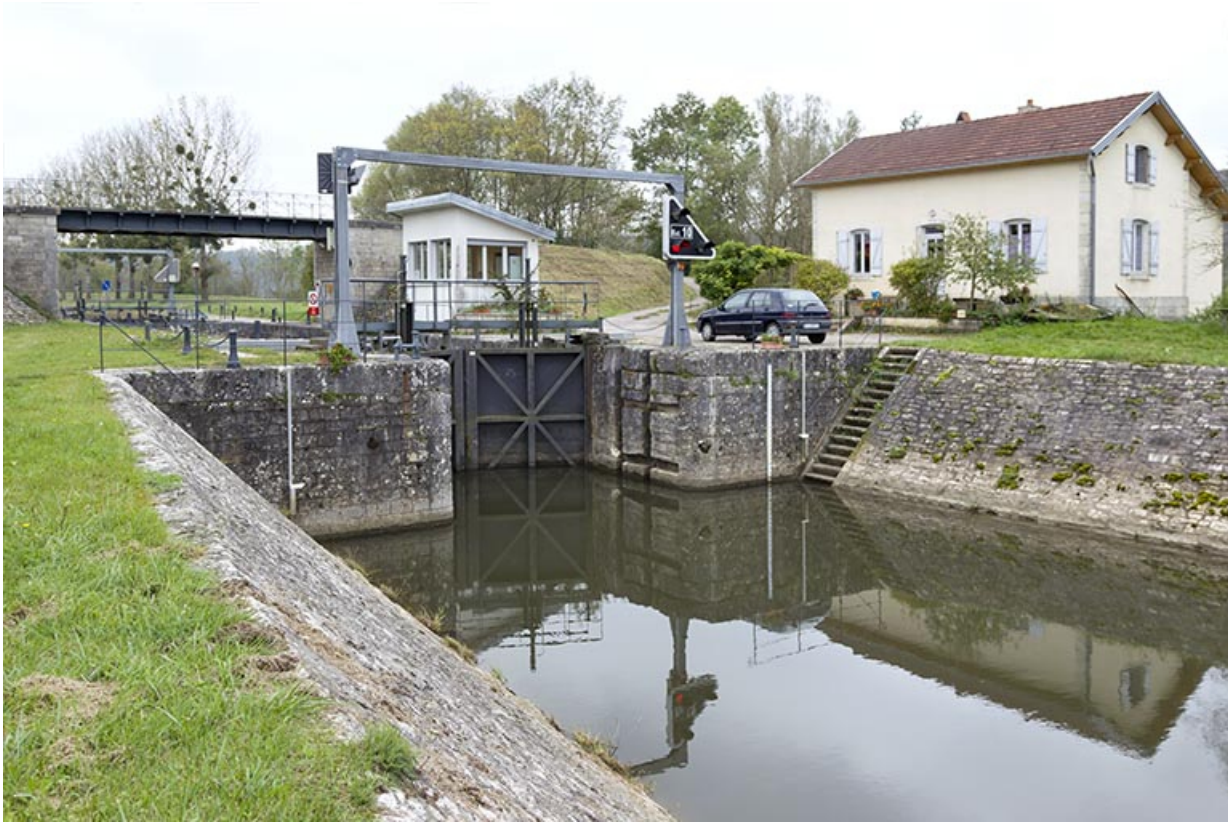
Vue aval de l'entrée du sas.