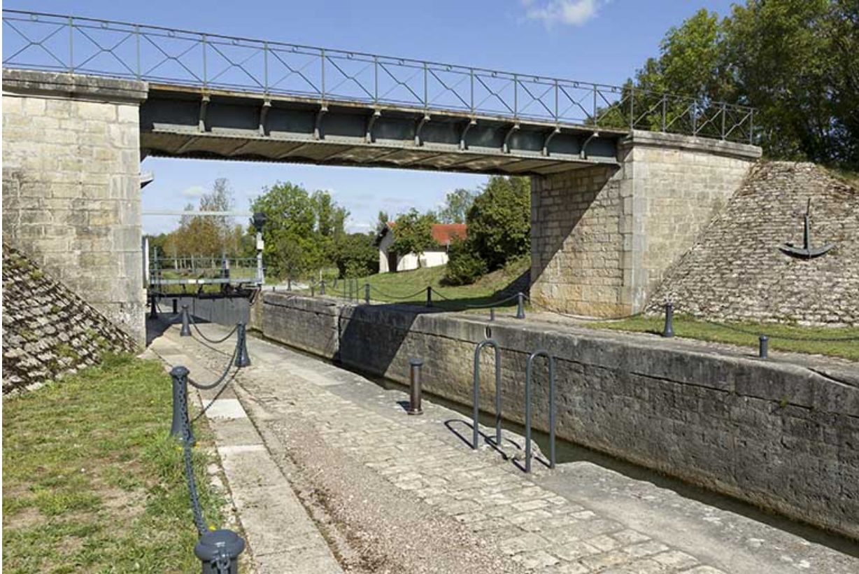
Le pont métallique au dessus de l'écluse.