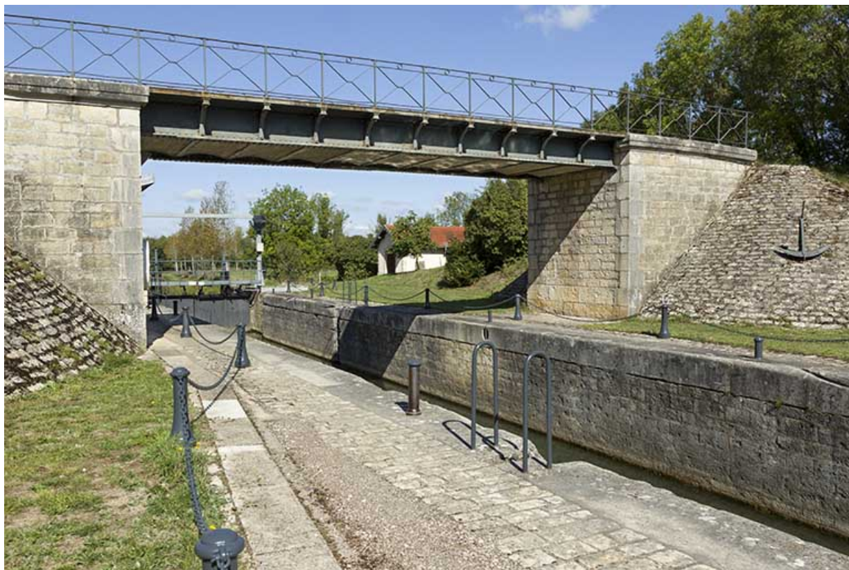
Le pont métallique au dessus de l'écluse. 70, Vanne