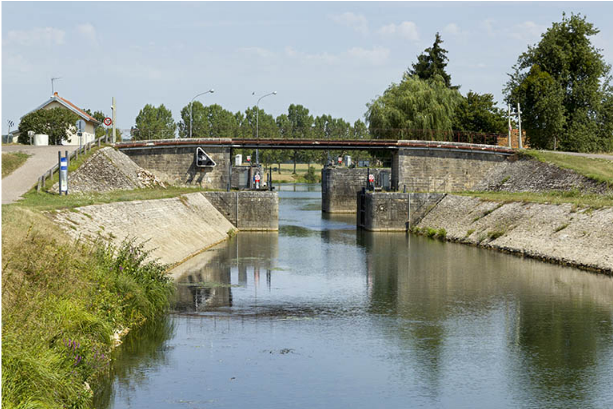
Entrée aval de l'écluse.