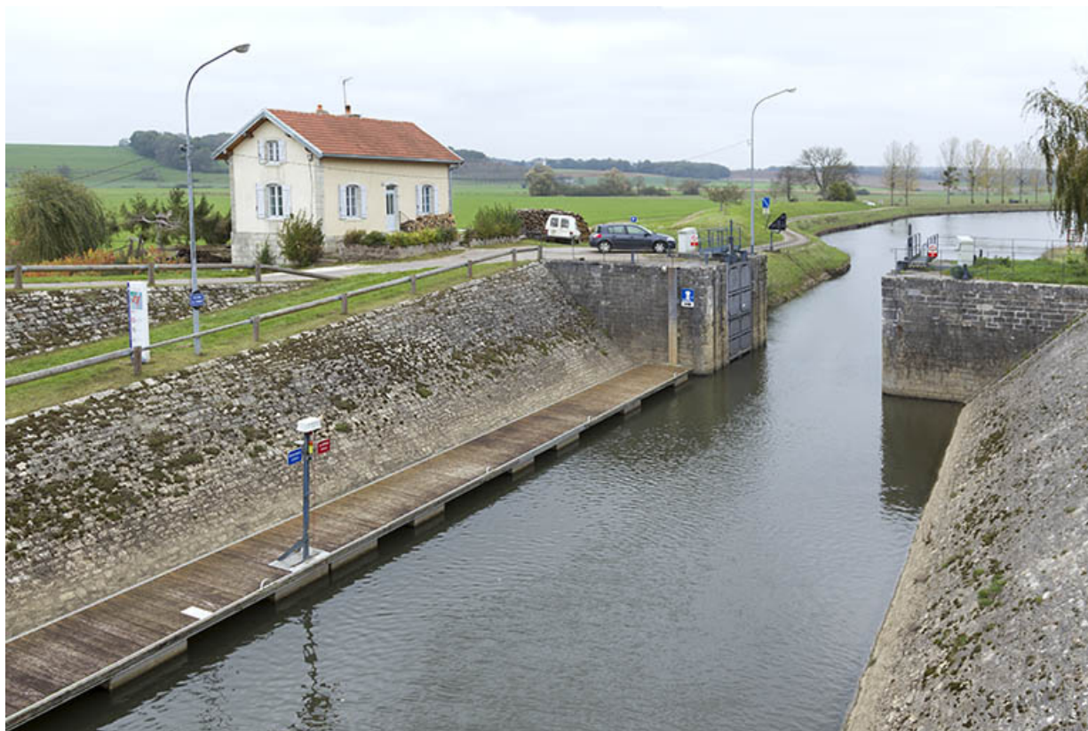
Les perrés inclinés de l'écluse de garde.