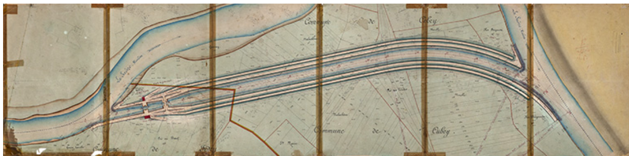
Bief de Soing. Coupure de Cubry - Plan général (1878).