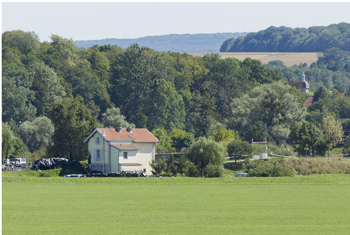
La maison située à l'entrée du canal de navigation.