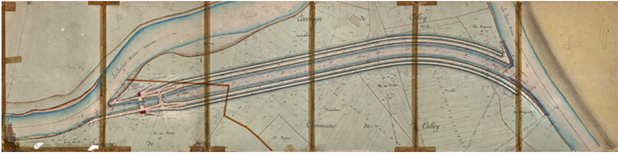
Bief de Soing. Coupure de Cubry - Plan général (1878). 70, Soing-Cubry-Charentenay