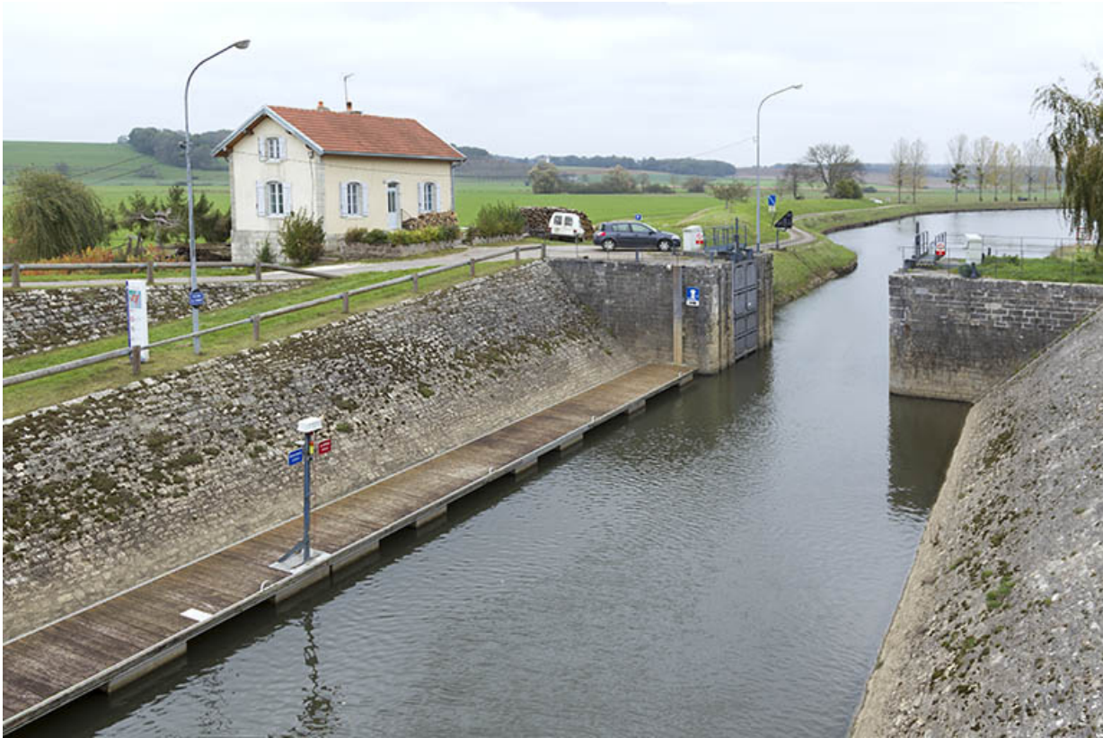
Les perrés inclinés de l'écluse de garde.