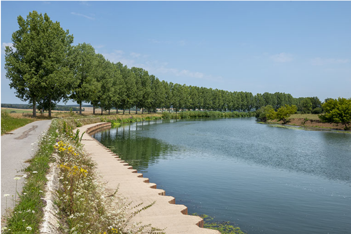
Vue vers l'amont depuis l'entrée du canal.