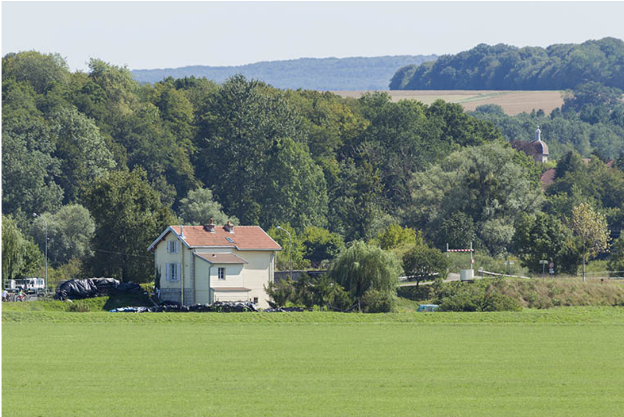
La maison située à l'entrée du canal de navigation.