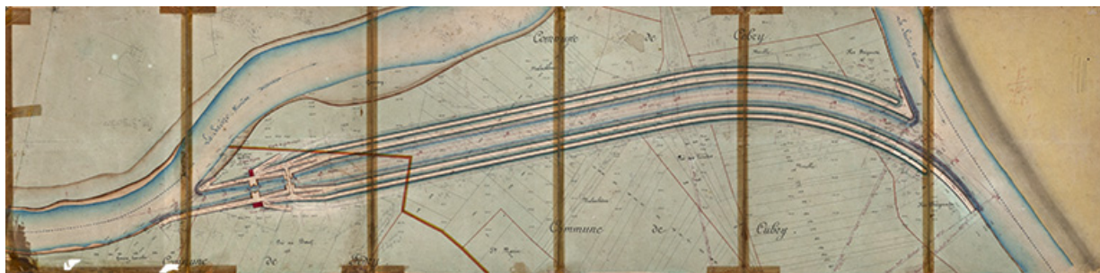
Bief de Soing. Coupure de Cubry - Plan général (1878). 70, Soing-Cubry-Charentenay