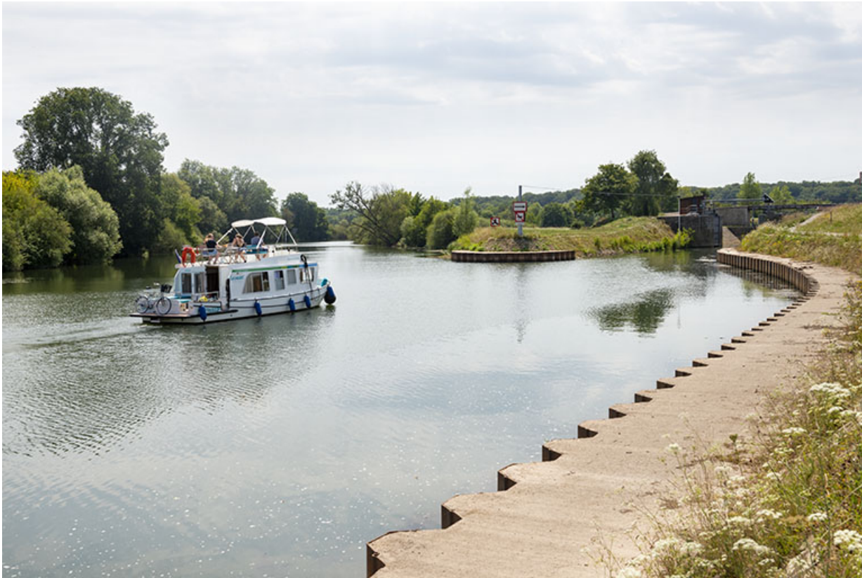
Entrée du canal de navigation de Cubry.