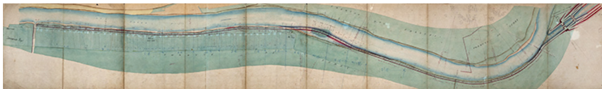
Bief de Soing - Construction de la coupure de Cubry, de la dérivation éclusée de Soing et d'un chemin de halage . Chemin de halage entre le ruisseau de Vy-Lès-Rupt et la coupure de Cubry, plan général (1878).