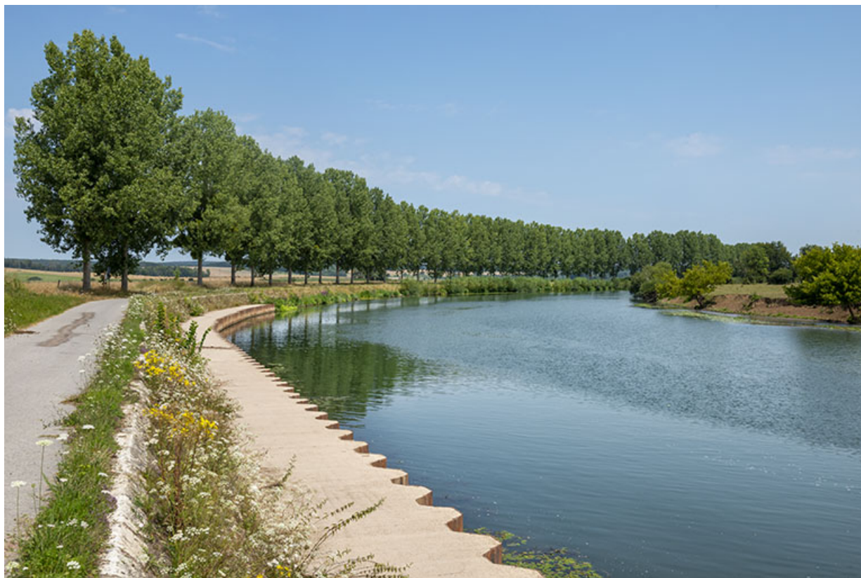
Vue vers l'amont depuis l'entrée du canal.