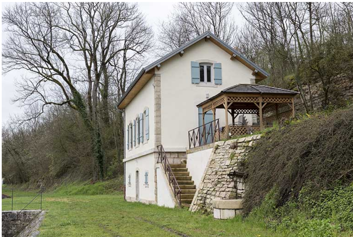
La maison d'éclusier.