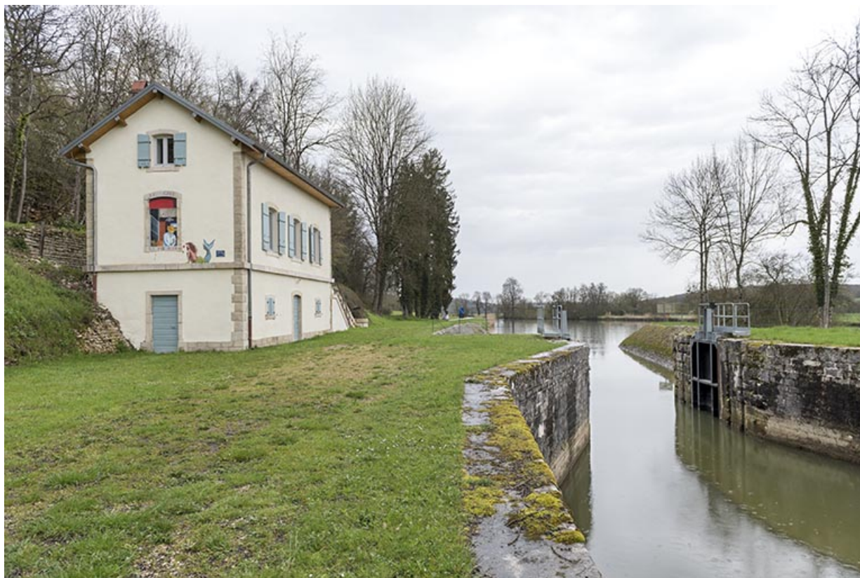
Vue depuis l'aval du site d'écluse.