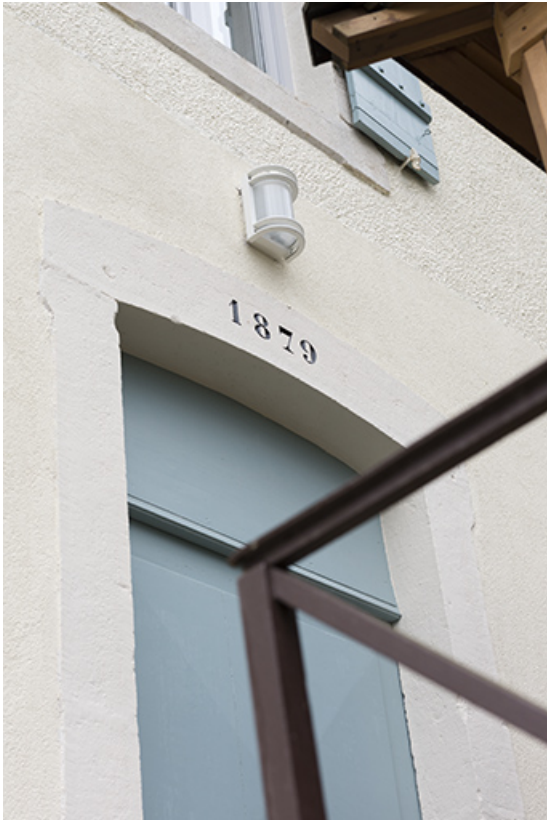
Date portée sur la maison d'éclusier.