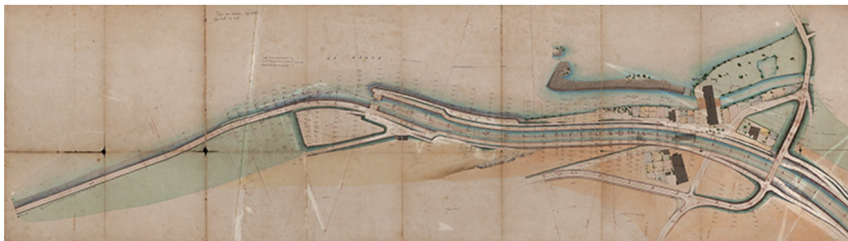
Dérivation de Soing - Plan des abords de la porte de garde et du pont sous le chemin de Morey à Soing (1878). 70, Soing-Cubry-Charentenay