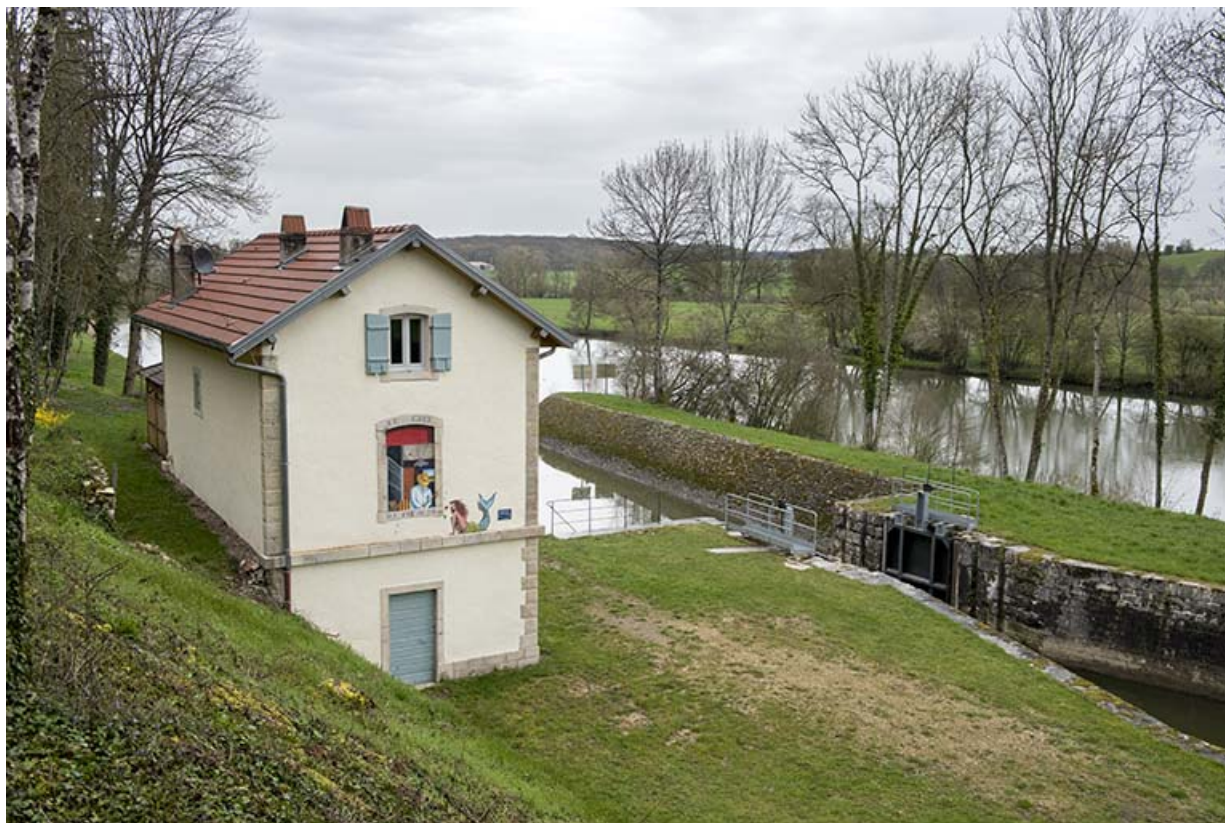
le site d'écluse, vue d'ensemble.