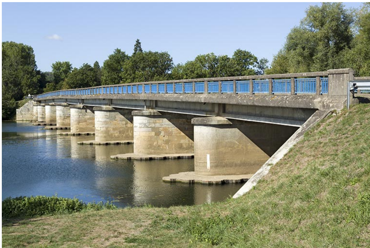
Le pont enjambant la Saône permettant de rejoindre le bourg de Soing. 70, Soing-Cubry-Charentenay