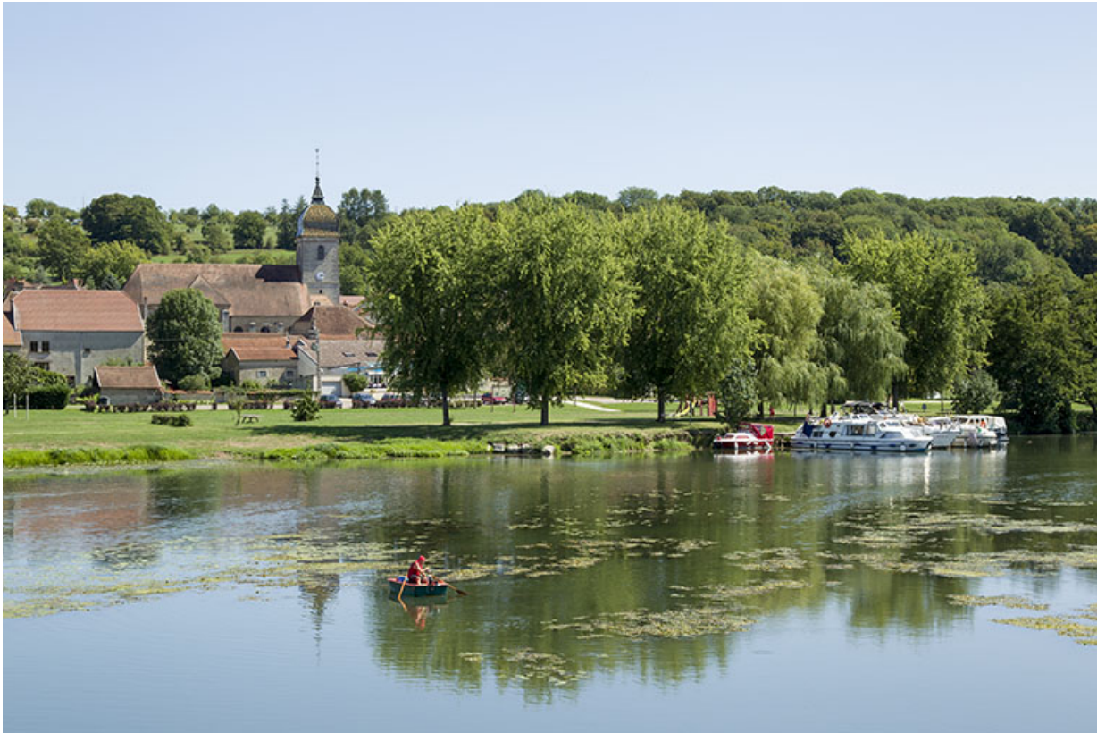
La Saône et le village de Soing.