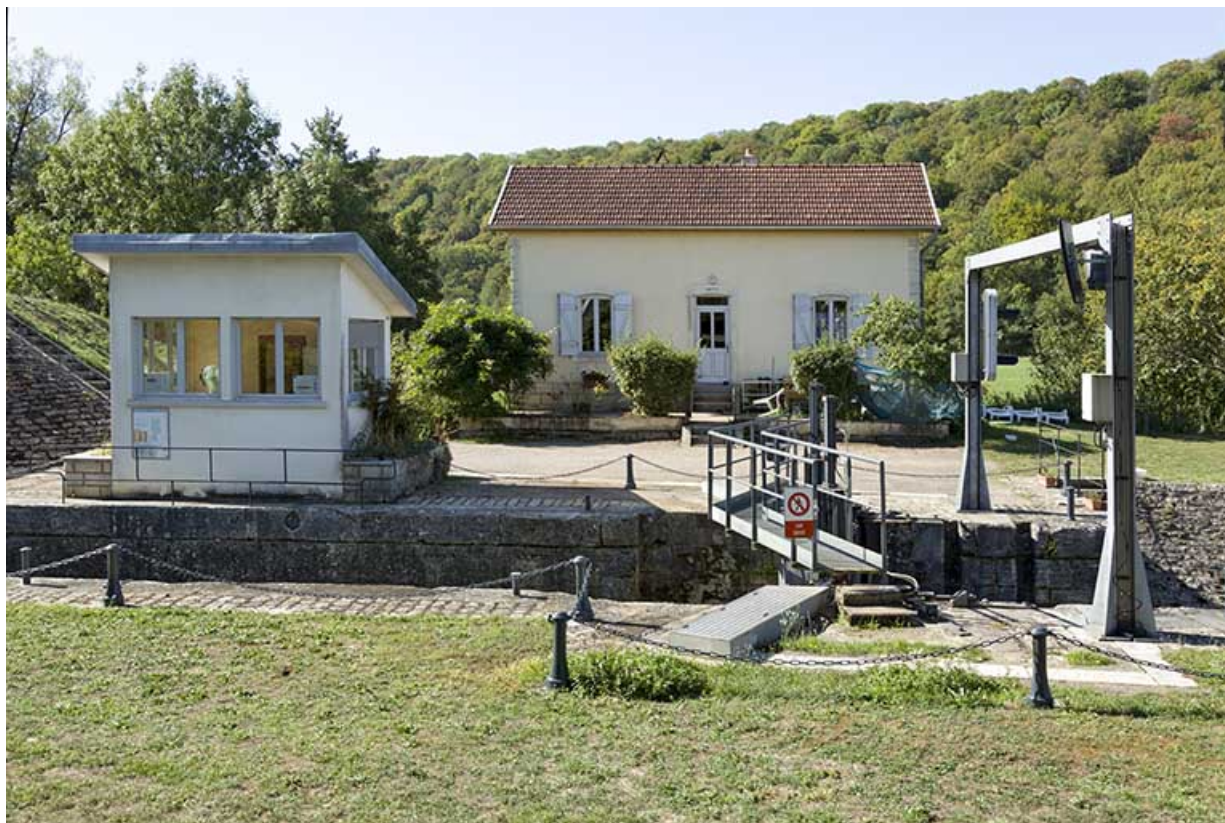
L'écluse, le poste de commande et la maison de l'éclusier. 70, Vanne