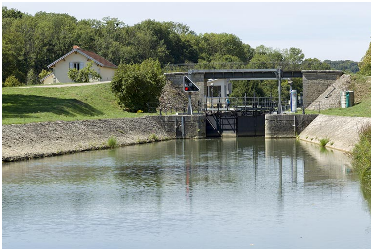
Entrée amont de l'écluse à sas.