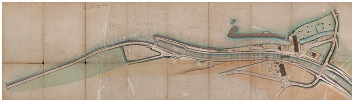
Dérivation de Soing - Plan des abords de la porte de garde et du pont sous le chemin de Morey à Soing (1878). 70, Soing-Cubry-Charentenay