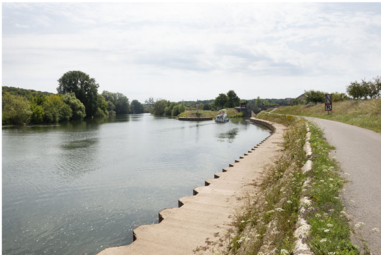
Entrée du canal de navigation de Cubry depuis le chemin de halage.