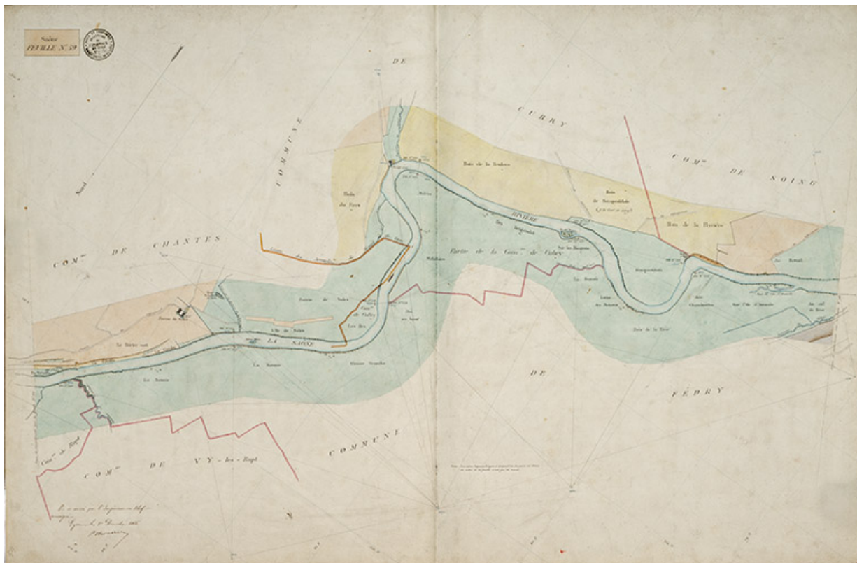
Saône -Feuille n°59.