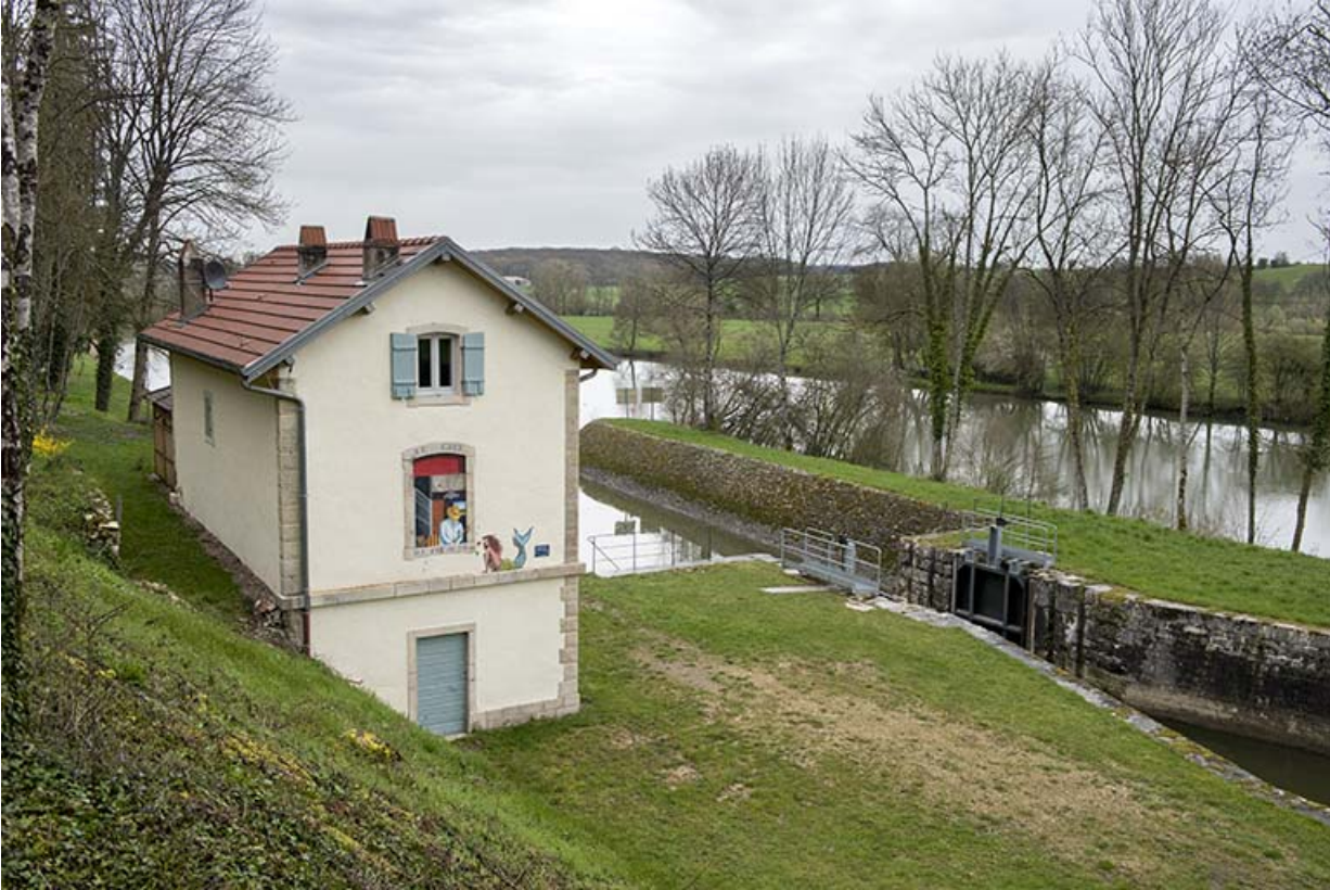
le site d'écluse, vue d'ensemble.