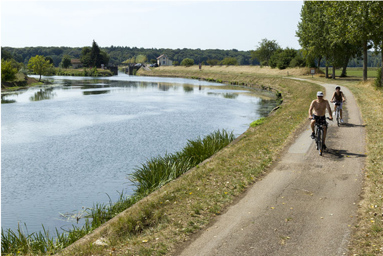
Cyclistes empruntant la véloroute aménagée sur l'ancien chemin de halage.