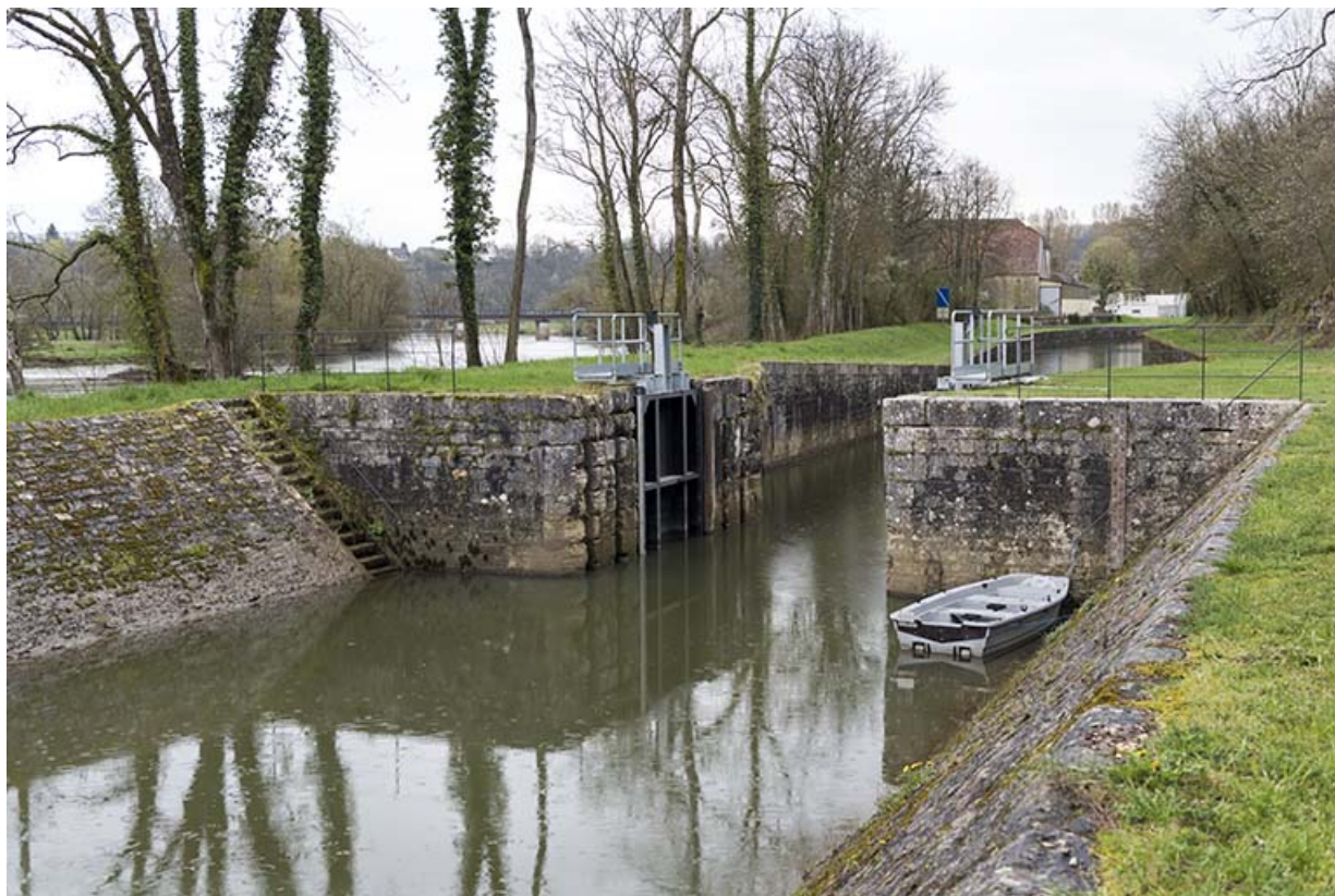
La maçonnerie de la porte de garde.