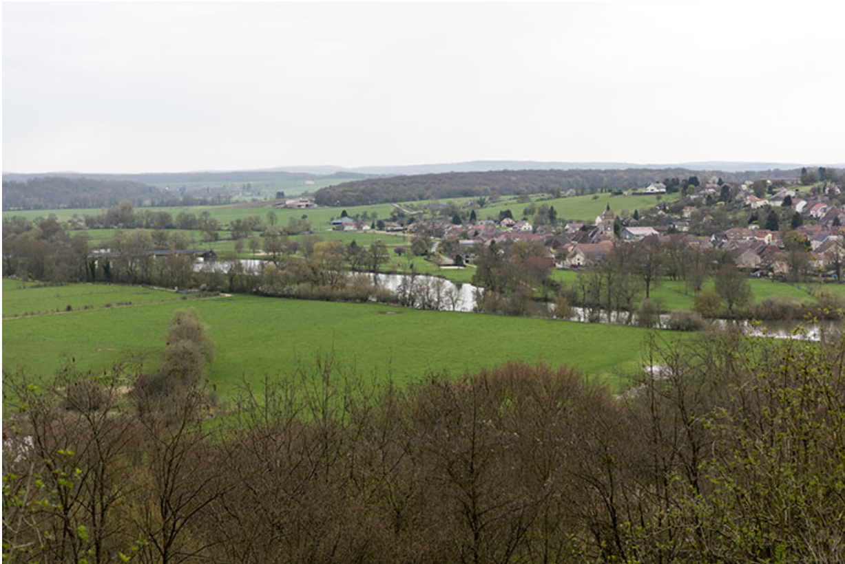
Le village de Soing et la Saône.