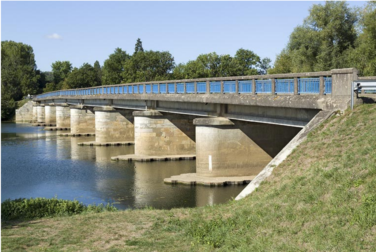
Le pont enjambant la Saône permettant de rejoindre le bourg de Soing. 70, Soing-Cubry-Charentenay