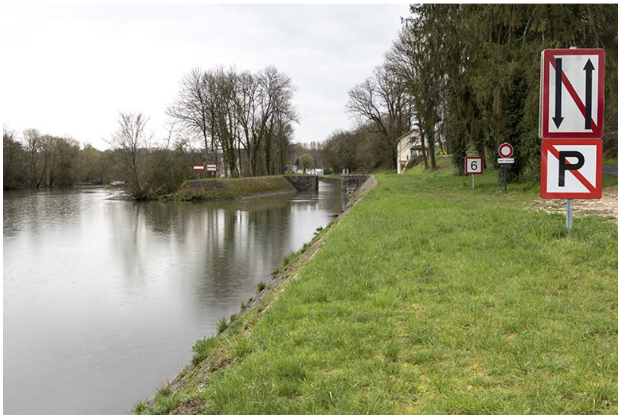
La porte de garde de Soing. 70, Soing-Cubry-Charentenay