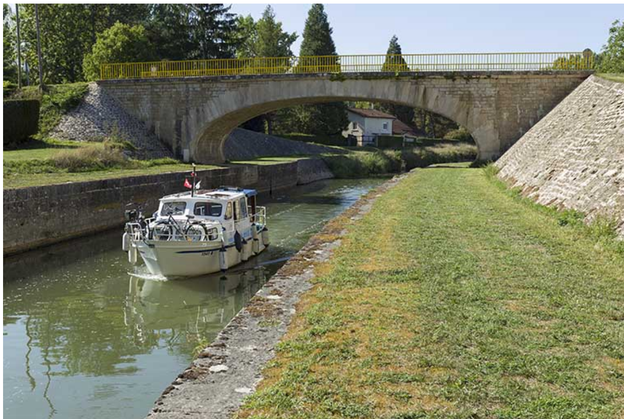
Bateau navigant sur le canal à hauteur de Soing.