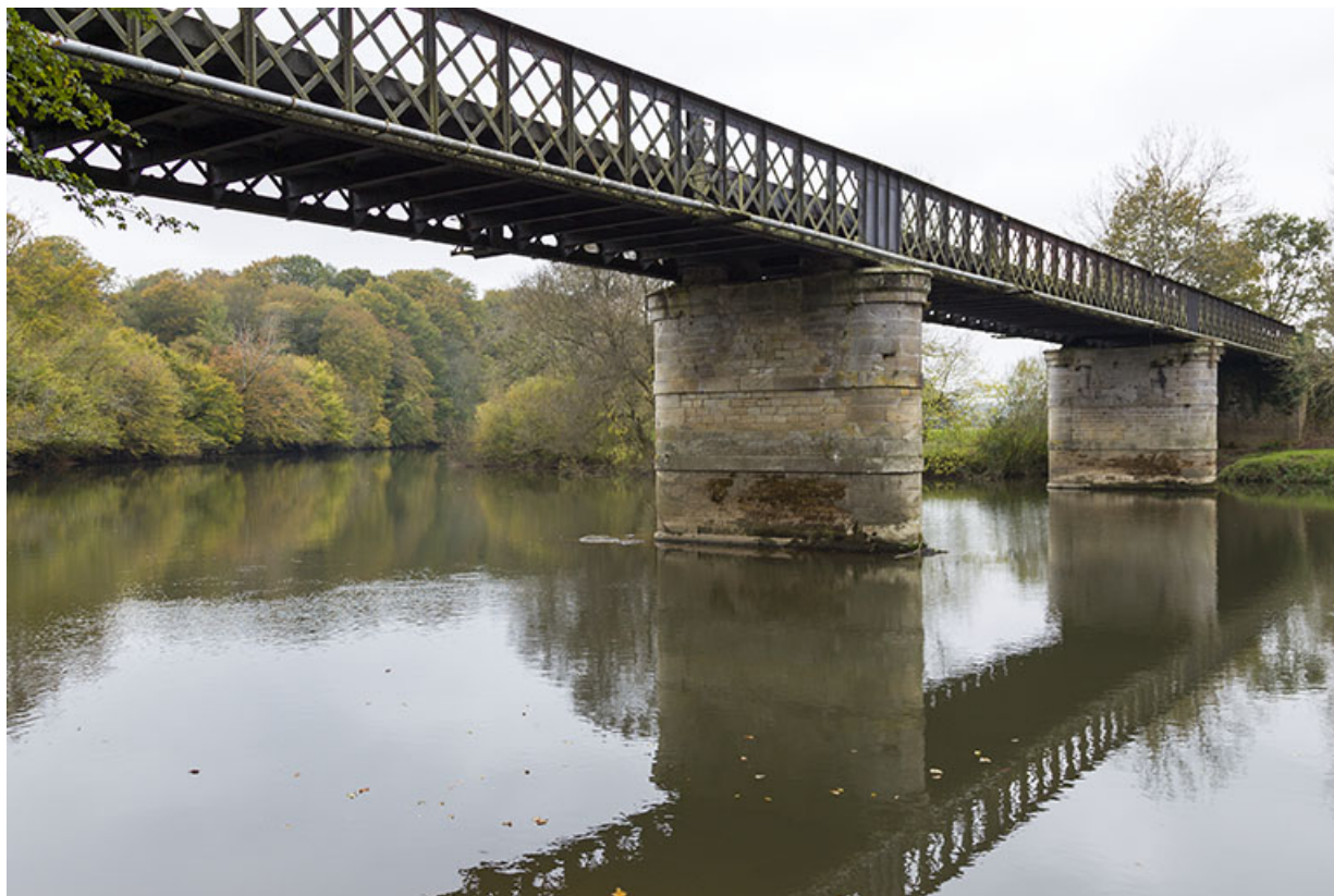
Détail du tablier métallique et des piles maçonnées.