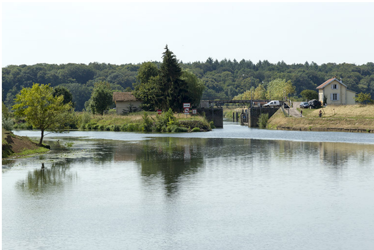
Entrée du canal de navigation de Cubry-lès-Soing.