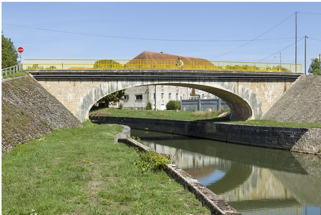
Vue générale de l'édifice depuis l'aval.