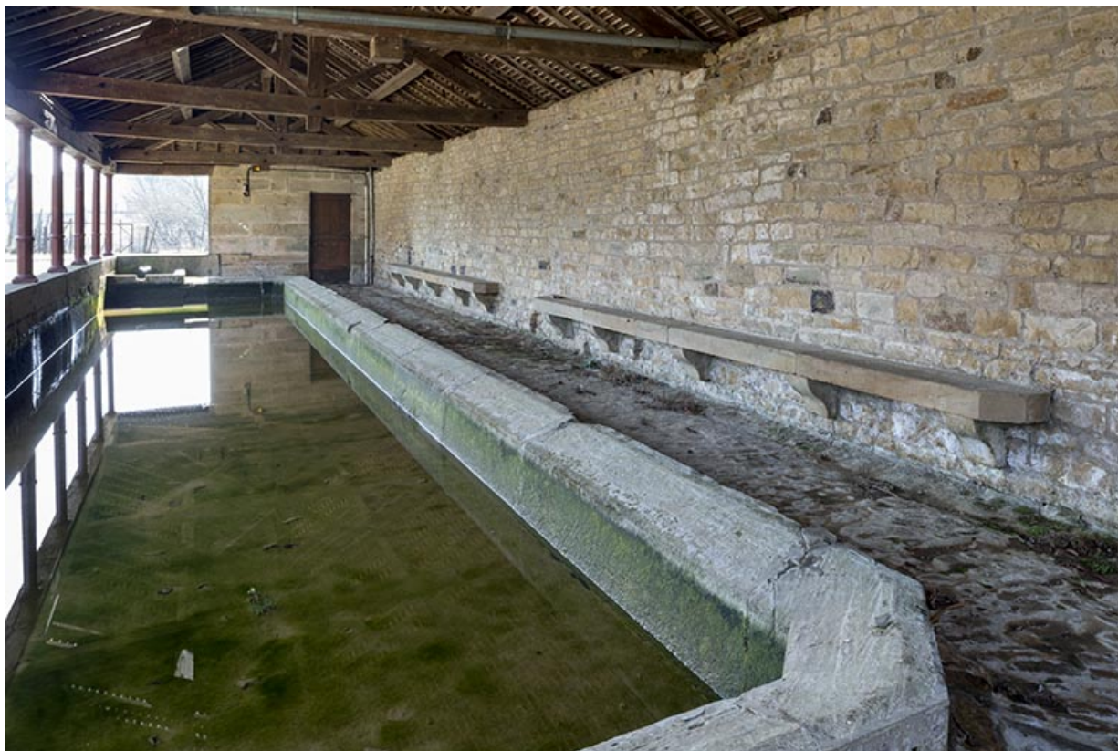
Vue intérieure du lavoir à l'entrée sud-est du village 70, Cendrecourt