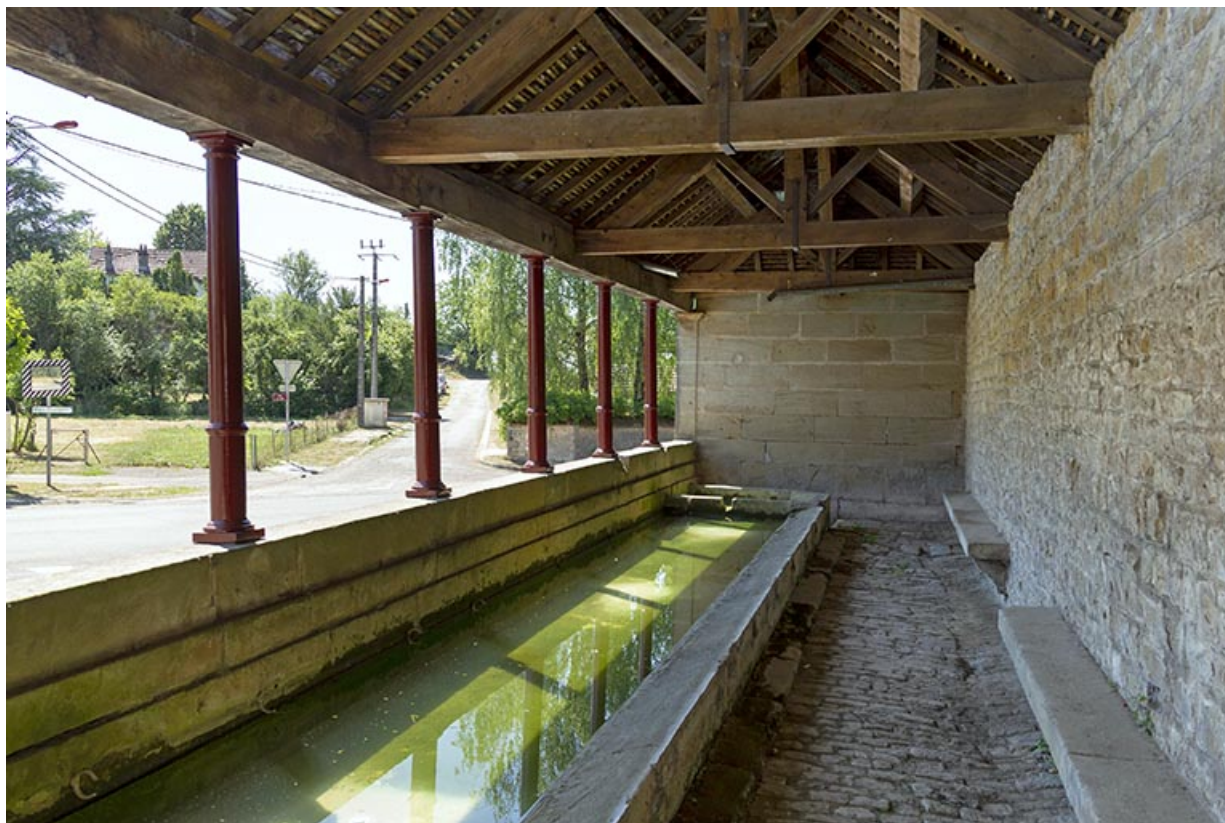
Vue intérieure du lavoir à l'entrée sud-ouest du village. 70, Cendrecourt