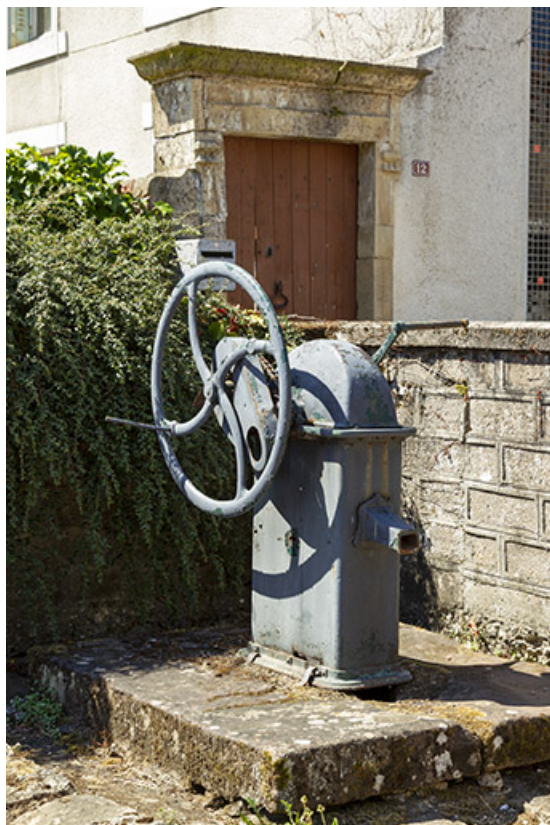
Fontaine à bras 12 rue du jardiney. 70, Cendrecourt