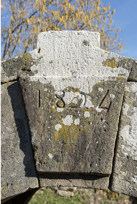
Date à la clé de de l'édicule sur la source joutant le lavoir. 70, Cendrecourt