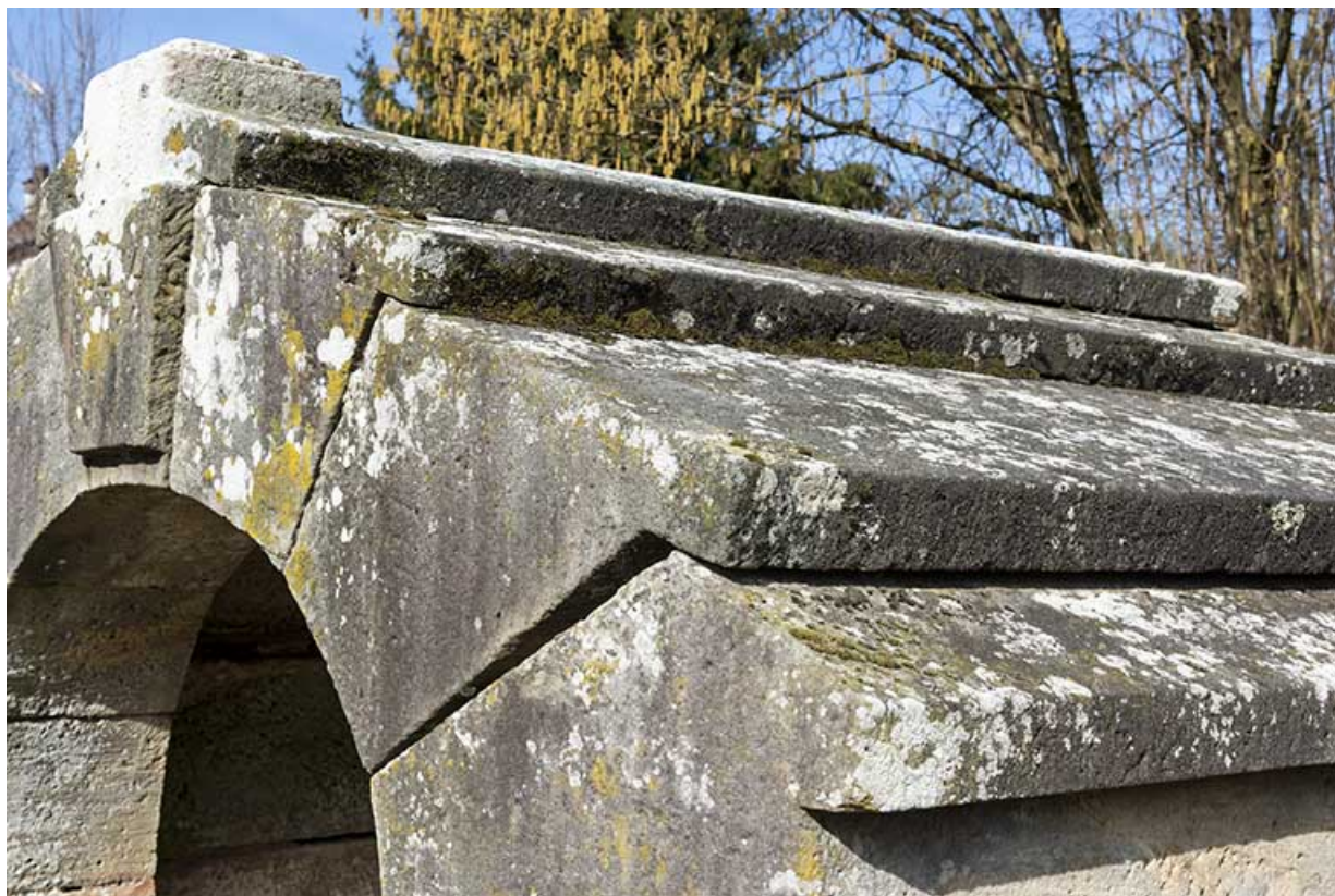
Vue de trois-quart de l'édicule sur la source jouxtant le lavoir. 70, Cendrecourt