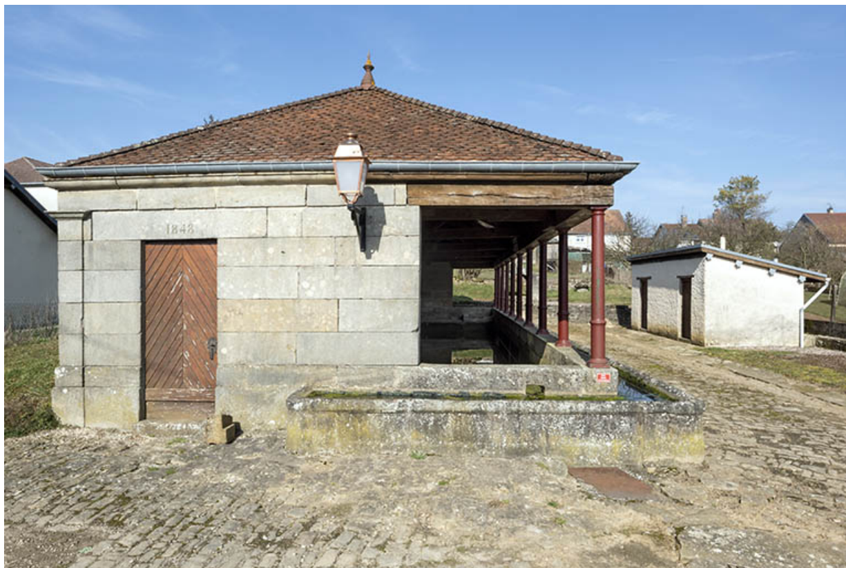
Vue rapprochée du fronton sud du lavoir à l'entrée sud-est du village. 70, Cendrecourt