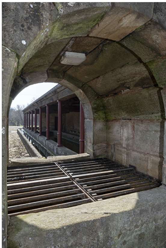
Vue du lavoir depuis l'édicule abritant la source. 70, Cendrecourt