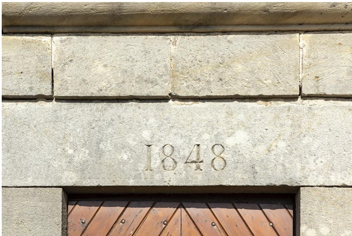
Vue rapprochée du linteau daté de la porte d'entrée du lavoir à l'entrée sud-est du village. 70, Cendrecourt