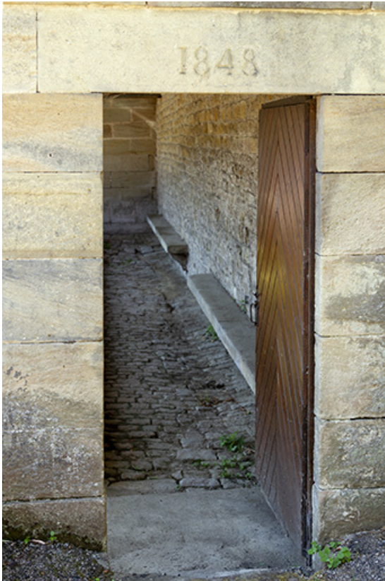
Porte et date portée au linteau du lavoir à l'entrée sud-ouest du village. 70, Cendrecourt