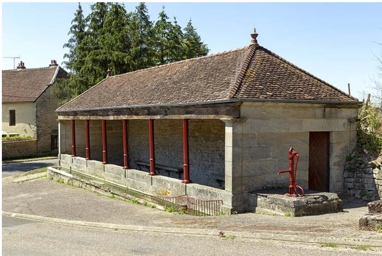
Vue rapprochée de trois-quart nord-est du lavoir à l'entrée sud-ouest du village. 70, Cendrecourt