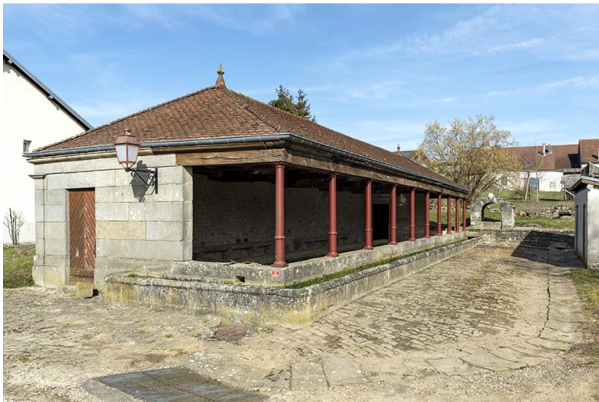
Vue de trois-quart sud-est du lavoir à l'entrée sud-est du village. 70, Cendrecourt