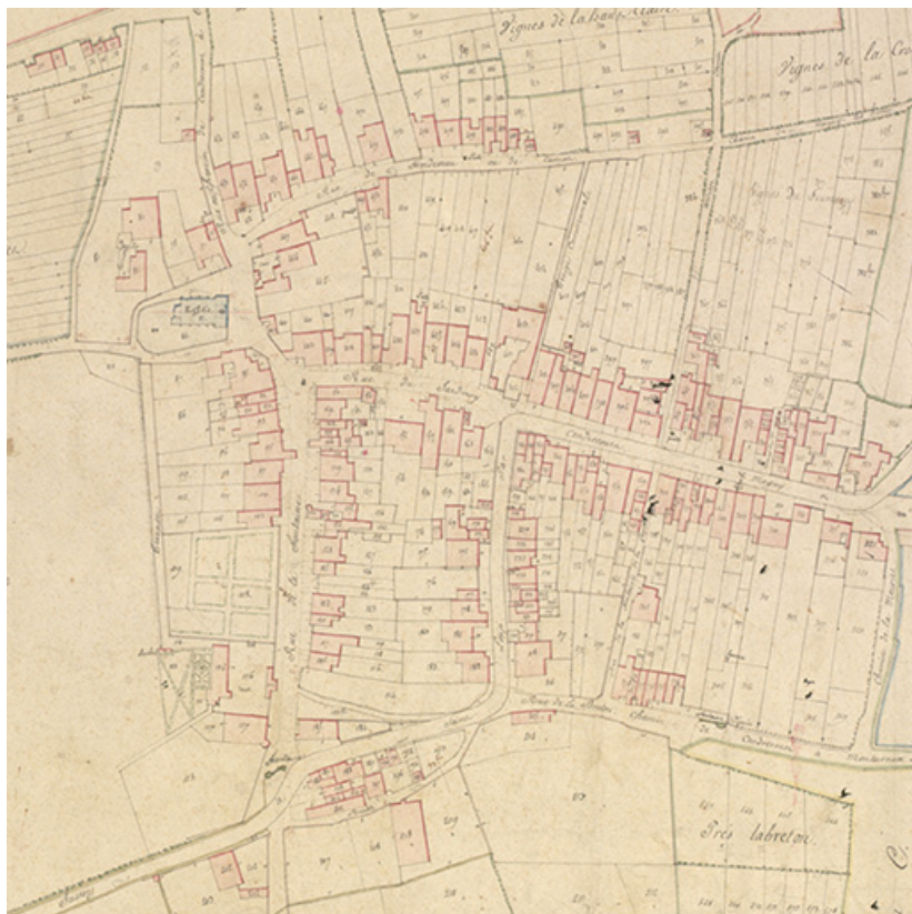
Extrait du cadastre napoléonien terminé le 25 septembre 1819. Section D dite du village. 70, Cendrecourt impasse de l'église