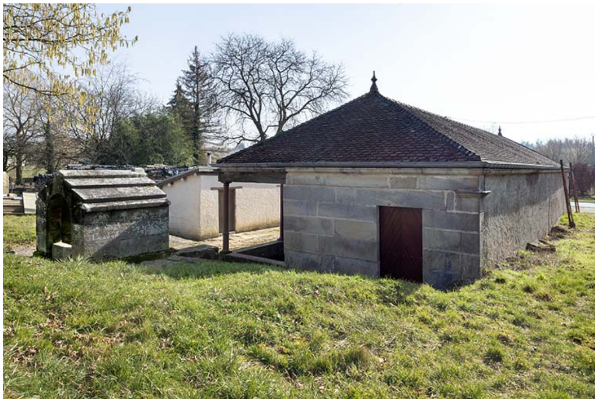
Vue de trois-quart nord-ouest du lavoir à l'entrée sud-est du village. 70, Cendrecourt