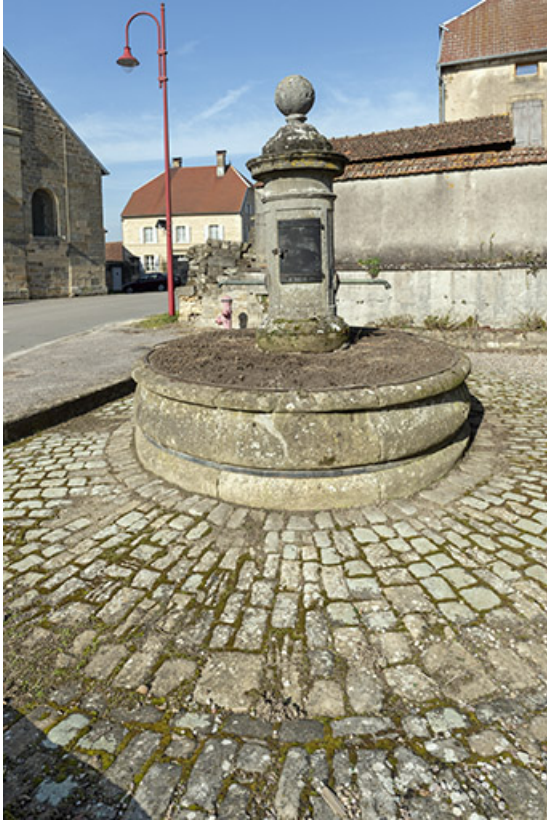
Ancienne fontaine remployée. (au nord-ouest de l'hôtel de ville) Vue du sud-est. 70, Cendrecourt