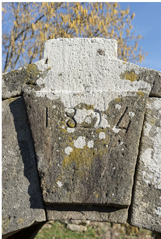
Date à la clé de de l'édicule sur la source juxtant le lavoir. 70, Cendrecourt