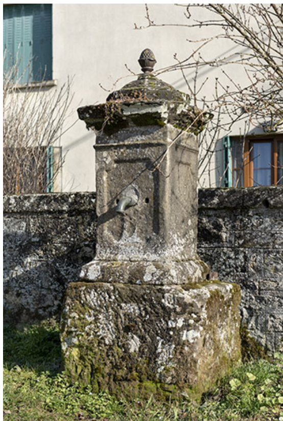
Fontaine à l'angle de la rue de Magny et du chemin de la Chapelle. 70, Cendrecourt