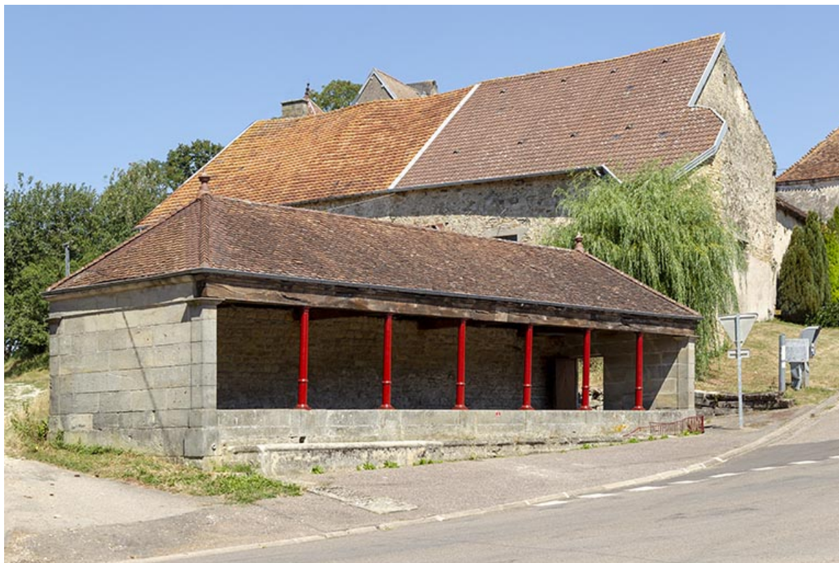
Vue de trois-quart sud du lavoir à l'entrée sud-ouest du village. 70, Cendrecourt