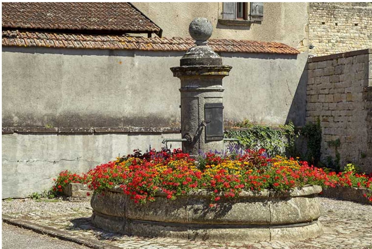
Ancienne fontaine réemployée. (au nord-ouest de l'hôtel de ville) Vue rapprochée du sud-ouest. 70, Cendrecourt