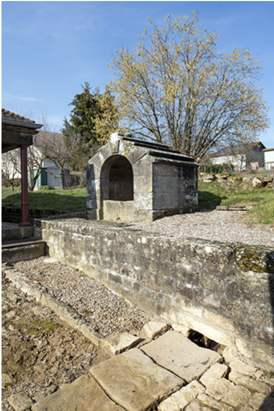
Vue de trois quart sud-est de l'édicule sur la source jouxtant le lavoir. 70, Cendrecourt