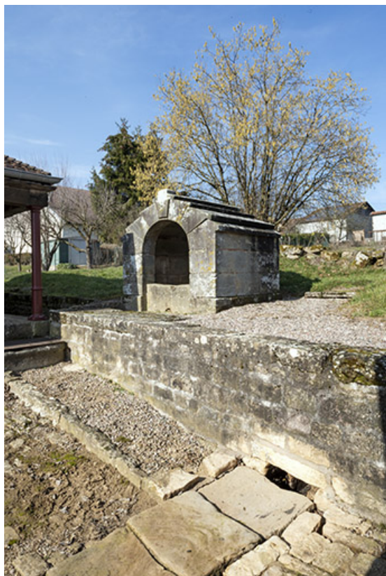
Vue de trois quart sud-est de l'édicule sur la source jouxtant le lavoir. 70, Cendrecourt