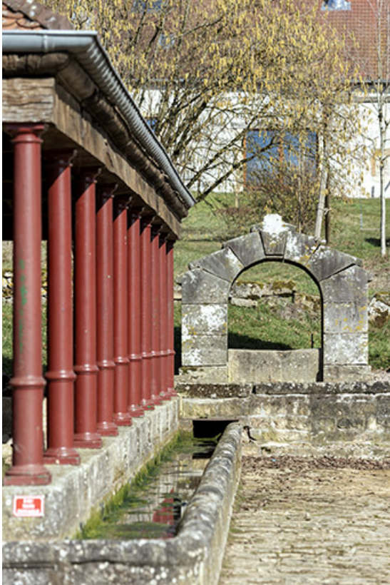
Vue de la colonnade du lavoir à l'entrée sud-est du village, depuis le sud. 70, Cendrecourt