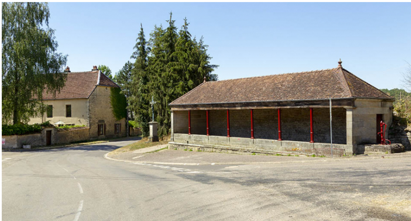
Vue de trois-quart nord-est du lavoir à l'entrée sud-ouest du village. 70, Cendrecourt