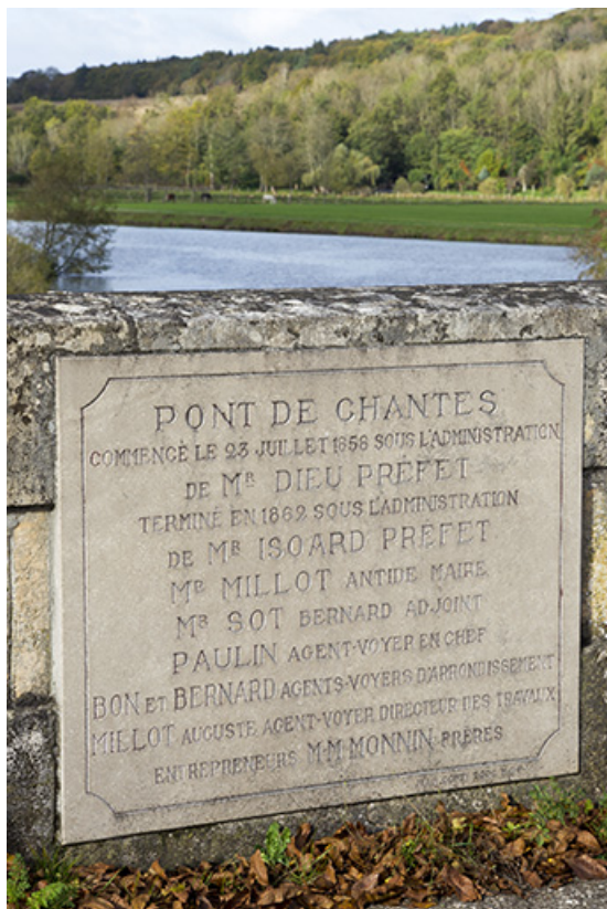
Plaque commémorative sur la construction de l'édifice. 70, Chantes