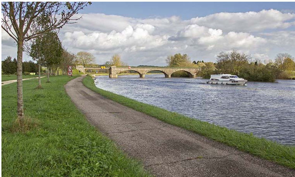
Vue depuis l'aval.