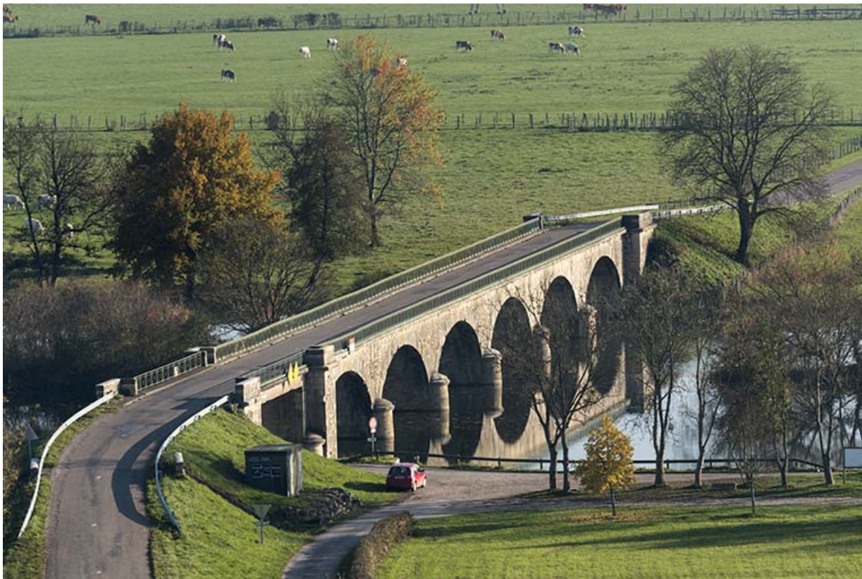
Vue générale du pont depuis le château de Rupt-sur-Saône. 70, Chantes