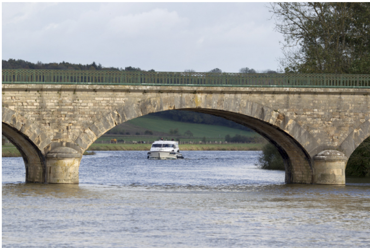
Détail d'une arche maçonnée du pont.