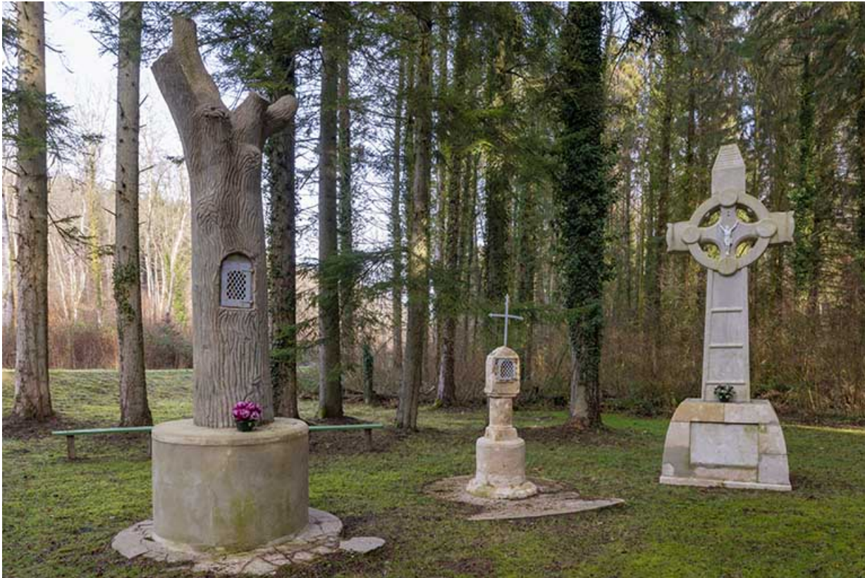
Tronc d'arbre artificiel, édicule à niche et croix monumentale.

70, Scey-sur-Saône-et-Saint-Albin, lieudit : Bois du prince de Bauffremont