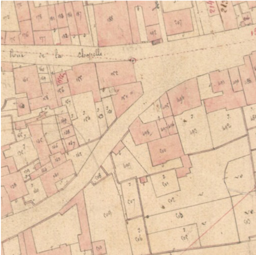
Extrait de l'Atlas parcellaire (1836) du cadastre de la commune de Scey-sur-Saône-et-Saint-Albin. 70, Scey-sur-Saône-et-Saint-Albin, 8 rue de l'Église