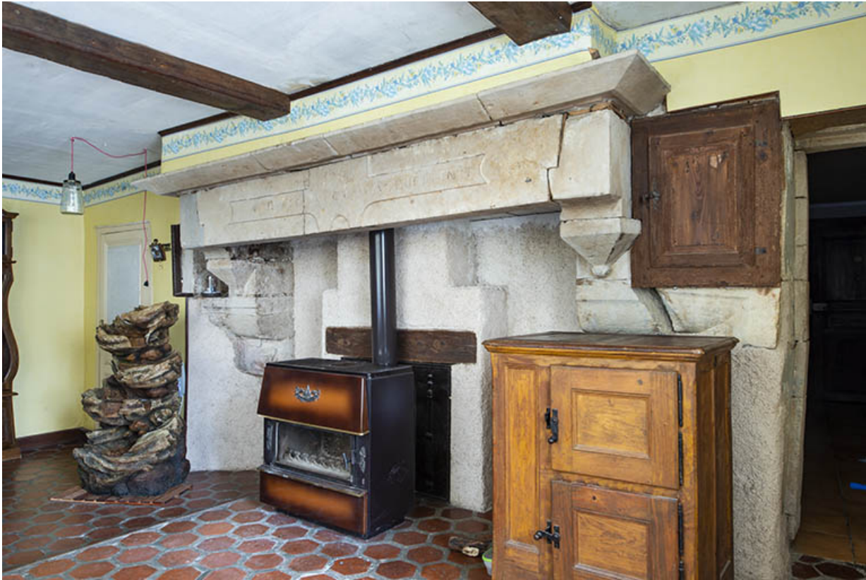
La cheminée de la pièce principale.

70, Scey-sur-Saône-et-Saint-Albin, 8 rue de l' Église