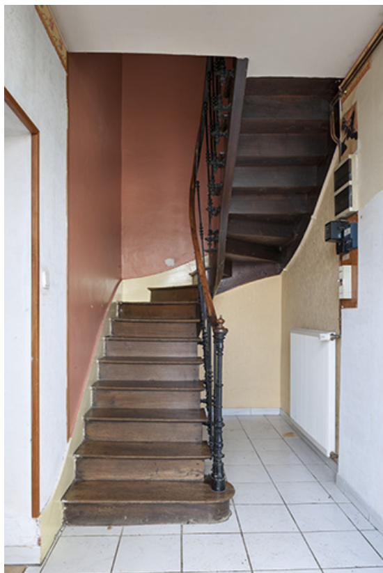
Escalier, vue d'ensemble.