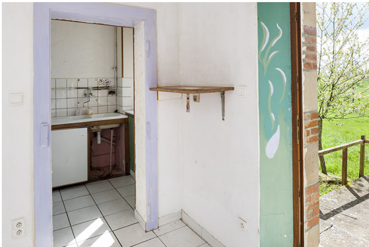
Arrière-cuisine, maison du barragiste. 70, Montureux-lès-Baulay