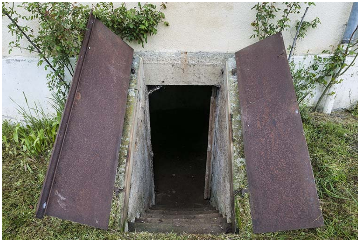
Porte d'accès à la cave, maison du barragiste.