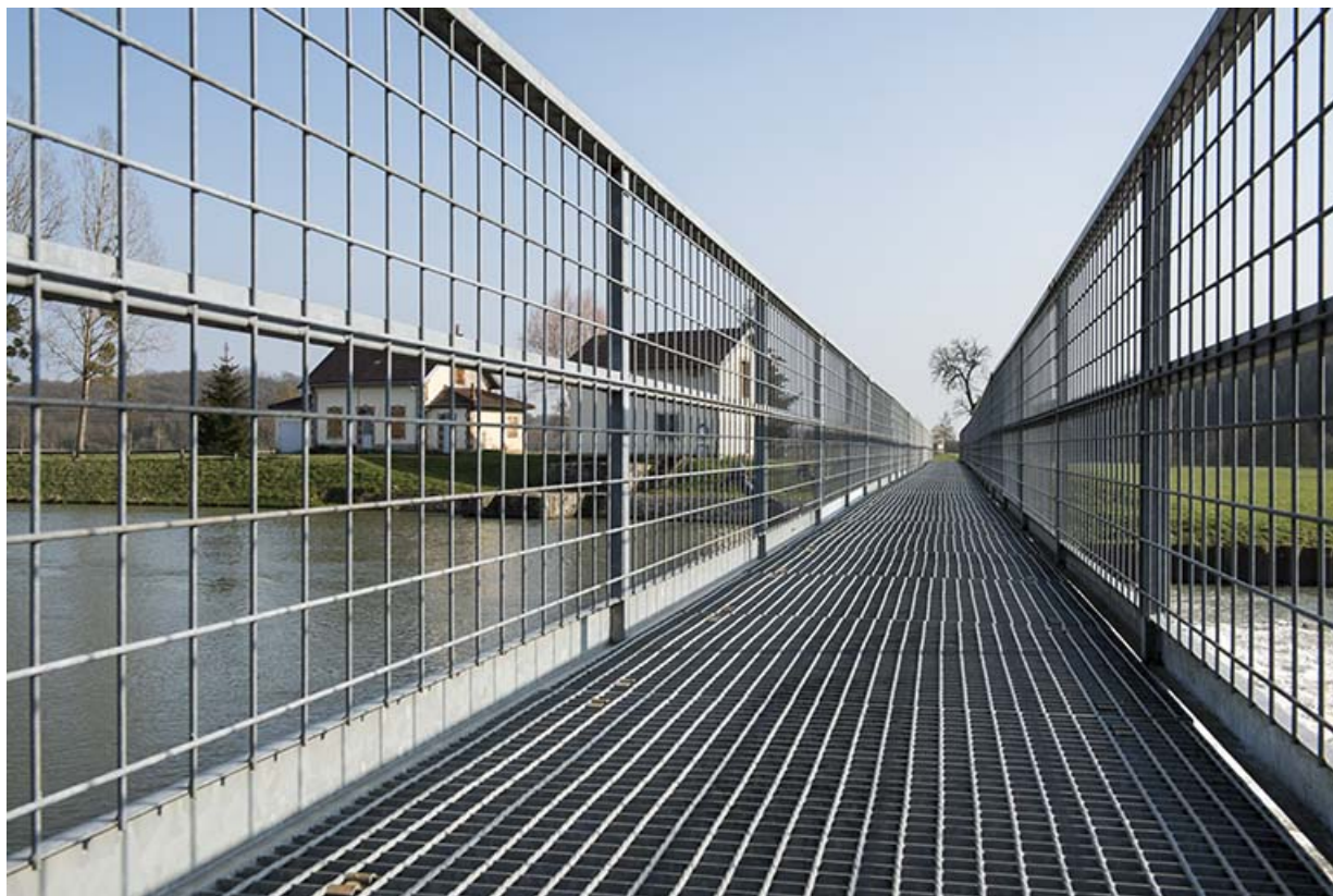
Passerelle du barrage. 70, Montureux-lès-Baulay