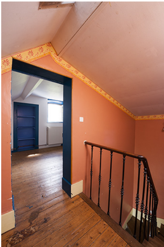
Palier de l'étage, maison du barragiste. 70, Montureux-lès-Baulay