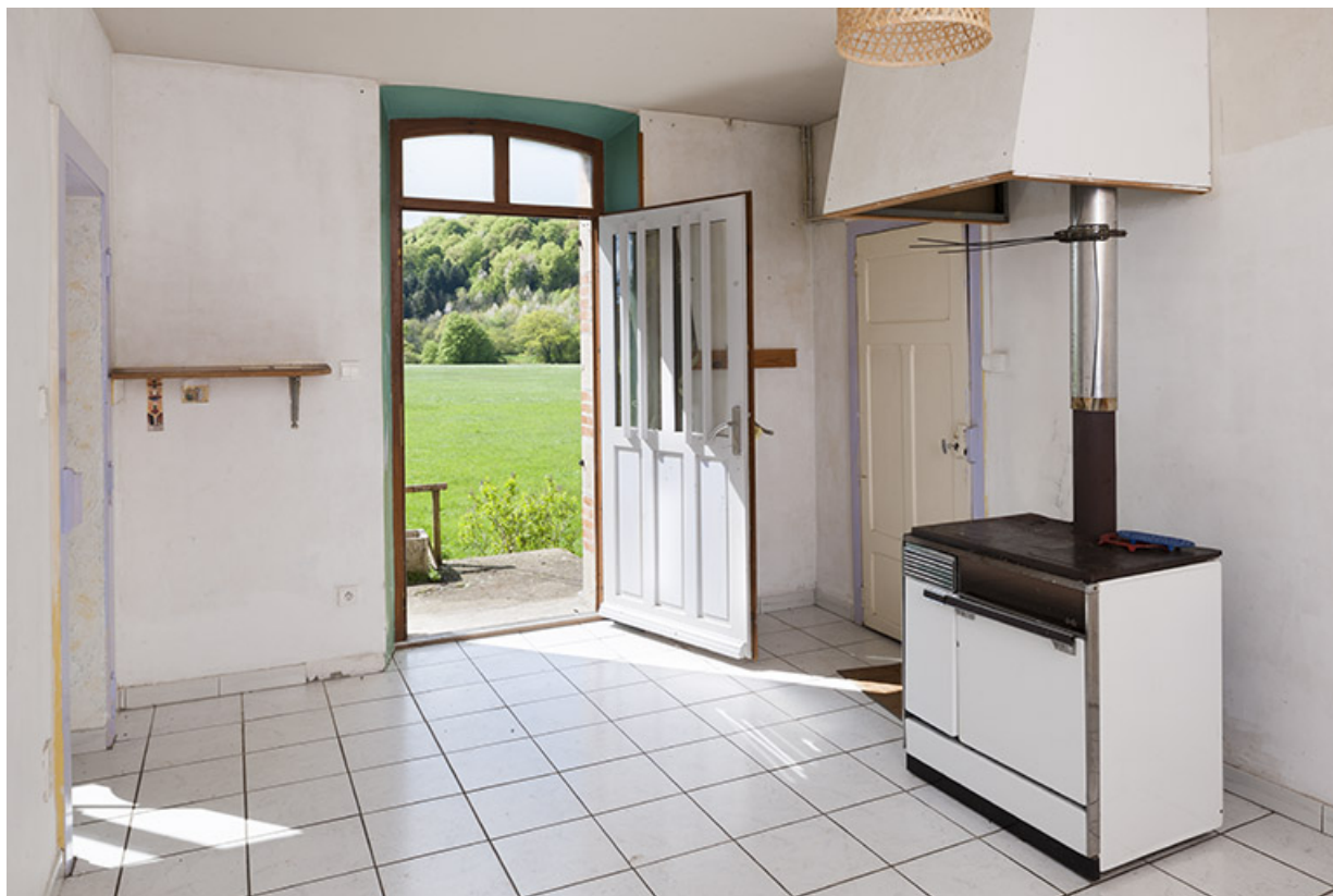
Cuisine et salle à manger, maison du barragiste.