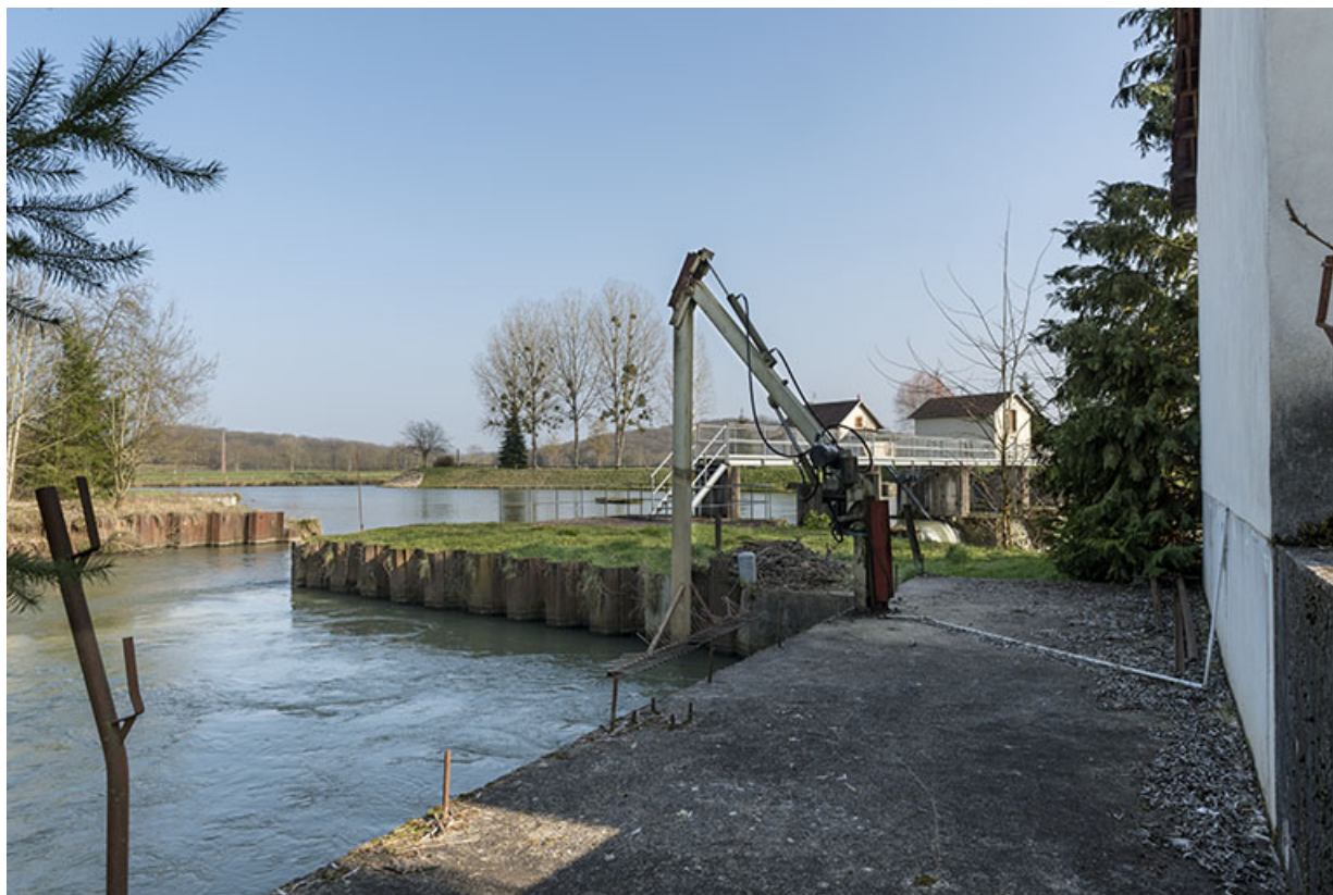
Outil situé au niveau de la centrale hydroélectrique.