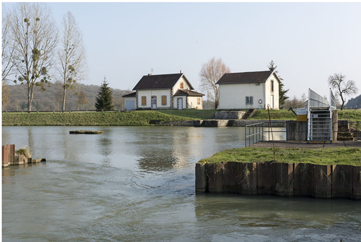
Vue du site du barrage depuis la rive sur la commune de Gevigney-et-Mercey.