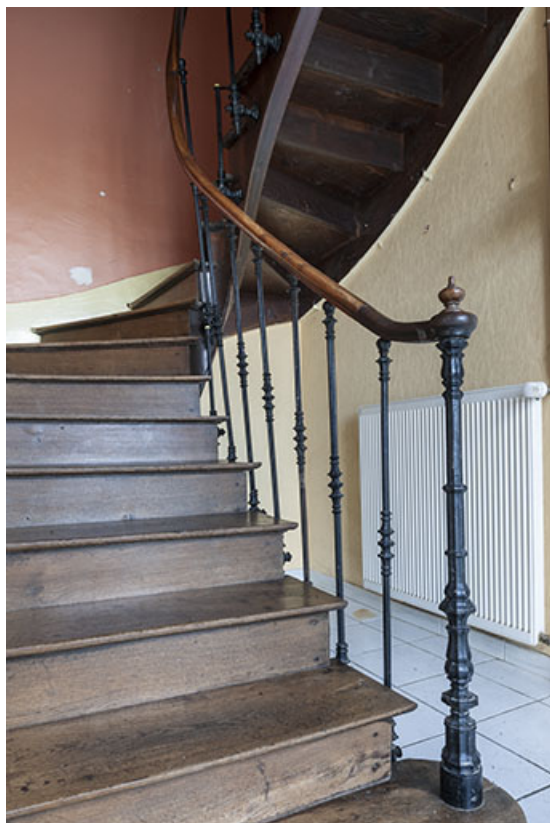
Détail de la première volée de l'escalier, maison du barragiste. 70, Montureux-lès-Baulay