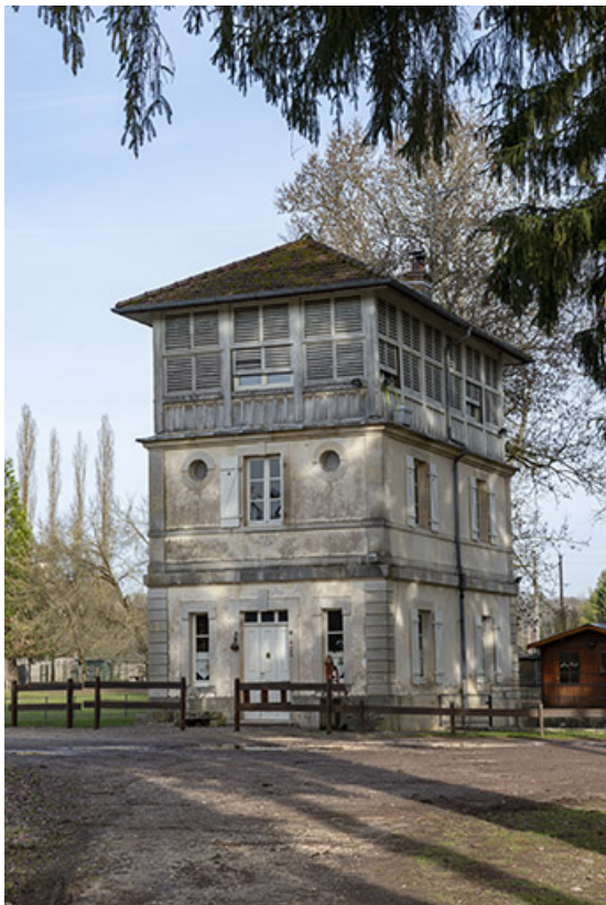
Façade sud-est et façade sud-ouest.

70, Scey-sur-Saône-et-Saint-Albin rue de Saint-Albin, lieudit : Bois du prince de Bauffremont