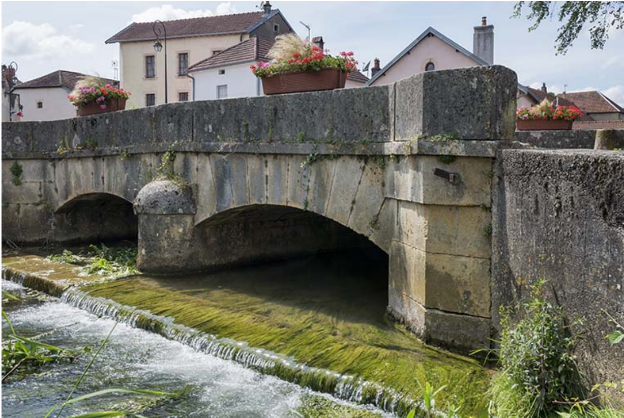
Face sud, vue depuis l'est.

70, Sceaux-sur-Saône-et-Saint-Albin rue de la Motte, lieu-dit : La Motte