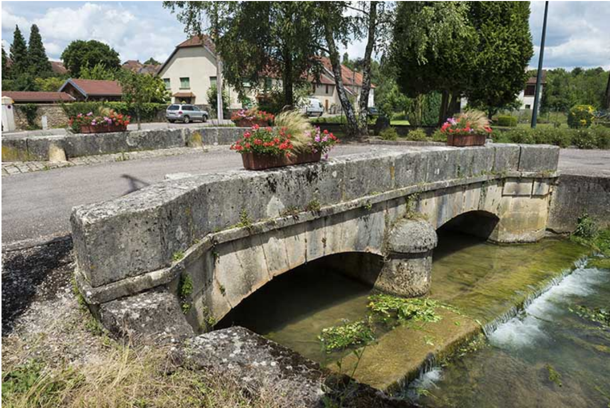
Face sud, vue depuis l'ouest.

70, Sceaux-sur-Saône-et-Saint-Albin rue de la Motte, lieu-dit : La Motte