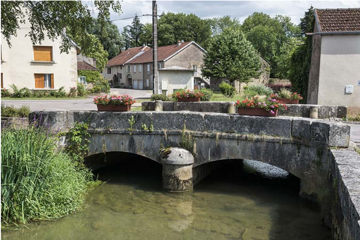
Face nord, vue depuis le nord.

70, Scey-sur-Saône-et-Saint-Albin rue de la Motte, lieudit : La Motte