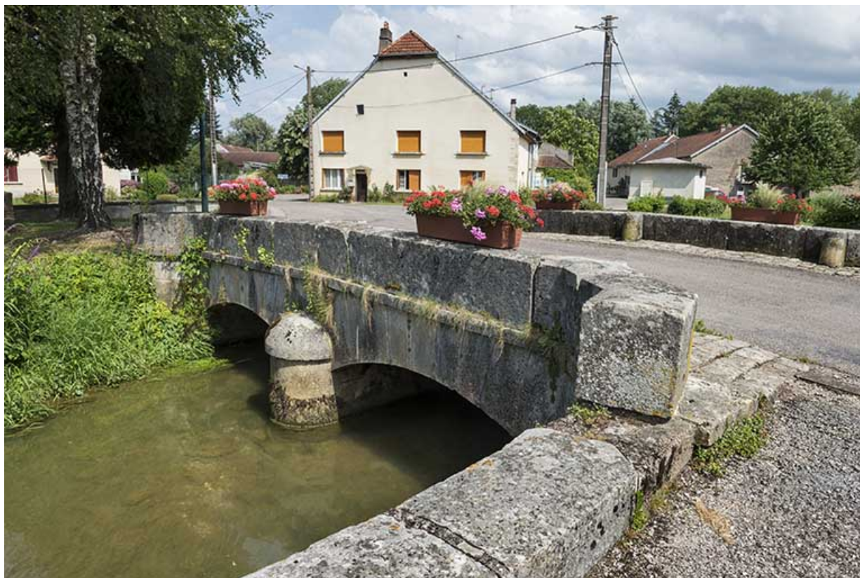
Face nord, vue depuis l'ouest.

70, Scey-sur-Saône-et-Saint-Albin rue de la Motte, lieudit : La Motte