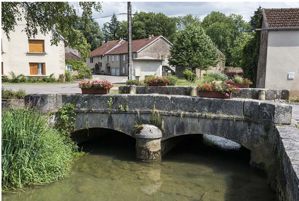
Face nord, vue depuis le nord.

70, Scey-sur-Saône-et-Saint-Albin rue de la Motte, lieudit : La Motte