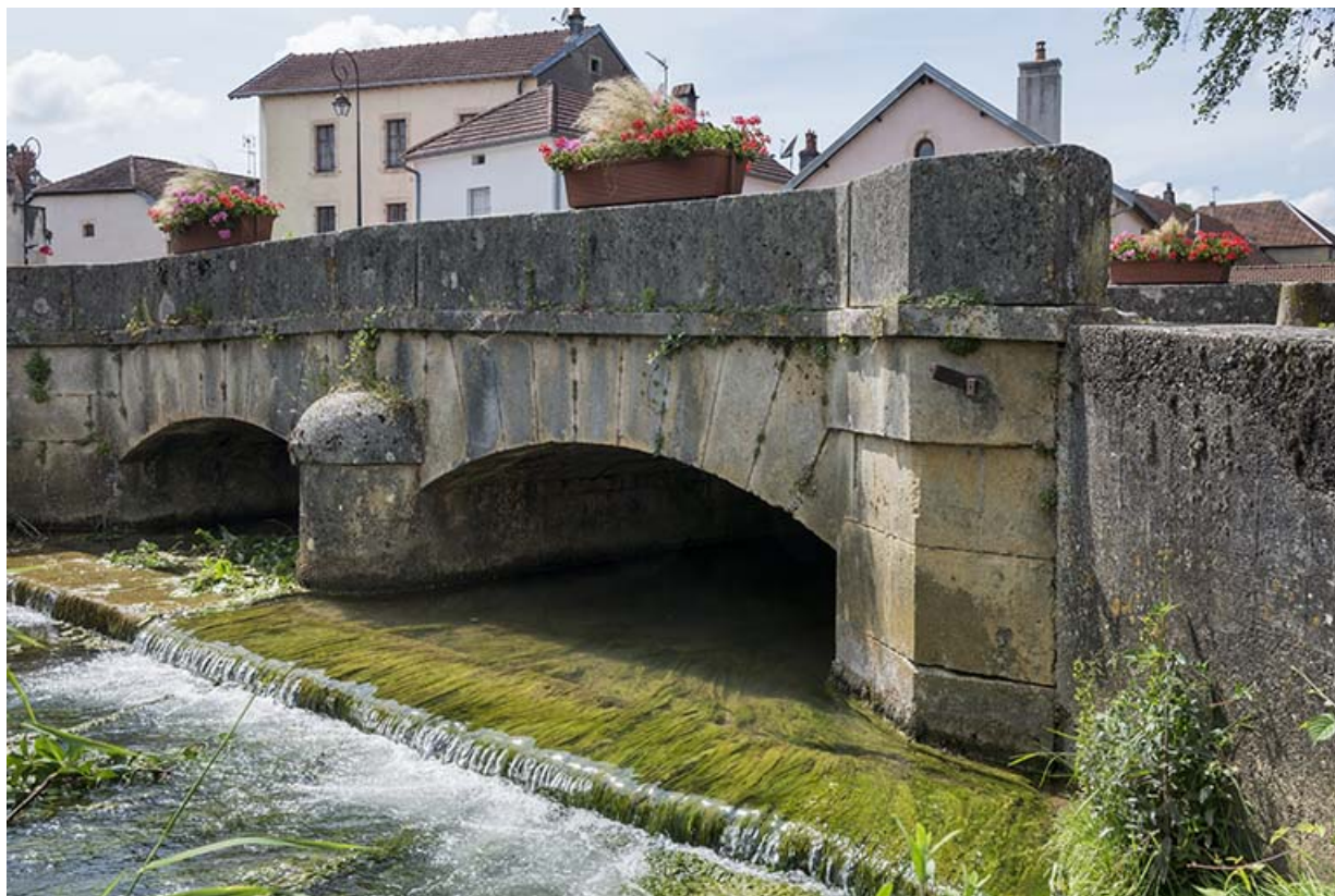
Face sud, vue depuis l'est.

70, Sceaux-sur-Saône-et-Saint-Albin rue de la Motte, lieu-dit : La Motte