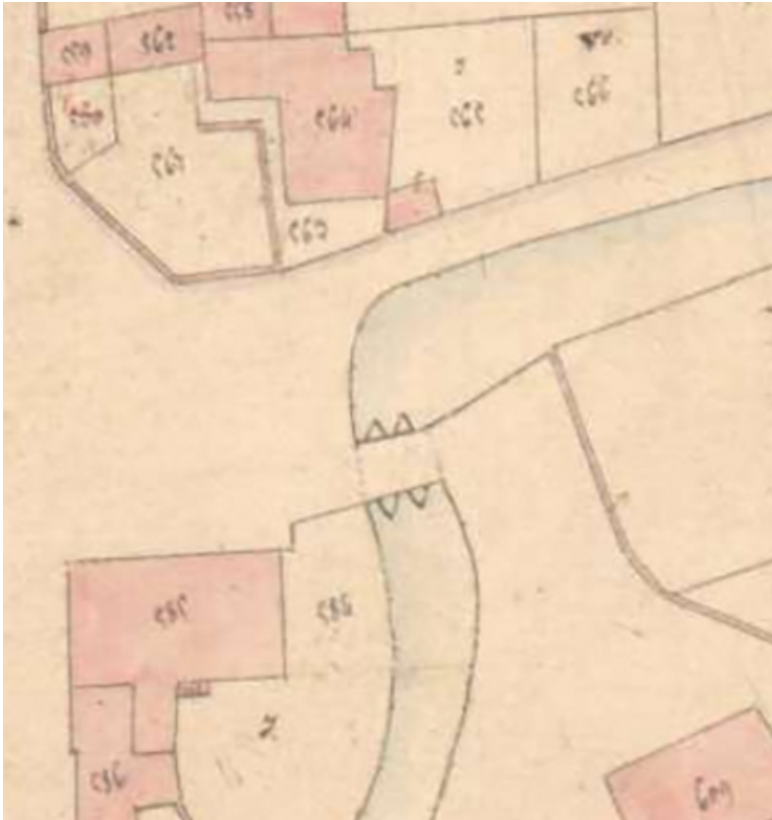
Extrait de l'Atlas parcellaire (1836) du cadastre de la commune de Scey-sur-Saône-et-Saint-Albin. 70, Scey-sur-Saône-et-Saint-Albin rue de la Motte, lieudit : La Motte