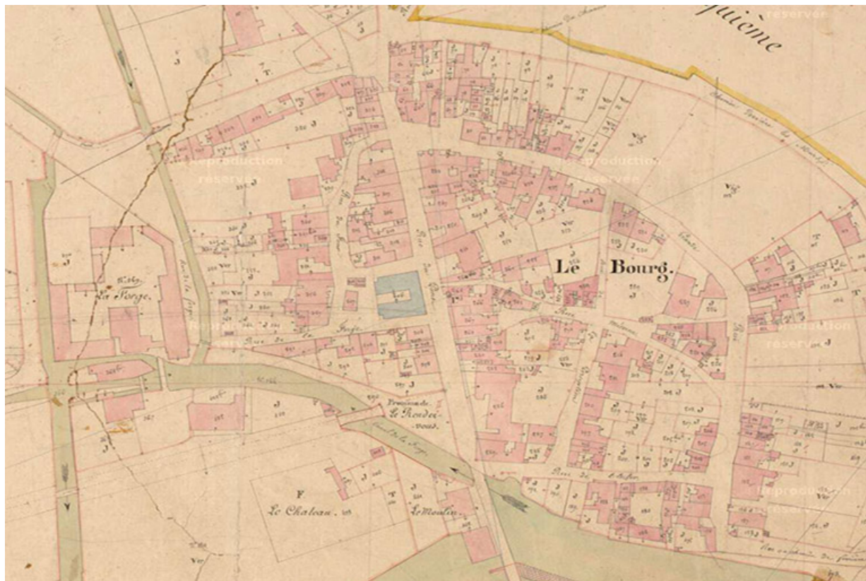
Extrait de l'Atlas parcellaire (1836) du cadastre de la commune de Scy-sur-Saône-et-Saint-Albin. 70, Scy-sur-Saône-et-Saint-Albin rue Armand Paulmard, lieudit : le Bourg