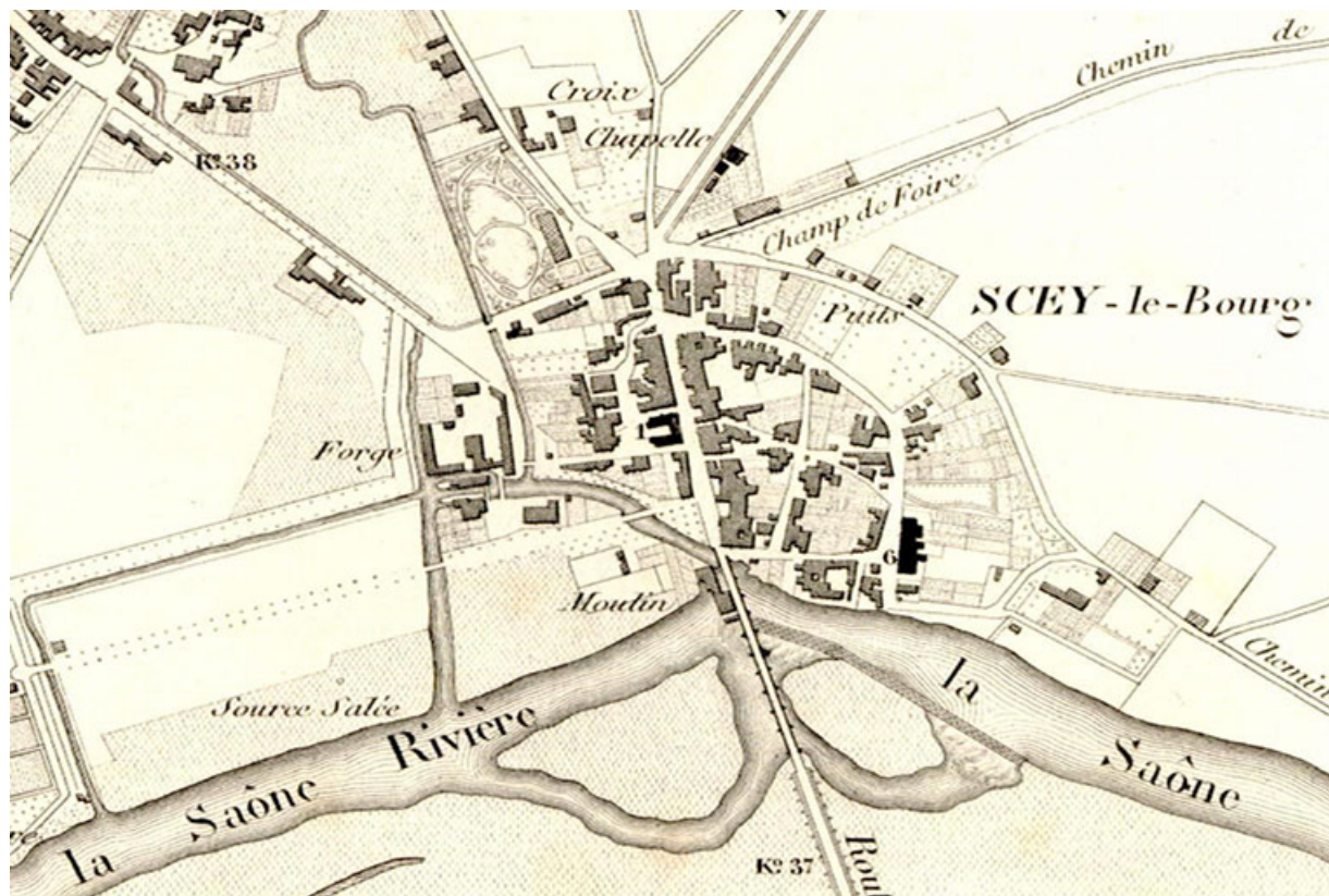
Plan de Sceaux-sur-Saône. In : Dieu, Hyppolite. Atlas cantonal de la Haute-Saône, 1858.

70, Sceaux-sur-Saône-et-Saint-Albin rue Armand Paulmard, lieudit : le Bourg