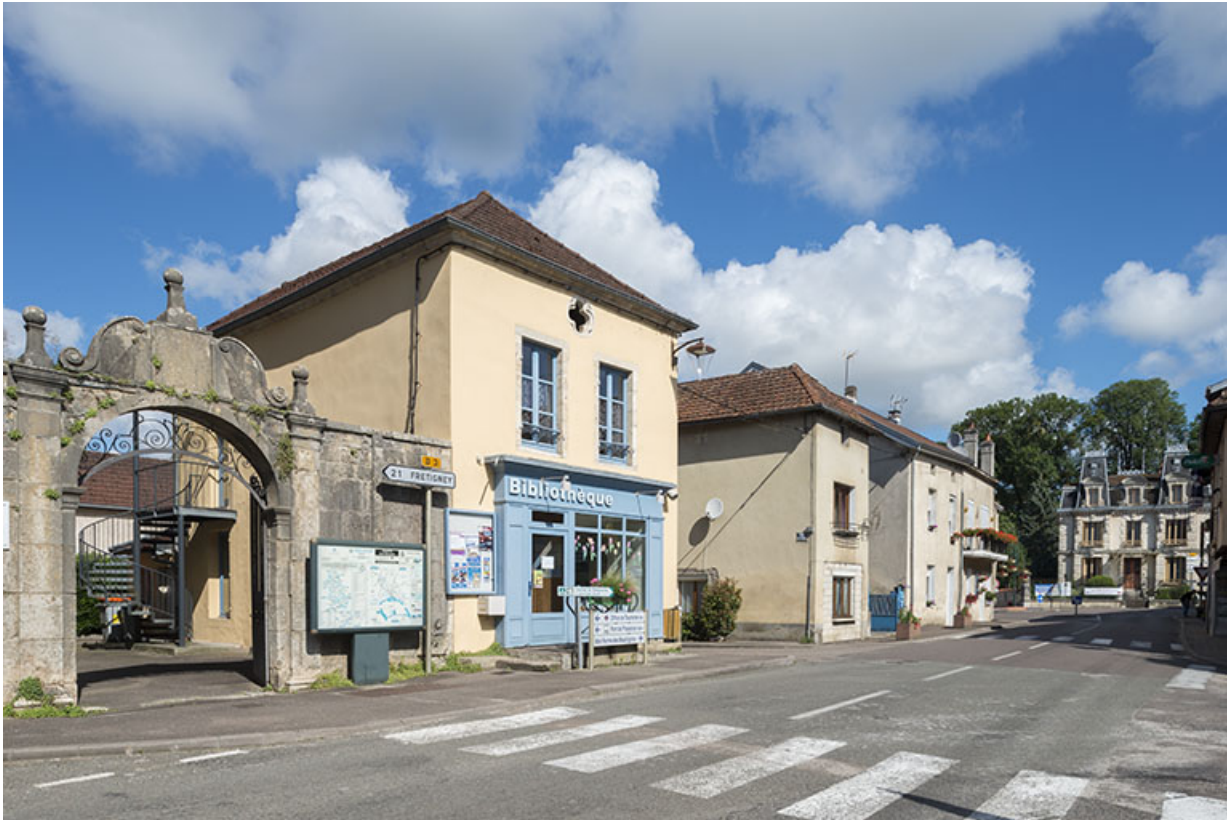
Extrémité nord de la rue Armand Paulmard, en direction de la porte du bourg (détruite). 70, Scey-sur-Saône-et-Saint-Albin rue Armand Paulmard, lieudit : le Bourg