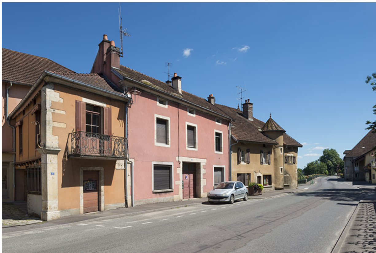
Extrémité sud de la rue Armand Paulmard, en direction du pont sur la Saône. 70, Sceaux-sur-Saône-et-Saint-Albin rue Armand Paulmard, lieudit : le Bourg