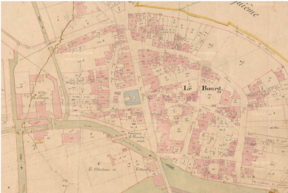
Extrait de l'Atlas parcellaire (1836) du cadastre de la commune de Scy-sur-Saône-et-Saint-Albin. 70, Scy-sur-Saône-et-Saint-Albin rue Armand Paulmard, lieudit : le Bourg