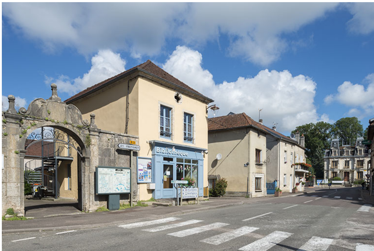
Extrémité nord de la rue Armand Paulmard, en direction de la porte du bourg (détruite).

70, Scey-sur-Saône-et-Saint-Albin rue Armand Paulmard, lieudit : le Bourg