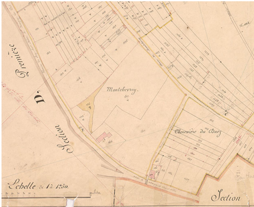
Extrait de l'Atlas parcellaire (1836) du cadastre de la commune de Scey-sur-Saône-et-Saint-Albin. 70, Scey-sur-Saône-et-Saint-Albin, 16 rue du Duez, lieudit : Montchevrey