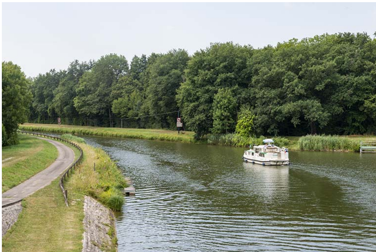
Plaisanciers en direction du site d'écluse de Scey.