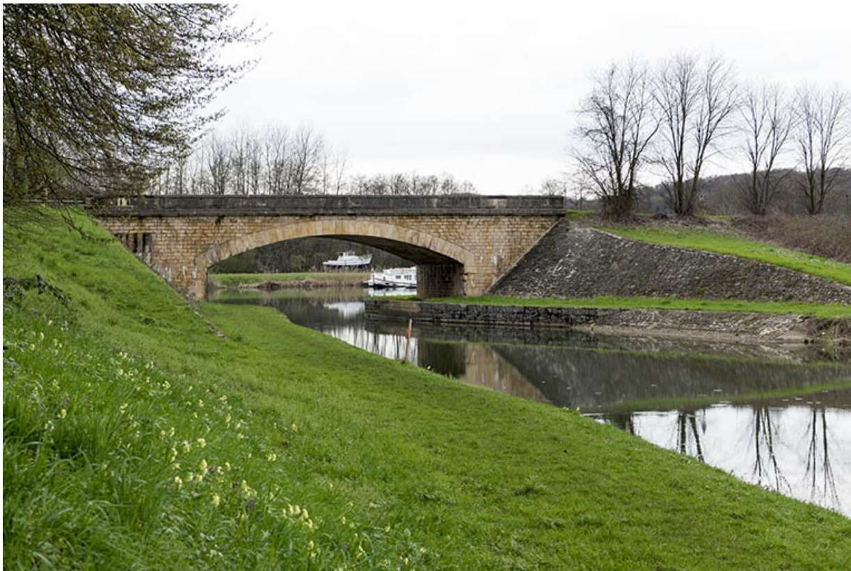
Le pont de chassey construit en 1878.