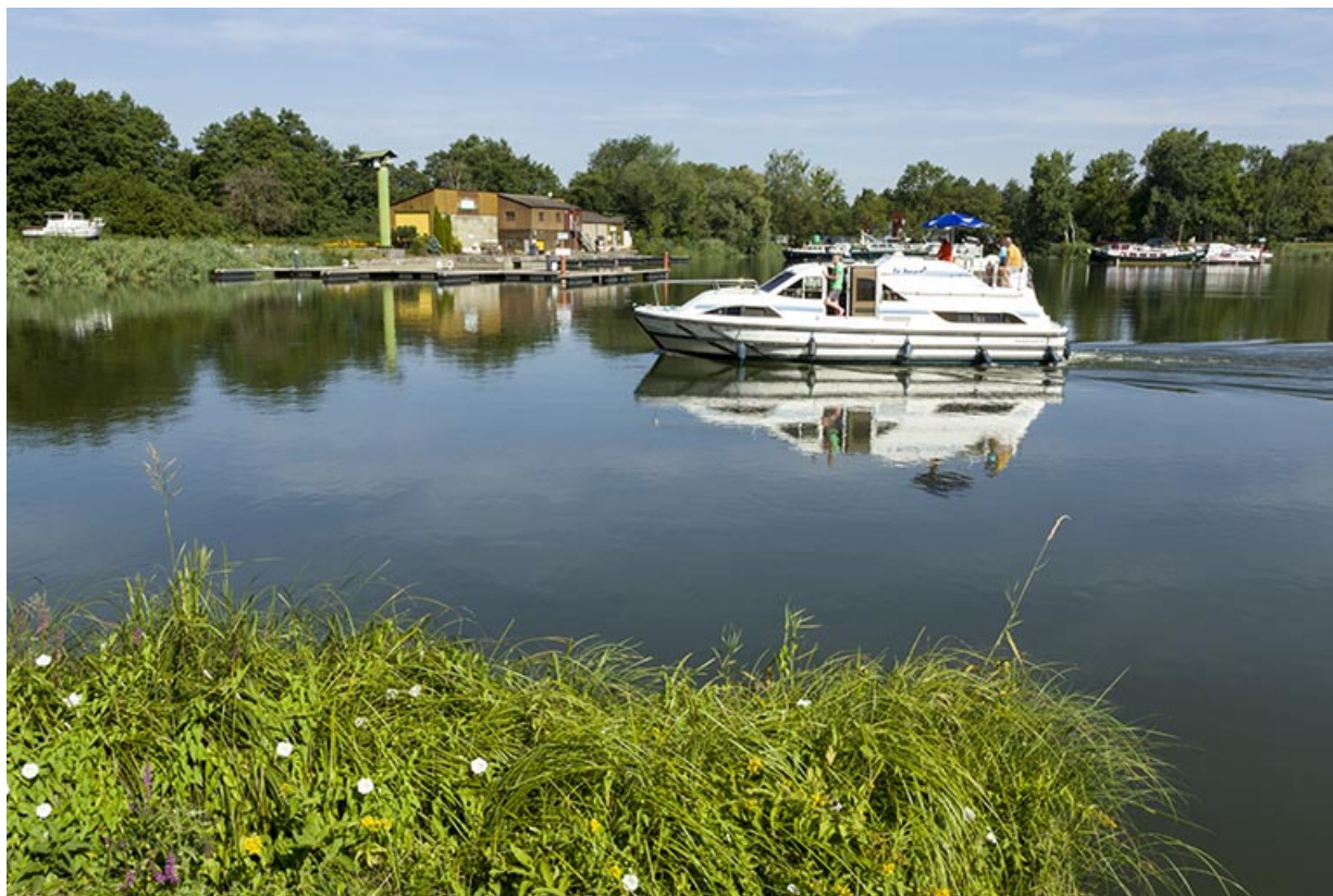
Bateau de plaisance empruntant la dérivation.