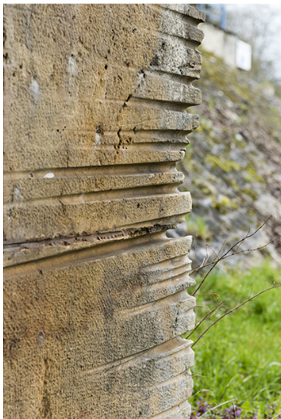
Traces des cordes utilisées lors du halage des bateaux.