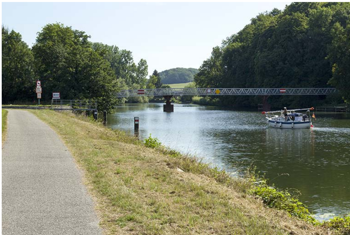
Entrée aval de la dérivation de Chemilly et une passerelle surmontant la Saône. 70, Sceaux-sur-Saône-et-Saint-Albin