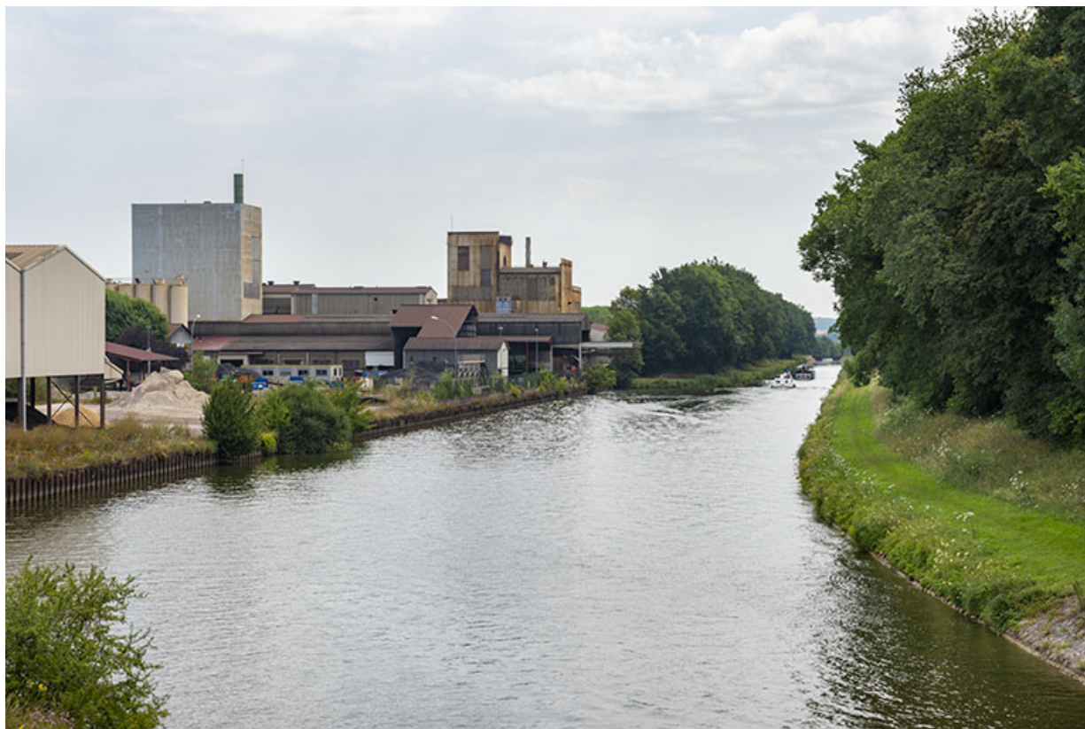
Site industriel situé le long du canal de navigation de Scey-sur-Saône. 70, Scey-sur-Saône-et-Saint-Albin