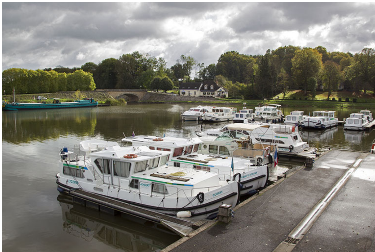
Le port de plaisance de Scey-sur-Saône-et-Saint-Albin.