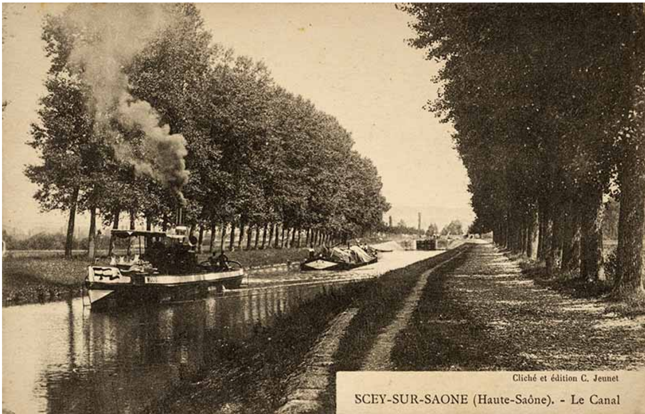
Le canal de navigation, carte postale. 70, Sceaux-sur-Saône-et-Saint-Albin