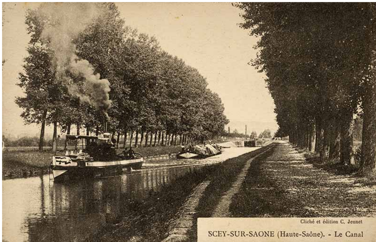
Le canal de navigation, carte postale. 70, Sceaux-sur-Saône-et-Saint-Albin