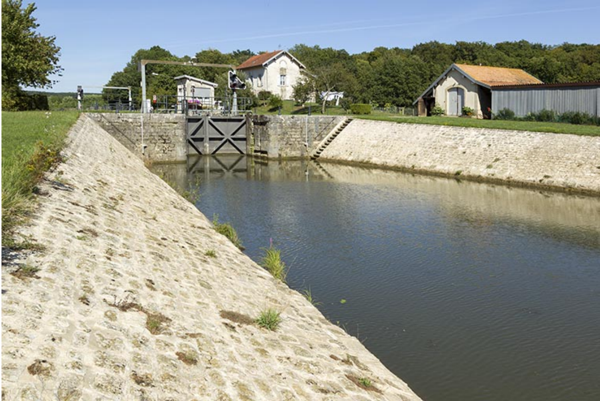
Vue aval du site d'écluse.

70, Chassey-lès-Scey, 3 écluse de Chassey