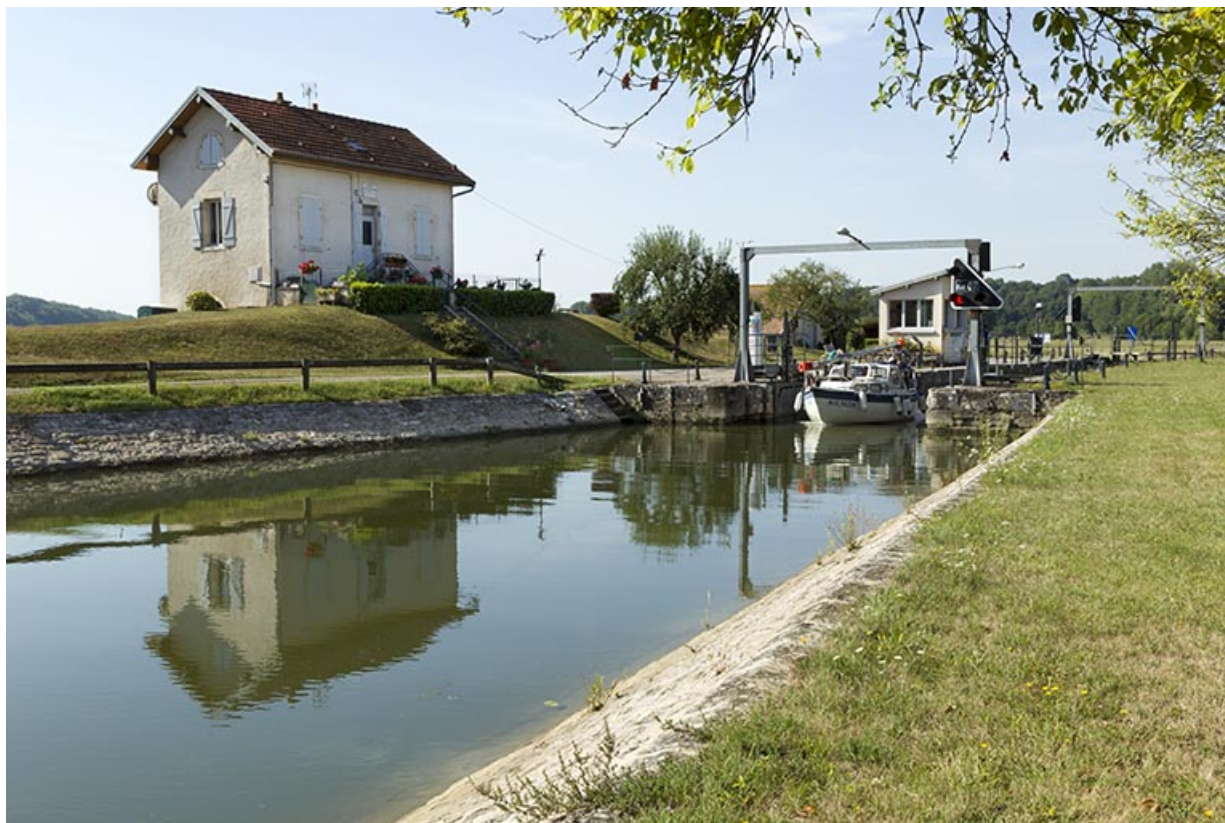
Vue amont du site d'écluse.