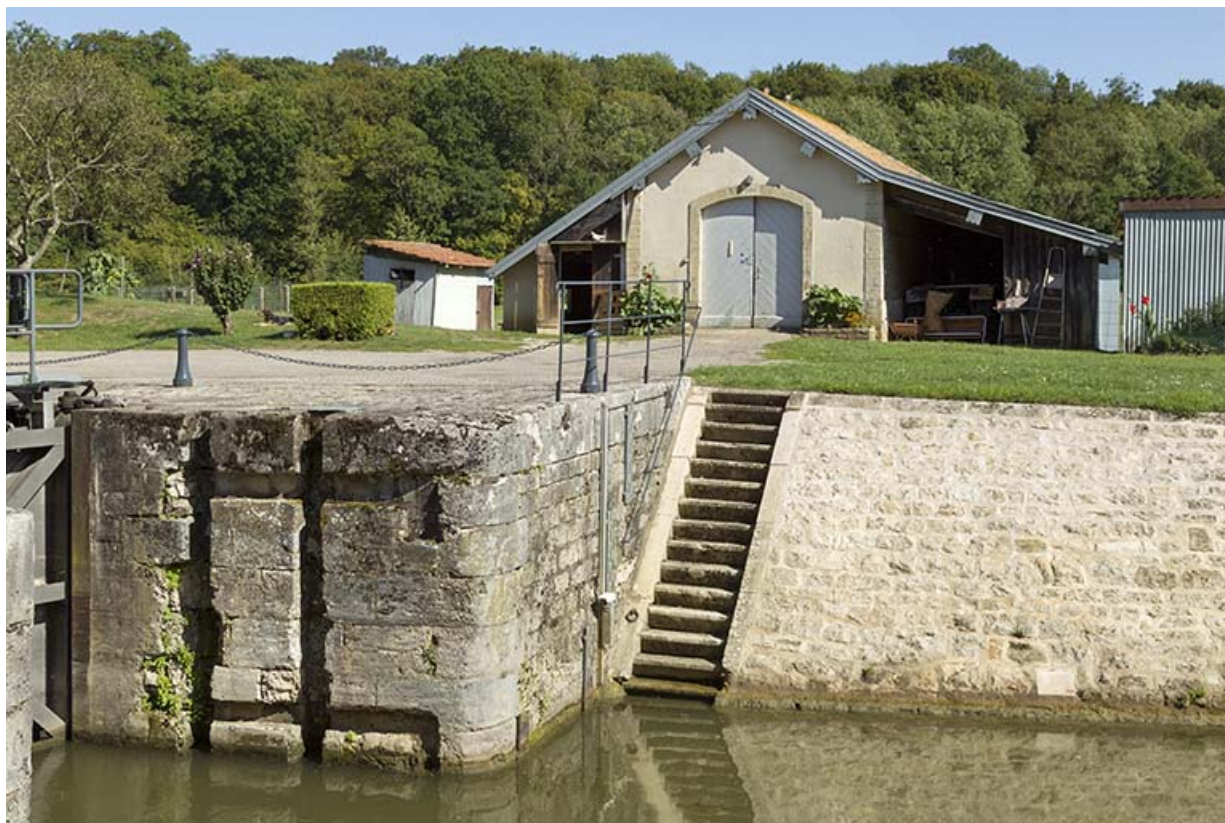
Vue partielle d'un bajoyer de l'écluse, perré et remise en arrière plan.

70, Chassey-lès-Scey, 3 écluse de Chassey