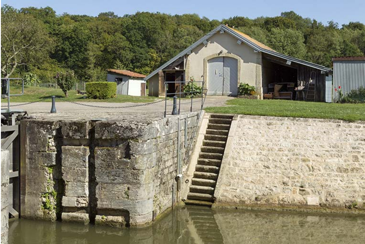
Vue partielle d'un bajoyer de l'écluse, perré et remise en arrière plan.

70, Chassey-lès-Scey, 3 écluse de Chassey