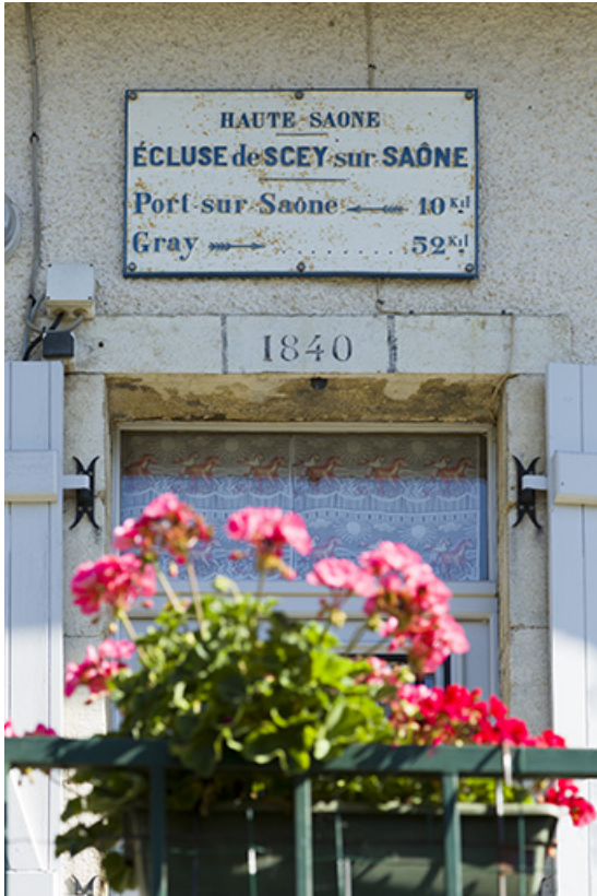
La plaque signalétique sur la maison d'éclusier.

70, Chassey-lès-Scey, 3 écluse de Chassey