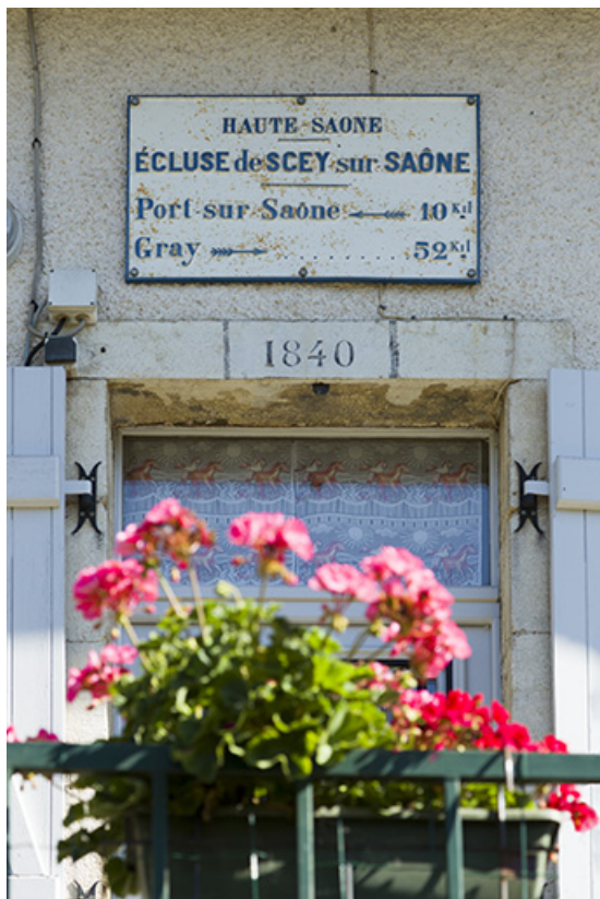
La plaque signalétique sur la maison d'éclusier.

70, Chassey-lès-Scey, 3 écluse de Chassey