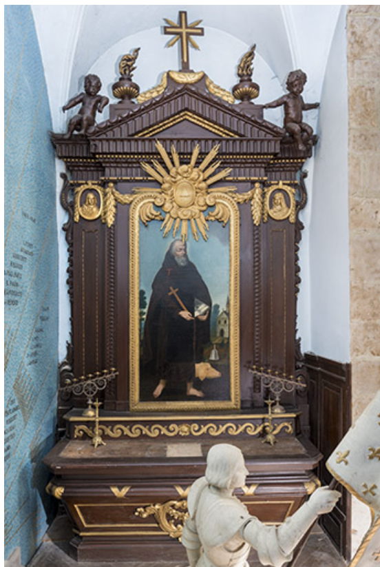
Retable de la chapelle Sainte-Anne, tableau représentant saint Antoine l'Ermite. 70, Scey-sur-Saône-et-Saint-Albin rue de l' Église