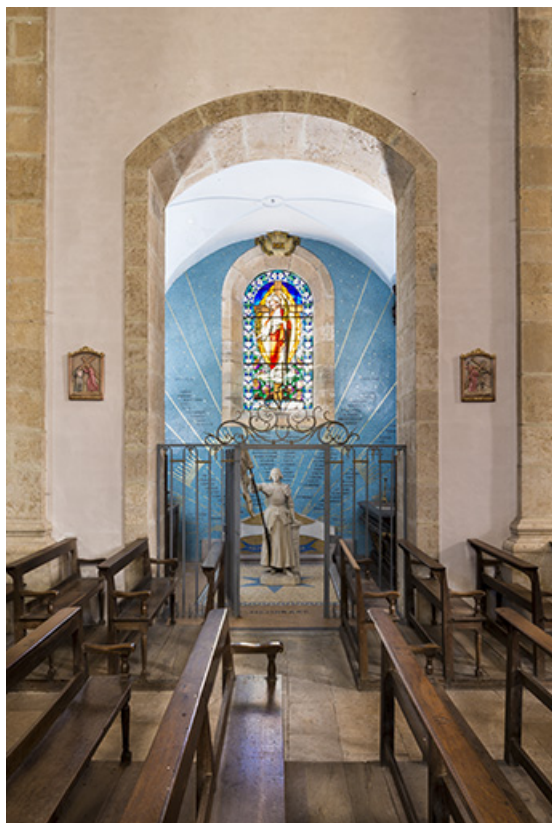
Vue d'ensemble depuis la nef.

70, Sceaux-sur-Saône-et-Saint-Albin rue de l' Église