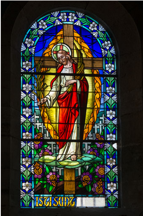
Le Christ distribuant des palmes au milieu d'un cimetière.

70, Scey-sur-Saône-et-Saint-Albin rue de l'Église