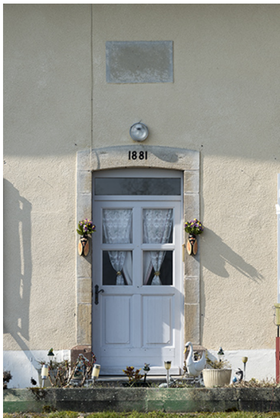
La porte d'entrée de la maison avec sa plaque signalétique. 70, Ormoy