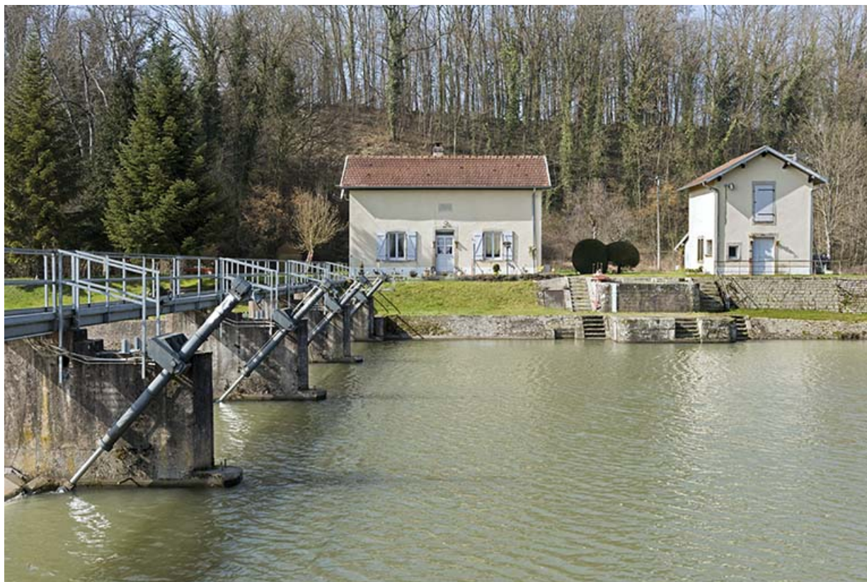
Le barrage et la maison du barragiste. 70, Ormoy