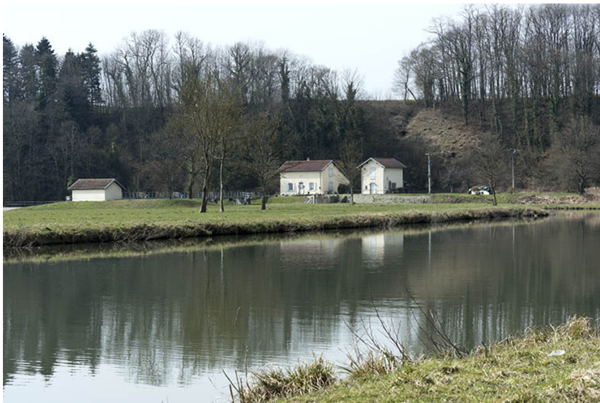
La saône et le site du barrage mobile.