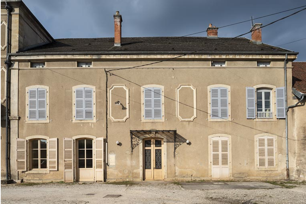
Corps de bâtiment central, façade sur la cour, vue de face.

70, Sceaux-sur-Saône-et-Saint-Albin, 1 rue de Duez