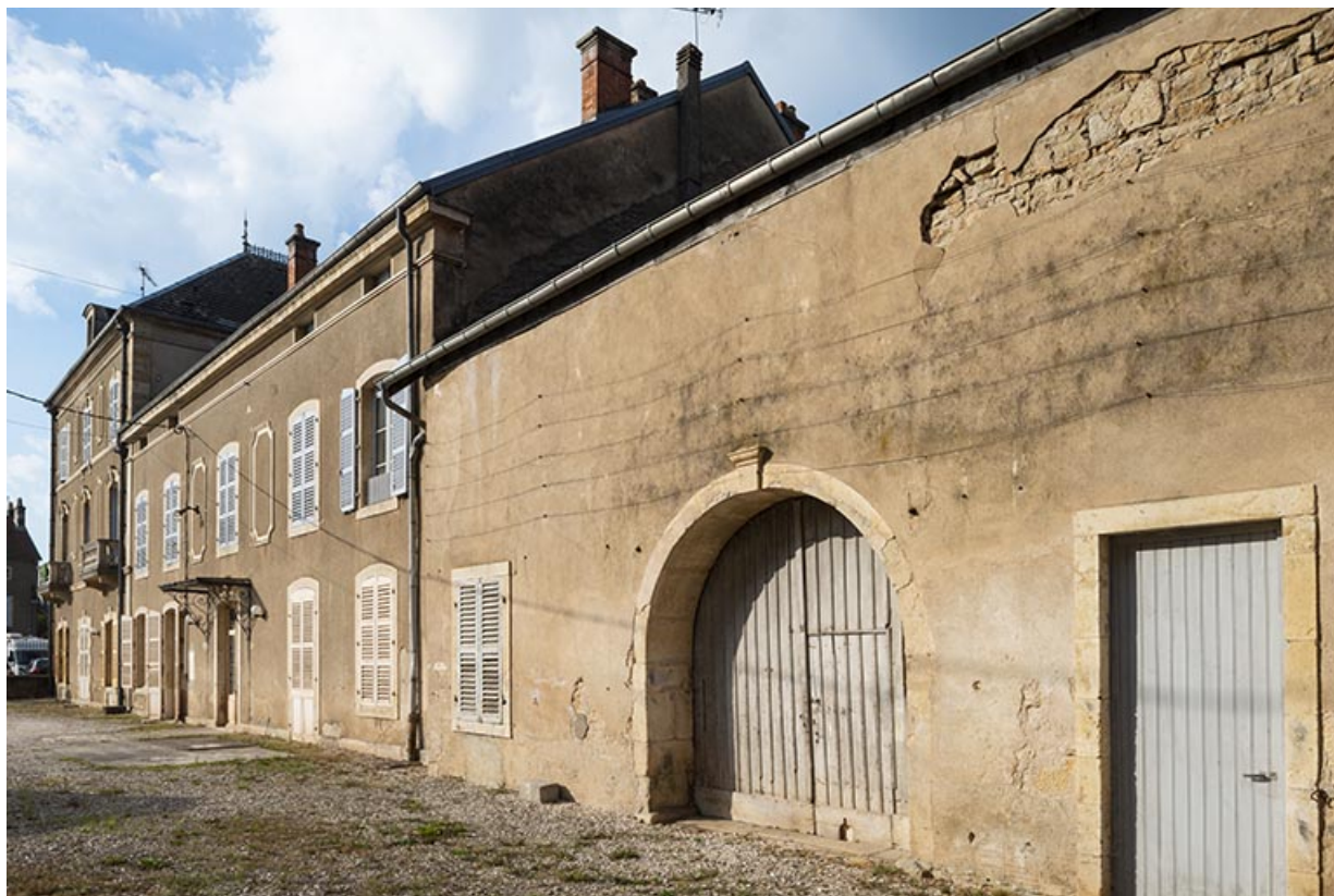
Corps de bâtiment nord, vue de trois-quarts gauche.

70, Sceaux-sur-Saône-et-Saint-Albin, 1 rue de Duez