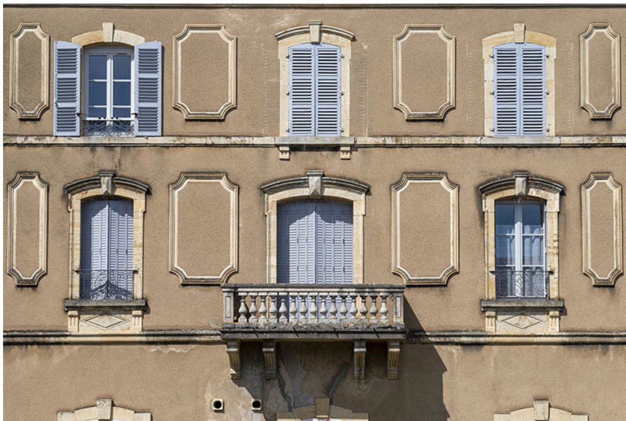
Corps de bâtiment sud, premier étage et second étage, vue de face.

70, Sceaux-sur-Saône-et-Saint-Albin, 1 rue de Duez