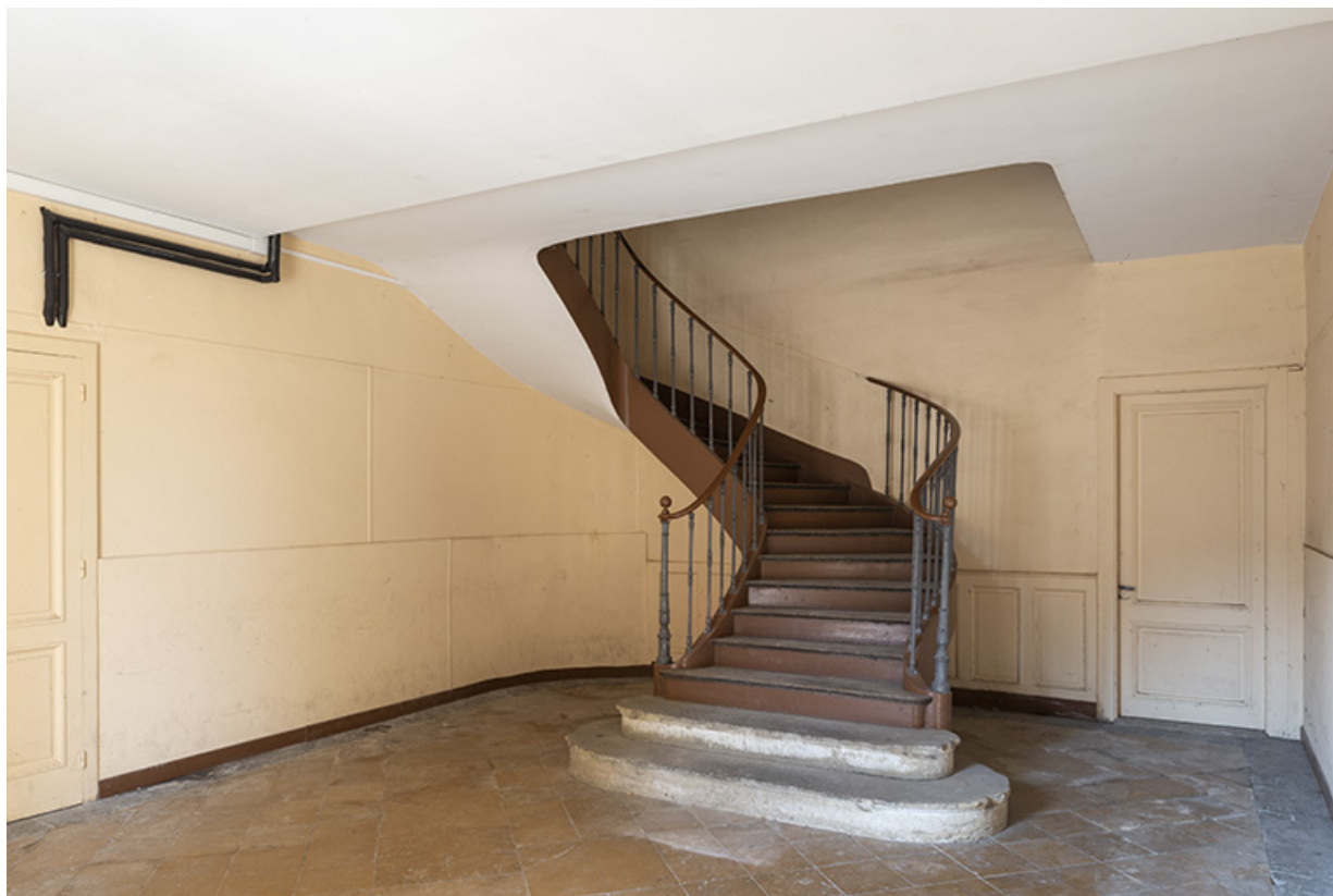
Escalier du corps central, vue de trois-quarts gauche.

70, Sceaux-sur-Saône-et-Saint-Albin, 1 rue de Duez