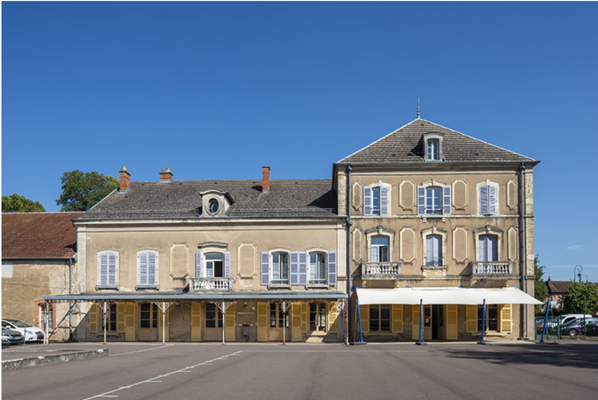
Façade sur l'ancien jardin, vue de face.

70, Scey-sur-Saône-et-Saint-Albin, 1 rue de Duez