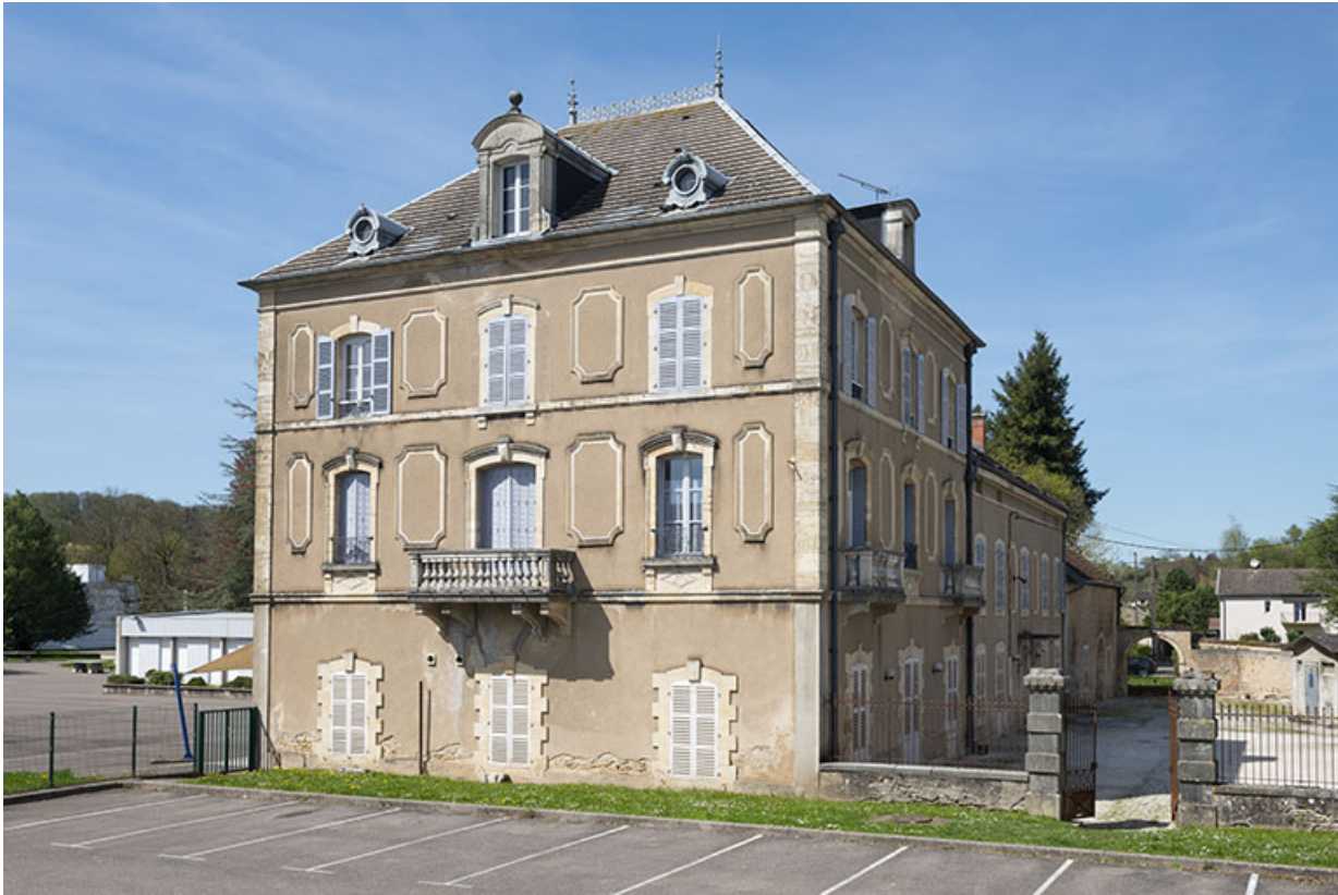
Corps de bâtiment sud, vue de trois-quarts gauche.

70, Sceaux-sur-Saône-et-Saint-Albin, 1 rue de Duez