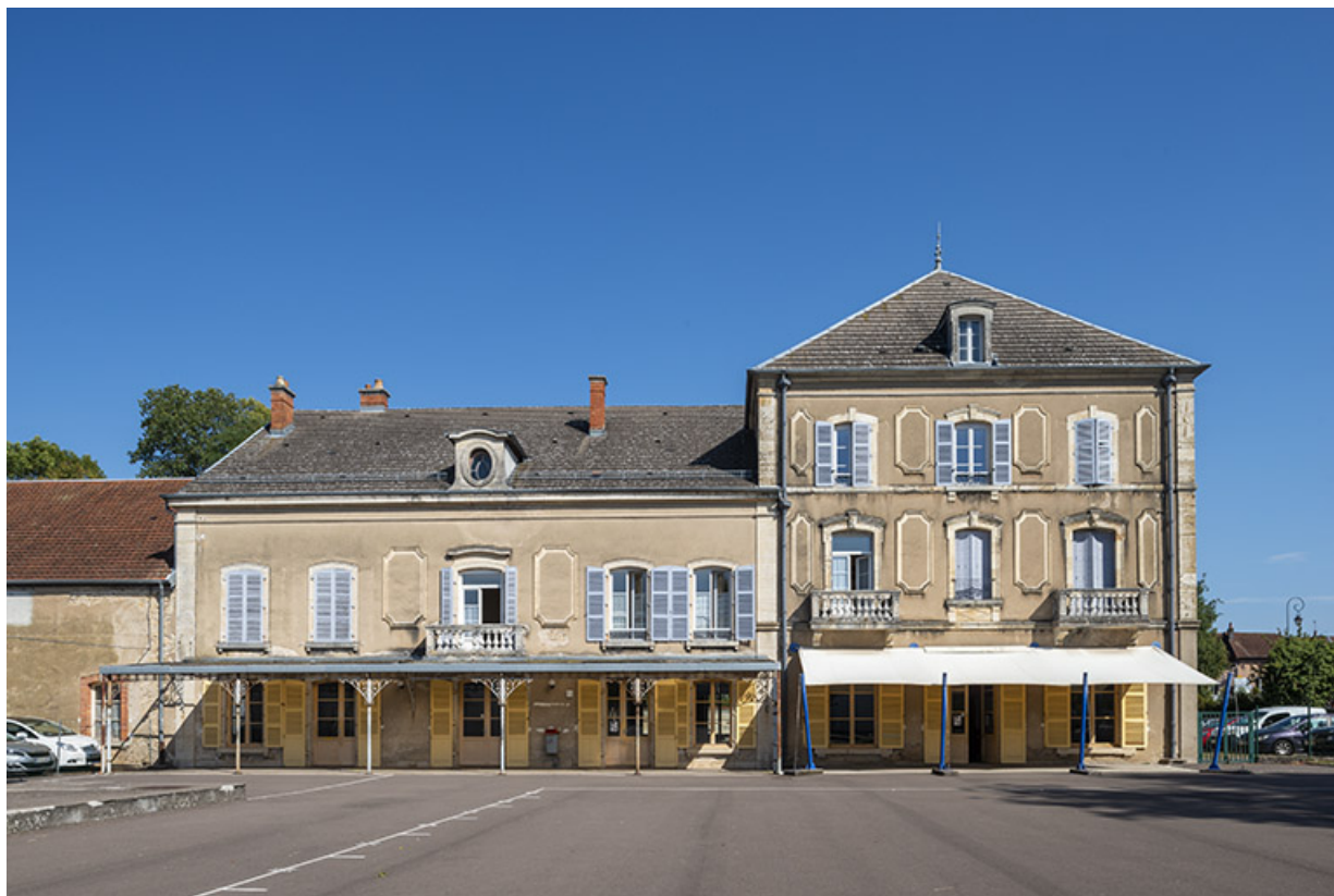
Façade sur l'ancien jardin, vue de face.

70, Scey-sur-Saône-et-Saint-Albin, 1 rue de Duez