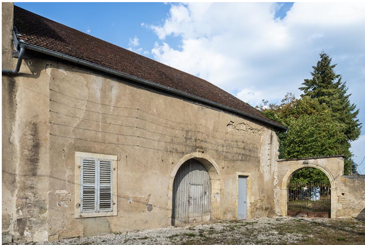
Corps de bâtiment nord, vue de trois-quarts droit, et arcade.

70, Scey-sur-Saône-et-Saint-Albin, 1 rue de Duez