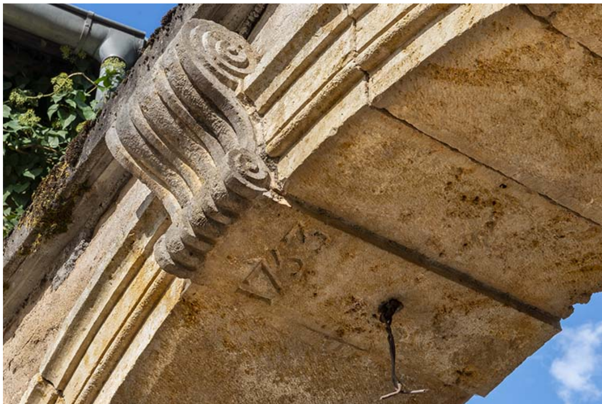
Arcade couverte d'un arc en plein cintre, agrafe et date portée (1753). 70, Scey-sur-Saône-et-Saint-Albin, 1 rue de Duez