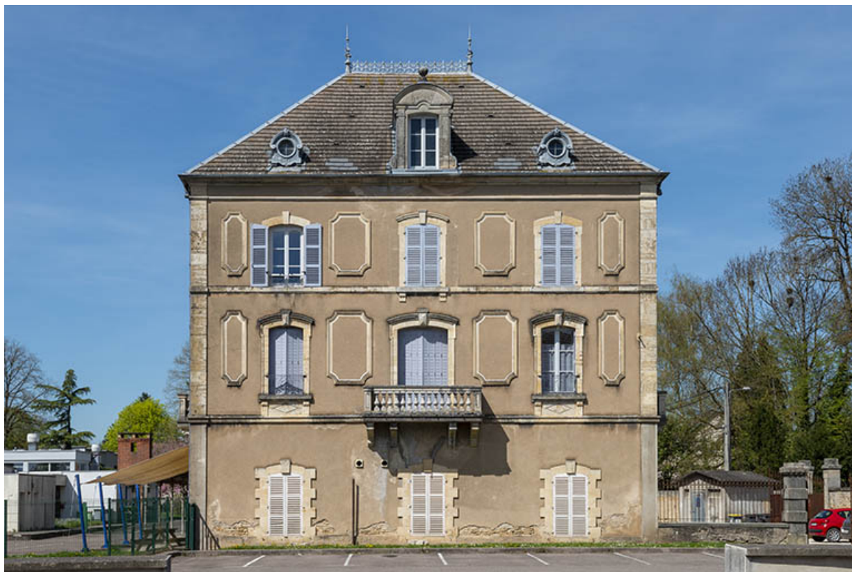
Corps de bâtiment sud, vue de face.

70, Sceaux-sur-Saône-et-Saint-Albin, 1 rue de Duez