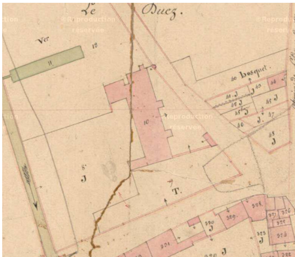
Plan de situation en 1836.

70, Scey-sur-Saône-et-Saint-Albin, 1 rue de Duez