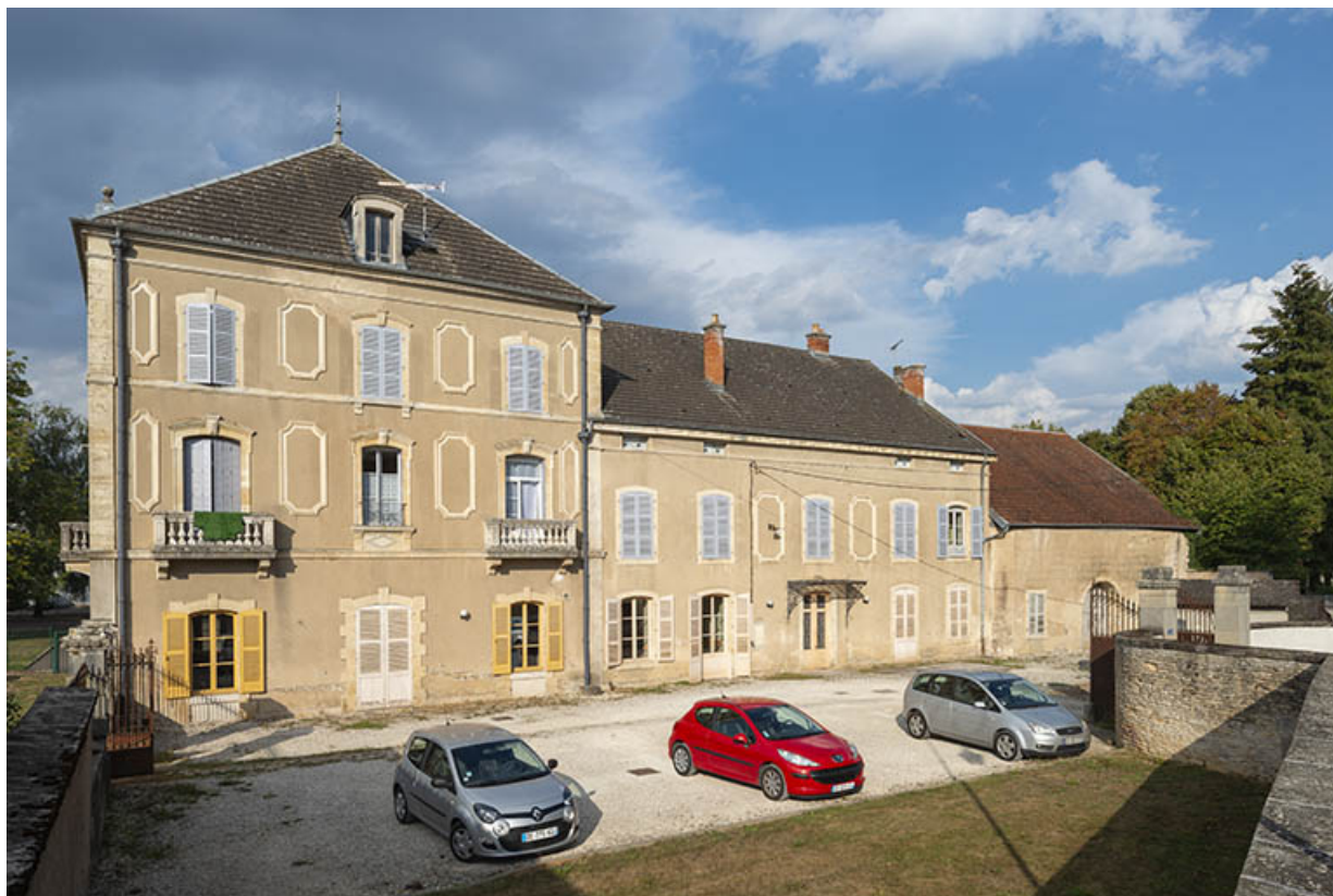
Façade sur la cour, vue de trois-quarts droit. 70, Sceaux-sur-Saône-et-Saint-Albin, 1 rue de Duez