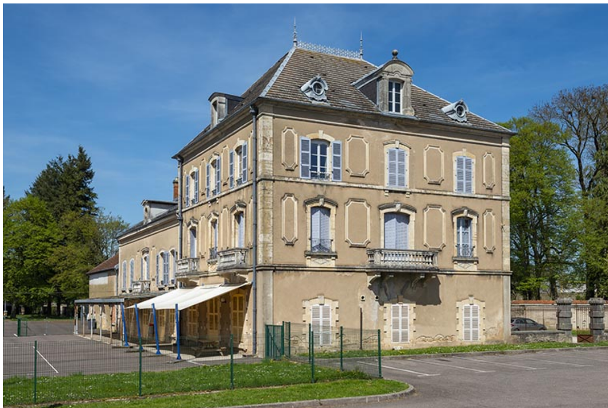
Demeure n°1 rue de Duez dite Château Rance. 70, Scey-sur-Saône-et-Saint-Albin, 1 rue de Duez