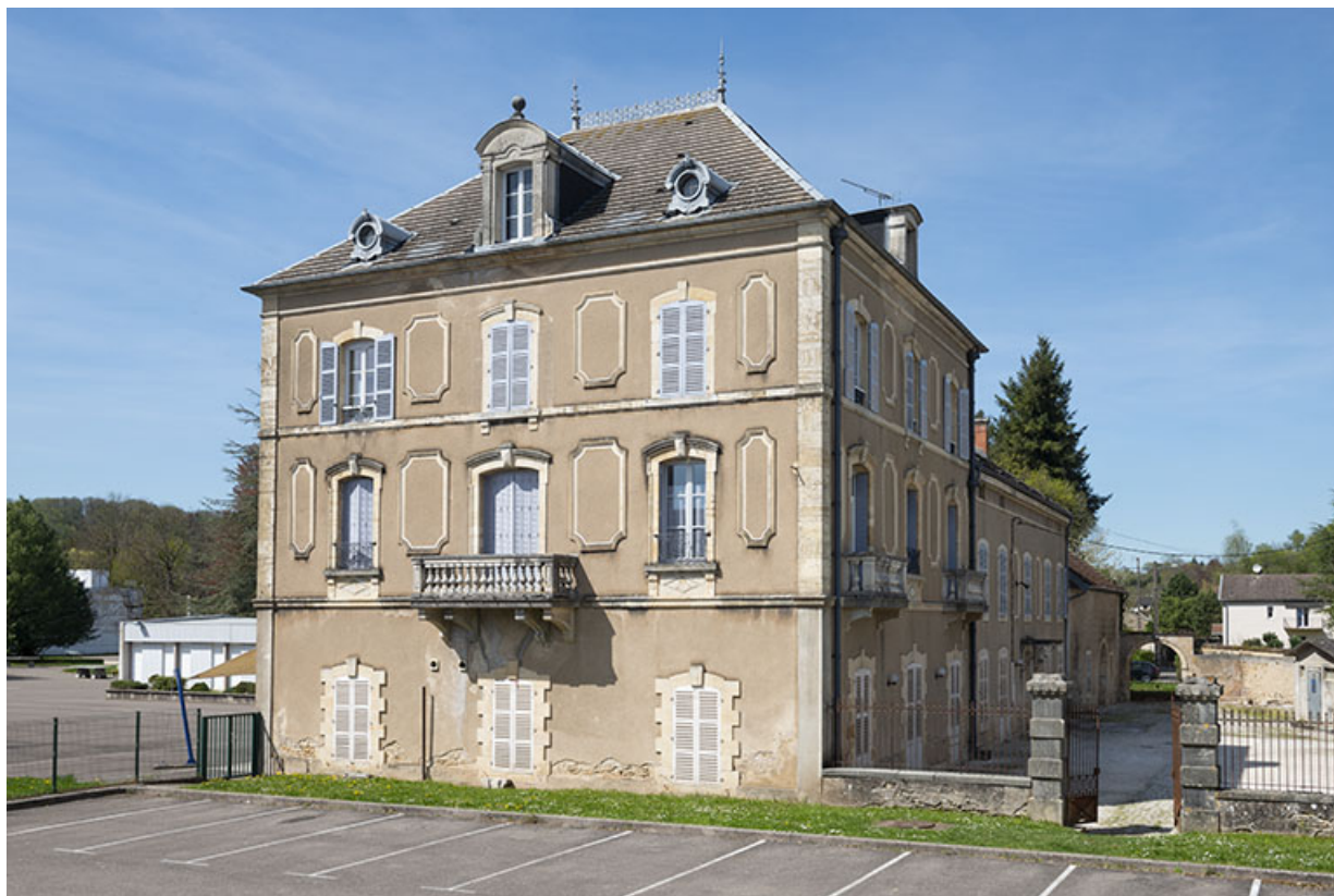
Corps de bâtiment sud, vue de trois-quarts gauche.

70, Scey-sur-Saône-et-Saint-Albin, 1 rue de Duez