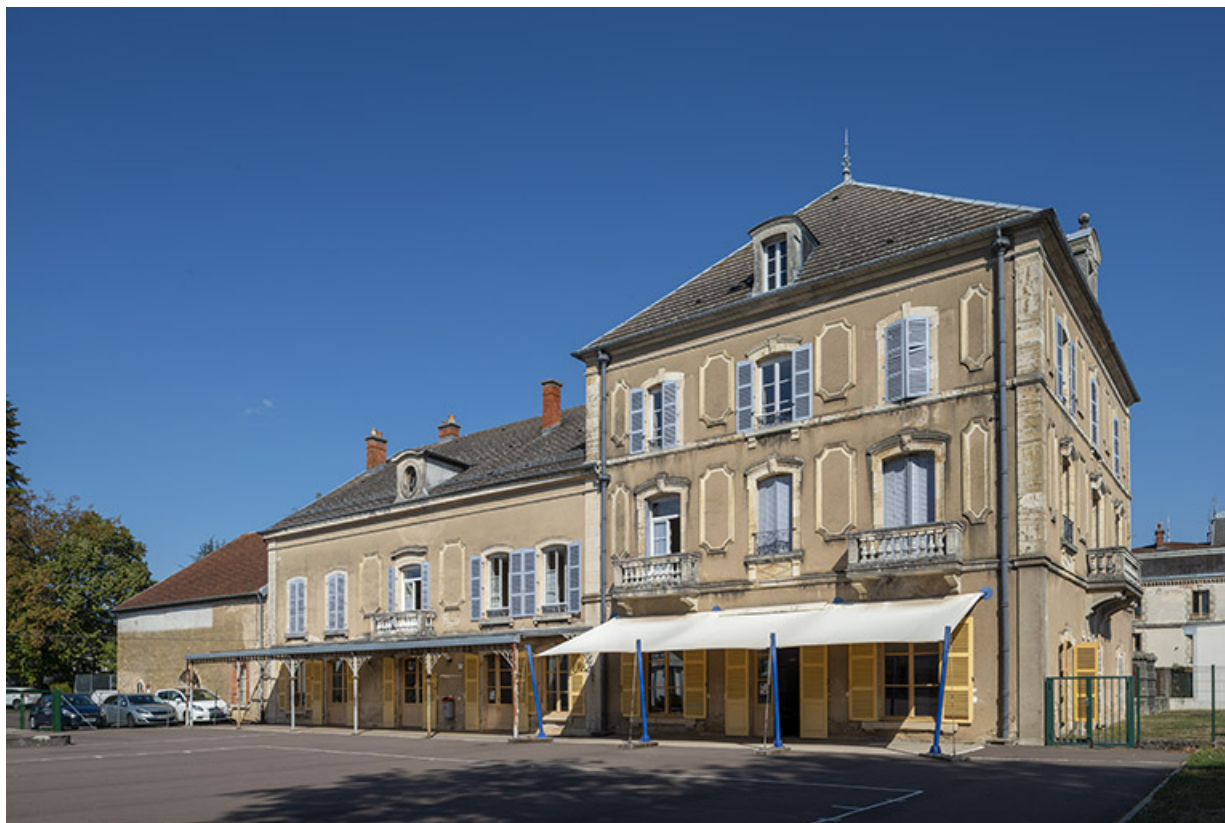
Façade sur l'ancien jardin, vue de trois-quarts gauche.

70, Sceaux-sur-Saône-et-Saint-Albin, 1 rue de Duez