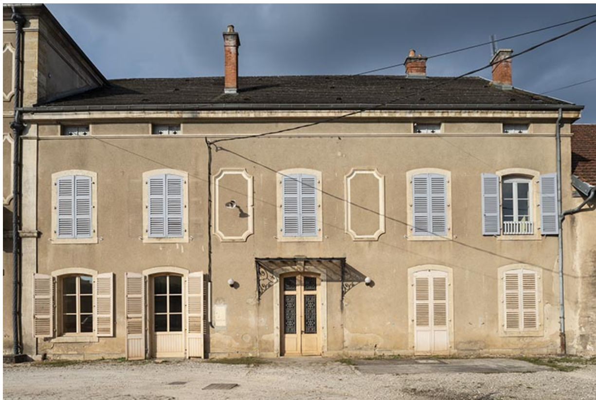
Corps de bâtiment central, façade sur la cour, vue de face.

70, Scey-sur-Saône-et-Saint-Albin, 1 rue de Duez