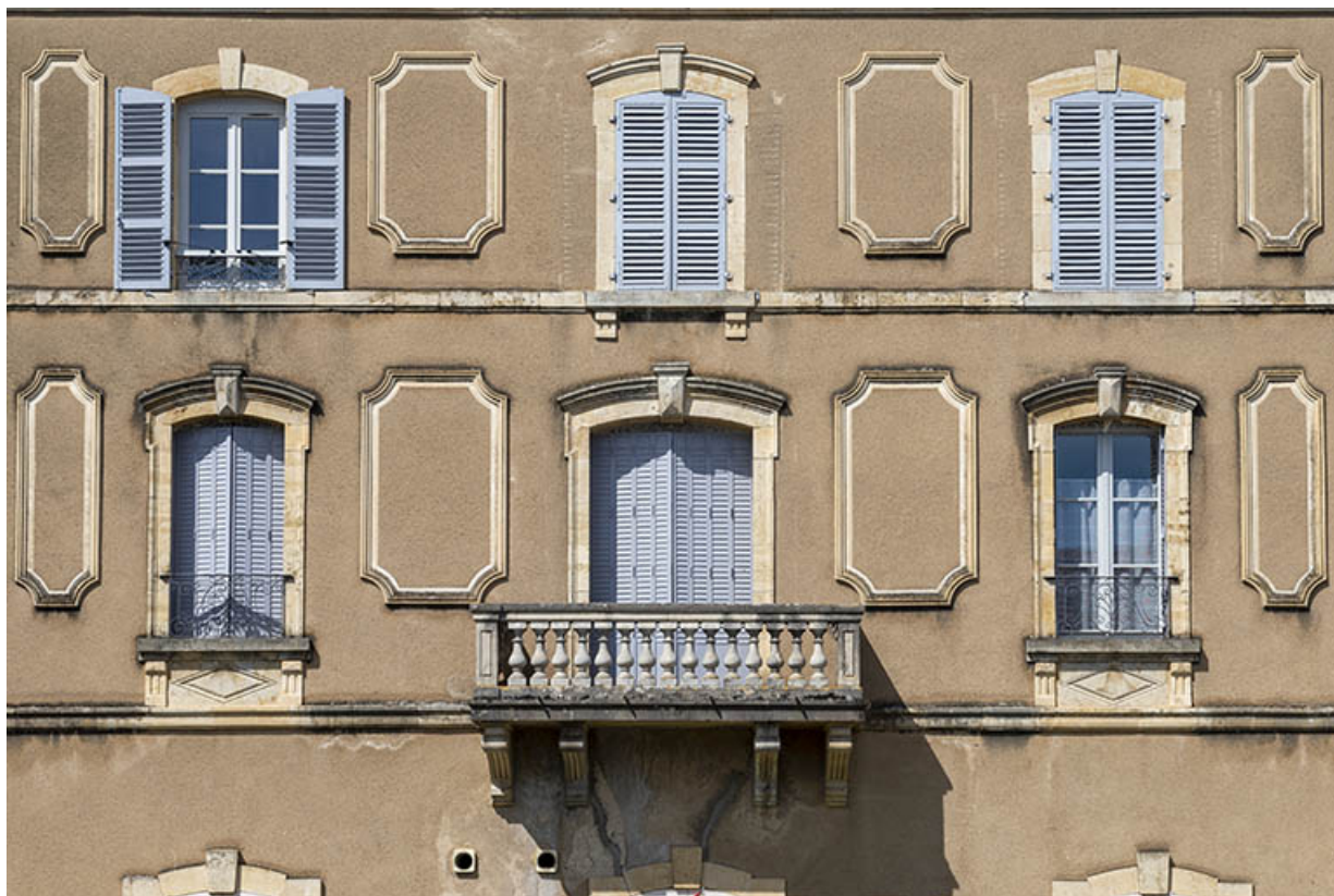
Corps de bâtiment sud, premier étage et second étage, vue de face.

70, Sceaux-sur-Saône-et-Saint-Albin, 1 rue de Duez