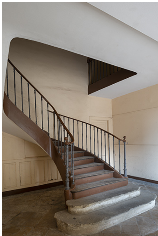
Escalier du corps central, vue de trois-quarts droit.

70, Scey-sur-Saône-et-Saint-Albin, 1 rue de Duez