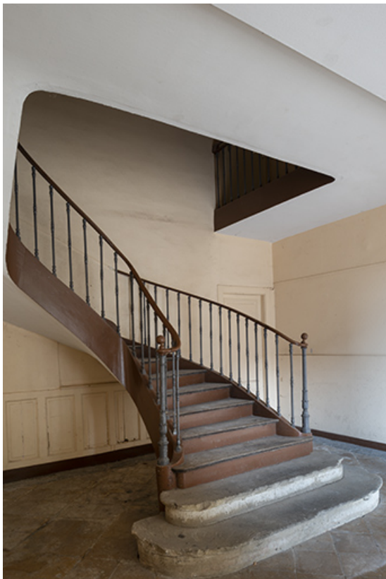
Escalier du corps central, vue de trois-quarts droit.

70, Scey-sur-Saône-et-Saint-Albin, 1 rue de Duez