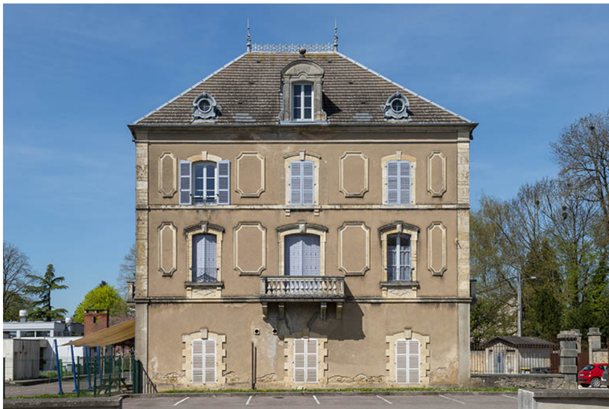
Corps de bâtiment sud, vue de face.

70, Scey-sur-Saône-et-Saint-Albin, 1 rue de Duez