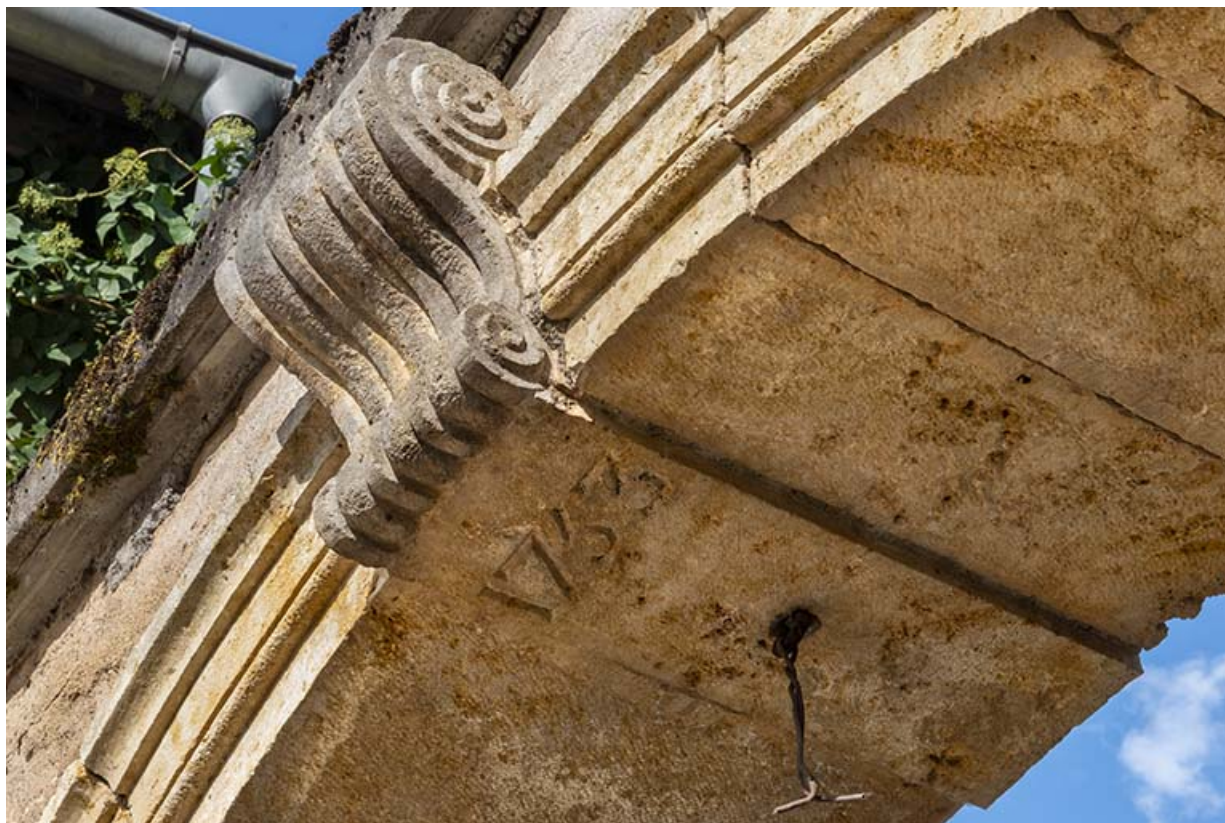
Arcade couverte d'un arc en plein cintre, agrafe et date portée (1753). 70, Sceaux-sur-Saône-et-Saint-Albin, 1 rue de Duez