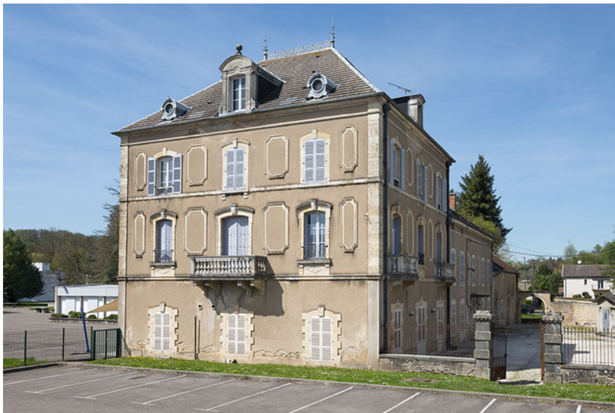
Corps de bâtiment sud, vue de trois-quarts gauche.

70, Sceaux-sur-Saône-et-Saint-Albin, 1 rue de Duez