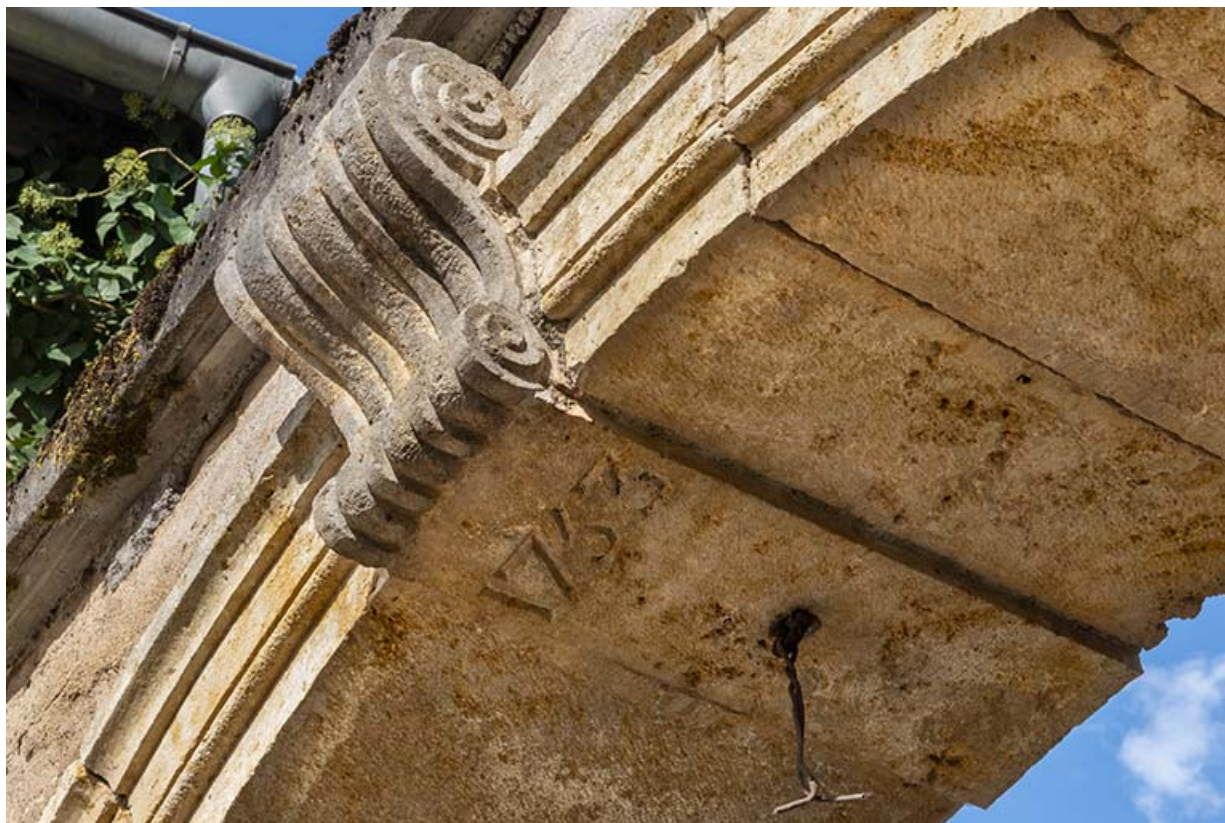
Arcade couverte d'un arc en plein cintre, agrafe et date portée (1753).

70, Sceaux-sur-Saône-et-Saint-Albin, 1 rue de Duez