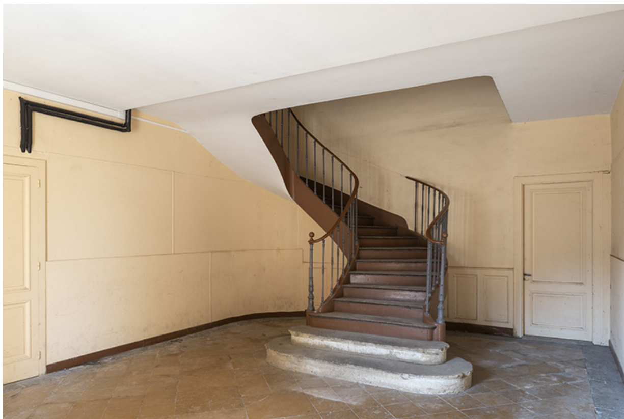
Escalier du corps central, vue de trois-quarts gauche.

70, Sceaux-sur-Saône-et-Saint-Albin, 1 rue de Duez