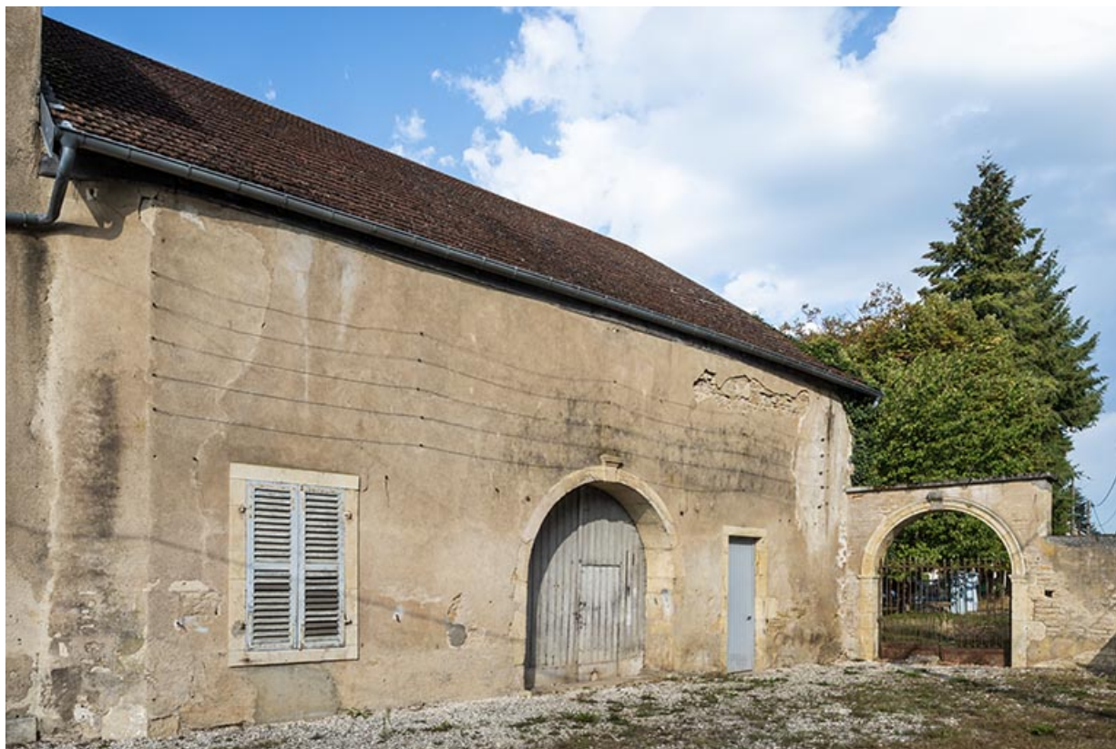
Corps de bâtiment nord, vue de trois-quarts droit, et arcade.

70, Scey-sur-Saône-et-Saint-Albin, 1 rue de Duez