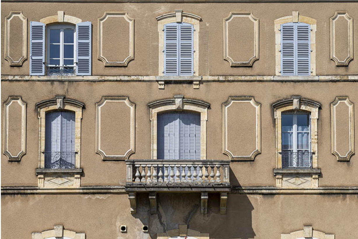
Corps de bâtiment sud, premier étage et second étage, vue de face.

70, Sceaux-sur-Saône-et-Saint-Albin, 1 rue de Duez