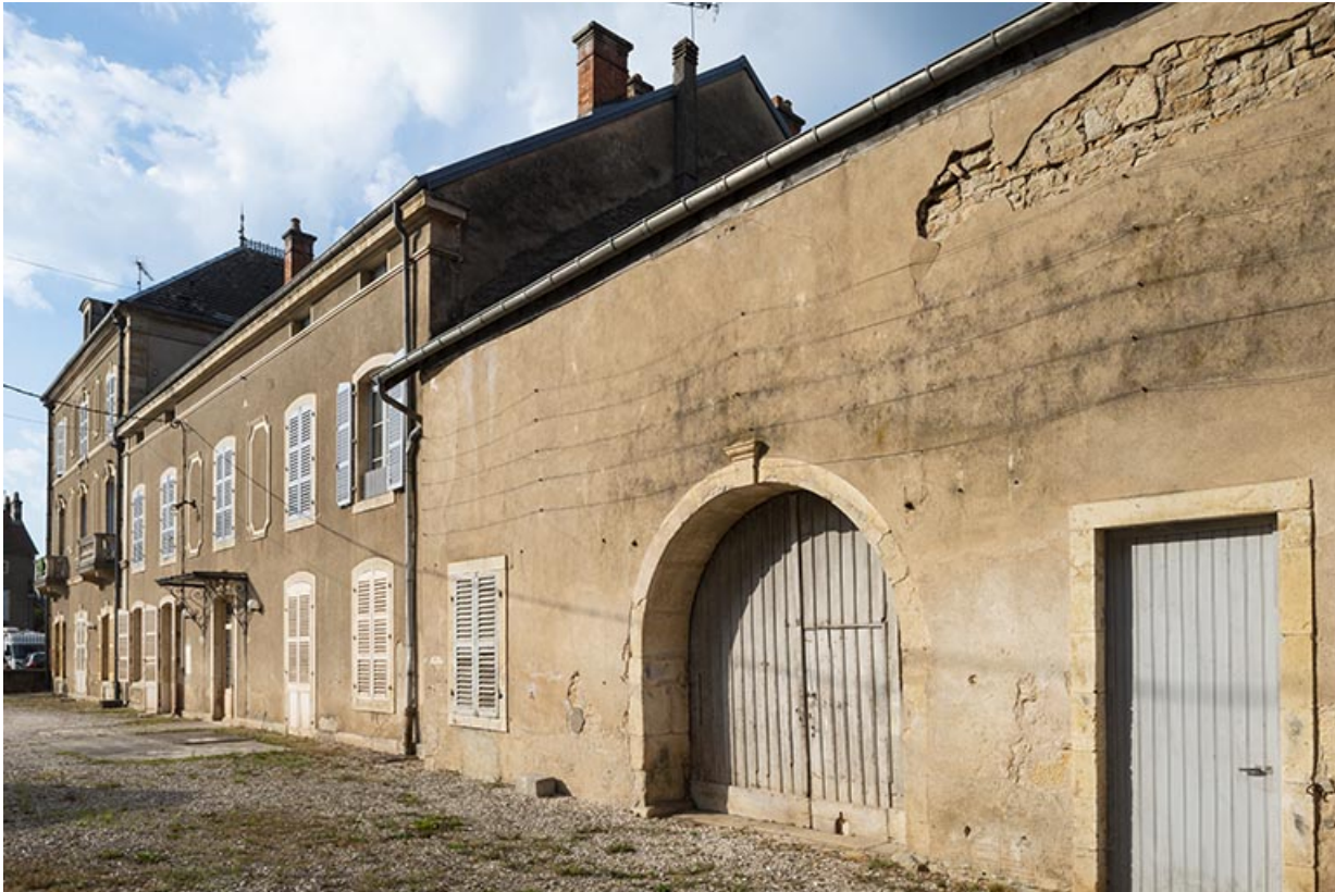
Corps de bâtiment nord, vue de trois-quarts gauche.

70, Scey-sur-Saône-et-Saint-Albin, 1 rue de Duez