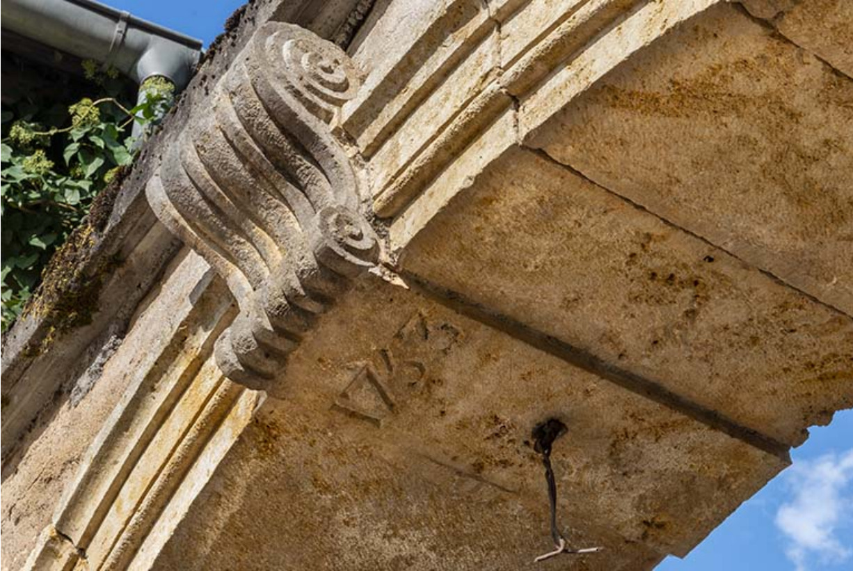
Arcade couverte d'un arc en plein cintre, agrafe et date portée (1753).

70, Scey-sur-Saône-et-Saint-Albin, 1 rue de Duez