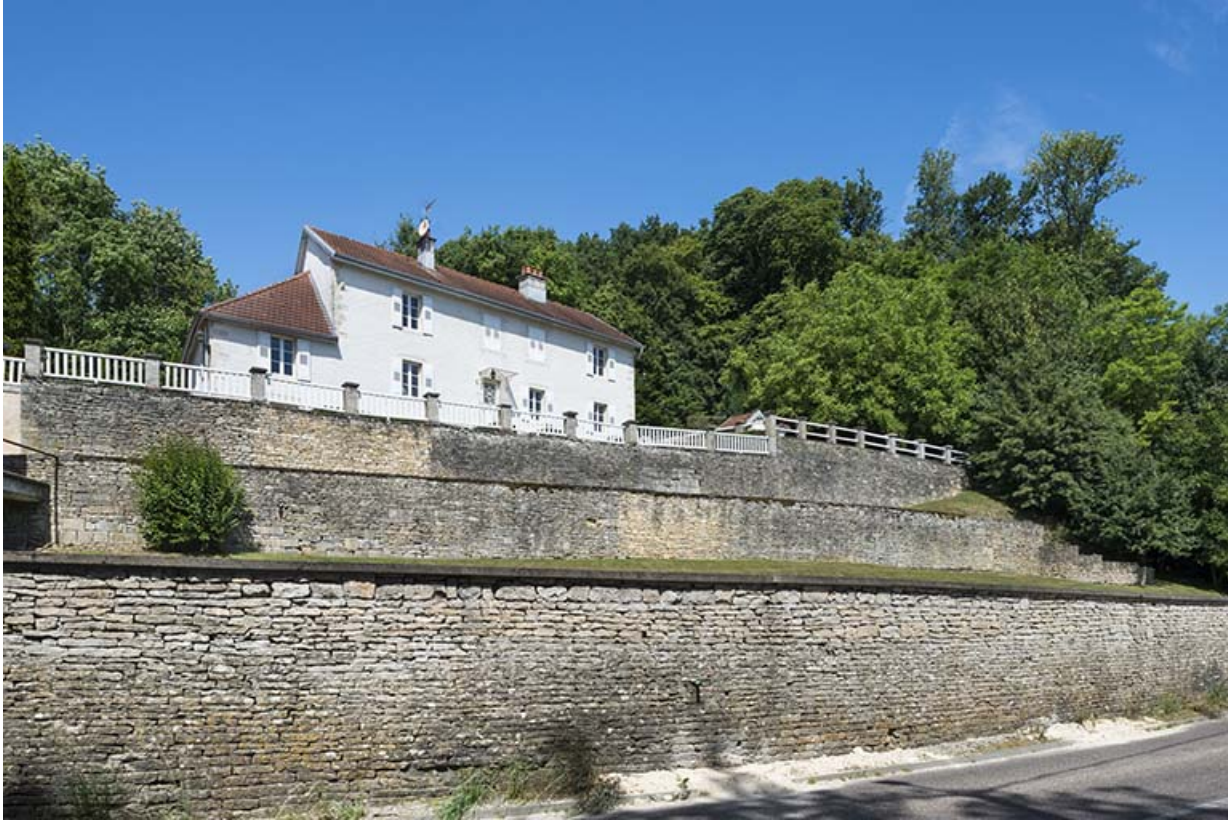
Ancienne maison des moines et presbytère de Saint-Albin.

70, Scey-sur-Saône-et-Saint-Albin, 2 rue de Rupt-sur-Saône, lieudit : Saint-Albin