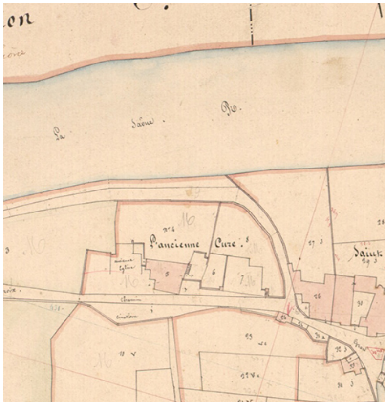
Extrait de l'Atlas parcellaire (1836) du cadastre de la commune de Scey-sur-Saône-et-Saint-Albin. 70, Scey-sur-Saône-et-Saint-Albin, 2 rue de Rupt-sur-Saône, lieudit : Saint-Albin