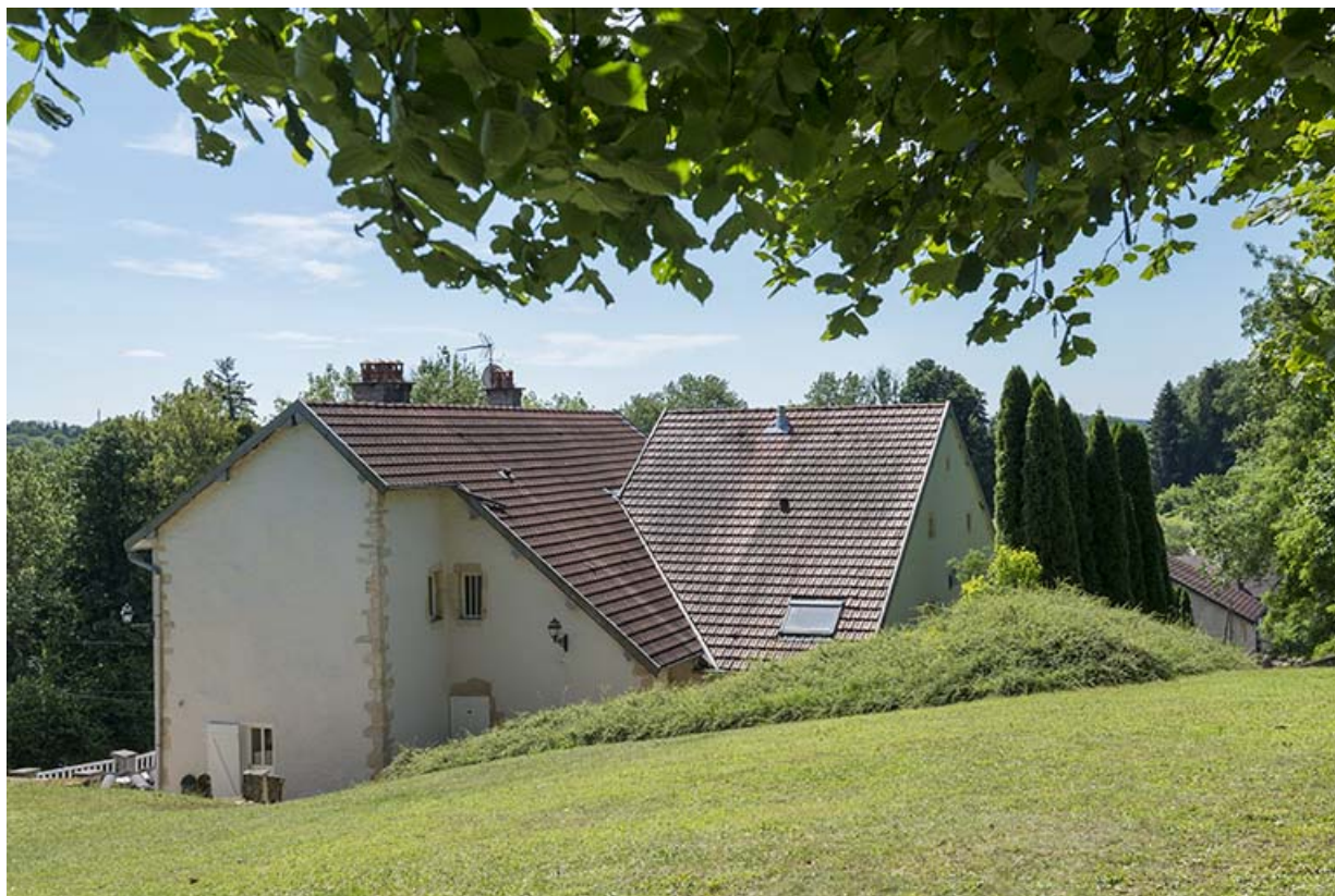
Vue depuis la parcelle " Vigne de la cure".

70, Scey-sur-Saône-et-Saint-Albin, 2 rue de Rupt-sur-Saône, lieudit : Saint-Albin