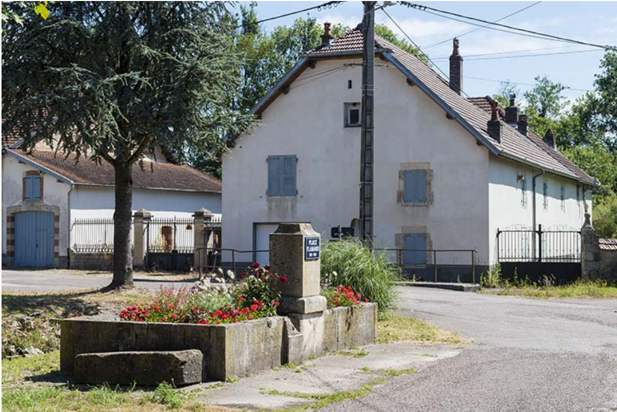
La fontaine, rue Flamand.

70, Sceaux-sur-Saône-et-Saint-Albin, 3 place Flamand, lieudit : Saint-Albin