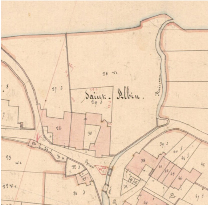
Extrait de l'Atlas parcellaire (1836) du cadastre de la commune de Sceaux-sur-Saône-et-Saint-Albin. 70, Sceaux-sur-Saône-et-Saint-Albin, 3 place Flamand, lieudit : Saint-Albin