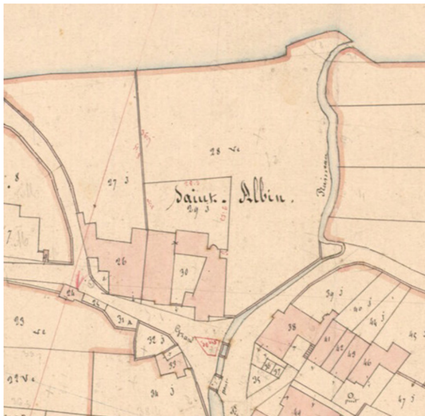
Extrait de l'Atlas parcellaire (1836) du cadastre de la commune de Scey-sur-Saône-et-Saint-Albin. 70, Scey-sur-Saône-et-Saint-Albin, 3 place Flamand, lieudit : Saint-Albin