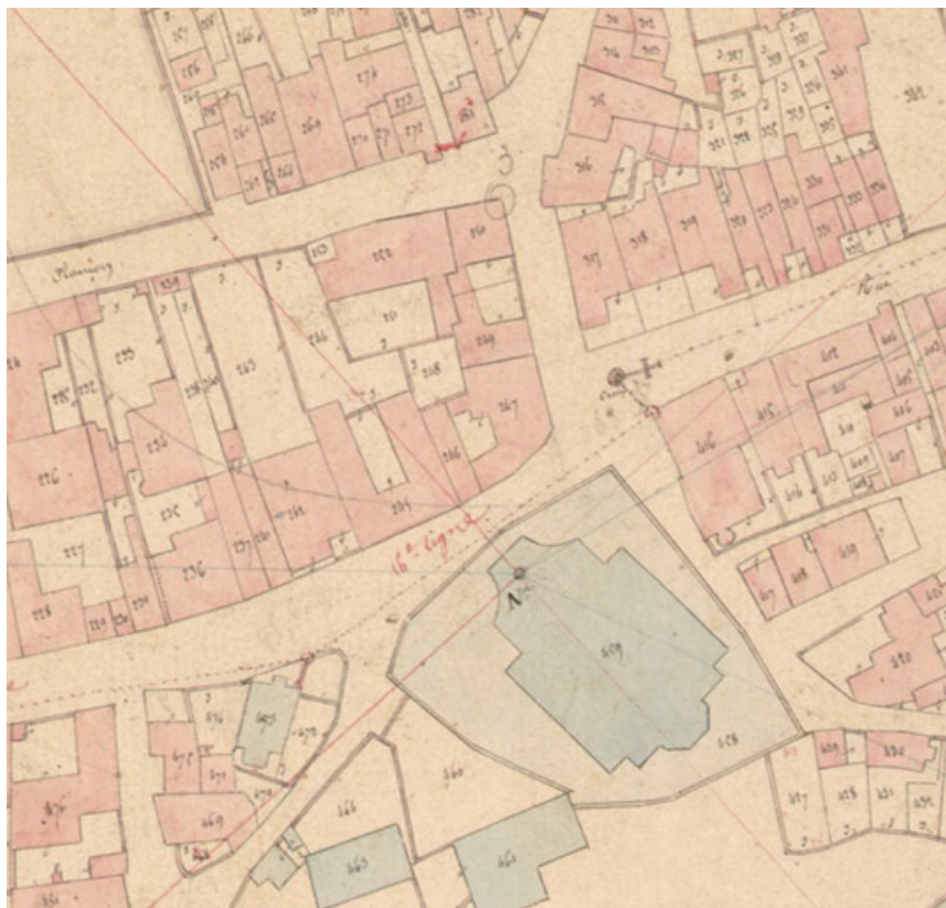
Extrait de l'Atlas parcellaire (1836) du cadastre de la commune de Scey-sur-Saône-et-Saint-Albin. 70, Scey-sur-Saône-et-Saint-Albin, 29 rue de l'Église