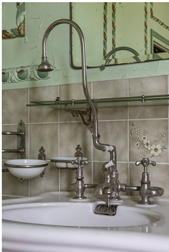
Premier étage, salle d'eau, robinets.

70, Scey-sur-Saône-et-Saint-Albin, 1 chemin des Vignes