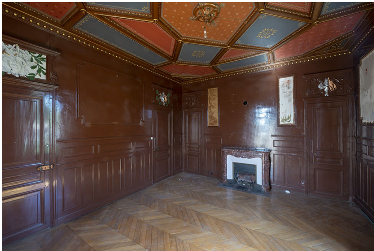
Rez-de-chaussée, grand salon, vue de l'angle nord-ouest.

70, Scey-sur-Saône-et-Saint-Albin, 1 chemin des Vignes