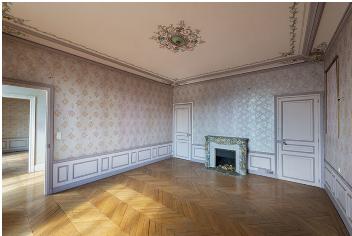
Premier étage, chambre à coucher de l'angle sud-est. 70, Sceaux-sur-Saône-et-Saint-Albin, 1 chemin des Vignes