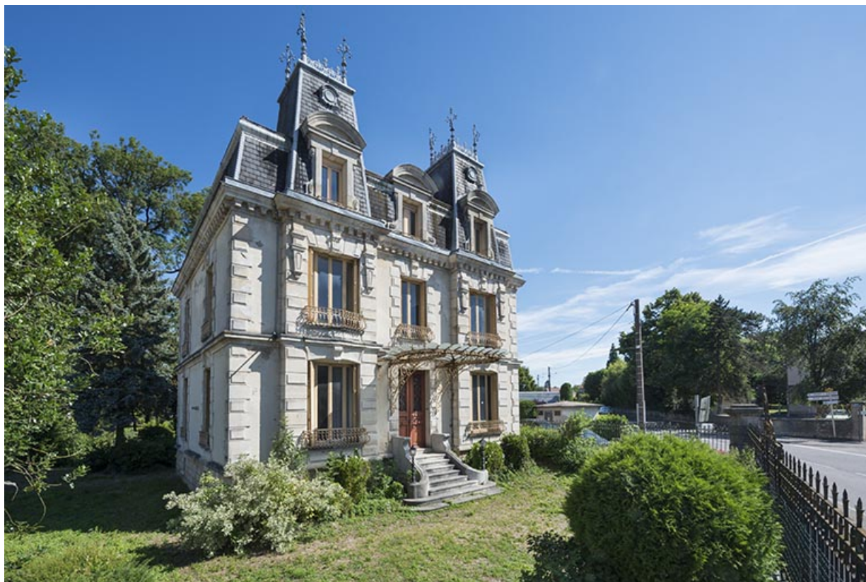
Vue d'ensemble de la maison, depuis le sud-ouest.

70, Scey-sur-Saône-et-Saint-Albin, 1 chemin des Vignes