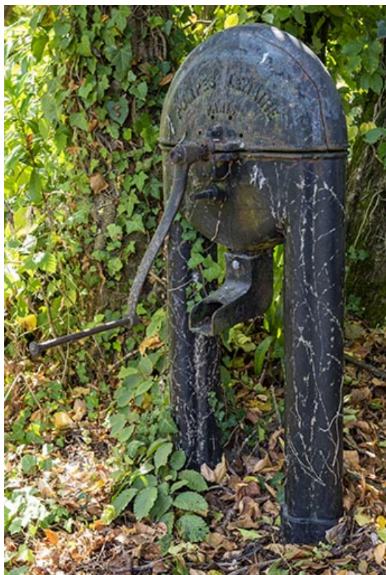
Pompe à godets (modèle Lemaire) dans le jardin.

70, Scey-sur-Saône-et-Saint-Albin, 1 chemin des Vignes