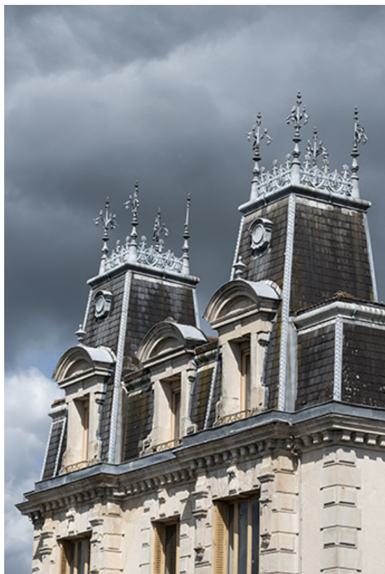
Toiture, côté sud.

70, Sceaux-sur-Saône-et-Saint-Albin, 1 chemin des Vignes