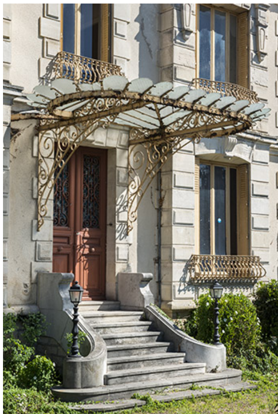
Porte d'entrée principale surmontée d'une marquise, vue de trois-quarts.

70, Scey-sur-Saône-et-Saint-Albin, 1 chemin des Vignes