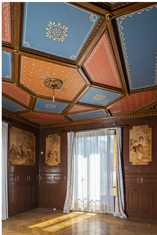
Rez-de-chaussée, grand salon, vue de l'angle sud-est. 70, Scey-sur-Saône-et-Saint-Albin, 1 chemin des Vignes