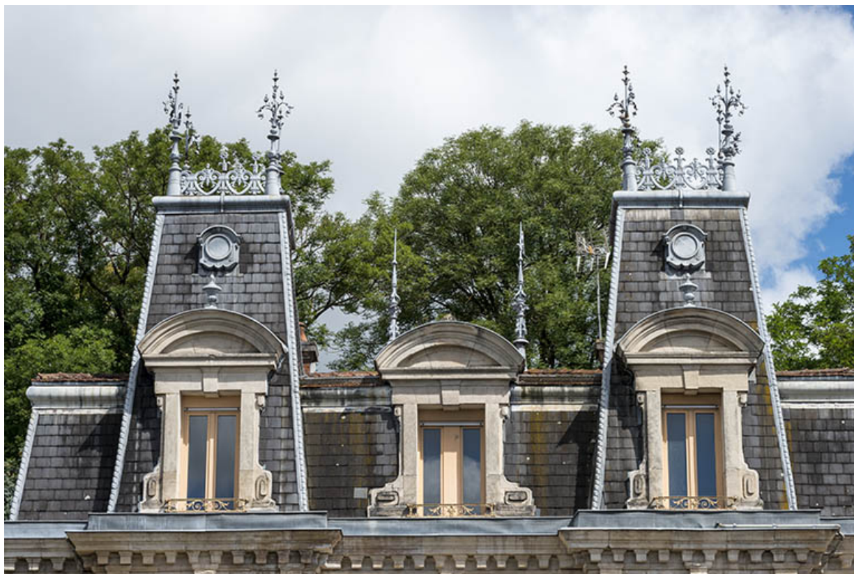
Toiture, côté sud.

70, Scey-sur-Saône-et-Saint-Albin, 1 chemin des Vignes