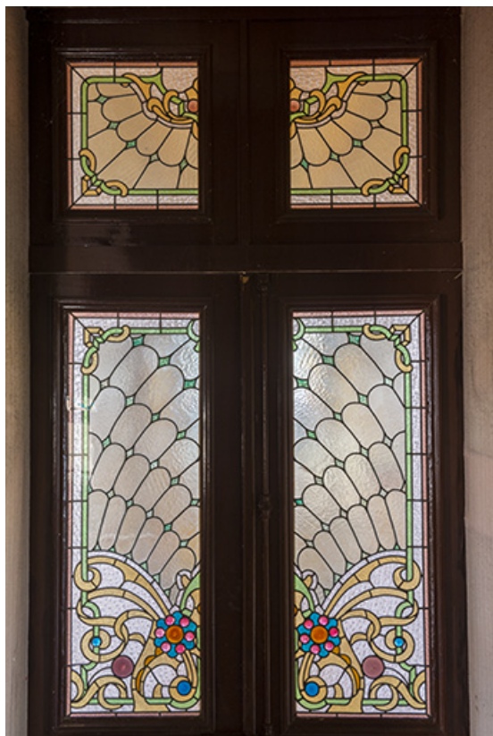
Porte du vestibule donnant sur la cage d'escalier, vitrail de style Art Nouveau.

70, Scey-sur-Saône-et-Saint-Albin, 1 chemin des Vignes